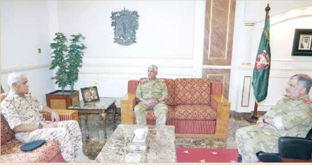
سمو رئيس الحرس الوطني يستقبل رئيس هيئة أركان قوة دفاع البحرين

♦ دور باسل تقوم به قوة الدفاع بحماية حدود المملكة