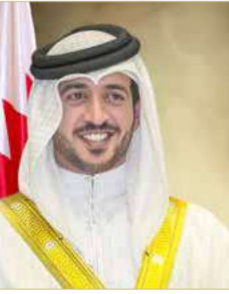
سمو الشيخ خالد بن حمد

قانون الاحتراف الرياضي، والذي يشكل بوابة للتحويل للرياضي البحريني والانتقال من مرحلة الهواة إلى مرحلة الاحتراف، والذي سيساهم في ارتقاء المنظومة الرياضية وسيساهم في صناعة قفزات كبيرة بالرياضة.