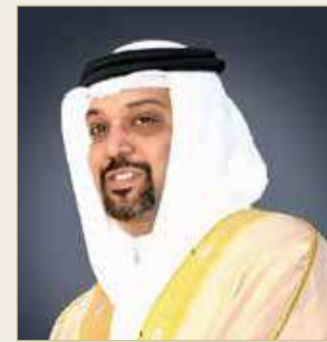
الشيخ سلمان بن خليفة

المملكة وأن يثبت على طريق الخير خطاه، مؤكداً أن مملكة البحرين تسطر يوماً بعد يوم مسيرة زاخرة بالإنجازات، وما تحقق من نجاح باهر أثبت للعالم ما تمتلكه المملكة من إمكانيات وقدرات وطنية لتنظيم الفعاليات الدولية على أرضها، داعياً الله العليّ القدير أن يوفق صاحب السمو الملكي ولي العهد رئيس مجلس الوزراء لمواصلة البناء بما يصب في صالح مملكتنا الغالية في ظل العهد الزاهر لعاهل البلاد.