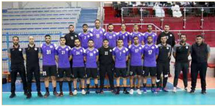
فريق باربار لكرة اليد

واحدة في دور المجموعات، وفاز باربار حينها بالمواجهة، ولكن اليوم يعتبر الوضع مختلفاً للغاية، كونها مباراة نهائية وحساباتها وأهميتها تختلف كلياً عن أي مرحلة سابقة، وعليه يتوقع أن تكون المواجهة مفتوحة على مصراعها ونسبة الفوز بينها متساوية رغم الفوارق الفنية التي تصب لصالح “الرهيب”، إلا أن باربار بعناصره الخبرة والشابة يُعتبر صعباً للغاية في النهائيات والنجمة يدرك ذلك جيداً. اللقاء بطبيعة الحال لن يكون سهلاً لأحدهما رغم المعطيات والمؤشرات، كون المباراة النهائية لها ضغوطها وآثارها السلبية التي من شأنها أن تشد الجوارح العام للمباراة وتؤثر على سيرها ومتعتها الفنية.