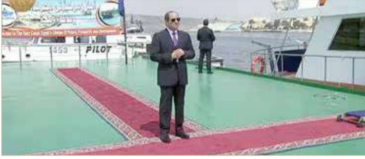
السياسي متفقاً مرافق قناة السويس

في التوصل إلى اتفاق. وأعلن السياسي أمس أنه "خلال الأسابيع القليلة القادمة سيكون هناك تحرك إضافي في هذا الموضوع ونتمنى أن نصل إلى اتفاق قانوني ملائم بشأن ملء وتشغيل السد". ومنذ العام 2011، تتفاوض مصر والسودان وإثيوبيا للوصول إلى اتفاق حول ملء سد النهضة الذي تبنيه أديس أبابا وتخشى القاهرة والخرطوم آثاره عليهما. وأخفقت الدول الثلاث