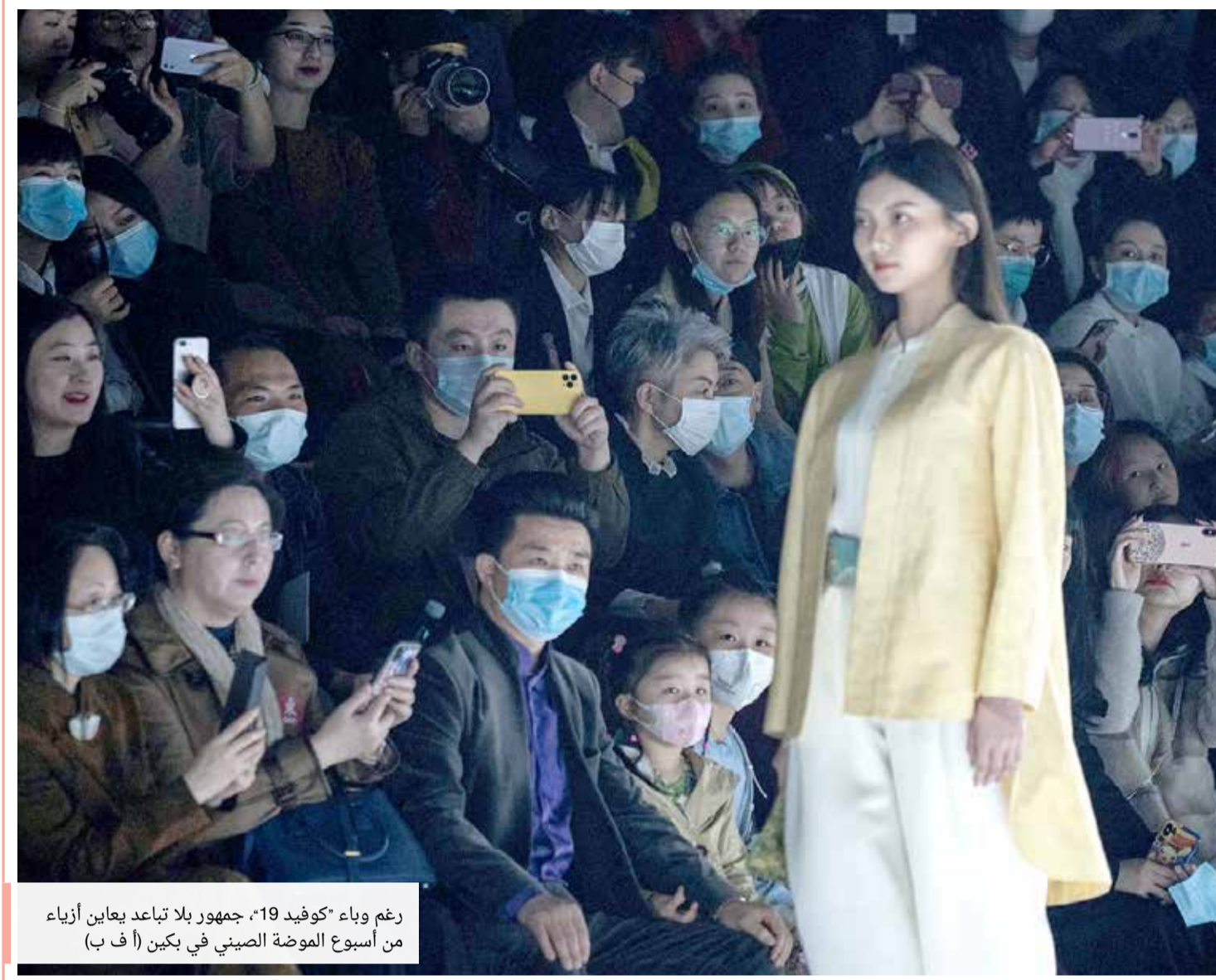
رغم وباء "كوفيد 19"، جمهور بلا تباعد يعاين أزياء من أسبوع الموضة الصيني في بكين

إدارة التحرير: 17111444 +973 17111467 +973 385 @albiladpress.com 2008 ٤٥٥١ عدد - السنة الثالثة عشر - ٣١ مارس ٢٠٢١ - ١٧ شعبان ١٤٤٢ تصدر عن دار البلاد للصحافة والنشر والتوزيع ٤٥٥١ عدد - السنة الثالثة عشر - ٣١ مارس ٢٠٢١ - ١٧ شعبان ١٤٤٢ قسم الإعلانات: 508 / 17111501 +973 32224492 / 39615645 +973 17111434 +973 17111432 +973 17580939