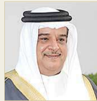
سمو الشيخ عبدالله بن عيسى

الطيبة والمشرفة لمملكة البحرين من حيث حسن التنظيم والإعداد لهذه الفعالية العالمية، التي حظيت بأصدقاء كبيرة على مستوى العالم، داعياً الله عز وجل أن تتواصل نجاحات البحرين في عهد جلالته الملك، وأن يتحقق مزيد من التقدم والازدهار لمملكة البحرين، مشيداً بجهود صاحب السمو الملكي ولي العهد رئيس مجلس الوزراء وبالنجاح الذي بات محل فخر واعتزاز الجميع في ظل العهد الزاهر لصاحب الجلالة الملك.