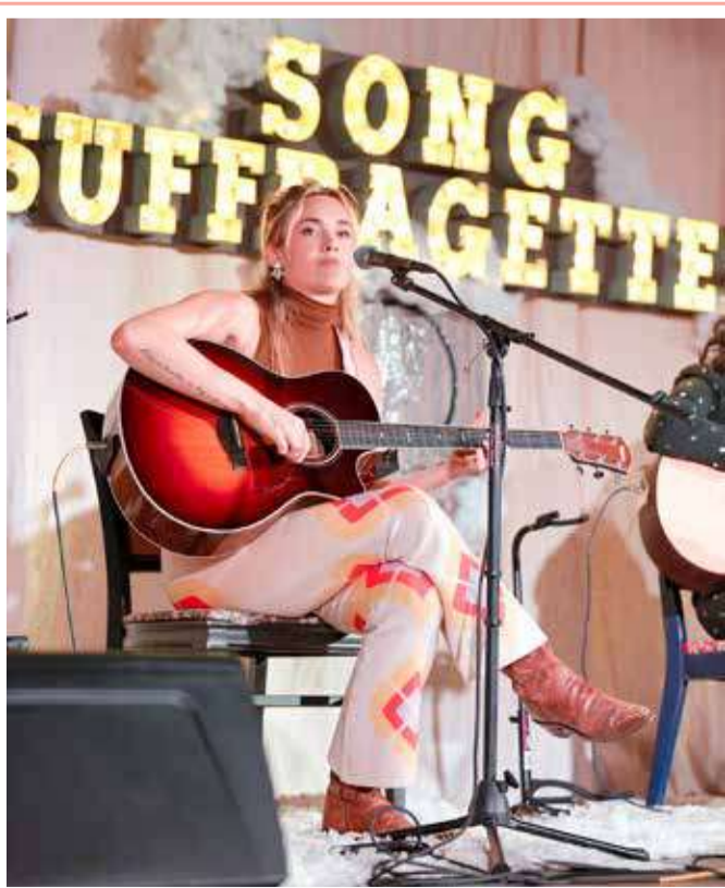
المغنية الأميركية وكاتبة الأغاني صوفيا سكوت تقدم عرضًا في مقهى الاستماع في ناشفيل، تينيسي

تؤكد الدراسات والأبحاث العلمية على أهمية فيتامين "د" للاستمتاع بصحة جيدة، والوقاية من عدة أمراض، لكن هل لهذا الفيتامين دور في الوقاية من فيروس كورونا. البروفيسور كليفن كاشمان، المتخصص في دراسة فيتامين "د" في جامعة كلية كورك في أيرلندا، يقول إن الفيتامين مرتبط بالمزيد من المشاكل الصحية. ويشير إلى أن من يعانون من نقص هذا الفيتامين "أكثر عرضة لخطر الإصابة بعدوى أو احتقان، وهي أشياء واردة بشدة هذا العام". بحسب ما نقل موقع "بي بي سي". وعن علاقة هذا الفيتامين بفيروس كورونا، يشير كاشمان إلى أن "الدراسات العلمية الأولية تؤكد وجود روابط بين نقص فيتامين د وتأثيرات كوفيد-19 على الصحة".