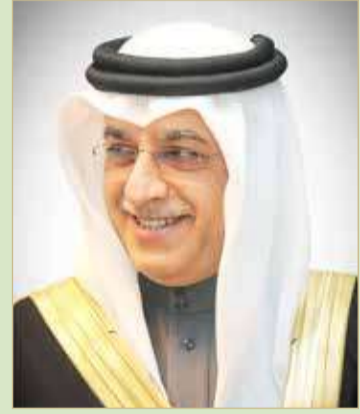
سلمان بن إبراهيم

ونوه الشيخ سلمان بن إبراهيم آل خليفة بجهود ممثل جلالة الملك للأعمال الإنسانية وشؤون الشباب سمو الشيخ ناصر بن حمد آل خليفة، والنائب الأول لرئيس المجلس الأعلى للشباب والرياضة رئيس لجنة