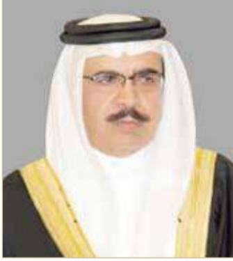
الشيخ راشد بن عبدالله

وأرجع وزير الداخلية نجاح مملكة البحرين في تنظيم هذا الحدث الرياضي الكبير، إلى الدعم الدائم والتوجيهات السديدة من صاحب السمو الملكي ولي العهد رئيس مجلس الوزراء بتهيئة الأجواء الآمنة وفق أعلى مستويات من الدقة والإجراءات لضمان صحة وسلامة الجميع بما يسهم في دعم الاقتصاد الوطني وتوفير مناخات التنمية والارتقاء بالأداء في مختلف المجالات، داعياً المولى جلست قدرته أن يدعم على سموه الصحة والعافية لتحقيق مزيد من الإنجازات لما فيه خير الوطن الغالي تحت القيادة الحكيمة لصاحب الجلالة الملك.