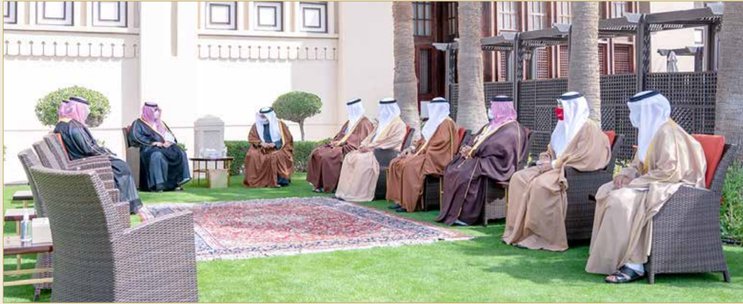
المنامة - بنا

وأقام صاحب السمو الملكي ولي العهد رئيس مجلس الوزراء مأدبة غداء تكريفاً لصاحب السمو الملكي الأمير تركي بن محمد بن فهد بن عبدالعزيز آل سعود والوفد المرافق.