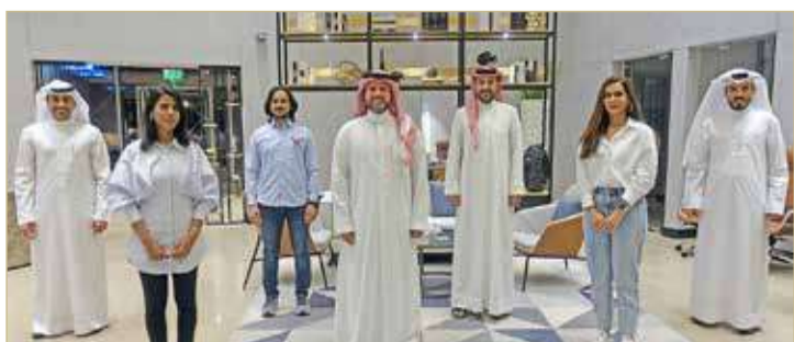
أعضاء مجلس إدارة الترياثلون