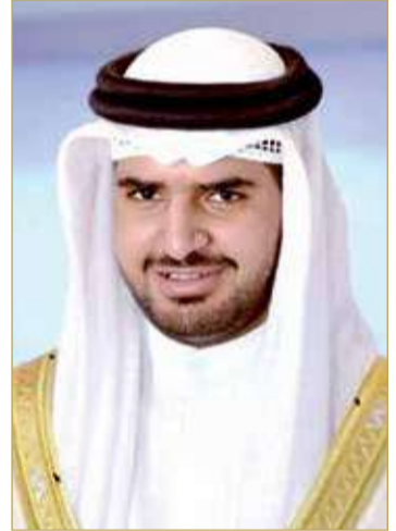
سمو الشيخ عيسى بن علي

سمو الشيخ عيسى بن علي: إقراره يبشر بمستقبل أفضل للرياضة البحرينية