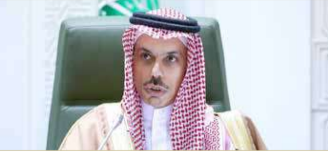
الأمير فيصل بن فرحان بن عبد الله

ويتطلب أن يقوم النظام السوري والمعارضة بالتوافق على حل سياسي". وتابع الأمير فيصل بن فرحان بالقول: "نتمنى أن تظفر الجهود القائمة، إلى حلول في هذا الاتجاه، وهذا البلد يستحق أن يعود إلى حضنه العربي، وأن يحظى بالاستقرار والسلام والأمن، وسوف ندعم أي جهود تخدم هذا التوجه".