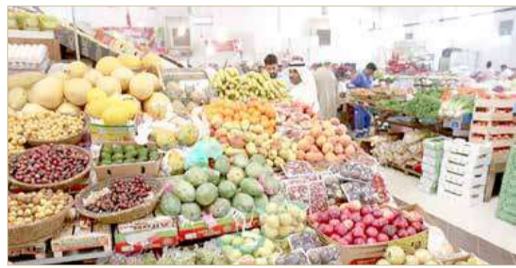
وفرة في احتياجات رمضان واستقرار الأسعار