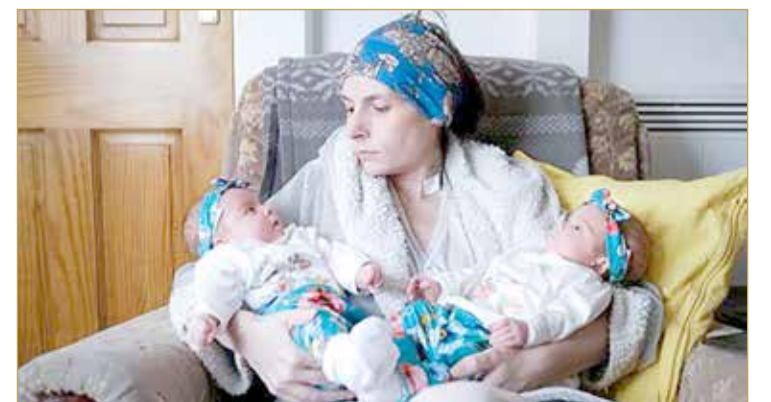
ومما زاد في العجوبة، أن ويليامز أنجبت التوأمين عن طريق عملية قصرية وكانت في حينها مصابة بفيروس كورونا.

في حادثة وصفها البعض بـ"المعجزة"، وضعت امرأة بريطانية تبلغ من العمر 40 عامًا توأمين. وذكرت الصحيفة البريطانية أن السيدة تركت الأطباء في حالة ذهول، بينما كانوا يحاولون العام الماضي دون جدوى البحث عن علاج للمرض الغريب الذي تعاني منه. ويشبه المرض أعراض الإنفلونزا لكن