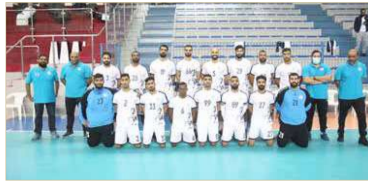
فريق النجمة لكرة اليد