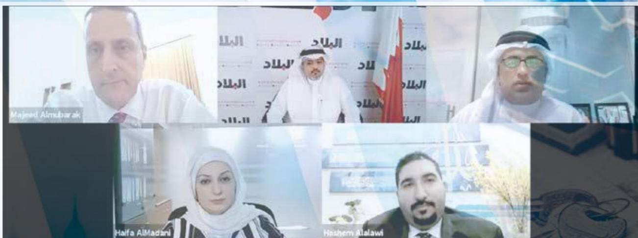
المندوبون بنبذة "البلاد"

1691 منتفعا سجلوا في 2020 والتوقع أن يتجاوز الرقم هذا العام متوسط سعر الوحدات بين 80 و109 آلاف دينار الوزارة تخطط لتخصيص مساحات للوحدات تتجاوز 200 متر