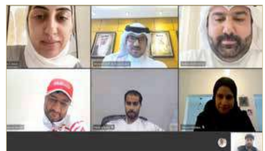
النصف أثناء ترؤسه الاجتماع

أكد تضافر الجهود والإعداد للدورة بالصورة المثلى