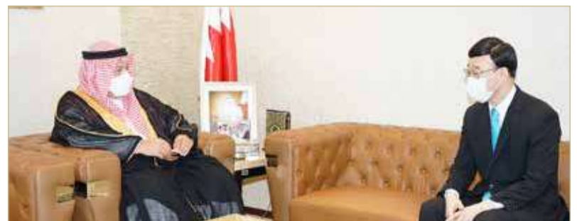
المنامة - وزارة العدل والشؤون الإسلامية

علاقات الصداقة الوطيدة التي تربط بين مملكة البحرين وإمبراطورية اليابان الصديقة، مثمناً الجهود المميزة التي بذلها السفير خلال فترة عمله في تعزيز التعاون المشترك بين البلدين الصديقين، ومنها في المجال العدلي.