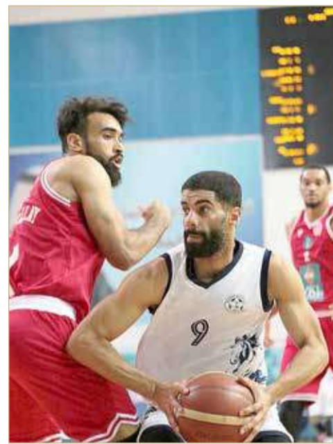
لقاء النجمة والمحرق

كسب فريق النجمة المركز الثالث والبرونزية لدوري زين لأندية الدرجة الأولى لكرة السلة، بعد فوزه الثمين والمستحق على نظيره المحرق بنتيجة (89/83) في المباراة التي جمعتهم مساء الثلاثاء لتحديد المركزين (الثالث والرابع).