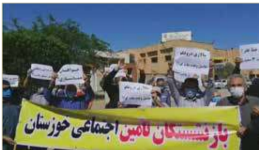
متقاعدون يتظاهرون في خوزستان

من جانب آخر، حذرت السلطات الصحية الإيرانية من خطورة الأوضاع الوبائية في البلاد بسبب انتشار السلالتين البريطانية والبرازيلية لفيروس كورونا المسبب لعدوى "كوفيد-19" وحجم