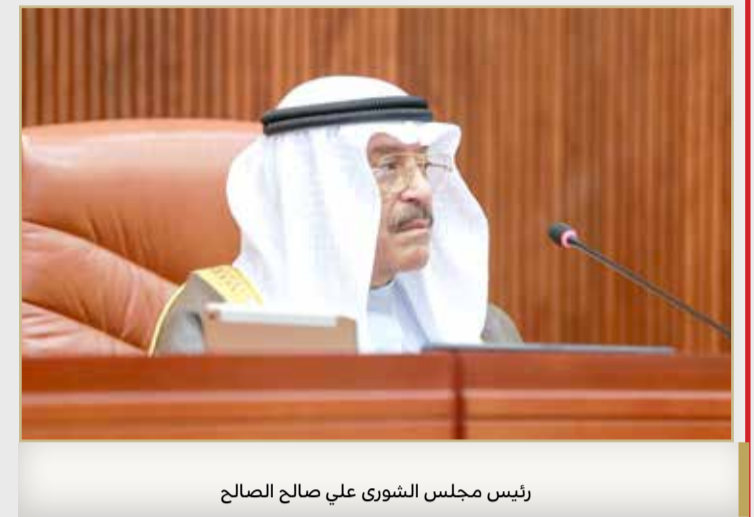
رئيس مجلس الشورى علي صالح الصالح