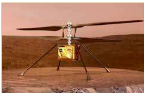
أول عملية طيران لمركبة بمحرك على كوكب آخر

وأضاف أن ”الاختبار التالي: البقاء على قيد الحياة في الليل“. وأظهرت صورة مصاحبة للتغريدة الروبوت ”برسفيرنس“ مبتعداً عن المروحية، وهو ينبغي أن يتعد في أقل من 25 ساعة ما فيه الكافية ليفسح المجال أمام أشعة الشمس التي تحتاج إليها المروحية لتوليد طاقتها بواسطة الألواح الشمسية، بحيث تستطيع تدفئة نفسها خلال ليالي المريخ الباردة. وأمنت ”إنجينيويتي“ حتى الآن تغذيتها من طاقة العربة الجوالة، ولكنها ينبغي أن تغذي نفسها بعد الآن. وستنفذ ”إنجينيويتي“ أول عملية طيران لمركبة بمحرك على كوكب آخر غير الأرض. وفي حال نجاح الاختبار، سيشكل إنجازاً كبيراً، إذ إن كثافة جو المريخ لا تتعدى واحداً في المئة من كثافة غلاف الأرض الجوي.