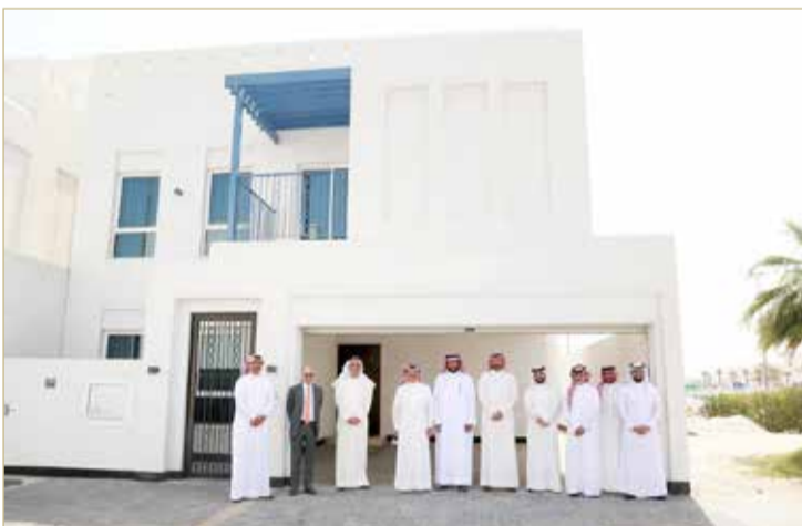
أثناء تسليم الفيلا السكنية

في 5 أيام فقط من طرح أحدث حملاته الترويجية