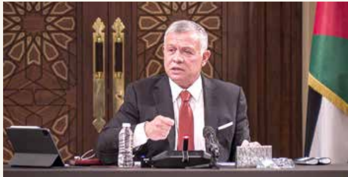
تصامم عربي ودولي مع العاهل الأردني في "إجراءاته لحفظ أمن المملكة"

وأعربت العديد من الدول في الشرق الأوسط وخارجه عن دعمها الكامل للعاهل الأردني عبدالله الثاني في الإجراءات التي اتخذها، على خلفية أبناء عن مؤامرة مزعومة تهدف للإطاحة به.