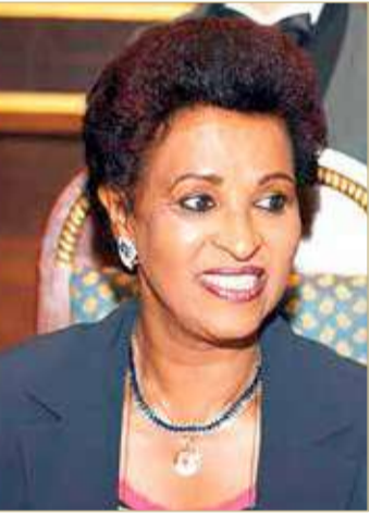
الشيخة نعيمة الاحمد الجابر الصباح

تقدم نادي سلوى الصباح الكويتي للفتاة بطلب رسمي لدى الاتحاد العربي لكرة الطائرة الذي يتخذ من مملكة البحرين مقراً له لاستضافة البطولة العربية للسيدات للأندية على أرض الكويت بشهري يونيو أو يوليو المقبلين.