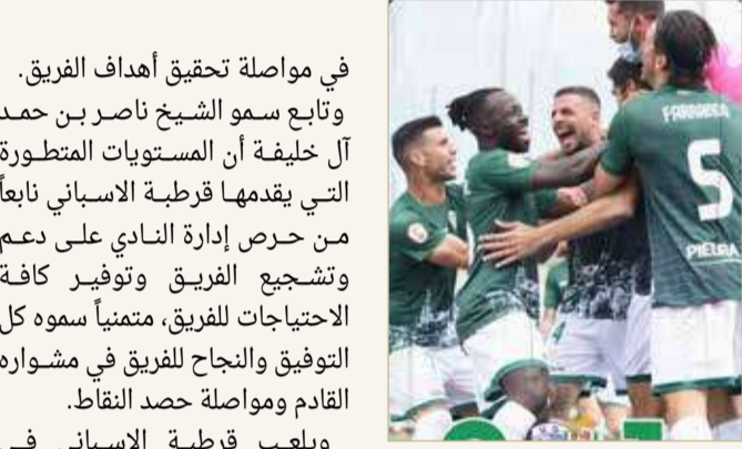
لقطة لفريق قرطبة

◆ سموه أعرب عن سعادته بانتصار الفريق على تاماريسيستي بالدوري الإسباني