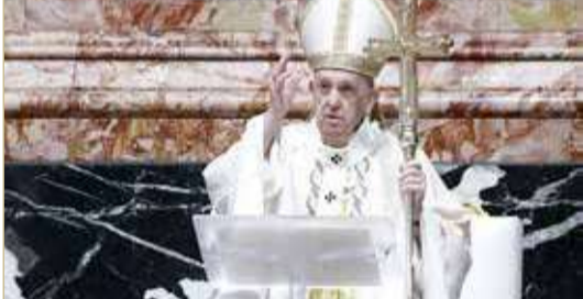
البابا فرنسيس خلال الاحتفال بقداس عيد الفصح

دعا البابا فرنسيس أمس الأحد في رسالة عيد الفصح المجتمع الدولي إلى تشارك اللقاحات المضادة لكوفيد-19 مع الدول الأكثر فقراً، ووضع حد لـ "قرعة السلاح" في سوريا واليمن وليبيا.