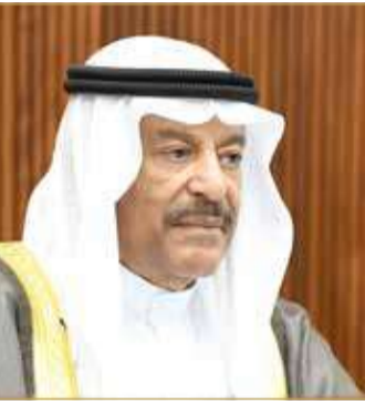
رئيس مجلس الشورى

وأشار رئيس مجلس الشورى إلى أن مملكة البحرين، بقيادة جلالة الملك، تعتبر نموذجاً متقدماً رائداً في التعايش والوئام والإخاء، حيث جسدت جاذبة فيروس كورونا (كوفيد 19) مثلاً للتعايش الإنساني وتقديم الرعاية الصحية والعلاجية لجميع المواطنين والمقيمين، فضلاً عن توفير اللقاحات المضادة للفيروس مجاناً للجميع، وهو الأمر الذي يبعث على الفخر الكبير، ويضاف للسجل الإنساني المشرف لمملكة البحرين.