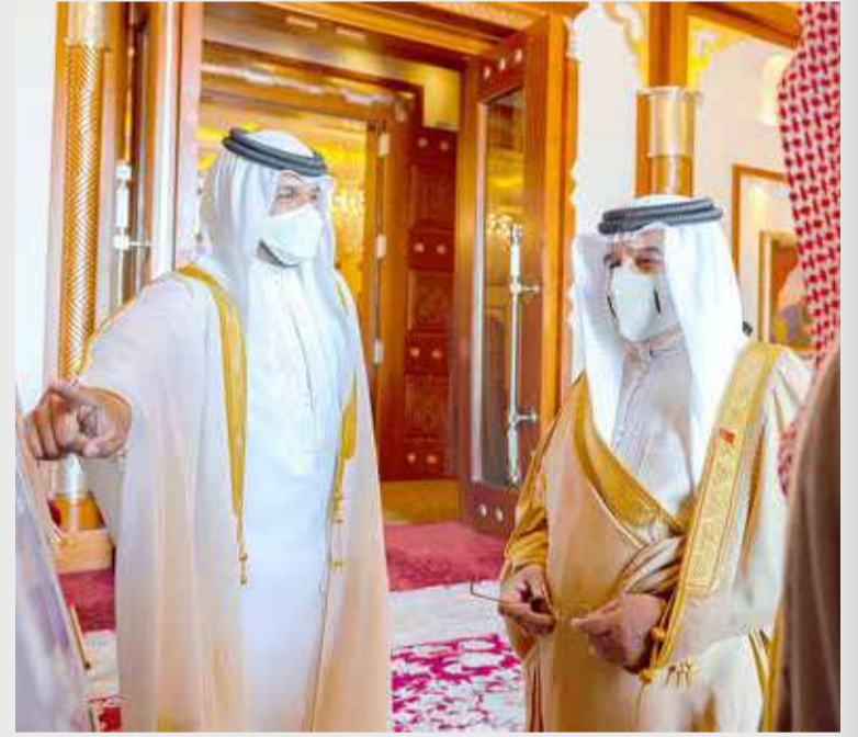
جلالة الملك مستقبلاً سمو الشيخ ناصر بن حمد وسمو الشيخ خالد بن حمد

أكد عاهل البلاد صاحب الجلالة الملك حمد بن عيسى آل خليفة اهتمام المملكة بتطوير جميع التشريعات والقوانين التي تسهم في تقدم الحركة الرياضية والشبابية، إضافة إلى تحديث الأنظمة بصورة مستمرة بما يتوافق مع القوانين والنظم العالمية، التي تشكل أساساً مهماً للاعتراف الرياضي، متطلعاً لجلالته أن تواصل المنتخبات والفرق البحرينية مسيرتها المشرفة وتمضي قدماً في تمثيل الوطن خير تمثيل في جميع المنافسات الرياضية المقبلة. (02)