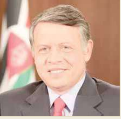
جلالة الملك عبدالله الثاني

جلالته يعلن تأييد المملكة وتضامنها الكامل مع قرارات عبدالله الثاني