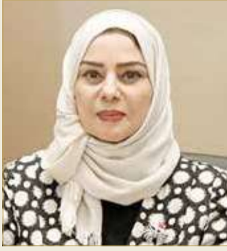
رئيسة مجلس النواب

مرة في العام 2019م، تأكيداً لدور مملكة البحرين ومكانتها في المجتمع الدولي. وأكدت الدعم النيابي المستمر لجهود مملكة البحرين الريادية المتميزة، في خدمة القضايا الإنسانية، والسعي الحثيث من أجل بناء تفاهم عالمي مشترك يسوده الأمن والطمأنينة، ومكافحة وبنيذ كافة صور وأشكال التطرف والإرهاب والكراهية بين الشعوب، وترسيخ ونشر قيم الخير والعدل والوئام والتسامح، وتحقيق كل ما يكفل الحق للجميع في التطور والبناء، والتقدم والإزدهار، والوصول إلى ذروة التنمية والكرامة الإنسانية.