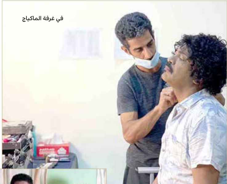
في غرفة الماكياج