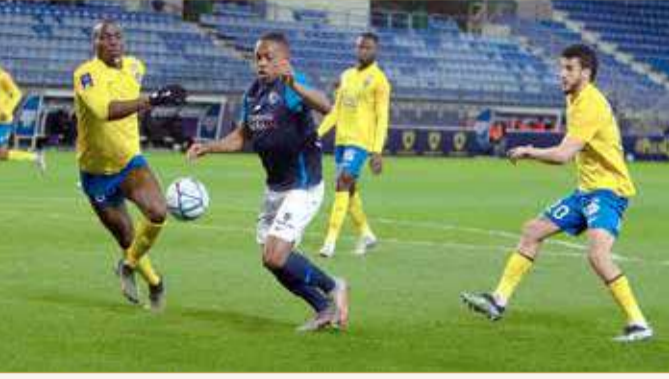
لقطة لفريق باريس أف سي

◆ أشاد بفوز "باريس أف سي" على "سوشو" بالدوري الفرنسي