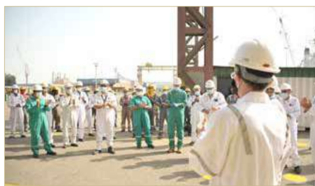
المطلوبة لأنشطة النفط والغاز بالمنطقة إضافة إلى إصلاح وتصنيع أوعية الضغط التي تشمل المعدات الأساسية بالقطاع النفطي إضافة إلى كونها عضوًا رئيسًا في قطاع الإصلاح البحري.

احتفلت دائرة البناء الجديد والهندسة بالشركة العربية لبناء وإصلاح السفن (أسري)، وهي الشركة الرائدة في مجال الإصلاح والبناء البحري في منطقة الخليج العربي، بحصولها على اعتماد الجمعية الأميركية للمهندسين الميكانيكيين (ASME) للقيام بأعمال تصنيع وإصلاح أوعية الضغط.