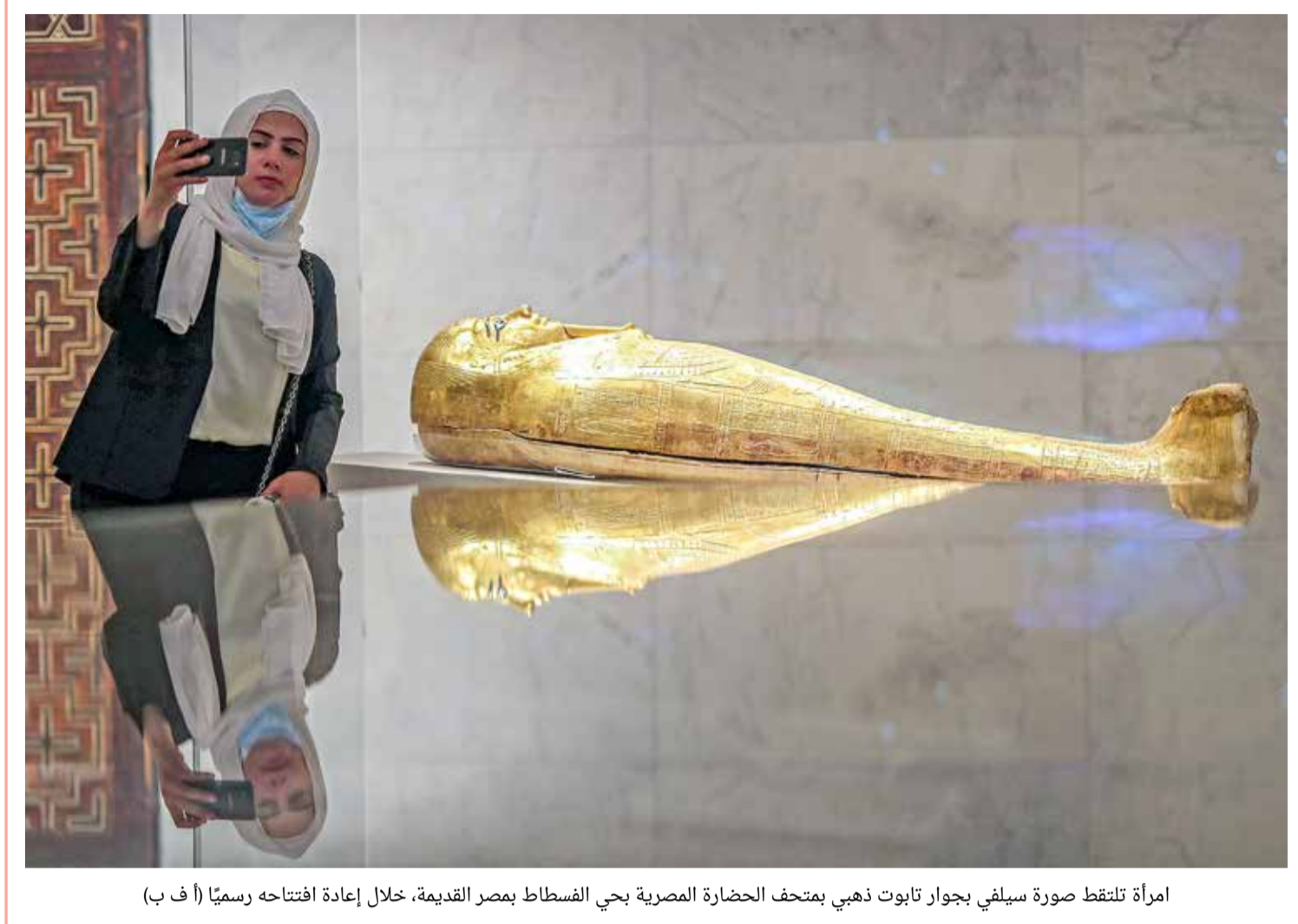
امراة تلتقط صورة سيلفي بجوار تابوت ذهبي بمتحف الحضارة المصرية بحي الفسطاط بمصر القديمة، خلال إعادة افتتاحه رسمياً