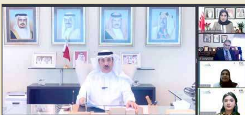
لخدمة الطلاب قبل وبعد تخرجهم وذلك من خلال إستراتيجية واضحة المعالم، ومنهج علمي متكامل ومتزامن مع الخطط الأكاديمية المطبقة في الجامعة.

بدوره، أكد رئيس الجامعة غسان عواد أن تنظيم ملتقى ومعرض يوم المهن الثامن يؤكد على نجاح النسخ السابقة في تحقيق الأهداف المرجوة، والمساهمة في تعزيز التواصل بين الطلبة وأصحاب العمل، لافتاً إلى أن الجامعة تحرص على رفد سوق العمل بالخريجين المتميزين في مختلف المجالات، وذلك من خلال الحرص على رعاية الطلبة وتلقيهم للتدريب العملي قبل استكمال متطلبات التخرج، ما يساعدهم على سهولة الانخراط في سوق العمل ويسهم في اكتسابهم الخبرات الكافية للعمل.