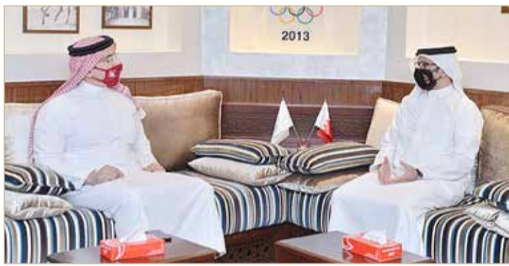
النصف لدى استقباله وفد اتحاد الجودو

أكد أن دعم خالد بن حمد للألعاب القتالية قادها لتحقيق إنجازات مشرفة