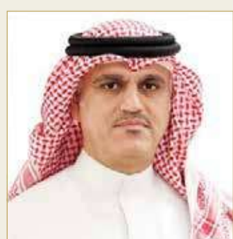
الشيخ محمد بن أحمد

الحياة". وتابع "إن اليوم الدولي للضمير بقدر ما يشكل من وسيلة لتعبئة جهود المجتمع الدولي لتعزيز السلام والتسامح والاندماج والتفاهم بقدر ما هو فلسفة حياة وإدارة وبناء وفن يجيده العظماء والرسلانيون في هذه الحياة. كما أننا نؤمن أن عملية البناء والتنمية لا يمكن أن تكون إلا بعنصرين أساسيين هما الضمير الحي المحب لكل قيم الحياة والتسامح وتقبل الآخر وعنصر الإرادة التي تعمل من أجل هذه الأهداف السامية وهي الأهداف التي تشترك فيها جميع الرسالات السماوية والفلسفات الأخلاقية التي ترتكز على حق الإنسان في العيش الكريم".