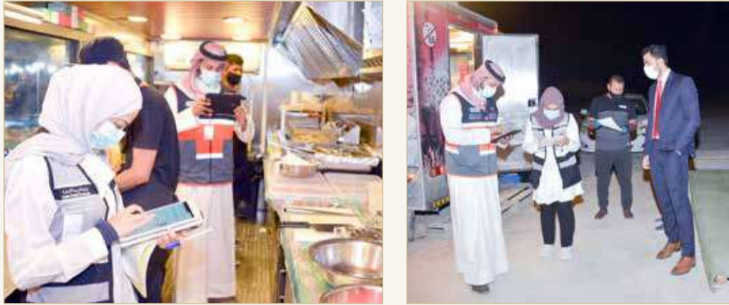
جانب من الحملة التوعوية للأطعمة المتنقلة

والمتوسطة، وزيادة أعداد العربات المرخصة، كون هذا النوع من المشاريع يساهم في دعم للاقتصاد الوطني، ورواد الأعمال في المملكة، في ظل توجيهات القيادة الرشيدة بتطوير ودعم هذا القطاع. واختتم الأشراف أنه وبحسب الخطة التفتيشية للوزارة سيتم القيام بالعديد من الزيارات الميدانية الرقابية بكافة محافظات البحرين للتحقق من التزام أصحاب العربات المتنقلة، ودعا أصحاب العربات بضرورة الحصول على كافة التراخيص المطلوبة قبل البدء بالنشاط التجاري، إضافة إلى دعوة جميع المتعاملين والمستهلكين لتقديم أية اقتراحات أو شكاوى للجهات المختصة في حال وجود مخالفات أو ملاحظات، عبر قنوات التواصل المتاحة.