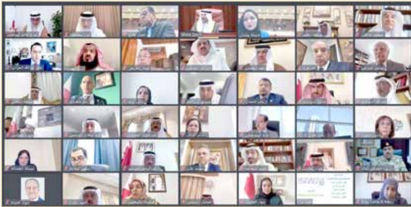
صور الجلسة الخامسة والعشرين لمجلس الشورى

ويجوز إعفاؤه من العقوبة إذا رأى القاضي محلاً لذلك، ويسري حكم الفقرة السابقة كذلك بالنسبة إلى الجاني الذي يُمكن السلطات أثناء التحقيق من القبض على مرتكبي الجريمة الآخرين.