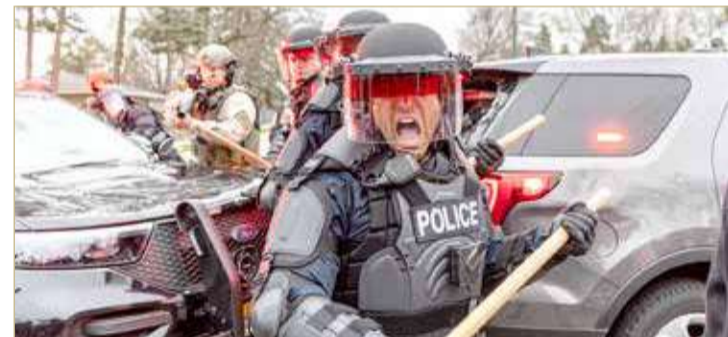
ضباط الشرطة أثناء اشتباكاتهم مع المتظاهرين في مركز بروكلين، مينيابوليس

◆ احتجاجاً على مقتل شاب أسود على أيدي الشرطة الأميركية