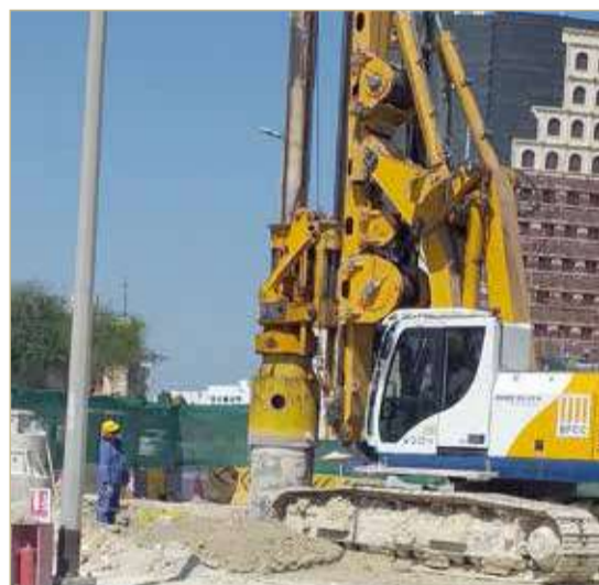
ضمن الأعمال التحضيرية لمشروع تطوير شارع الفانج

2.2 مليون دينار كلفة المشروع وينتهي نوفمبر المقبل