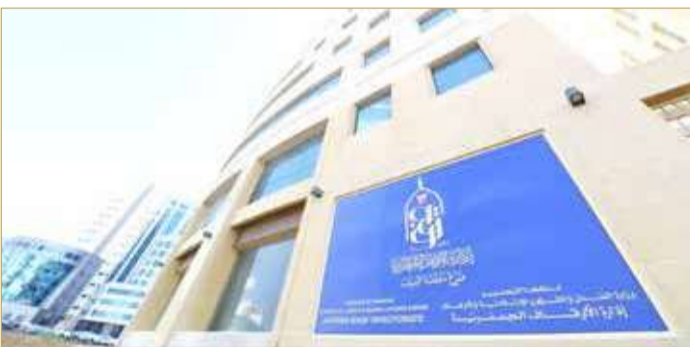
المنامة - إدارة الأوقاف الجعفرية

في ضوء المستجدات المتعلقة بالوضع الحالي وبعد المناقشة مع الفريق الطبي الوطني للتصدي لفيروس كورونا، ومراعاة لأهمية المناسبات الدينية، وبعد الاجتماع المشترك الذي عقد أمس بين رئيس المجلس الأعلى للصحة رئيس الفريق الوطني للتصدي لفيروس كورونا الفريق طبيب الشيخ محمد بن عبد الله آل خليفة ورئيس الأوقاف الجعفرية يوس ف الصالح، تم التوافق على السماح بإعادة فتح المآتم، والالتزام بالإجراءات الاحترازية التالية: يقتصر فتح المآتم للرجال فقط ويقتصر الحضور على المتطعمين فقط (بعد 14 يوماً من الجرعة الثانية للتطعيم)، على ألا يتجاوز الحضور 30% من الطاقة الاستيعابية داخل المآتم، وألا يكون بين الحضور من هم من كبار السن (60 سنة وما فوق)، وأصحاب الأمراض المزمنة، كما يجب الالتزام بلبس الكمامات وترك مسافة مترين بين الحاضرين على ألا تتجاوز مدة القراءة 45 دقيقة، وأن يتم فتح المآتم نصف ساعة قبل القراءة. وعلى إدارة المآتم تسجيل أسماء الموجودين وعدم السماح للمواكب خارج المآتم، وأن يتم مسح الأسطح ومقابض الأبواب قبل وبعد انتهاء المناسبة الدينية بالماديل المعقمة أو الماء والصابون إن أمكن، والاحتفاظ بسجل خاص بأوقات التطهير للأسطح، وأن يتم توفير معقمتان لليد عند الأبواب والتأكد من أن يكون مطهر الأيدي يحتوي على 70% من الكحول وتوزيع الماديل الورقية في أنحاء المآتم ووضعها في أماكن بارزة. وطالب المجتمعون بإزالة جميع برادات المياه وثلاجات المياه وعدم السماح بتوزيع المأكولات أو المشروبات في المآتم، وتوفير سلال مهملات ونفايات تعمل دون الحاجة للمس ويجب التخلص من النفايات بشكل مستمر، وإغلاق دورات المياه وأماكن الوضوء وجعل أبواب المآتم مشرعة قبل وبعد المناسبة الدينية لتسهيل عملية الدخول والخروج.