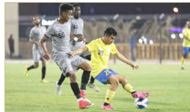
من مباراة التضامن وقلالي