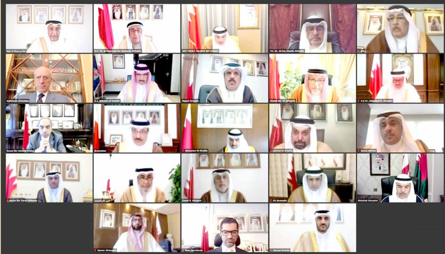
سمو ولي العهد رئيس الوزراء مترئسا الاجتماع الأسبوعي لمجلس الوزراء صباح أمس عن بُعد

مجلس الوزراء يوافق على إنشاء وتنظيم الهيئة العامة للرياضة