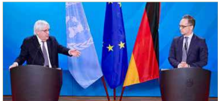
مارتن غريفيث مع هايكو ماس خلال مؤتمر صحفي في برلين

◆ طالبت أطراف النزاع بالتفاوض بحسن نية دون شروط