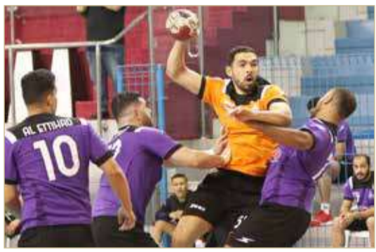
من مباراة الاتحاد والدير

الاتفاق يكسب التضامن في كأس خالد بن حمد لكرة اليد