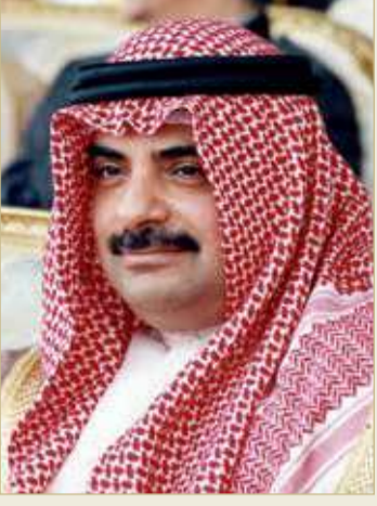
سمو الشيخ سلمان بن خليفة