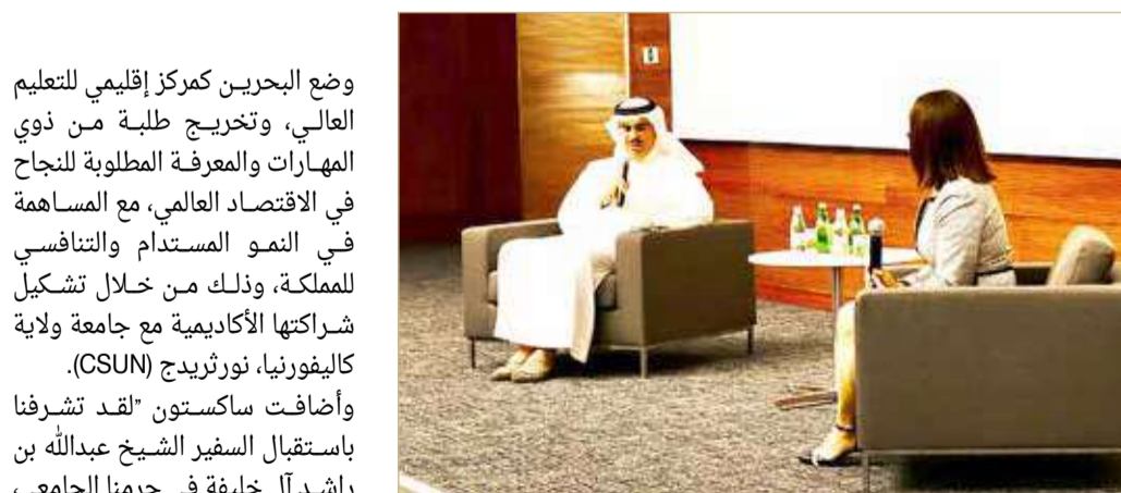
المنامة - وزارة الخارجية

◆ دور مهم للجامعة الأميركية في تحسين جودة التعليم