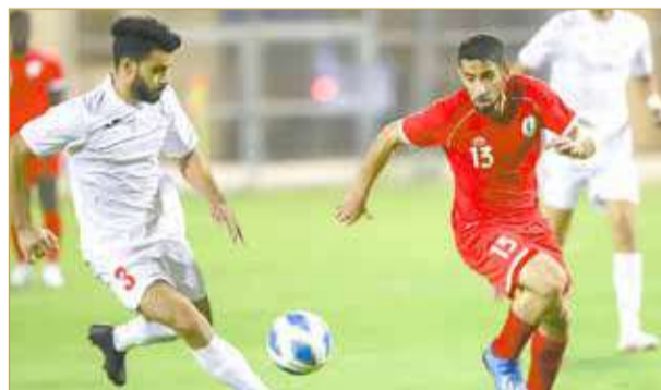
من مباراة سترة والاتفاق