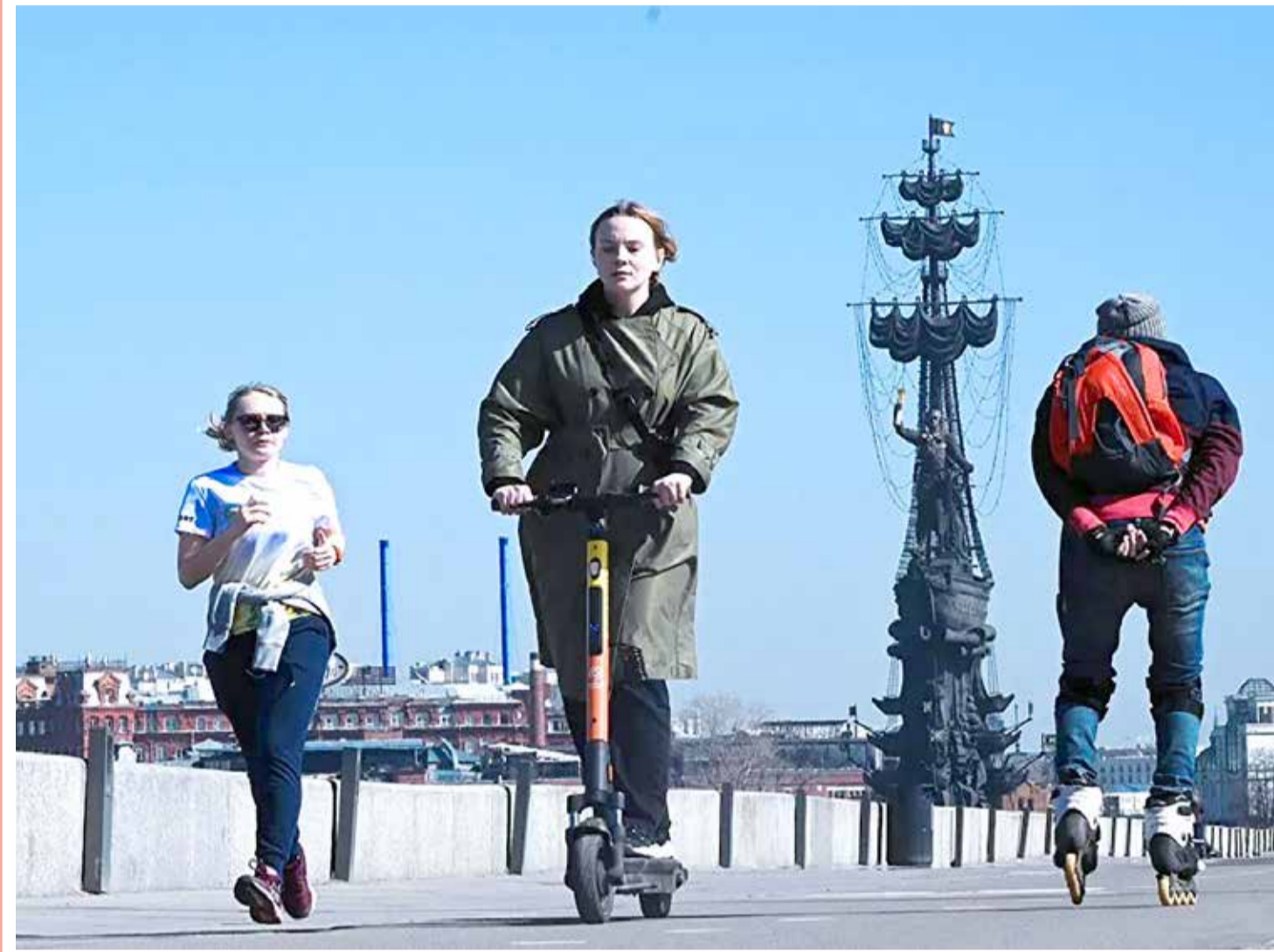
مواطنون يتنزهون في حديقة "موزيون" على ضفة نهر موسكو، إذ شهدت العاصمة الروسية طقساً مشمساً ودافئاً صيفياً تقريباً.