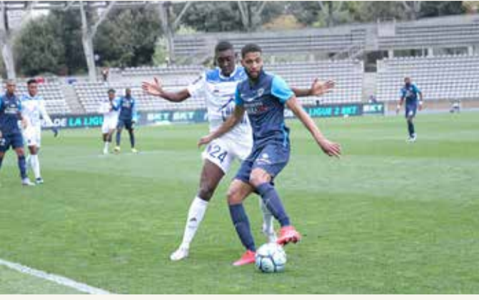
من مباريات الفريق