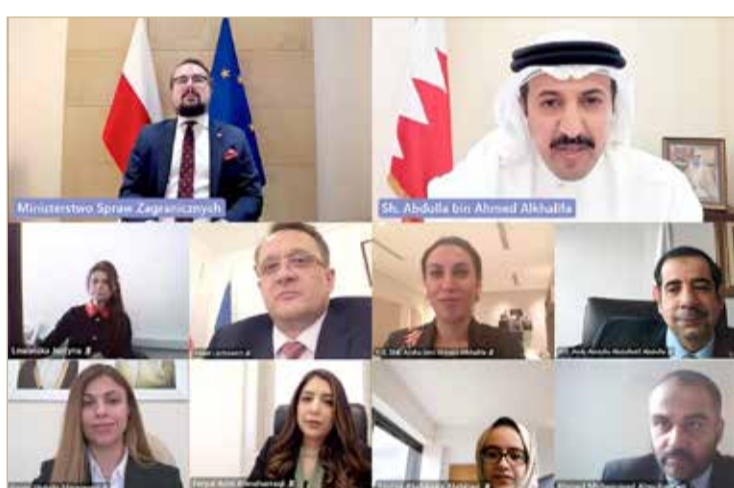
المنامة - وزارة الخارجية

◆ مرور 3 عقود على العلاقات الدبلوماسية بين البلدين