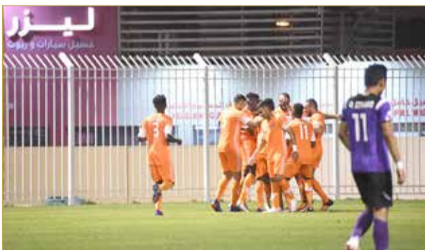
فرحة حلاوية بالصدارة

مستفيداً من خسارة الاتفاق الأولى... والتضامن يحقق فوزه الأول على قلالي