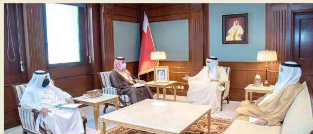
المنامة - وزارة الخارجية

◆ الزباني يستعرض التطورات بالمنطقة مع الأمير سلطان