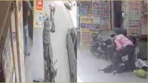
الجريمة أثارت غضبا حقيقيا واسعا

تعرضت امرأة هندية للقتل بطريقة مروعة، عندما انهال عليها زوجها بالطعنات، في وضح النهار، فيما لم يتمكن أي شخص في الشارع من تقديم المساعدة، مما خلف غضبا عاما، وسلط الضوء مجددا على وضع المرأة في البلد الآسيوي.