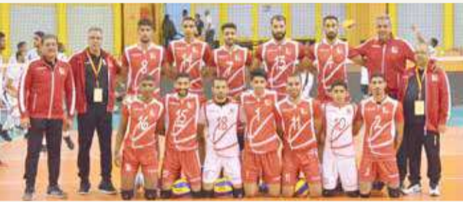
منتخبنا الأول لكرة الطائرة

والعشرون للرجال التي استضافتها جمهورية مصر العربية في نوفمبر 2018 آخر مشاركة لمنتخبنا الوطني وحقق فيها المركز الثاني بعد خسارته من منتخب مصر بثلاثة أشواط مقابل شوط. وتعتبر البطولة العربية الحادية