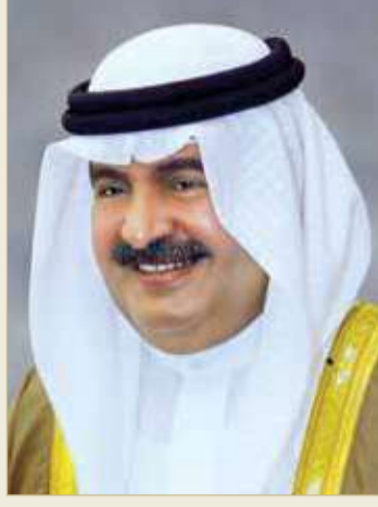
سمو الشيخ علي بن خليفة