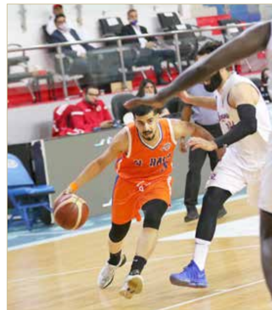
من مباراة المنامة والحالة

خطا المنامة والأهلي خطوة إلى نهائي كأس خليفة بن سلمان لكرة السلة الموسم الرياضي 2020 - 2021، بتخطيها الحالة والنجمة على التوالي، نصف النهائي الأول من سلسلة 3 مباريات، في المواجهتين التي أقيمتا الإثنين على صالة اتحاد اللعبة بأم الحصم. المنامة تفوق على الحالة بفارق 16 نقطة بواقع 83-98، وجاءت نتائج الفترات الأربع كالتالي: 26-21 الحالة، 16-25 المنامة، 24-25 الحالة، 26-28 المنامة. وتفوق الأهلي على النجمة بفارق 20 نقطة بواقع 77-97، إذ كانت نتائج الفترات كالتالي: 13-21 الأهلي، 21-24 النجمة، 30-18 الأهلي، 22-25 الأهلي. وستقام المباراة الثانية من سلسلة المباريات الثلاث يومي الإثنين والثلاثاء المقبلين، إذ يلعب يوم الإثنين 19 أبريل الحالة مع المنامة، ويوم الثلاثاء 20 أبريل يلتقي النجمة مع الأهلي، ويكفي المنامة والأهلي الفوز للتأهل إلى النهائي، فيما يسعى الحالة والنجمة للفوز وتأجيل الحسم للمباراة الفاصلة.