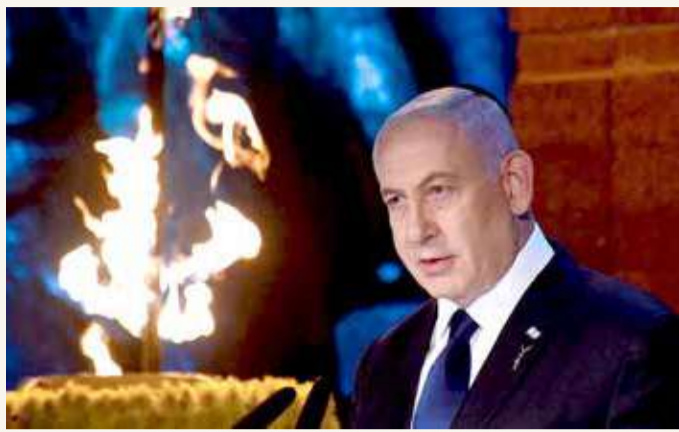
رئيس الوزراء الإسرائيلي بنيامين نتنياهو

◆ طهران تتهم إسرائيل بالوقوف وراء هجوم نطنز وتوعد بـ "الانتقام"