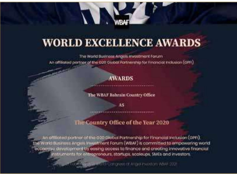
صورة الشهادة الخاصة بالجائزة

ناس: إضافة جديدة لسجل المملكة الحافل بزيادة الأعمال