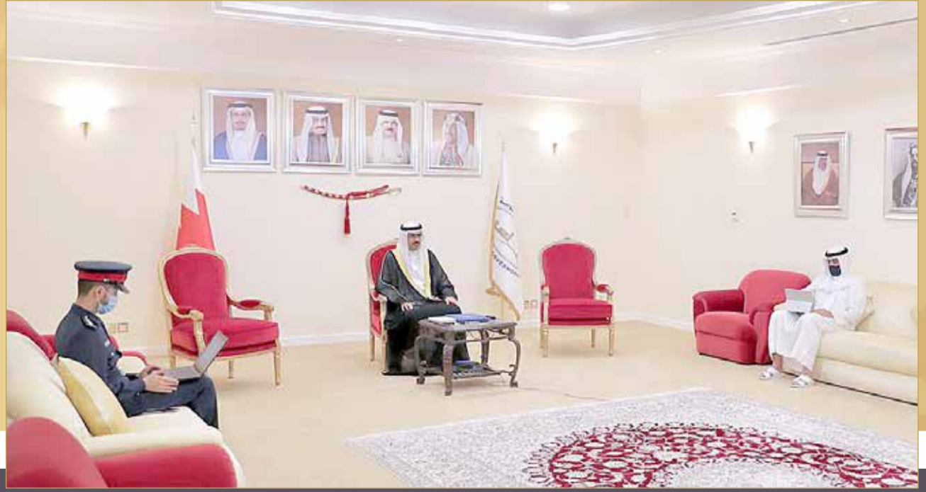
سمو محافظ الجنوبية متحدثاً إلى المشاركين بمجلس "البلاد" الرمضاني