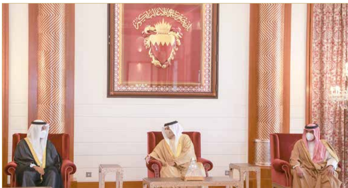
جلالة الملك مستقبلاً القائد العام لقوة الدفاع وسمو رئيس الحرس الوطني ووزير الداخلية ورئيس جهاز المخابرات الوطني

جلالة الملك يشكر جميع المواطنين والمقيمين المبادرين بأخذ التطعيم