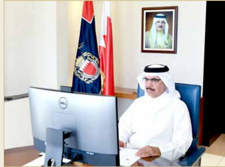
الشيخ راشد بن عبدالله يترأس اجتماع مجلس الدفاع المدني