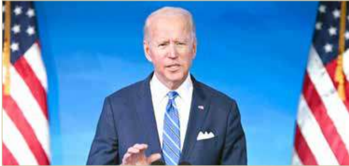
الرئيس الأميركي جو بايدن

◆ سنعيد قواتنا إلى أرض الوطن وسنواصل دعم الحكومة الأفغانية