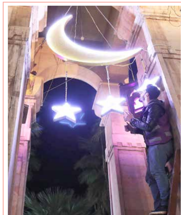
سوري يركب زينة شهر رمضان المبارك في ساحة الساعة بمدينة إدلب شمال غرب سوريا

وبينت الدراسة أن "الخمول البدني شكل أهم عامل خطر في كل النتائج"، بالمقارنة مع عوامل الخطر الأخرى كالتدخين والسمنة وارتفاع ضغط الدم وأمراض القلب والأوعية الدموية أو السرطان.