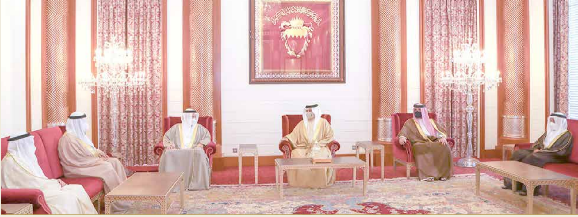
جلالة الملك المفدى يستقبل رئيس المجلس الأعلى للشؤون الإسلامية ورئيس مجلسي الأوقاف

جلالة الملك: جهود مقدرة لمجلسي الأوقاف في رعاية شؤون دور العبادة