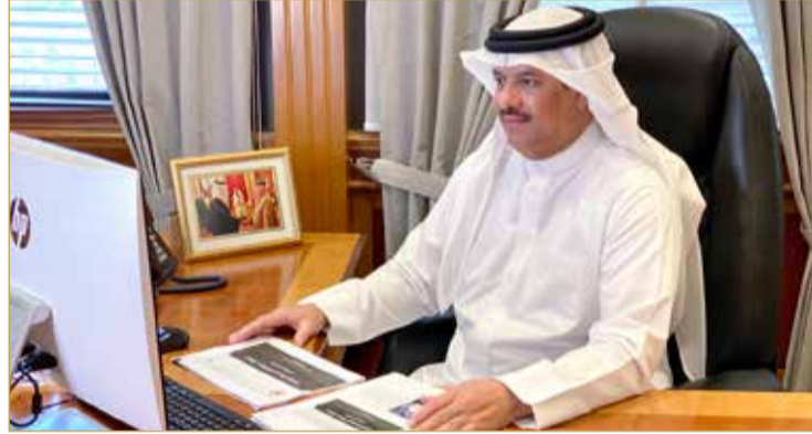
مساعد وزير الخارجية مترشاً اجتماع اللجنة الوطنية

الكيميائية والوكالة الدولية للطاقة الذرية والمنظمات الدولية ذات العلاقة بأسلحة الدمار الشامل، يتم خلالها تبادل المعلومات اللازمة، ومتابعة عمليات التفتيش التي تقوم بها المنظمات، وذلك في حدود ما نصّت عليه التشريعات الوطنية لمملكة البحرين وبالتنسيق مع الجهات المختصة في المملكة.