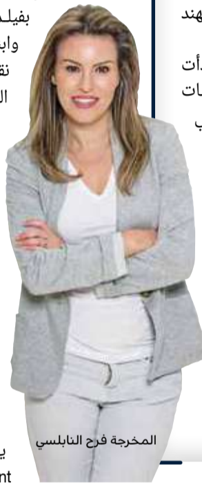
المخرجة فرح النابلسي

تحدث المخرجة فرح النابلسي عن أول ظهور لها في مجال الإخراج، بفيلم قصير يتحدث عن أب وابنته أجبروا على عبور نقاط التفتيش في الضفة الغربية بعنوان "The Present" أو "الهدية"، الذي يعرض حالياً على نتفليكس، وفاز أخيراً بجائزة جائزة أفضل فيلم قصير بالدورة الحادية عشر لمهرجان مالمو للسينما العربية، وهو الآن مرشح لجوائز أكبر فيلم على جانبي المحيط الأطلسي في جوائز الأوسكار. وفي غضون 24 دقيقة، يمتلك "The Present" فرضية بسيطة