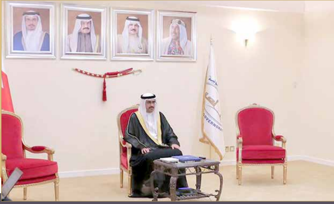
سمو محافظ الجنوبية متحدثاً عبر الاتصال المرئي