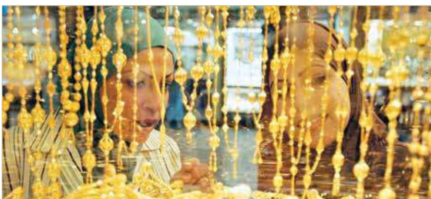
86% من واردات الذهب من الإمارات العربية المتحدة

66.2% الزيادة في استيراد المعادن الأصفر في مارس