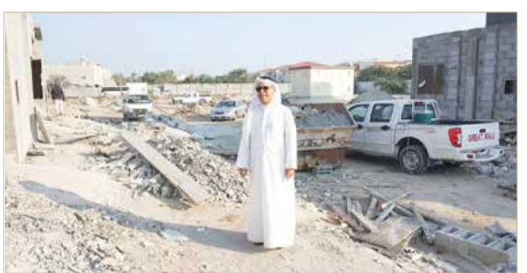
الوداعي أثناء متابعته للمنطقة قبل استكمال أعمال البناء

حرصنا على الحضور في الموقع برفقة مهندسي صيانة الطرق ومفتشي النظافة وموظفي لجنة العمل المباشر في شؤون الأشغال. ولفت إلى أنه إضافة إلى المعوقات المشار إليها فان طبيعة المنطقة تعد من المعوقات؛ بسبب كونها زراعية في الأصل، وبالتالي فإن التربة متفتكة، ما يتسبب ذلك في إحداث مصاعب أخرى في عملية التسوية الترابية.