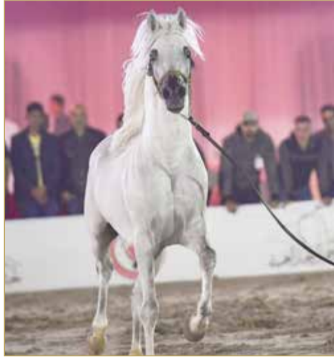
من منافسات جمال الخيل

وأوضح أن مربط عالي قادم بقوة للبطولة من أجل حصد الإنجازات،