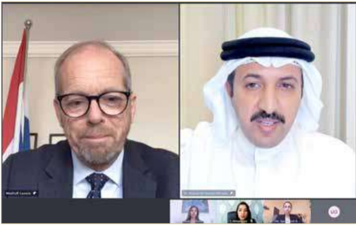
وكيل وزارة الخارجية للشؤون الدولية مجتمعاً مع السفير الهولندي

عبدالله بن أحمد يستقبل السفير الجديد للدولة الصديقة