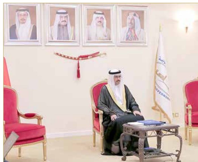
سمو محافظ الجنوبية متحدثاً في أول مجالس "البلاد" الرمضانية عبر الاتصال المرئي

سمو محافظ الجنوبية يشرف أول مجالس "البلاد" بمشاركة مسؤولين ونواب وبلديين