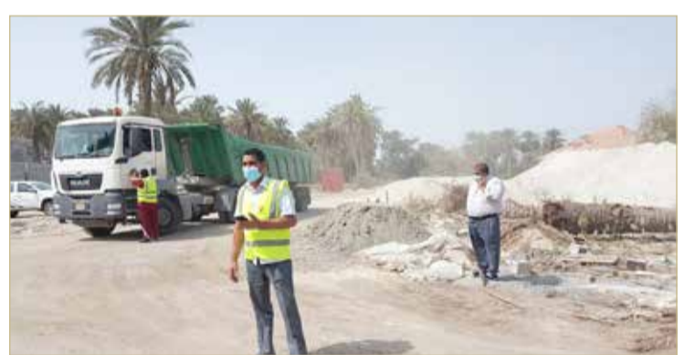
أثناء أعمال التسوية