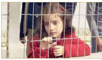
أفضل فيلم قصير بمهرجان مالمو للسينما العربية