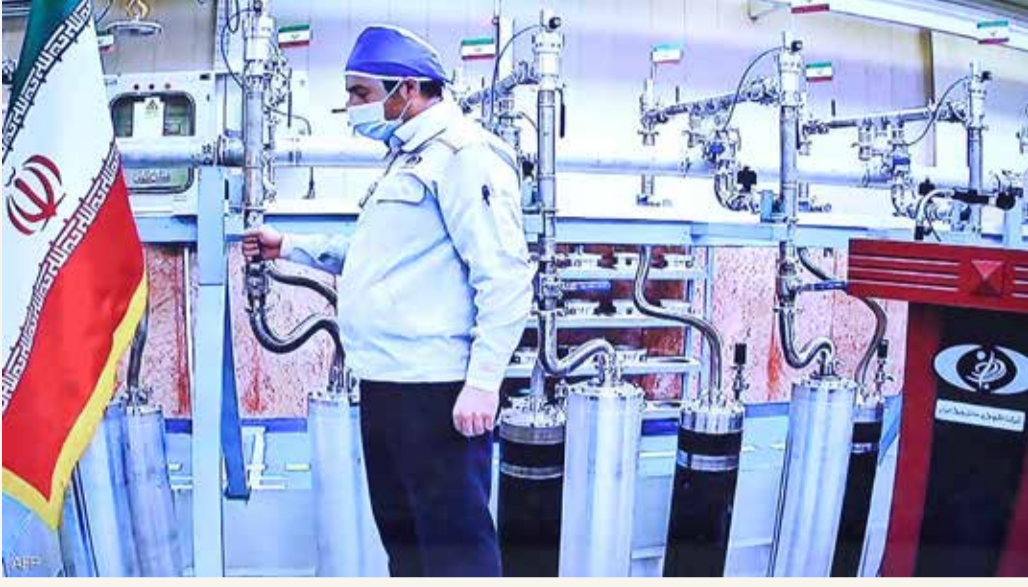
مشأة نووية في إيران

دعت السعودية أمس الأربعاء إيران إلى "تفادي التصعيد وعدم تعريض أمن المنطقة لمزيد من التوتر"، وذلك بعد إعلان طهران رفع نسبة تخصيب اليورانيوم إلى 60%.