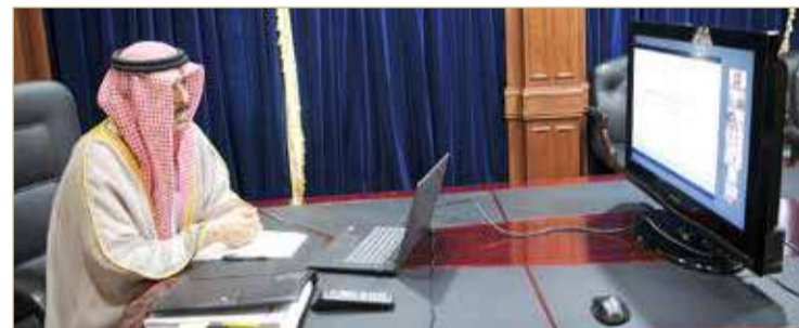
ماجد النعيمي يترأس مجلس أمناء جامعة البحرين

في الجوانب الأكاديمية والبحثية، وتطبيق أفضل الممارسات العالمية. وكلف المجلس الجامعة باستكمال الأدوات القانونية اللازمة لإصدار اللوائح في كافة المجالات وإرسالها إلى جهاز الخدمة المدنية. كما استعرض المجلس الشركاء ومذكرات التفاهم واتفاقيات التعاون التي تعتمدها الجامعة توقيعها مع الوزارات وكبريات المؤسسات الوطنية والعالمية ذات العلاقة. وقد أشاد المجلس بالخطوات التي تأخذها جامعة البحرين للارتقاء بالشأن الأكاديمي. واختتم المجلس اجتماعه باعتماد ميزانية جامعة البحرين وكلية البحرين للمعلمين للسنتين الماليتين 2021 - 2022م وفق تعميم وزارة المالية والاقتصاد الوطني بخصوص اعتماد الميزانية العامة للدولة.