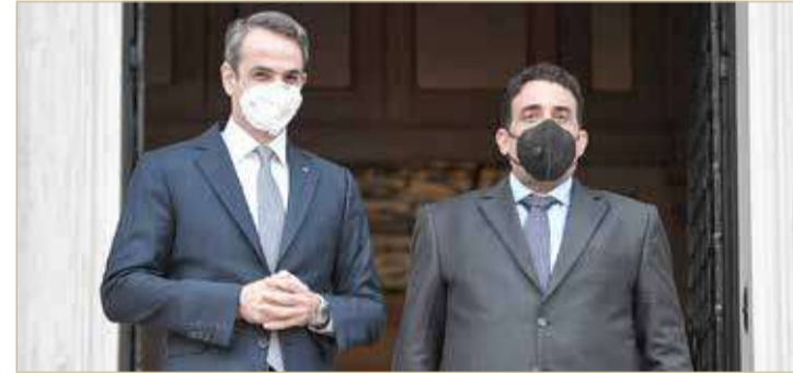
محمد المنفي مع ميتسوتاكيس قبيل اجتماعهما في أثينا

◆ أكد من أننا بذل كل الجهود الممكنة لضمان سيادة واستقلال بلاده