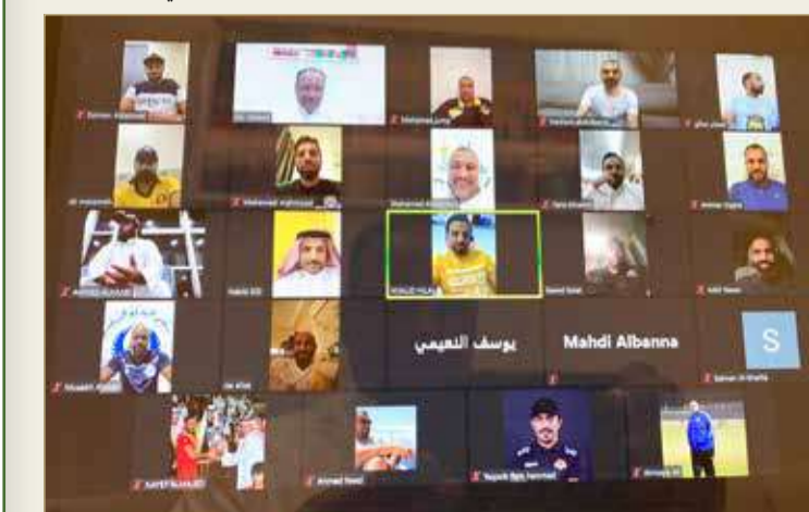
جانب من الدورة