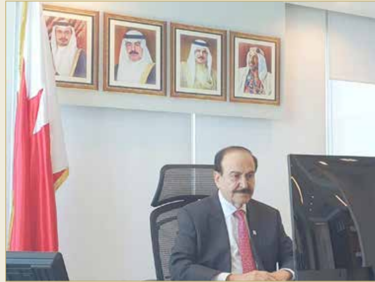
رئيس هيئة الطاقة المستدامة