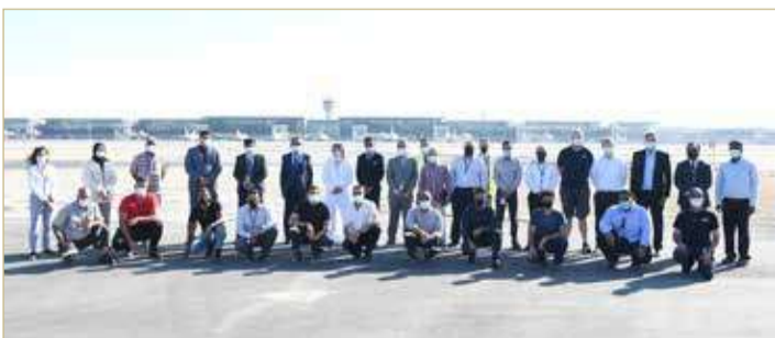
صورة جماعية للفريق مع الإدارة التنفيذية

أهمية إزالتها من المدرج في أسرع وقت ممكن