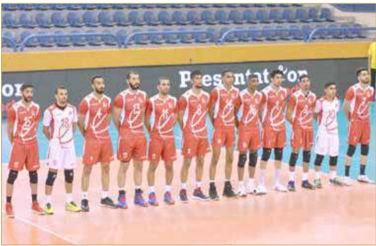
منتخبنا الوطني لكرة الطائرة