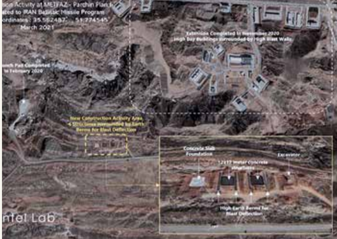
مجمع بارشين النووي