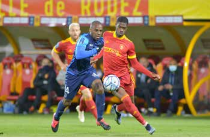
من مباريات النادي

◆ بشعار "فيكتوريوس البحرين" وبعد التمسك بالمنافسة على الصعود