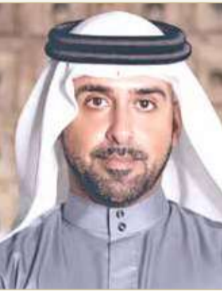
الشيخ عبد العزيز بن دعيج آل خليفة

التعاون مع 200 مكتب عائلي لاختيار رواد الصناعة بالقطاع