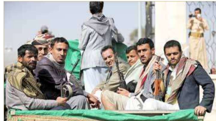
عناصر من ميليشيات الحوثي