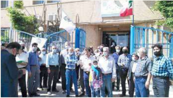
المسيرات الاحتجاجية للعمال المتقاعدين عمّت مختلف المدن

أدى ذلك، بعد أن اتهمت مؤسسة بحثية أميركية إيران في أغسطس 2015 بتطهير مجمع "بارشين" العسكري. وكشف "معهد العلوم والأمن الدولي"، ومقره واشنطن، صورا التقطت بالأقمار الصناعية تبين مركبات وأجساماً مثل الحاويات يجري نقلها من "بارشين".