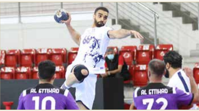
من مباراة النجمة والاتحاد