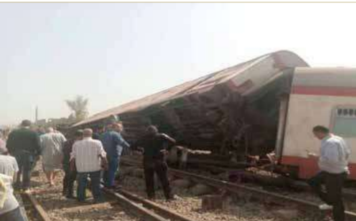
الصحبة المصرية تدفع بـ 58 سيارة إسعاف لإنقاذ ضحايا