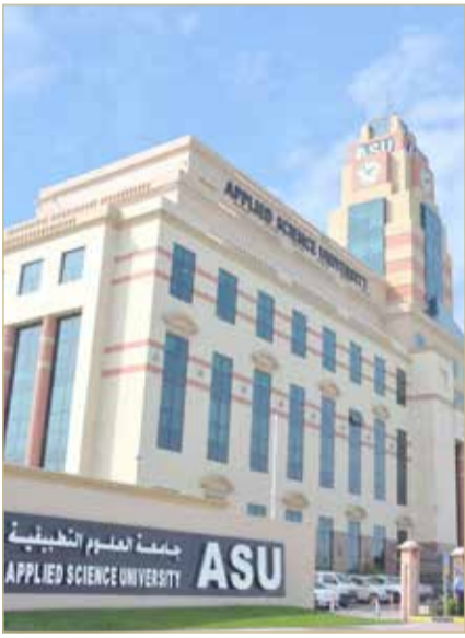
المعمقة التي من شأنها أن تخدمهم في سوق العمل على الصعيد المحلي والإقليمي.

توجهه النوعي في برنامج الدكتوراه، كما تقدم برنامج ماجستير متخصص في القانون التجاري يتناول فيه الطالب المواد ذات العلاقة بالتخصص من حيث الجانب المحلي والدولي والشركات التجارية وقوانين البورصة والتحكيم التجاري مما سيساعده مستقبلا في معرفة كافة القضايا القانونية في المجال التجاري وإظهار معرفة متخصصة بالقواعد القانونية ذات الصلة على مستوى محلي وإقليمي ودولي، حيث بإمكان الطلبة الذين يمتلكون شهادات بكالوريوس في حقوق ذات علاقة مثل إدارة الأعمال والاقتصاد دراسة التخصص لتنمية معارفهم في الأمور القانونية المتعلقة بأنظمة الشركات والقوانين التي