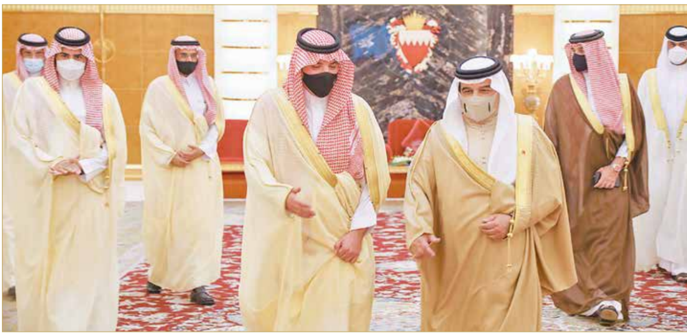
جلالة الملك مستقبلاً وزير الداخلية السعودي

المنامة - بنا أكد عاهل البلاد صاحب الجلالة الملك حمد بن عيسى آل خليفة، اعتزازه بالعلاقات الأخوية التاريخية الراسخة التي تجمع مملكة البحرين والمملكة العربية السعودية وقيادتهما وشعبهما الشقيقين، مثنياً جلالته المواقف المشرفة للمملكة العربية السعودية الشقيقة بقيادة خادم الحرمين الشريفين، الداعمة لمملكة البحرين، والتي تأتي تجسيداً للروابط التاريخية القائمة على مبادئ الأخوة والتضامن الوثيق بين البلدين الشقيقين على مر التاريخ. جاء ذلك خلال استقبال جلالة الملك في قصر الصخير، أمس، وزير الداخلية بالمملكة العربية السعودية صاحب السمو الملكي الأمير عبد العزيز بن سعود بن نايف بن عبد العزيز آل سعود بمناسبة زيارته للبلاد. وأشاد جلالة الملك بالجهود الطبية لأخيه عاهل المملكة العربية السعودية الشقيقة خادم الحرمين الشريفين الملك سلمان بن عبد العزيز آل سعود في توثيق أواصر العلاقات البحرينية السعودية، وبالذور الريادي للمملكة العربية السعودية الشقيقة في ترسيخ دعائم الأمن والاستقرار والسلام في المنطقة والحفاظ على مصالح ومقدرات دولها وشعبها. وجرى بحث الأوضاع الراهنة في المنطقة والمستجدات الإقليمية بالإضافة إلى القضايا ذات الاهتمام المشترك. (02)