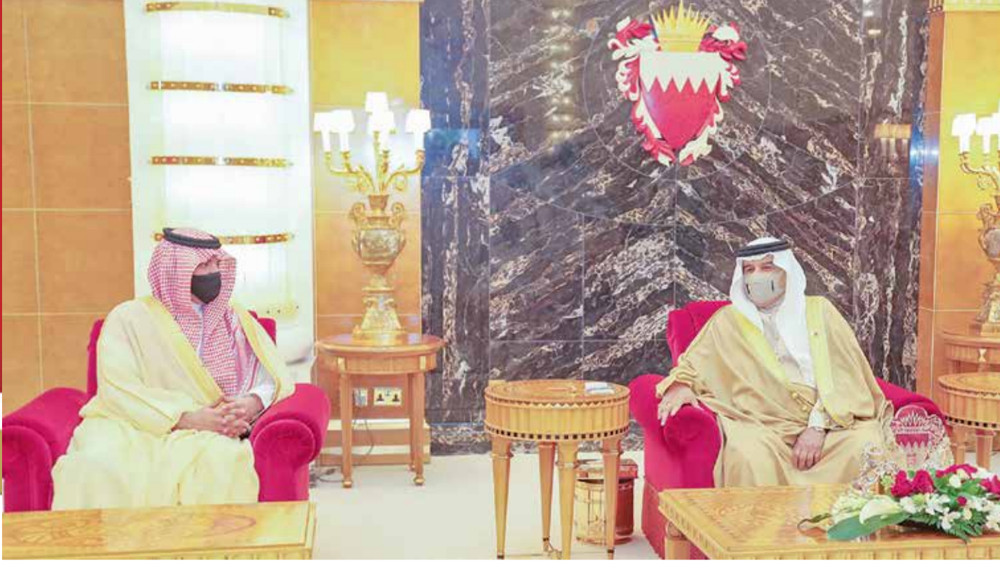
جلالة الملك مستقبلا وزير الداخلية السعودي