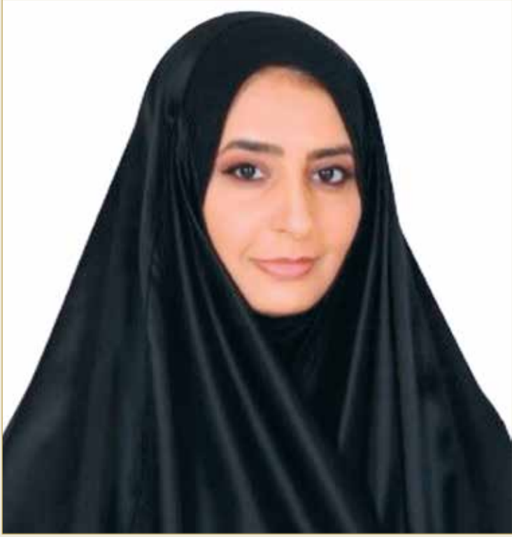
سمو الشيخة زين بنت خالد

سمو الشيخة زين لـ "البلاد": الأمير الراحل مثلنا الأعلى في خدمة المواطنين