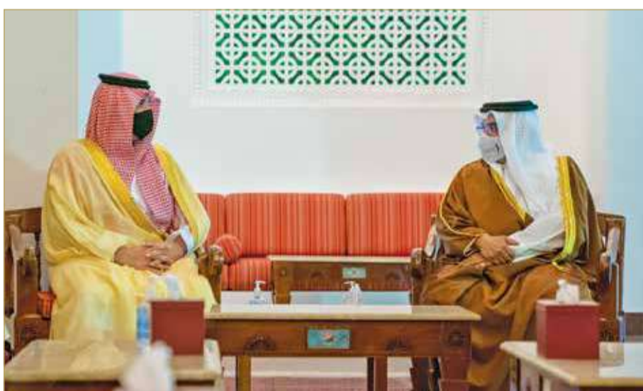
سمو ولي العهد رئيس مجلس الوزراء مستقبلا وزير الداخلية السعودي

◆ سمو ولي العهد رئيس الوزراء: ما يمس الشقيقة الكبرى يمس البحرين