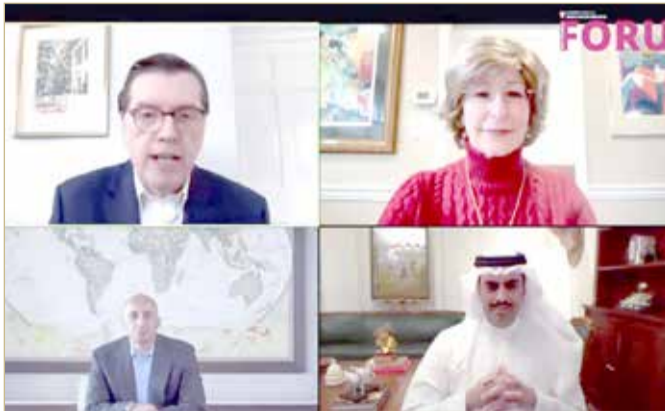
المنامة - بنا

التاريخية المهمة والشجاعة للتوقيع على إعلان مبادئ إبراهيم مع دولة إسرائيل، وأن العلاقات الثنائية بين مملكة البحرين ودولة إسرائيل والتي تشهد تعاوناً في مختلف المجالات الاقتصادية والبيئية والتقنية أدت أيضاً إلى تطور اجتماعي إقليمي مهم وبشأن عملية السلام في الشرق الأوسط، أوضح السفير أن حكومة مملكة البحرين لا تزال ملتزمة بمبادرة السلام العربية وحل الدولتين المؤدي إلى قيام دولة فلسطينية مستقلة عاصمتها القدس الشرقية، وأن الخطوة التاريخية التي اتخذتها مملكة البحرين إنما تقرب المنطقة إلى تحقيق السلام العادل والشامل.