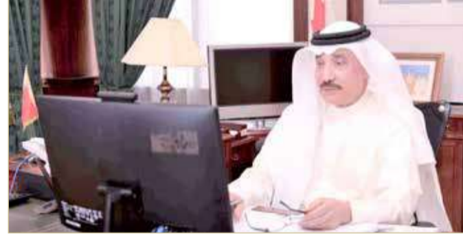
ضاحية السيف - هيئة تنظيم سوق العمل

استقبل وزير الإعلام علي الرميحي في مكتبه سفير مملكة البحرين لدى الولايات المتحدة الأميركية الشيخ عبدالله بن راشد آل خليفة. وقد ركب وزير الإعلام بالشيخ عبدالله بن راشد آل خليفة، مشيداً بالجهود الطيبة التي