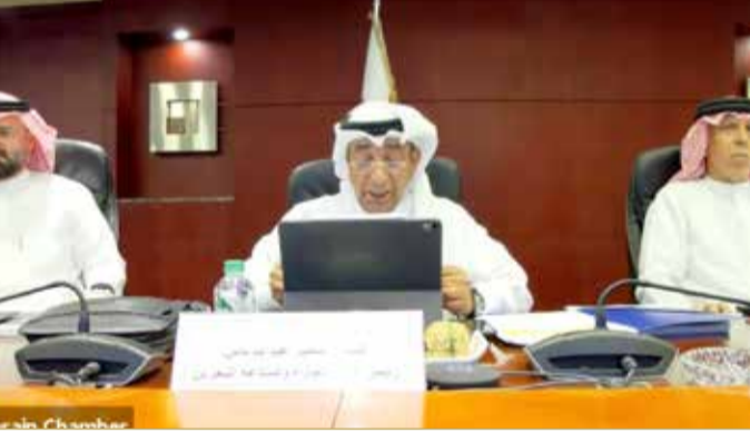
ناس مترسدا اجتماع "عمومية" الغرفة

الحالية لمجلس إدارة الغرفة أهمها: تمكين القطاع الخاص البحريني من تجاوز الآثار السلبية التي خلفتها جائحة كورونا، كذلك نجاح الغرفة في تعزيز الدور الفاعل لمركز الدراسات والبحوث مع المساهمة في سن التشريعات والقوانين المتوائمة مع متطلبات الصالح العام، فضلاً عن استعراض ما تحقق من إنجازات ونجاحات على كافة المستويات وفي مختلف القطاعات. وأقرت الجمعية العمومية الوضع المالي وتقدير مدقق الحسابات الخارجي عن السنة المالية 2020، الذي أكد فيه مدقق الحسابات الخارجي أن البيانات المالية للغرفة تعرض بصورة عادلة من كافة النواحي الجوهرية.