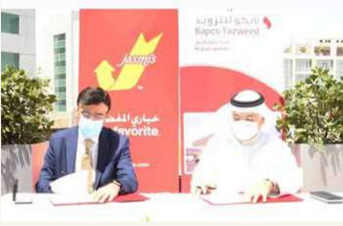
أثناء توقيع اتفاقات التعاون

◆ لافتتاح 3 فروع لمطاعم المأكولات السريعة بمحطات الوقود