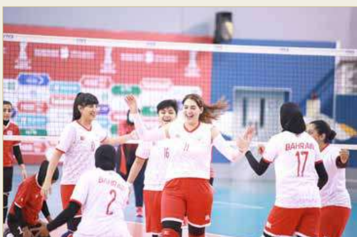
نجاح كبير لدوري سيدات الطائرة

البحرين الرياضية والتي كان لها أثر معنوي كبير لدى اللاعبات مثمنا جهود اتحاد الكرة الطائرة والقناة الرياضية.