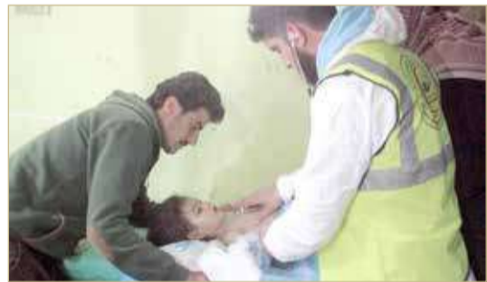
طفل سوري فاقد للوعي يتلقى العلاج بمستشفى في خان شيخون في أعقاب هجوم بالغاز السام

◆ منظمة حظر الأسلحة الكيميائية تصوت لتعليق حقوق سوريا