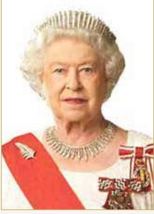
جلالة الملكة إليزابيث الثانية