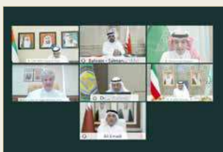
وزير المالية والاقتصاد الوطني يترأس الاجتماع

الخاصة بإيجاد تعريف موحد للمنتج الوطني (الخليجي) ووضع مشروع قواعد منشأ خليجية موحدة في إطار الاتحاد الجمركي لدول المجلس، ومبادرات مجموعة العشرين G20 في المسار المالي. كما تم بحث دعم آليات تنفيذ قرارات العمل المالي والاقتصادي المشترك ومتابعة سير برنامج الوحدة الاقتصادية بين دول مجلس التعاون لدول الخليج العربية، كما اعتمدت اللجنة توصيات وقرارات محاضر اللجان ذات العلاقة والتي أهمها هيئة الاتحاد الجمركي لدول المجلس، ولجنة رؤساء ومدراء الإدارات الضريبية بدول المجلس ولجنة السوق الخليجية المشتركة.