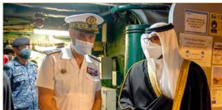
شارل ديغول، وقد نقل سموه وتحيات وتقدير عاهل البلاد القائد الأعلى صاحب الجلالة بحري مارك اوسيدات قائد حاملة الطائرات

أكد سمو الشيخ عيسى بن سلمان بن حمد آل خليفة على ما يربط مملكة البحرين والجمهورية الفرنسية الصديقة من علاقات ثنائية وصلت لمستويات متميزة في مختلف المجالات، منوهاً سموه بأهمية الدفع بمسار التعاون المشترك نحو آفاق أرحب بما يحقق التطلعات المنشودة للبلدين والشعبين الصديقين.