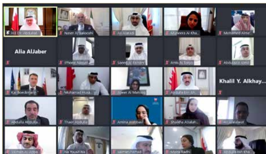
وزير الخارجية يبدشن برنامج (مجالس الأكاديمية)

نفتخر باحتضانهم بيننا في المملكة. وأعرب وزير الخارجية عن إعجابه بتسمية هذا البرنامج بالمجالس، لأن المجالس في مملكة البحرين جزء لا يتجزأ من إرثنا الحضاري العريق، وتمثيل واقعي لترباط جميع أفراد المجتمع، وتجسيد لوحدة الوطنية، مؤكداً أن مجالس البحرينيين، وبيوتهم، وقلوبهم كذلك، كانت على الدوام مفتوحة للقریب والبعيد، والصغير والكبير، بدءاً من مجالس القيادة الرشيدة، وامتداداً إلى مجالسنا الشعبية والأسرية. وأعرب وزير الخارجية عن اعتزازه بتدشين مجالس الأكاديمية في وزارة الخارجية، التي سوف تمثل كنزاً من الخبرات والتجارب العريقة، لنخبة من السفراء، تنطلق في وزارة الخارجية للقائهم والسماع منهم ومحاورتهم وتسيب الضوء على تجاربهم، مؤكداً أن هذه المبادرة المحمودة،