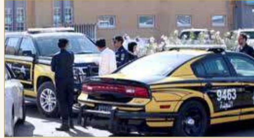
عناصر من الشرطة الكويتية

كشفت وسائل إعلام كويتية تفاصيل الجريمة التي هزت الشارع الكويتي، بعد إلقاء القبض على المتهم الذي أقدم على قتل مواطنة بطعنة قاتلة في الصدر بعد أن اختطفها بسيارتها من منطقة "صباح السالم"، بعدما أجبرها على التوقف بصدمها عمداً. وأشارت صحيفة "الأبناء" الكويتية إلى تلقي عمليات وزارة الداخلية الكويتية، عصر الثلاثاء، بلاغا من مواطنة قالت فيه إن شقيقتها اختطفت برفقة طفلتين بسيارتها من منطقة صباح السالم. ونقلت الصحيفة عن مصدر أمني قوله "على الفور انتقل رجال الأمن، وتبين أن الجاني ترك سيارته من نوع وانبث أسود، وهرب بسيارة المجني عليها". وأضاف المصدر "تم تعميم أوصاف المركبة التي تعود للمجني عليها، وتم تحديد هوية الجاني من خلال مركبته الوانيت والتواصل معه هاتفياً، حيث حاول تمويه رجال الأمن بأنه موجود في منطقة جنوب السرة". وتابع قائلاً "فيما عملية البحث جارية، تلقت عمليات الداخلية بلاغا من إدارة مستشفى العبدان بوصول مواطنة في العقد الثالث مصابة بطعنة في الصدر، وأنها لفظت أنفاسها الأخيرة بفعل غزارة الدماء التي زفتها". وبحسب المصدر فقد "تمت الاستعانة بكاميرات المراقبة والتي حددت المركبة التي كان يستقلها الجاني، وتبين أنها