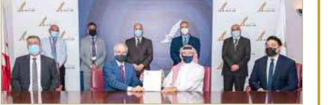
المحرق - طيران الخليج

أكملت “طيران الخليج”، للمرة الأولى في تاريخ الناقل الوطنية للبحرين، بنجاح أول تدريب افتراضي للكوارث عن بعد لضمان استمرارية العمل، والذي شمل معظم الوظائف الأكثر أهمية لتقييم استعداد الناقل لمواصلة عملياتها خلال الحالات الكارثية أو غير المتوقعة. وتم تنفيذ التدريب على عمليات الناقل الفعلية في الشهر الماضي عن طريق العمل من المنزل. وتولت فرق الطوارئ السيطرة الكاملة على عمليات المقر الرئيسي لفترة التدريب وبشرت جميع تلك العمليات عن بعد أثناء تواجدها في المنزل. وكان الهدف الرئيس من هذا التدريب هو تحديد ما إذا كان الهدف المحدد مسبقاً لوقت الاسترداد (RTO) - الفترة الزمنية المستغرقة لاستئناف العمل) لكل وظيفة من وظائف العمليات قد تم استيفائه، وكذلك تقييم إجراءات خطة الاسترداد وجاهزية أعضاء الفريق للتعامل مع الكوارث الكبرى.