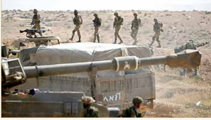
مناورات عسكرية إسرائيلية

فشلت في العثور عليهم. وذكر ستام وكيل، نائب مدير برنامج الشرق الأوسط وشمال أفريقيا في معهد "تشاتام هاوس" للشؤون الدولية، أن قدرة الإسرائيليين بفعالية على ضرب إيران في الداخل بهذه الطريقة الفجة أمر محرج للغاية ويظهر ضعفا وارتباك داخل إيران. وأفاد الموقع العبري بأن "الخطة التي سيتم التدرب عليها بالاشتراك بين قوات القيادة المركزية والوحدات الموسعة التي تتمركز أمام قطاع غزة وجنوب لبنان، تهدف إلى حماية السكان من خطرين مركزيين، وهما رشقات الصواريخ الثقيلة الوزن، التي لم تتعرف عليها إسرائيل بعد، وعناصر قوات الرضوان في لبنان وقوات النكبة في غزة الذين سيجاولون التسلسل إلى البلدات الإسرائيلية المتاخمة للحدود".