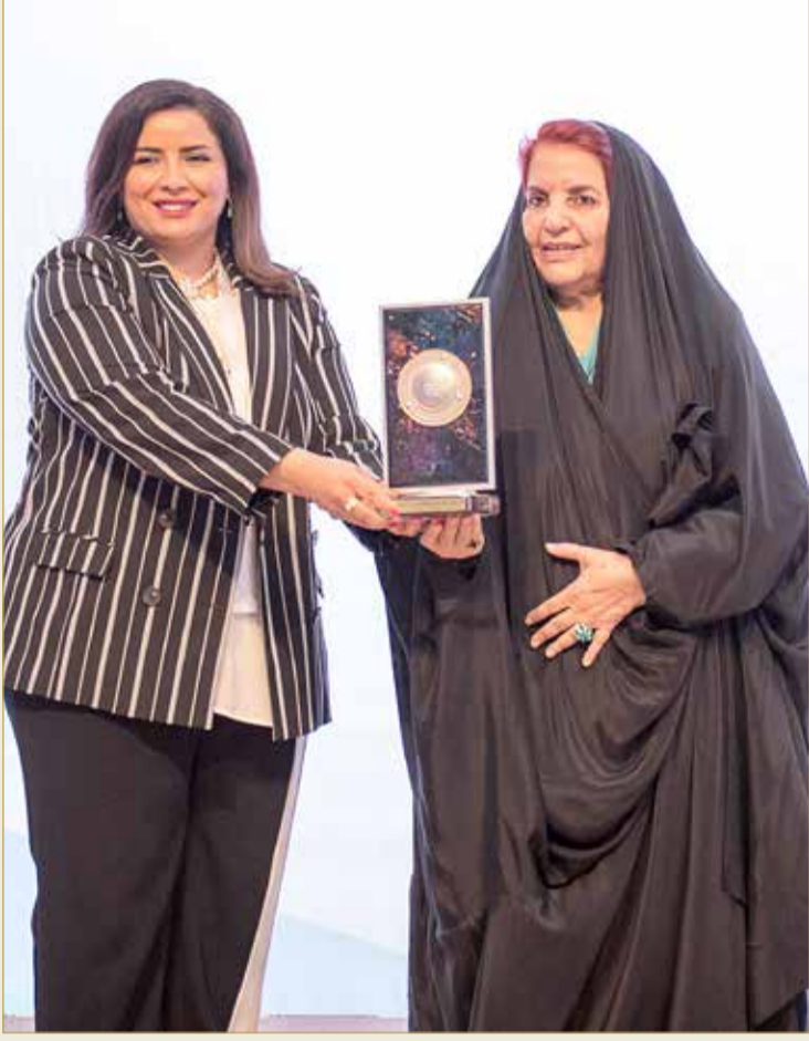
سمو الأميرة سبيكة بنت إبراهيم لدى تكريم الفرق الفائزة بالهاكثون (أرشيفية)

ويتبنى المجلس الأعلى للمرأة لجنة نوعية تحت مسمى "المرأة في مجال التكنولوجيا المالية"، تهدف إلى دعم حضور المرأة البحرينية في مجالات علوم المستقبل والتي تندرج التكنولوجيا المالية في إطارها، وتختص باقتراح السياسات العامة المتعلقة بتشجيع ورفع تنافسية