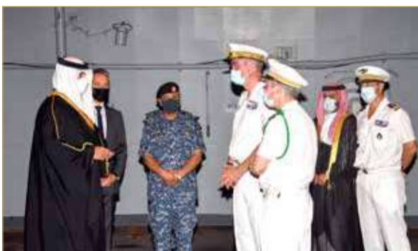
الملك حمد بن عيسى آل خليفة وولي العهد نائب القائد الأعلى رئيس مجلس الوزراء

واستمع سموه إلى إيجاز عن مهمة حاملة الطائرات الفرنسية في المنطقة وطبيعة عملها، كما قام سموه بجوله تفقدية على متن حاملة الطائرات.