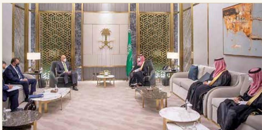
من اجتماع ولي العهد السعودي ووزير خارجية اليونان، واس

الكفيلة بدعمه وتطويره، إلى جانب بحث الأوضاع الإقليمية الراهنة والجهود المبذولة بشأنها.