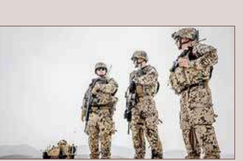
برلين. أ ف ب

تعترزم ألمانيا سحب قواتها المنتشرة في أفغانستان اعتبارا من الرابع من يوليو، على ما أعلن المتحدث باسم وزارة الدفاع، فيما تسحب واشنطن قواتها من هذا البلد بحلول 11 سبتمبر. وقال المتحدث "في الوقت الحاضر، تسير المداولات الجارية (...) في اتجاه تقصير فترة الانسحاب، ويتم طرح تاريخ للانسحاب في الرابع من يوليو" مشيراً إلى أن القرار الأخير يعود للحلف الأطلسي. وأعلنت دول الحلف الأطلسي أمس الأربعاء أنها قرّرت المباشرة بسحب قواتها المنتشرة في إطار مهمة التحالف في أفغانستان بحلول الأول من مايو على أن تنجز ذلك "في غضون بضعة أشهر". وقال المتحدث باسم وزارة الدفاع الألمانية "لدينا الآن مهمة لوجستية صعبة أمامنا (...) لكننا كنا مستعدين لهذا الاحتمال". والدول الأكثر انخراطا في أفغانستان هي الولايات المتحدة وألمانيا وتركيا والمملكة المتحدة وإيطاليا. ونشرت هذه الدول الخمس 6 آلاف عسكري من أصل 9592 عسكريا من 36 بلدا أعضاء في الحلف وشركاء له على غرار أوكرانيا (10 عسكريين) في إطار مهمة "الدعم الحازم".