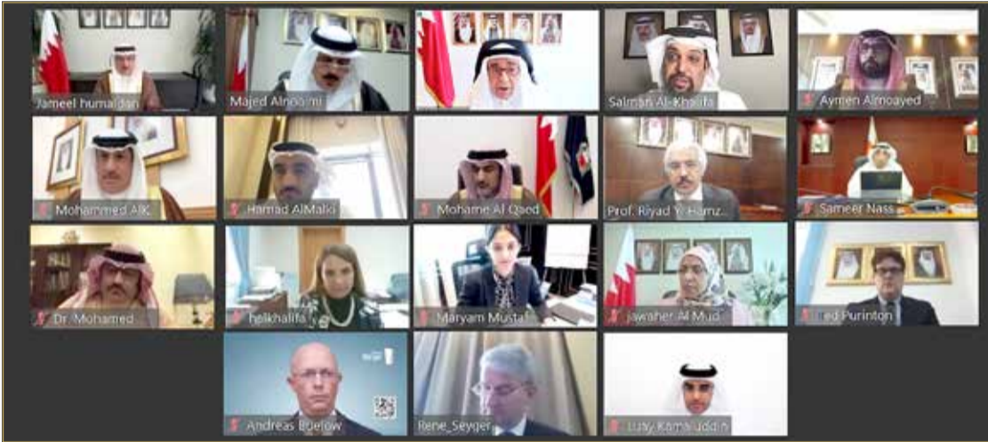
سمو الشيخ محمد بن مبارك آل خليفة يترأس اجتماع المجلس الأعلى لتطوير التعليم والتدريب

وفي ختام الاجتماع، شكر سمو الشيخ محمد بن مبارك آل خليفة أعضاء المجلس وجميع العاملين في مشاريع تطوير التعليم والتدريب على ما يبذونه من التزام ومتابعة وتنفيذ المشاريع والبرامج والمبادرات التعليمية والتدريبية، متمنياً للجميع التوفيق والنجاح.