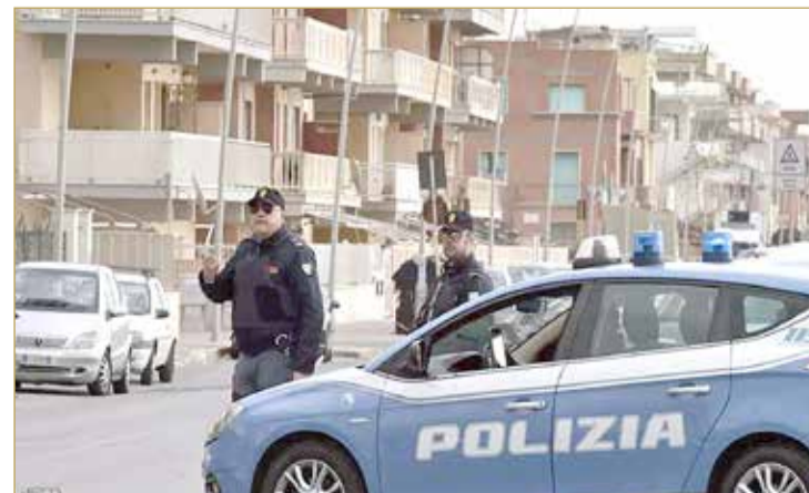
عناصر من الشرطة الإيطالية

وتشمل التهم الموجهة إلى الموظف؛ إساءة استخدام المنصب، إضافة إلى ممارسة التزوير والابتزاز، بينما يجري التحقيق مع 6 مسؤولين