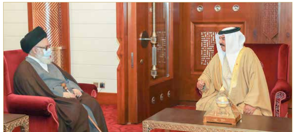
جلالة الملك مستقبلاً سماحة السيد عبدالله الغريفي

المنامة- بنا أعرب عاهل البلاد صاحب الجلالة الملك حمد بن عيسى آل خليفة عن تقديره للدور السامي لعلماء الدين الأفاضل في مد جسور التعايش وتأكيد القيم الإنسانية المشتركة والاعتدال بالإضافة لدورهم النبيل في خدمة الدين الإسلامي الحنيف ونشر تعاليمه السحاء والتوعية بثوابته القائمة على الاعتدال