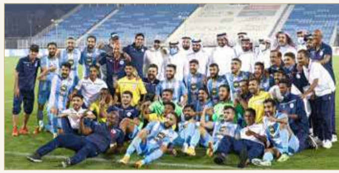
فرقة رفاعية بحسم لقب الدوري

تخطى الحد بهدفين.. والمحرق يكسب الأهلي في "الكلاسيكو"