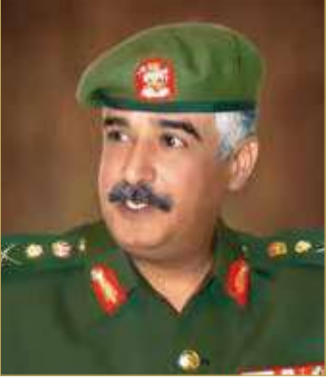
سمو الشيخ محمد بن عيسى

هنأ رئيس الحرس الوطني الفريق أول الركن سمو الشيخ محمد بن عيسى آل خليفة، رئيس مجلس إدارة نادي الرفاع الشيخ عبدالله بن خالد آل خليفة وجميع لاعبي الفريق والجهات الإدارية والفنية بمناسبة الفوز بلقب دوري ناصر الرياضي 2020 - 2021، وذلك بعد فوزه على فريق نادي الحد في المباراة النهائية.