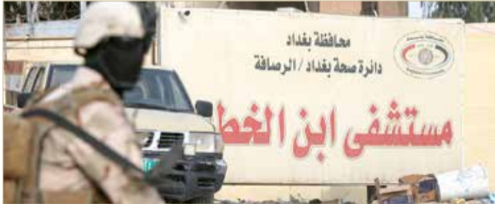
عناصر من قوات الأمن العراقية عند بوابة مستشفى ابن الخطيب