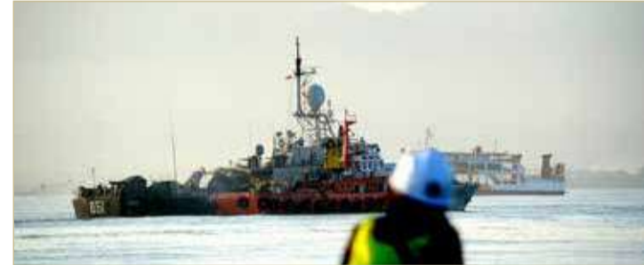
سفينة تابعة للبحرية الإندونيسية خلال عمليات البحث عن الغواصة قبالة سواحل بالي

احتياطات الأوكسجين التي كان يملكها أفراد الطاقم في حال حصول عطل كهربائي، تكفي لمدة 72 ساعة وتم تجاوز هذه المهلة فجر السبت، ما جعل من بقائهم على قيد الحياة أمراً غير مرجح.