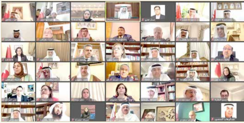
صورة جماعية لأعضاء مجلس الشورى

30 ألف نوع من الحيوانات والنباتات مهددة بالانقراض