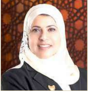
الرئيس التنفيذي لهيئة الجودة

بمشاركة 48 أكاديميا ودبلوماسيا وتاجرا واقتصاديا وقياديا بجمعيات أهلية