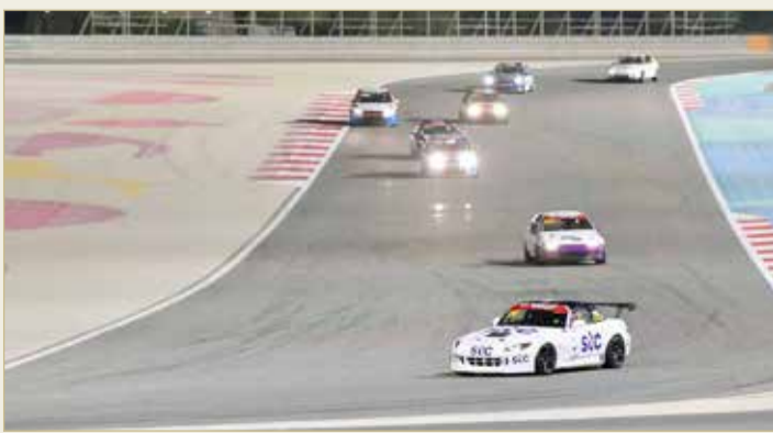
من منافسات البطولة

حلبة البحرين الدولية ورجالها التي هيأت كل الظروف من أجل إقامة السباقات على أكمل وجه. ووجه الشيخ عبدالله بن عيسى آل خليفة إلى جميع من ساهم في تحقيق النجاح في هذه البطولة المحلية المميزة، مؤكداً أن اتحاد السيارات حريص على توفير جميع الإمكانيات لتميز هذه البطولة وتسخيرها خدمة المتسابقين، متمنياً التوفيق للجميع في الموسم القادم.