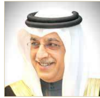
سلمان بن إبراهيم

المنامة - الأمانة العامة للمجلس الأعلى للشباب والرياضة