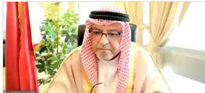
وزير العدل والشؤون الإسلامية والأوقاف

المحكمة لم تُفسط طعنه حقه". وحول حرمان المدعي من بعض المبادئ المستقر عليها في محكمة التمييز، ذكر وزير العدل بأن غرفة المشورة تؤكد المبادئ المستقر عليها، ولا داع لإصدار مبدأ جديد، إذ أن الموضوع يتعلق يتم النظر إلى موضوع محكمة النقد الفرنسية، وأن محكمة النقد الفرنسية تأخذ بمبدأ الجدارة وكل المحامون في فرنسا مقيدون أمام محكمة الاستئناف العليا ومن تجد المحكمة فيه الجدارة أن يكون محامياً، ليكتب مذكرة الطعن في التمييز، هي التي تقوم بإعطاء ترخيص لكي يكون مجازاً أمام محكمة التمييز، والنتيجة إذا كانت طعون المحامي ليست على القدر الصحيح من الجدارة يلغى تصريحه.