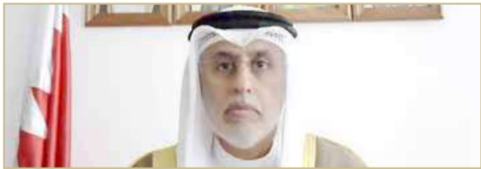
وزير التجارة والصناعة والسياحة