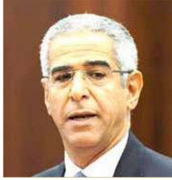
النائب الأول لرئيس النواب