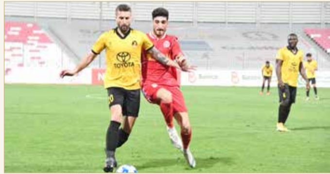
من لقاء المحرق والأهلي