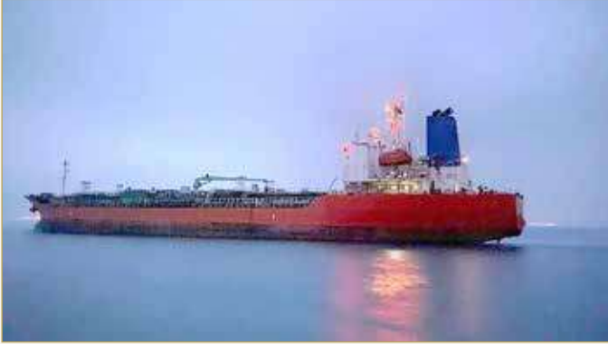
السفن الإيرانية تعيش على وقع استهدافات متوالية

يأتي التهديد غداة احتراق خزان وقود ضمن ناقلة نفط إيرانية مقابل مدينة بانياس على الساحل السوري. ويفرض الاتحاد الأوروبي منذ سنوات