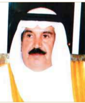
دعيج بن سلمان

هنأ الشيخ دعيج بن سلمان آل خليفة نائب رئيس المجلس الأعلى للشباب والرياضة، مجلس إدارة نادي الرفاع برئاسة الشيخ عبدالله بن خالد آل خليفة وجماهيره وكافة منتسبيه، بعد تحقيق الفريق الأول لكرة القدم لقب دوري ناصر بن حمد الممتاز، وذلك للمرة 13 في تاريخ النادي.