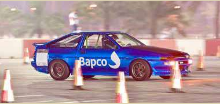
جانب من منافسات السباق

المتسابقون على موعد مع رابع الجولات نهاية هذا الأسبوع