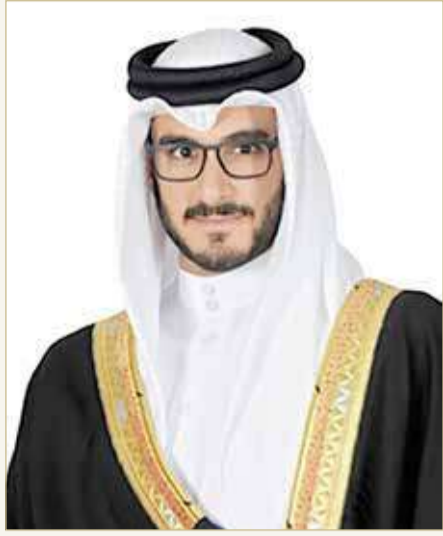
سمو الشيخ عيسى بن سلمان

عيسى بن سلمان: نتطلع لفرصة تعاون وتوحيد الجهود