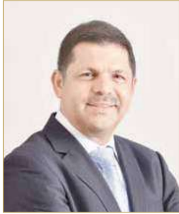
عبد الرحمن سيف

وقال الرئيس التنفيذي للمجموعة، عبدالرحمن سيف -لقد استمرت التحديات التي تفرزها الجائحة في تأثيرها سلبيًا على مختلف القطاعات الاقتصادية، بما في ذلك القطاع المصرفي. ولكن في بنك البحرين والكويت قمنا بتبني العديد من التدابير الصارمة لتعزيز فاعلية الأداء والتكيف مع التحديات الجديدة، مع التركيز على الاستدامة طويلة الأجل لمجموعتنا، وفي الوقت نفسه ركزنا على دعم موظفينا وعملائنا والمجتمعات التي نعمل فيها للتخفيف من حدة التأثير السلبي للجائحة. وبسبب تلك الإجراءات التي اتخذناها بجانب ضبط التكلفة والتحكم في المخاطر وإدارة علاقات العملاء الاستثنائية تمكننا من الاستمرار في تحقيق عوائد جيدة لمساهميننا والحفاظ على مركز رأس المال والسيولة القوي الذي يمكننا من مواصلة دعم عملائنا.