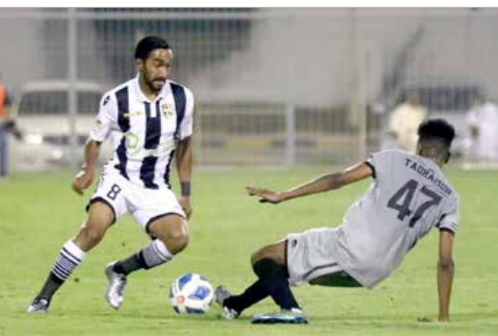
من مباراة الخالدية والتضامن

الاتحاد يتخطى الشباب في افتتاح الجولة 16 لدوري "الثانية"