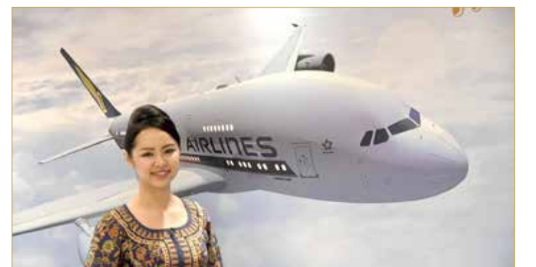
تأتي فقاعة السفر الجوي في الوقت الذي تسعى فيه سنغافورة وهونغ كونغ لتعزيز السياحة وسط تفشي الوباء، الذي أدى إلى إغلاق العديد من البلدان للحدود وتراجع حركة النقل الجوي.

بعد أشهر من تأجيل ترتيبات أولية تسمح للساحين بالسفر بين المدينتين دون الحاجة للخضوع لحجر صحي، تعززت هونغ كونغ وسنغافورة إطلاق "فقاعة سفر جوي" في مايو المقبل. ومن المقرر أن تبدأ الرحلات الجوية اعتبارا من 26 مايو. لن يضطر الزوار للخضوع للحجر الصحي طالما أنهم