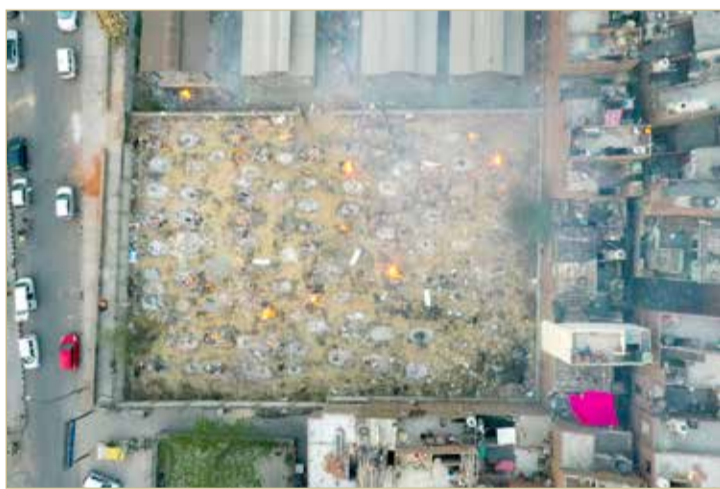
صورة جوية لساحة حرق الجثث في نيودلهي

الدعم للهند التي يعزى إليها الارتفاع في عدد الإصابات على مستوى العالم في الأيام الأخيرة، إذ سجلت وحدها