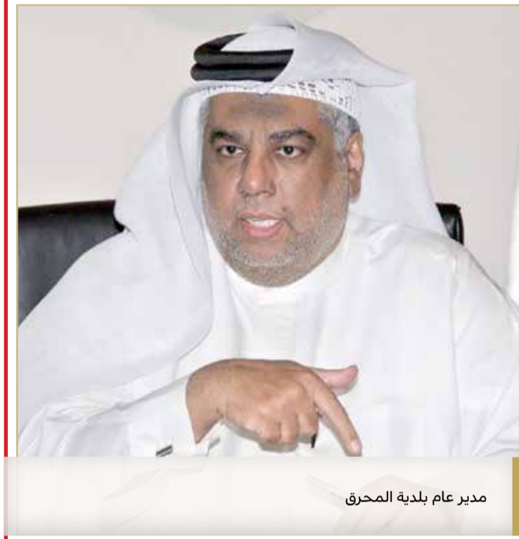
مدير عام بلدية المحرق

وقال رئيس مجلس بلدي المحرق غازي المرابطي إنه تم تعديل المدخل والمخرج للمنطقة المذكورة، إلا أن المخزن الخاص بالشركة لا يزال يتسبب بحدوث الاختناقات المرورية، بسبب تحميل وتنزيل البضائع في الشارع نفسه، وليس بالمواقف التابعة للأسواق