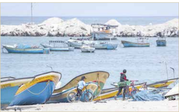
قوارب الصيد الساحلية في ميناء مدينة غزة