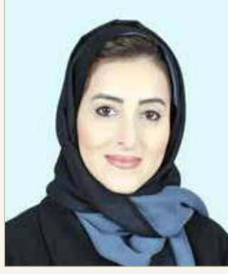
ياسمين ال شرف

التي تفي بالشروط، وستتم دعوة المبتكرين لتقديم حلولهم أمام لجنة من الخبراء. ثم تقوم لجنة تحكيم مؤلفة من مديرين تنفيذيين من جميع المؤسسات المشاركة، إضافة إلى عدد من الخبراء في هذا المجال، بإعلان المرشحين للتصفيات النهائية في 3 يونيو 2021، حيث ينتهي التحدي في 10 يونيو 2021. وقالت رئيس وحدة التكنولوجيا المالية والابتكار بمصرف البحرين المركزي، ياسمين آل شرف “يسعدنا الإعلان عن انطلاق سلسلة تحديات البحرين سوبرنوبا على منصتنا الرقمية FinHub 973. فقد أدت جائحة كوفيد-19 إلى تسريع عملية تبني التغييرات التقنية وزيادة وتيرة التقدم في جميع أنحاء الحياة، وفي ظل التزايد المتسارع في تبني التكنولوجيا، تشتد الحاجة إلى تطوير الخدمات المالية بما يتناسب مع احتياجات العملاء مع تغيير بيئة العمل.” وأضافت “لا شك أن التقنيات الحديثة، كالذكاء الاصطناعي والبيانات الضخمة والخدمات السحابية، تؤثر على الاقتصادات في جميع أنحاء العالم بوتيرة غير