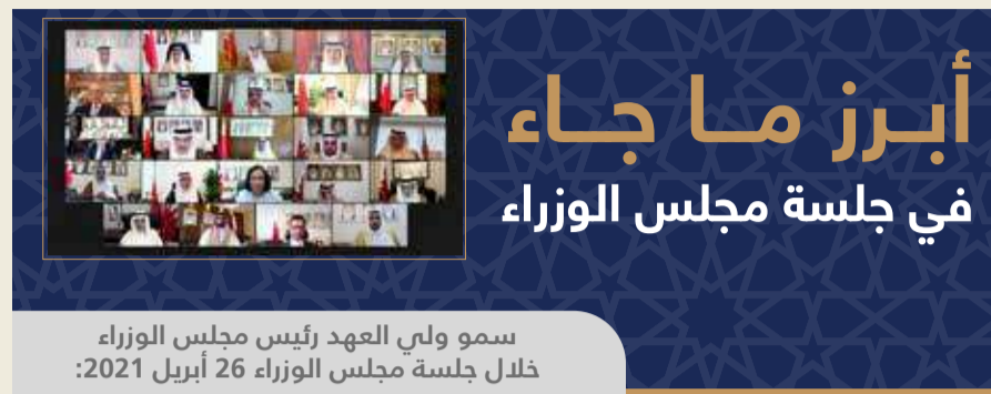
سمو ولي العهد رئيس مجلس الوزراء خلال جلسة مجلس الوزراء 26 أبريل 2021:

مجلس الوزراء: تكاملية العمل مع السلطة التشريعية التي لها كل الاحترام والتقدير