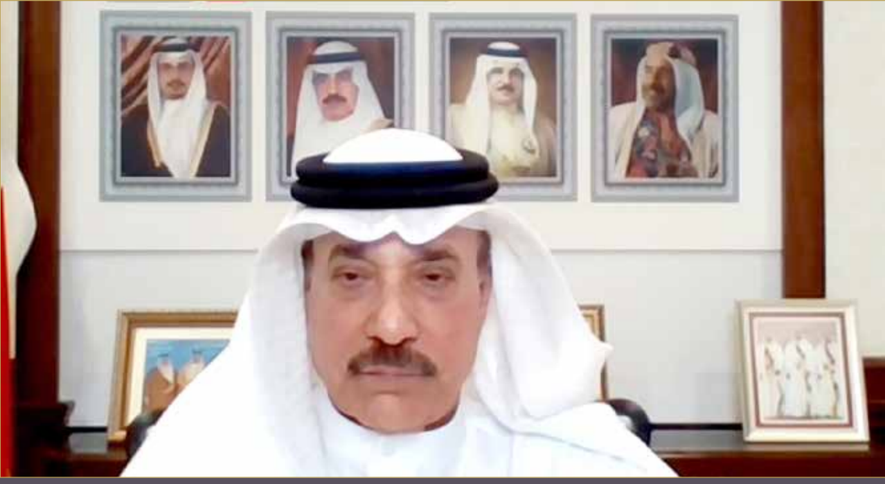
وزير العمل والتنمية الاجتماعية مشاركا بالفعالية