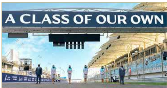
المحرق - طيران الخليج

متماشياً مع استراتيجية الناقل التحولية والرقمية الجديدة