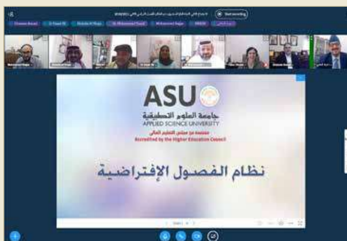
نظام الفصول الافتراضية

مواصلته تعليمهم... إنزفعتت من قيمة الدعم الذي يقدمه الصندوق للطلبة، كما جعلت باب التقديم فصيلاً بعدما كان سنوياً. وصرح رئيس الجامعة إلى أن اللجنة وافقت على تقديم الدعم في الفصل الثاني 2020 - 2021، إلى 143 طالب وطالبة، و102 طالب وطالبة في الفصل الدراسي الأول 2020 - 2021، موضحة أن هذه الإجراءات تأتي انسجاماً مع مسؤولية الجامعة المجتمعية والوطنية، ولتستشعاراً للواقع الذي يشهده العالم، وأثره الاقتصادي على