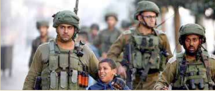
انتهاكات جسيمة ترتكب ضد الفلسطينيين

تنتج سياسة "الفصل العنصري" و"الاضطهاد" بحق الفلسطينيين