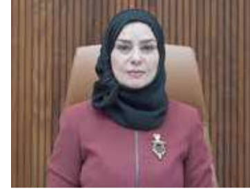
رئيسة مجلس النواب

دعم كل مسارات التعاون والتكامل مع مجلس النواب.