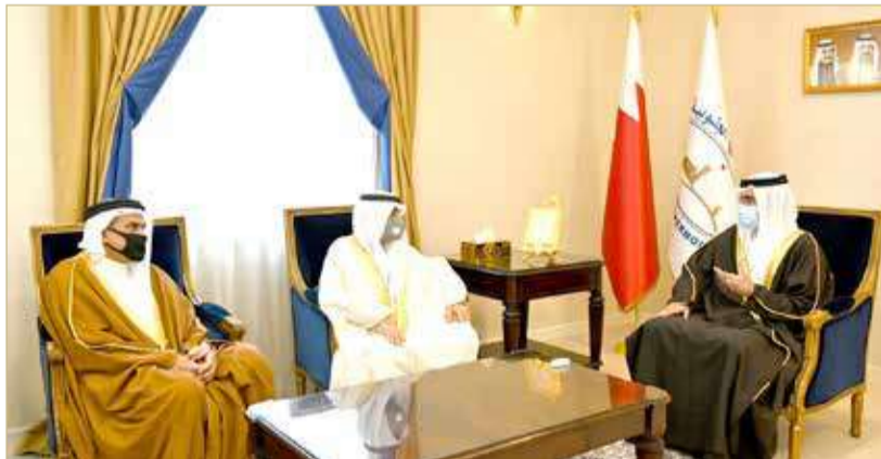
سمو محافظ الجنوبية يستقبل رئيس مجلس إدارة جمعية البحرين لرعاية الوالدين وينسلم إصدارها (وبالوالدين إحسانا)

حضر الاجتماع عن وزارة الخارجية سفير مملكة البحرين في واشنطن الشيخ عبدالله بن راشد آل خليفة، وكيل وزارة الخارجية للشؤون السياسية الشيخ عبدالله بن أحمد آل خليفة، ورئيس قطاع شؤون الأميركيين بالوزارة الشيخ عبدالله بن علي آل خليفة.