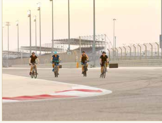
جانب من الفعاليات

◆ تنطلق غدًا برعاية "بتلكو" على مضمار حلبة البحرين الدولية