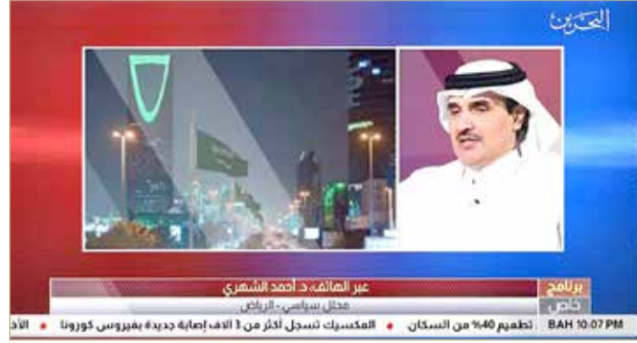
المنامة - بنا

خبراء ومحللون سياسيون: قانون العقوبات البديلة من صميم حقوق الإنسان