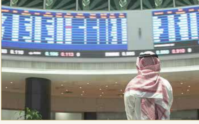
المنامة - بورصة البحرين

سند لكل مكتب وتخصيص الطلبات المتبقية بأية النسبة والتناسب. ويبلغ حجم الإصدار 200 مليون دينار بقيمة إسمية قدرها دينار واحد للسند، في حين تبلغ مدة الإصدار 5 سنوات اعتباراً من 5 مايو 2021 حتى 5 مايو 2026 (تاريخ الاستحقاق). ويبلغ العائد الثابت 3.60 % سنوياً، يتم خلالها دفع فوائد الإصدار كل ستة أشهر تستحق في 5 مايو و5 نوفمبر من كل عام خلال مدة الإصدار. تمثل سندات التنمية الحكومية أداة مالية يصدرها مصرف البحرين المركزي بالنيابة عن حكومة مملكة البحرين، التي تضمن إصدار سندات التنمية الحكومية ضماناً مباشراً.