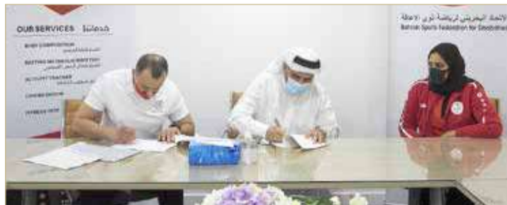
جانب من توقيع الرعاية

◆ اتفاقية بين اتحاد ذوي الإعاقة ومختبر البحرين الوطني