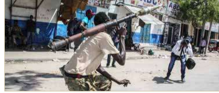
مسلحون وعربات مزودة بأسلحة رشاشة تنتشر في العاصمة الصومالية

على خلفية الأزمة بشأن تمديد ولاية الرئيس محمد عبدالله