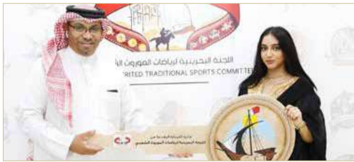
جانب من تسليم الفائزين بالسيارات

خليفة بزيادة عدد السيارات في البرنامج. ويبلغ مجموع جوائز برنامج المسابقات الشعبي السارية 150 ألف دينار بين جوائز نقدية مباشرة وأخرى عينية قيمة، إضافة إلى 10 سيارات، و6 سيارات أخرى بعد توجيهات سمو الشيخ ناصر بن حمد آل خليفة لدى زيارة سموه موقع تصوير البرنامج.