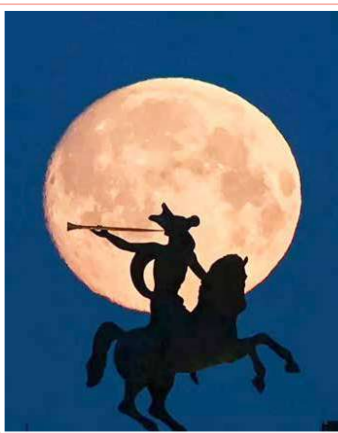
قمر وردي عملاق على خلفية تمثال متحف النصر في موسكو، روسيا

تم في يوم الأرض العالمي أخيراً الإعلان في الصين عن أول طريق يتم تعبيده بالنفايات البلاستيكية المعاد تدويرها، وذلك في حرم جامعة للعلوم والتكنولوجيا في شينغهاي شرقي الصين. واستخدم في إنجازها الطريق الذي يبلغ طوله 300 متر، أكثر من 200 كغ من رضعات الأطفال البلاستيكية المعاد تدويرها، وفق "شينخوا". ويتم إرسال رضعات الحليب البلاستيكية إلى مصنع إعادة التدوير للرز والعجن والصحف، ثم يتم إرسالها إلى مصنع إنتاج الإسفلت لإنتاج نفايات الإسفلت البلاستيكية... بدلا من إعادة تقنية محددة. ويعمل هذا الإجراء على تقليل توليد النفايات البيئية بالمقارنة مع رصيف الأسفلت النقي التقليدي.