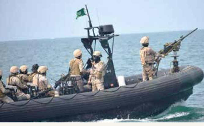
القوات السعودية تمكنت في السابق من إحباط هجمات مماثلة بزوارق مفخخة

الحوثيون المتهم الأول بالوقوف وراء مثل هذه الهجمات البحرية