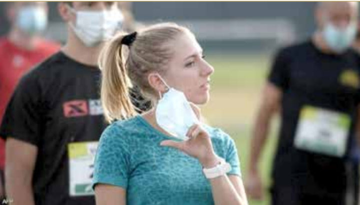
أميركا تسمح لمواطنيها بخلع الكمامات

مسؤولو الصحة وخبراء الأمراض المعدية في أميركا إن الكمامات لن تعود ضرورية مع ارتفاع عدد الحاصلين على اللقاح في الولايات المتحدة. وحصل 140 مليون أميركي حتى الآن، أي ما يعادل 43% تقريبا من سكان البلاد، على جرعة واحدة على الأقل من لقاح كورونا.