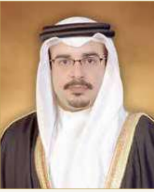
سمو ولي العهد رئيس الوزراء