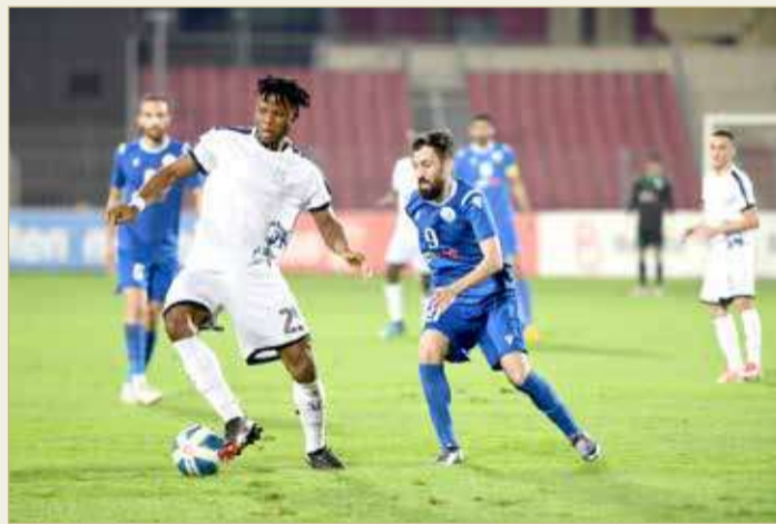
من مباراة الحد والنجمة