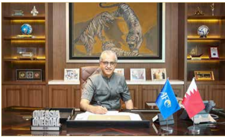
سلمان بن إبراهيم

2021، وذلك بعد الأخذ في الاعتبار قيود السفر الحالية وتحديات الحظر التي تفرضها جائحة كوفيد-19. وسوف تستضيف تايلند منافسات المجموعات السادسة والسابعة والعاشر، في حين سيتم لاحقاً تحديد مستضيف المجموعتين الثامنة والعاشر.