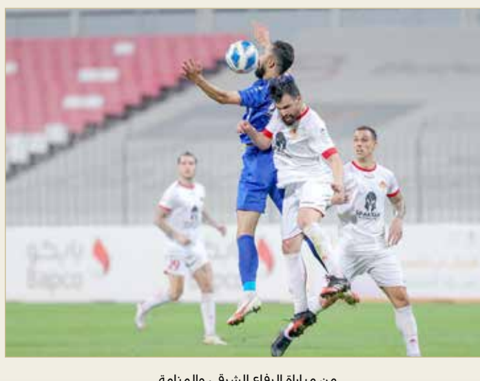
من مباراة الرفاع الشرقي والمنامة

البستين يتعادل مع البديع وبقية حظوظ الهبوط مفتوحة