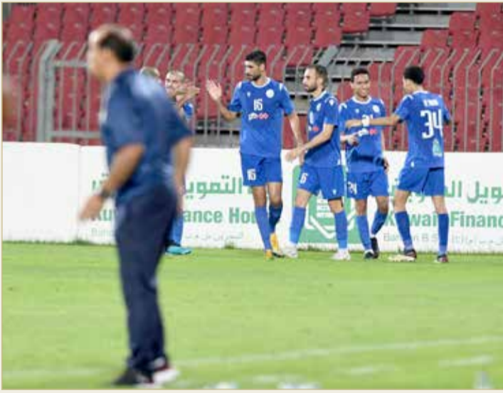
فرحة حدادية تكررت 4 مرات