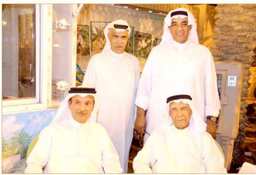
تميز المرحوم بعلاقات طيبة مع كل الفئات

لأنه كان يكرر دائماً: "حينما نرى الناس سعداء.. فذلك يسعدنا"، ولهذا، فإن ذلك الإخلاص - رغم حرص الراحل على ألا يكون عمله تحت أضواء الإعلام - إلا أن أهل البحرين يثمنون أدواره