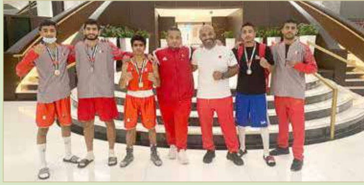
المنتخب الوطني للملاكمة

سموه كذلك بالمستوى الفني المشرف الذي قدمه لاعبو المنتخب في هذه المشاركة، والتي أكدت مدى الاستعدادات الواضحة التي منحت المنتخب حصد 4 ميداليات ملونة في هذه البطولة الدولية، متمنيا سموه كل التوفيق والنجاح للمنتخب في المشاركات القادمة.