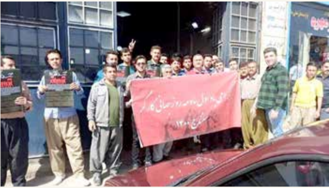
من تظاهرات إيران أمس

تجمعت مجموعات مختلفة من المتقاعدين في إيران، أمس تزامنا مع اليوم المقرر لعيد العمال الموافق في الأول من مايو؛ للمطالبة بتحسين ظروف المعيشة والأمن الوظيفي، فما كان من رجال الشرطة وقوات الأمن الإيرانية إلا أن هاجمت التجمع واعتقلت ما لا يقل عن 30 شخصا.