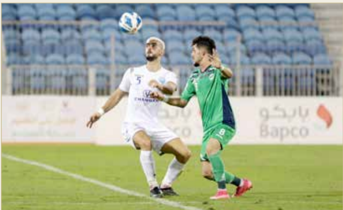
من مباراة البستين والبديع