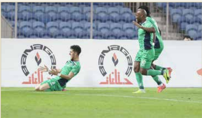
فرحة البديع لم تكتمل