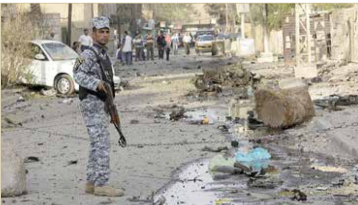
بقايا إحدى الهجمات بالعراق