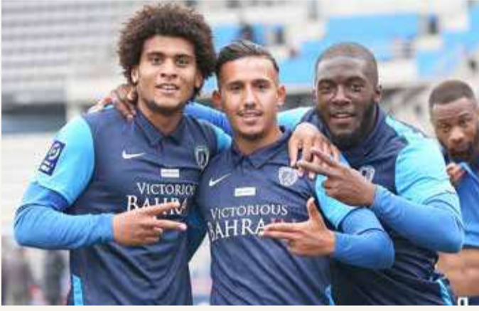
فرحة لاعبي فريق باريس اف سي