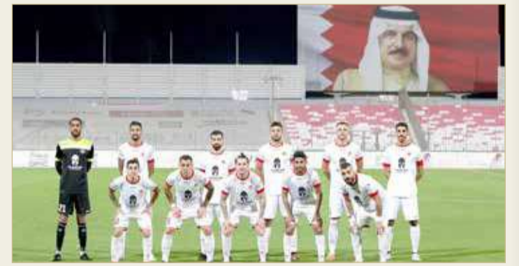
الرفاع الشرقي ضمن المركز الثاني