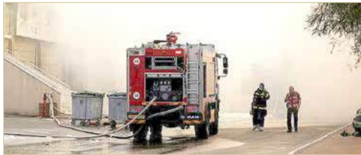
اندلاع حريق كبير قرب مطار بن غوريون

إصابة 3 إسرائيليين في عملية إطلاق نار جنوب نابلس