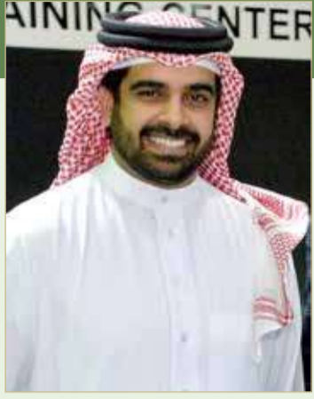
سمو الشيخ سلمان بن محمد