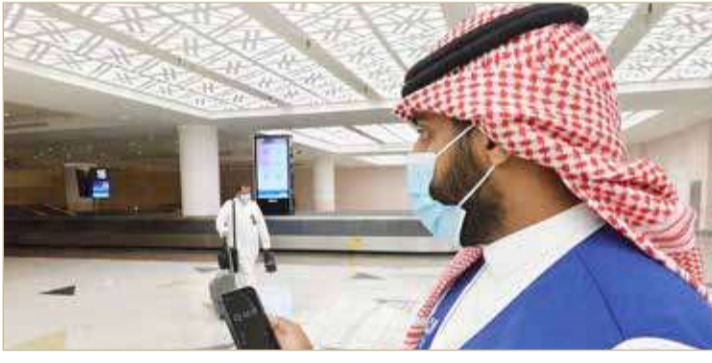
السعودية تسمح باستئناف حركة السفر الدولي

بشروط تلقي جرعتي اللقاح أو مرور 14 يوماً على الجرعة الأولى