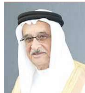
الشيخ محمد بن عبدالله

تقديرها لأوامر صاحب السمو الملكي رئيس مجلس الوزراء والتي تصب بشكل مباشر في توفير أرقى خدمات صحية المواطنين والمقيمين على هذه الأرض الطبية. ونوهت بأن وزارة الصحة على أتم الاستعداد للبدء بتنفيذ أمر سموه بالتنسيق مع مراكز الصحة الأولية لتجهيز المراكز الصحية التسعة للعمل على مدار الساعة بما يوفر التغطية الطبية لمباشرة الحالات المستعجلة المتعلقة بطب العائلة. وأكدت أن مسيرة العطاء مستمرة وسوف تسير على خطى ثابتة ووفق الرؤية الثاقبة التي تقوم على رفع جودة وكفاءة الخدمات الصحية وضمان تقديم أرقى المستويات من الخدمة الصحية والعلاجية للمواطنين، لكي يبقى كما أشار سموه هذا القطاع دائماً متطوراً ومؤهلاً ومعززاً بالخدمات وأحدث التقنيات العلاجية.