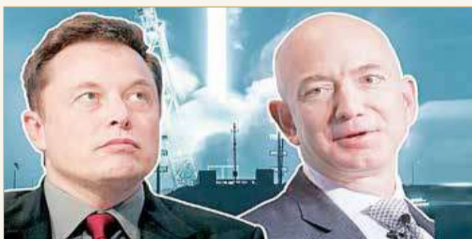
جيف بيزوس وإيلون ماسك

إكس" و"بلو أوريجين" بمؤسسين يملكان موارد مالية وافرة، تتنافس الشركتان أيضاً للحصول على عقود مع الجيش الأمريكي أو وكالات الفضاء. ولا شك في أن ماسك يتفوق على بيزوس في هذا الصدد. أطلقت "سبايس إكس" مئات الأقمار الصناعية بينما لا تزال شبكة "كويبر" للأقمار الصناعية على الأرض رغم تخصيص بيزوس 10 مليارات دولار لدعماً.