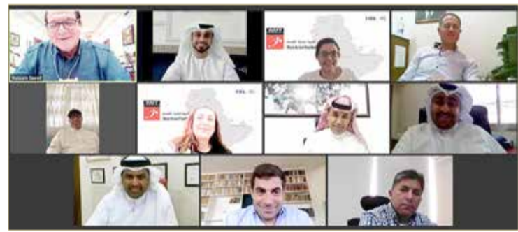
من الاجتماع المرئي

شارك الأمين العام للاتحاد البحريني لكرة القدم إبراهيم البوعيينين في اجتماع لجنة المسابقات باتحاد غرب آسيا لكرة القدم، والذي عقد عبر المنظومة الإلكترونية، وذلك بصفته عضواً في اللجنة.