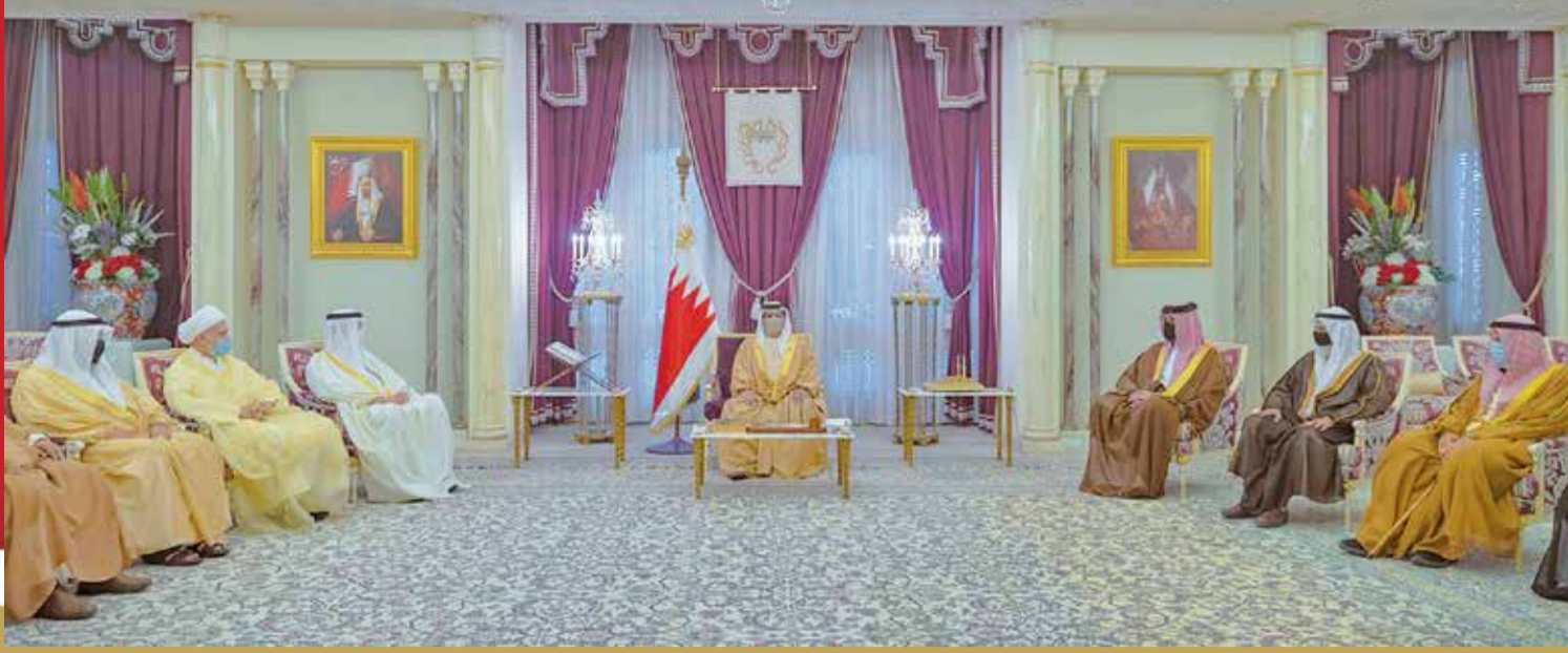
جلالة الملك يستقبل رئيس وأعضاء المجلس الأعلى للشؤون الإسلامية