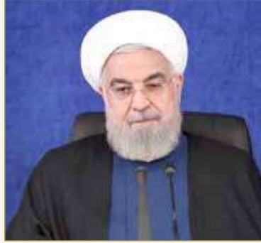
الرئيس الإيراني حسن روحاني

من جهتها، أفادت وكالة "فارس" بأن التقارير الأولية تشير إلى اشتعال النيران في معامل عدة بالمدينة الصناعية، حيث امتدت إلى الطريق العام. وأضافت أن الحريق أدى إلى وقوع قتلى وجرحى بالمدينة. وقد تم إرسال 20 سيارة إطفاء و150 من رجال الإطفاء إلى الموقع. وأظهرت مقاطع مصورة دخاناً أسود كثيفاً يتصاعد من مصنع