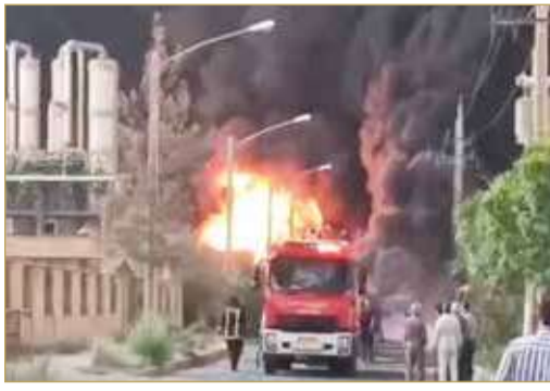
الإطفاء يحاول إخماد الحريق

واشنطن تنفي توصلها إلى اتفاق مع طهران بشأن تبادل أسرى