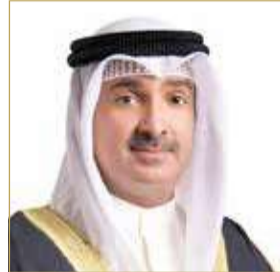
مستشار جلالته الملك