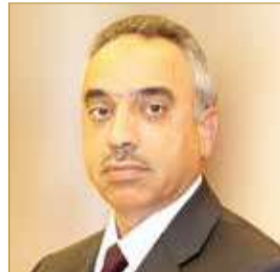
وزير الأشغال وشؤون البلديات