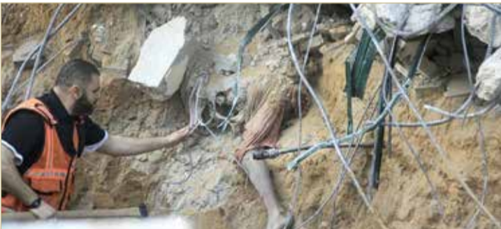
صبي فلسطيني عالق بين الركام نتيجة القصف الإسرائيلي على غزة

السعودية فيصّل بن فرحان حول الجهود المستهدفة لوقف العدوان على القدس وغزة وبقيّة الأراضي الفلسطينية سبيلاً وحيداً لوقف التصعيد الحالي. كما أكد عبر سلسلة تغريدات عبر حسابه على "تويترا"، أن الاحتلال أساس الصراع وإطلاق حراك سياسي فاعل لإنهائه هي أولوية تعمل عليها مع الشركاء والأشقاء.