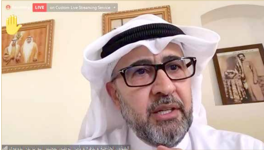
الدوسري: التوجيه الملكي يدعم الجهود الدولية في نشر قيم الاعتدال

وذكر أن ذلك يأتي تأكيدا آخر لحرص جلالتهم على أهمية التعايش السلمي العالمي وإعلاء رسالة الإنسانية جمعاء، وبما يتوافق مع مبادئ الإعلان العالمي لحقوق الإنسان وتعاليم الإسلام والقيم الإنسانية.