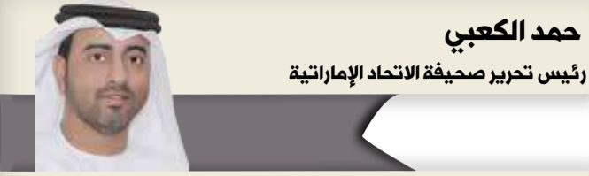
حمد الكعبي رئيس تحرير صحيفة الاتحاد الإماراتية