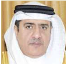
رئيس جهاز الاستخبارات الوطني