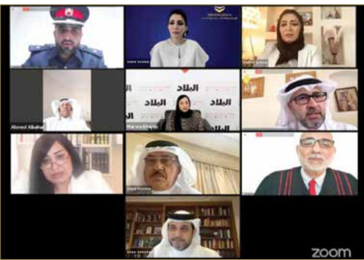
المشاركون في ندوة "البلاد"

♦ الرائد الرميحي بندوة "البلاد": إزراء الأديان جنحة تصل عقوبتها إلى السجن 3 سنوات