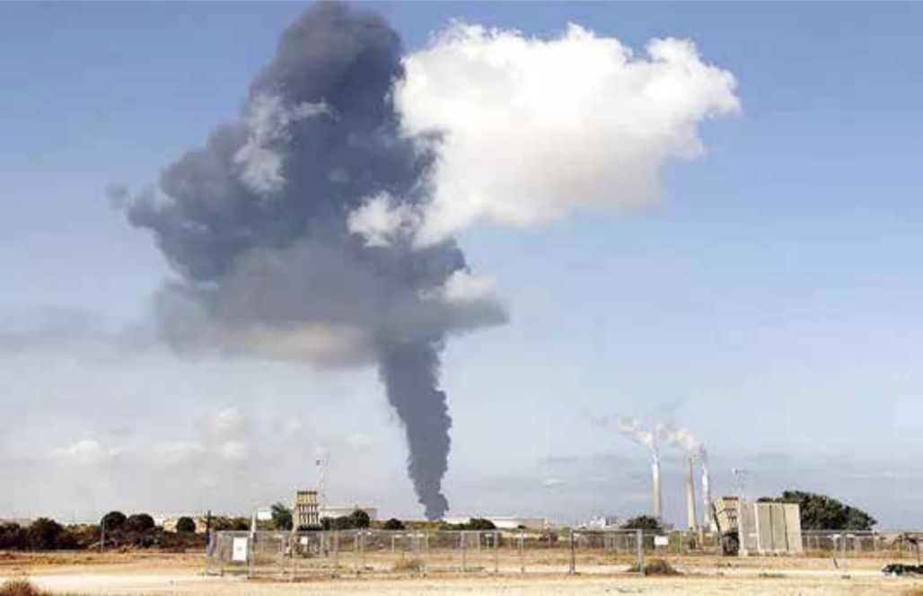
أعمدة الدخان تتصاعد بعد قصف فصائل فلسطينية موقع المخزن النقطي لمحطة كهربائية في عسقلان، جنوب إسرائيل

اليوم الخامس على التوالي، استمر العدوان الإسرائيلي، أمس الجمعة، بالقصف العنيف جوا وبراً وبحراً على قطاع غزة الذي تسيطر عليه حركة حماس، إذ استشهد منذ الاثنين 122 فلسطينياً. وفي المقابل، انطلقت مئات الصواريخ من القطاع المحاصر في اتجاه المدن والبلدات الإسرائيلية، لاسيما الجنوبية منها، وارتفعت حصيلة القتلى في إسرائيل إلى 9.