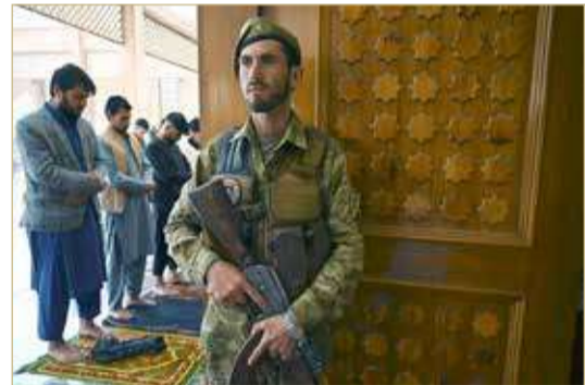
أحد أفراد الأمن الأفغان يحرس المصلين في مسجد بالعاصمة كابول (أ ف ب)

تسبب انفجار في سقوط 12 قتيلاً على الأقل في مسجد ضاحية كابول في حرق لوقف إطلاق النار الموقت بمناسبة عيد الفطر، بعيد الانسحاب الأمريكي من قاعدة قندهار الجوية، التي تعد من الأهم في أفغانستان.