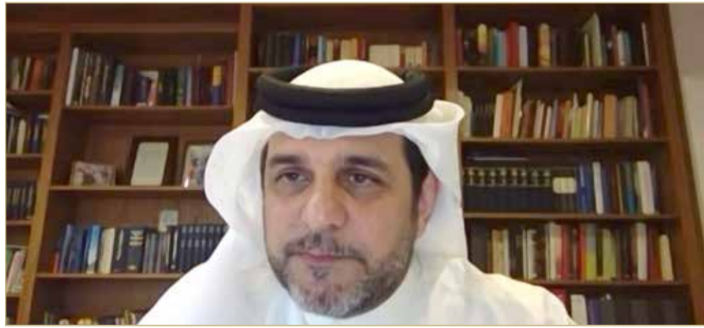
الجابري: البهائيون جزء لا يتجزأ من المجتمع البحريني

◆ الجابري: جمعيتنا ترحب بالجميع... ولها مبادرات في التعايش