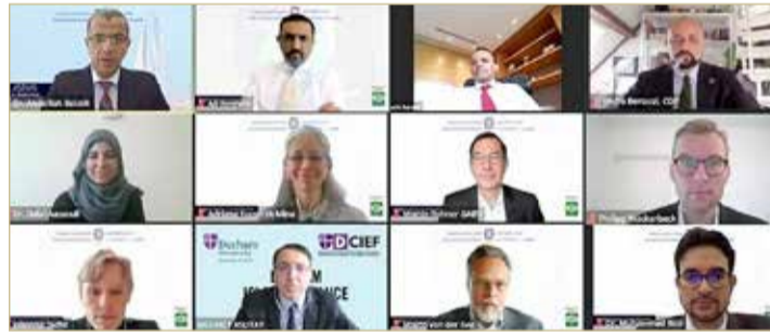
جانب من اجتماع الطاولة المستديرة

عقد المجلس العام للبنوك والمؤسسات المالية الإسلامية المظلة الرسمية للصناعة المالية الإسلامية الأسبوع الماضي اجتماع الطاولة المستديرة حول دليل الاستدامة في الصناعة المالية الإسلامية من خلال البث المرئي. تعزيزا لالتزام المجلس العام بدعم ممارسات الاستدامة والعمل المسؤول في الصناعة المالية الإسلامية، عُقد اجتماع الطاولة المستديرة لمناقشة القضايا الرئيسية لتطوير دليل الاستدامة في الصناعة المالية الإسلامية بمشاركة نخبة من الخبراء والمهنيين من مختلف المؤسسات الرائدة. كما شارك في الاجتماع أعضاء مجموعة الاستدامة للمجلس العام، وعدد من منتسبي