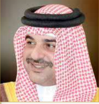
سمو الشيخ عبدالله بن حمد

في إنجاز بحريني رياضي جديد، حقق فريق "بحرين 1" للسيارات انتصاره الأول هذا الموسم 2021 من منافسات الجملة الثانية من بطولة العالم NHRA للسيارات السريعة فئة برومود التي أقيمت على حلبة أتلانتا لسباقات السرعة بولاية جورجيا بالولايات المتحدة الأمريكية، حيث تمكن السائق جاستن بوند من الفوز في السباق النهائي على زميله بطل العالم ستيفي جاكسون بزمق وقدره 5.738 ثانية.