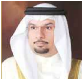
الرئيس التنفيذي للمجلس الأعلى للبيئة