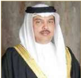
رئيس المراسم الملكية