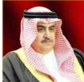
مستشار جلالته الملك للشؤون الدبلوماسية