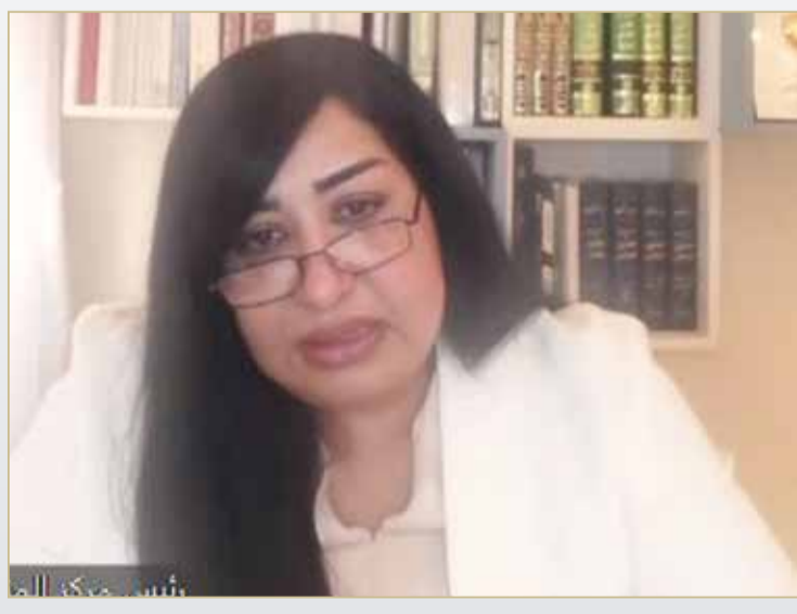
اللطي: الرواد الأوائل غرسوا مفاهيم الوطنية والتسامح والانتماء

على التطرف أو العنف والإرهاب. وذكرت أن جلالة الملك يحرص دائما على إبراز دور مملكة البحرين نموذجا عالميا في التسامح