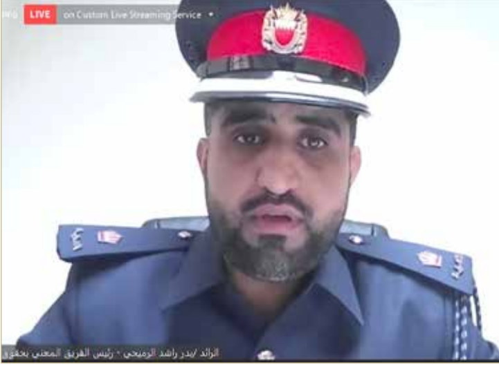
الرائد الرميحي: قانون "الكراهية" حصانة للمجتمع من الأفة