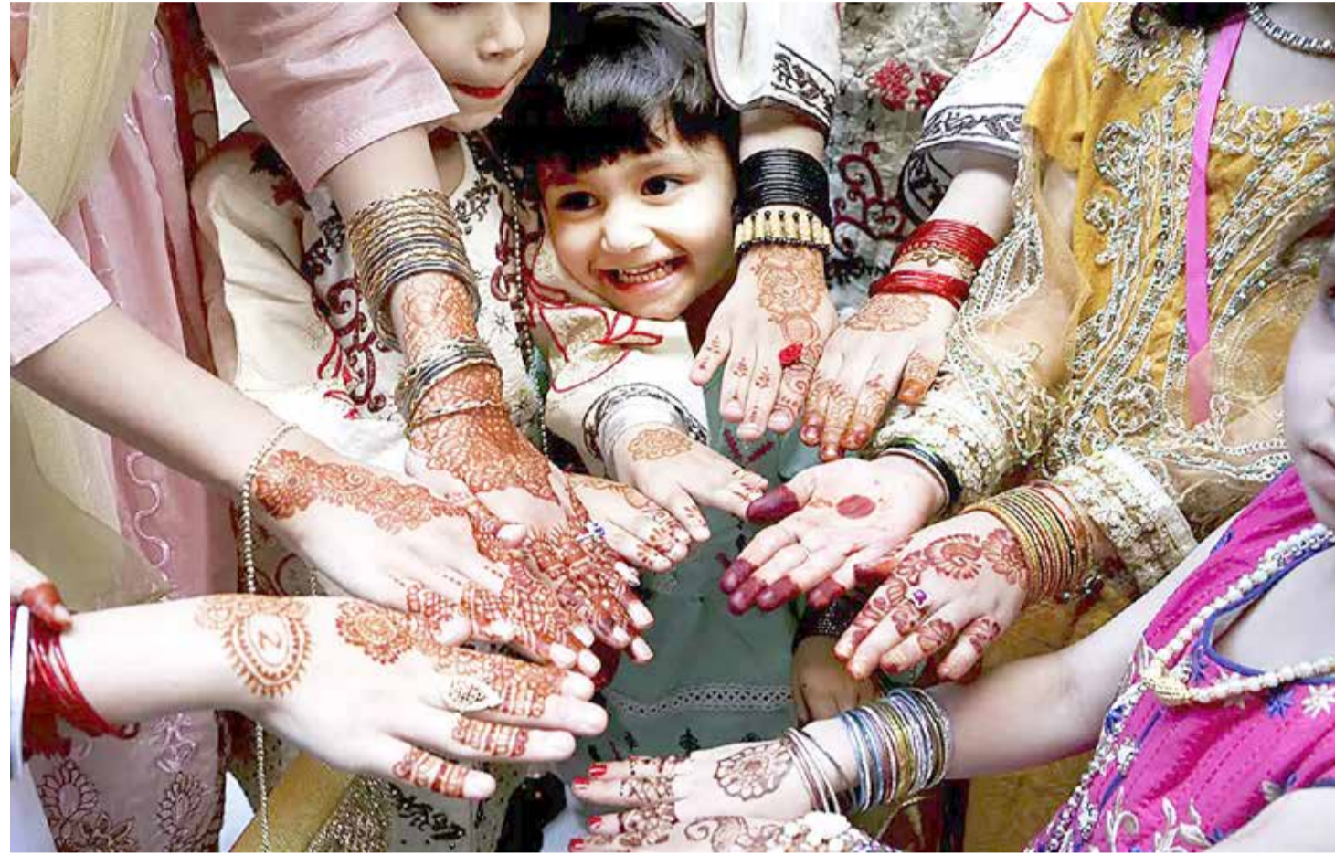
فتيات يزبن أيديهن بالحناء التقليدية احتفالاً بعيد الفطر (أ ب)

إدارة التحرير: +973 17111444 / +973 17111467 / 385 @albiladpress.com / 2008 تصدر عن دار البلاد للصحافة والنشر والتوزيع • س ت 67133 تطبع في مؤسسة الأبرام للنشر • قسم الإعلانات: 508 / +973 17111501 / 39615645 / +973 32224492 / +973 17580939 / +973 17111432 / +973 17111434