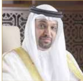
وزير المالية والاقتصاد الوطني