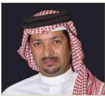
غازي عبدالله ناس

سموه لتحقيق الإضافة المنشودة، عطفاً على ما يتمتع به من خبرات كبيرة ورغبة واضحة في تعزيز مسيرة الحركة الرياضية وقيادتها نحو المزيد من التطور والنماء على المستويات كافة. وأكد ناس أن سمو الشيخ خالد بن حمد آل خليفة يعتبر الرجل المناسب في المكان المناسب وهو شخصية قادرة على النهوض بالقطاع الرياضي إلى آفاق أرحب من التميز والنماء بعد أن ترك بصمة واضحة في مختلف المواقع القيادية التي شغلها، متمنياً لسموه التوفيق والنجاح في مهام عمله الجديد.