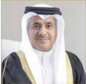
وزير المواصلات والاتصالات