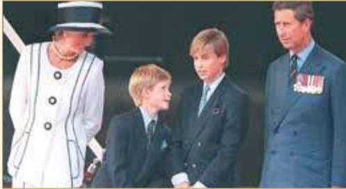
هاري وصغيرا بصحة عائلته

الذهنية بعنوان "ذي مي يو كانت سي"، تبدأ عرضه "آبل تي في" في 21 مايو. وخلال الترويج لهذا البرنامج، أكد الأمير هاري عبر بودكاست "أرتمشير إكسبيرت" أنه أدرك بعيد بلوغه سن العشرين أنه لا يرغب في الاستمرار بالالتزامات الملكية، في موقف عائد بجزء منه إلى "ما حصل مع أمي". كما تذكر شعوره بـ "العجز التام" بعد رؤيته والدته الأميرة ديانا "ملاحقة من قناصي صور المشاهير" حين كان طفلاً. ويعيش هاري وميغان مع ابنتهما آرثشي، البالغ سنتين، في مونتيسيتو شمال لوس أنجلوس، وهما ينتظران مولودة هذا الصيف.