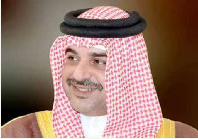
سمو الشيخ عبدالله بن حمد

في إنجاز بحريني رياضي جديد، حقق فريق "بحرين 1" للسيارات انتصاره الأول هذا الموسم 2021 من منافسات الجولة الثانية من بطولة العالم NHRA للسيارات السريعة فئة برومود التي أقيمت على حلبة أتلانتا لسباقات السرعة بولاية جورجيا بالولايات المتحدة الأمريكية، حيث تمكن السائق جاستن بوند من الفوز في السباق النهائي على زميله بطل العالم ستيفي جاكسون بزمن وقدره 5.738 ثانية.