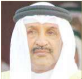
مستشار جلالته الملك لشؤون الشباب والرياضة