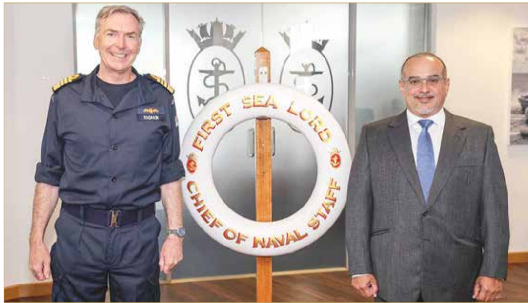
سمو ولي العهد نائب القائد الأعلى رئيس مجلس الوزراء في لقاء مع قائد البحرية الملكية البريطانية

مملكة البحرين بالملكة المتحدة وتعزيز أفق التعاون والتنسيق الثنائي بينهما.