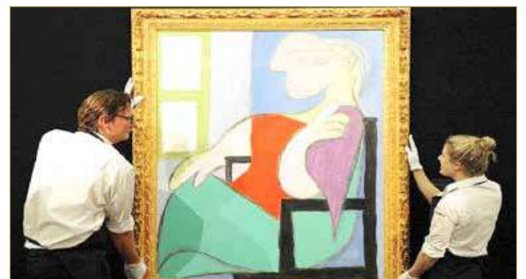
ويؤكد بيع هذه اللوحة حيوية سوق الفن التي لم تعان فعليا من الوباء رغم التباطؤ الذي شهدته بسبب القلق الناجم عن الوضع الصحي والاقتصادي، لكنه أيضا يعكس المكانة الخاصة لأعمال بابلو بيكاسو (1881-1973).

بيعت لوحة "المرأة الجالسة بالقرب من نافذة (ماري تيريز)" للرسام بابلو بيكاسو الخميس في مقابل 103,4 مليون دولار خلال مزاد أقيم في دار "كريستيز" في نيويورك. وتنافس عدد من هواة جمع الأعمال الفنية نحو 19 دقيقة على شراء هذه اللوحة التي يبلغ قياسها 1,46 متر ورسمها بيكاسو العام 1932، وبيعت في النهاية في مقابل 90 مليون دولار، وبلغ سعرها النهائي 103,4 ملايين بعد إضافة الرسوم والعمولات. ويشكل هذا المبلغ تقريبا ضعف التقدير الأولي الذي وضعته "كريستيز" لهذه اللوحة التي تمثل عشيقه بيكاسو ومصدر إلهامه ماري تيريز والتر، والبالغ 55 مليون دولار.