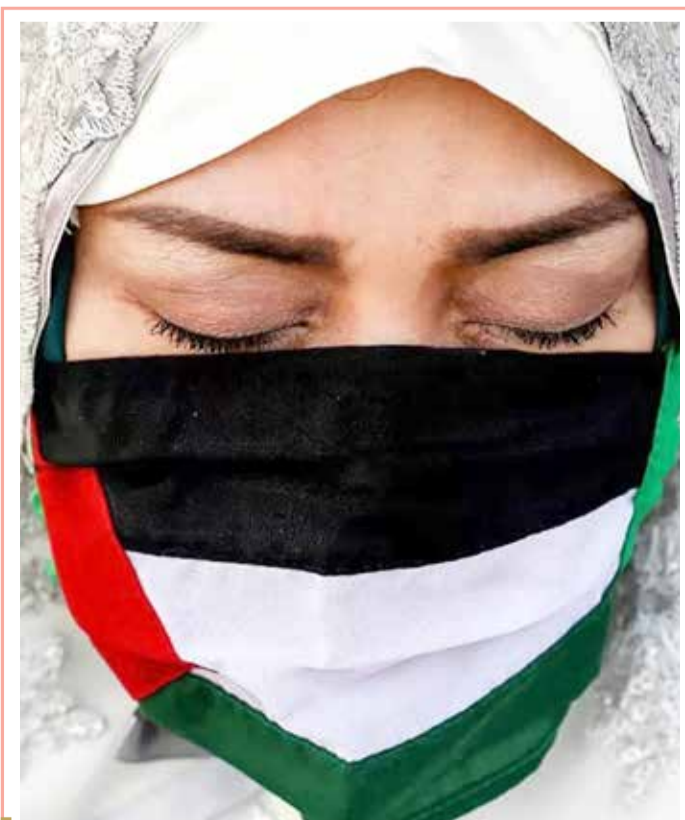
امرأة إندونيسية خلال صلاة عيد الفطر في مسجد الأزهر في العاصمة جاكرتا

غُثر على ثمانية عشر فيلا نافقا في أذغال ولاية أسام شمال شرق الهند، على ما أعلنت الجمعية السلطات المحلية التي فتحت تحقيقاً بشأن أسباب هذه الحالات فيما رجح مسؤولون محليون أن تكون ناجمة عن صاعقة. وأبدى وزير الغابات في ولاية أسام باريمال سوكلابايدا عميق حزنه بسبب نفوق هذه الحيوانات. وأشار إلى أن الفيلة قد تكون قضت جراء الصاعقة التي ضربت محمية غابات كاندالي في مقاطعة ناغاون ليل الأربعاء الخميس. وأعرب رئيس وزراء ولاية أسام هيمانتا بيسوا سارما في بيان عن قلقه إزاء نفوق "هذا العدد الكبير من الفيلة". وأرسلت حكومة أسام فريقاً من الأطباء البيطريين في منطقة تلال باموني، حيث نفقت الفيلة في ظروف لا تزال غامضة.