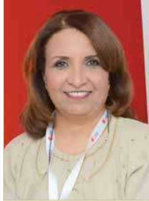
حياة بنت عبدالعزيز

رفعت رئيس مجلس إدارة الاتحاد البحريني لكرة الطاولة الشيخة حياة بنت عبدالعزيز آل خليفة بالأصالة عن نفسها وبالنيابة عن أعضاء مجلس الإدارة أسمى آيات التهاني والتبريكات إلى النائب الأول لرئيس المجلس الأعلى للشباب والرياضة رئيس اللجنة الأولمبية البحرينية سمو الشيخ خالد بن حمد آل خليفة، بمناسبة صدور المرسوم الملكي رقم (67) لسنة 2021 من عاهل البلاد صاحب الجلالة الملك حمد بن عيسى آل خليفة عاهل البلاد، بتعيين سموه رئيسا لمجلس إدارة الهيئة العامة للرياضة. وأكدت الشيخة حياة بنت عبدالعزيز آل خليفة أن صدور الثقة الملكية السامية بتعيين سمو الشيخ خالد بن حمد آل خليفة في هذا المنصب يعكس الكفاءة العالية والافتقار لسموه وما حققه من إنجازات عديدة في الرياضة في مملكتنا الغالية.