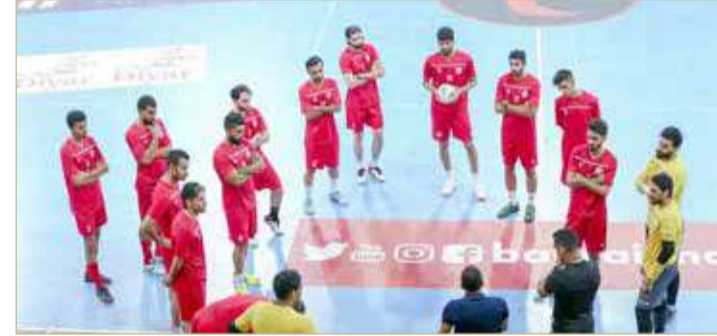
من تدريبات منتخب كرة الصالات

المجموعات يوم 20 مايو بقاء نظيره الكويتي في الجولة الأولى، ثم يلقي موريتانيا في الجولة الثانية يوم 22 مايو، ويختتم مبارياته بقاء مصر يوم 24 مايو. وينص نظام المجموعة على تأهل صاحبي المركزين الأول والثاني إلى نصف النهائي الذي سيقام بنظام إخراج المغلوب.