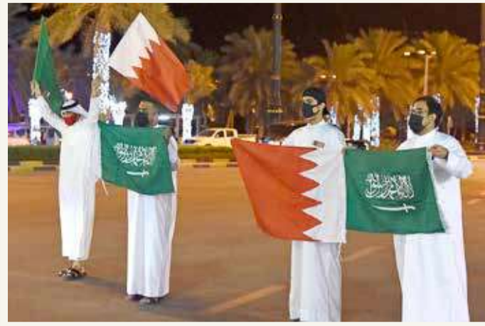
ترحيب واسع بالزوار السعوديين