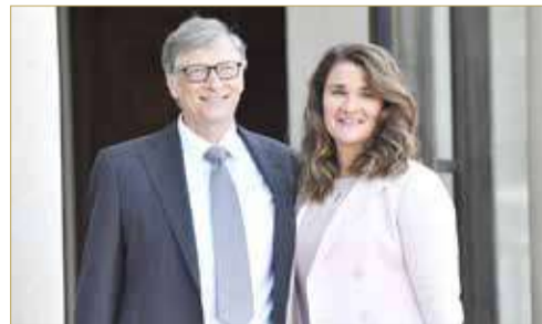
بيل غيتس وطليقته مليندا

وأثارت لجنة من مجلس الإدارة هذا القلق، بمساعدة مكتب محاماة خارجي لإجراء تحقيق شامل. وأثناء تحقيق، قدمت مايكروسوفت دعما مكثفا للموظفة المعنية. في المقابل، أبرز المتحدث باسم غيتس لـ "وول ستريت جورنال"، أن الملياردير كان في علاقة غرامية "منذ ما يقرب من 20 عاما"، لكنه أشار إلى أنها انتهت وديا، وأن قرار غيتس بالانسحاب من مجلس إدارة مايكروسوفت "لم يكن مرتبطا بهذا الأمر بأي حال من الأحوال". وفي مارس 2020، أعلنت شركة مايكروسوفت تنحي مؤسسها بيل غيتس عن مجلس إدارة عملاق التكنولوجيا الأميركية.