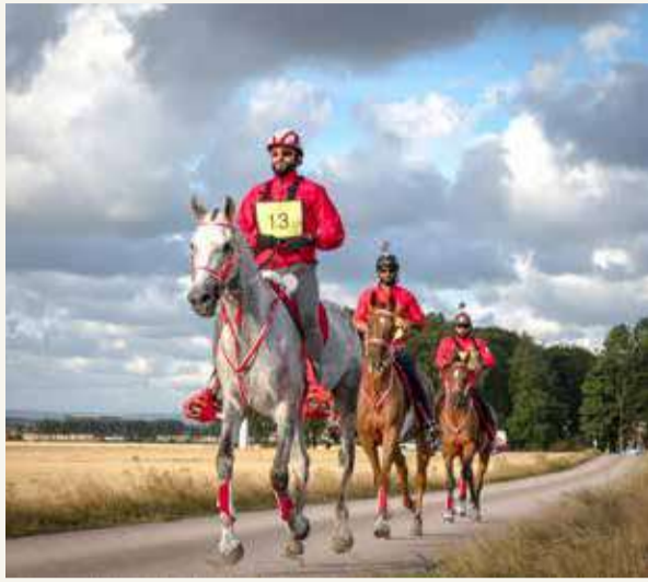
من منافسات القدرة