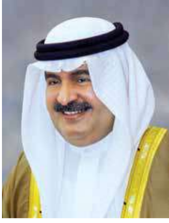
سمو الشيخ علي بن خليفة

هنا نائب رئيس مجلس الوزراء سمو الشيخ علي بن خليفة آل خليفة النائب الأول لرئيس المجلس الأعلى للشباب والرياضة رئيس مجلس إدارة الهيئة العامة للرياضة رئيس اللجنة الأولمبية البحرينية سمو الشيخ خالد بن حمد آل خليفة، بمناسبة صدور المرسوم الملكي بتعيين سموه رئيساً لمجلس إدارة الهيئة العامة للرياضة. وأكد سمو الشيخ علي بن خليفة أن تعيين سموه رئيساً لمجلس إدارة الهيئة العامة للرياضة، يؤكد الجهود المتميزة التي يبذلها سموه لخدمة مملكة البحرين، في ظل المسيرة التنموية الشاملة لملك البلاد صاحب الجلالة الملك حمد بن عيسى آل خليفة ومتابعة ولي العهد رئيس مجلس الوزراء صاحب السمو الملكي الأمير سلمان بن حمد آل خليفة، متمنياً لسموه التوفيق والسداد في مواصلة تطوير الحركة الرياضية، لتحقيق التطلعات الملكية لهضة وتقدم الرياضة البحرينية.