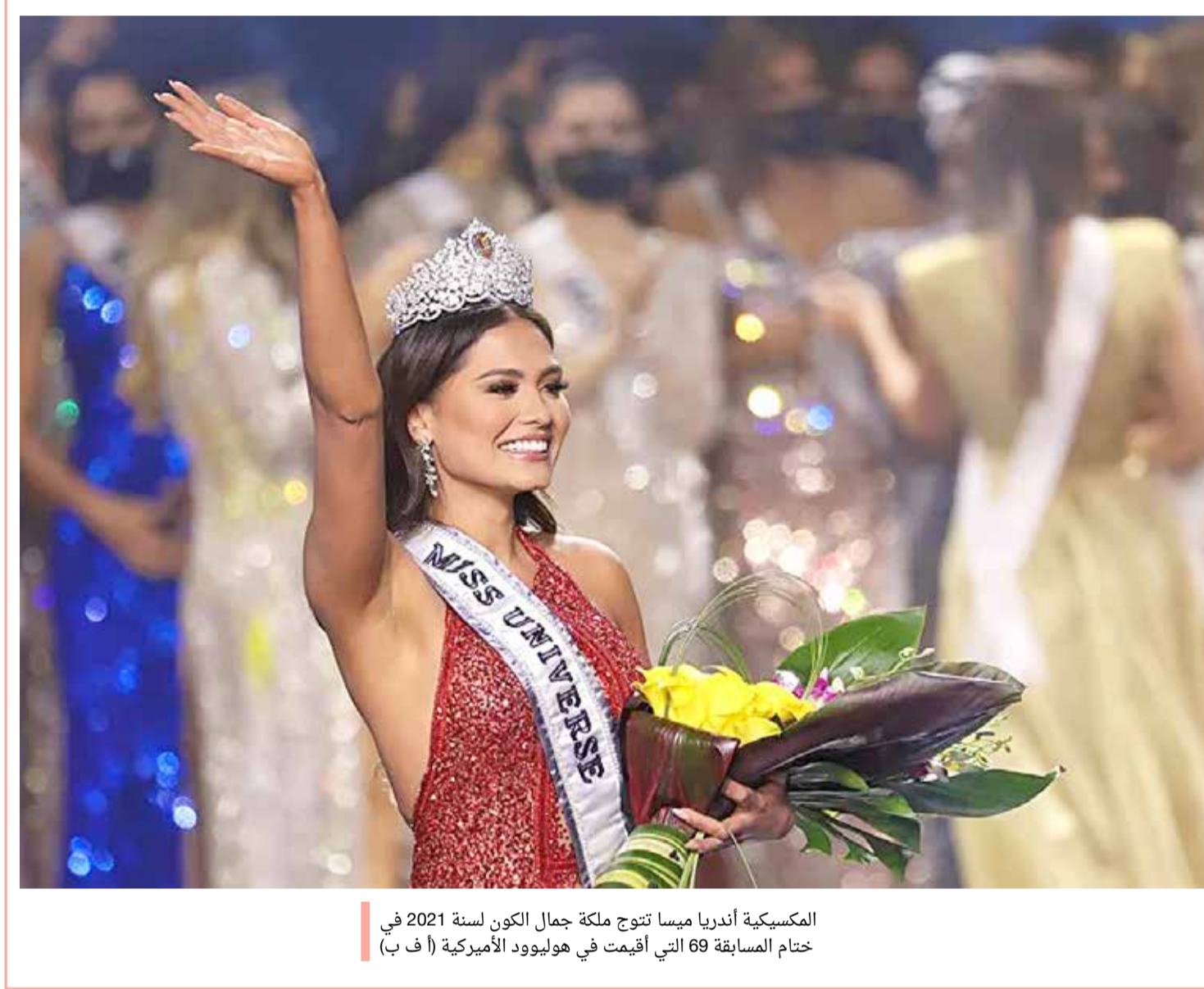
المكسيكية أندريا ميسا تتوج ملكة جمال الكون لسنة 2021 في ختام المسابقة 69 التي أقيمت في هوليوود الأمريكية

إدارة التحرير: +973 17111444 / +973 17111467 / 385 @albiladpress.com / local / 2008 / تصدر عن دار البلاد للصحافة والنشر والتوزيع / ست 67133 / تطبع في مؤسسة الأيام للنشر قسم الإعلانات: +973 17111501 / 508 / +973 17111432 / +973 17580939 / +973 32224492 / 39615645