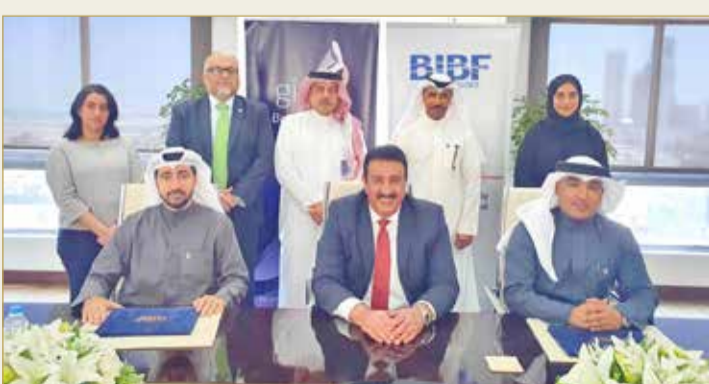
أثناء إبرام الشراكة بين الأطراف الثلاثة

البحرينية الكويتية للتأمين (جي آي بحرين) وشركة التكافل الدولية (جي آي بحرين التكافل) لإطلاق هذا البرنامج الفريد من نوعه لتنمية المواهب الوطنية وإعداد الجيل القادم من القيادات الشبابية في التأمين”.