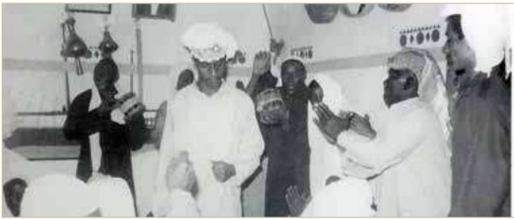
دار بن حربان قديماً وفن لفجري