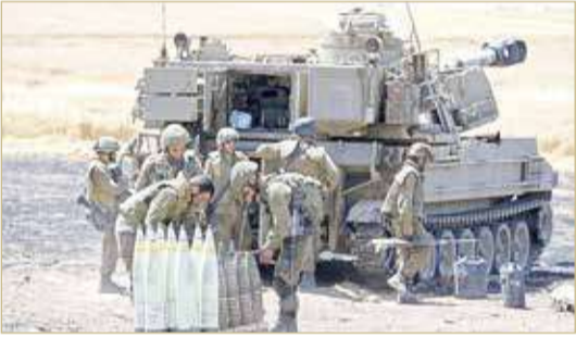
مدفعية إسرائيلية تطلق قذائفها نحو غزة.

أكد وزير الخارجية الأميركي أنتوني بلينكن، أن بلاده "تعمل بكثافة خلف الكواليس"، لإنهاء العنف بين الإسرائيليين والفلسطينيين. وأعرب وزير الخارجية الأميركي عن قلق الولايات المتحدة "الشديد" من تصاعد العنف بين الإسرائيليين والفلسطينيين. ودعا بلينكن إسرائيل والفلسطينيين إلى "حماية المدنيين" والأطفال، بينما تواصل بلاده تكثيف المساعي الدبلوماسية. وكرر بلينكن أن إسرائيل عليها ععب إضافي في بذل كل الجهود لتفادي سقوط ضحايا مدنيين.