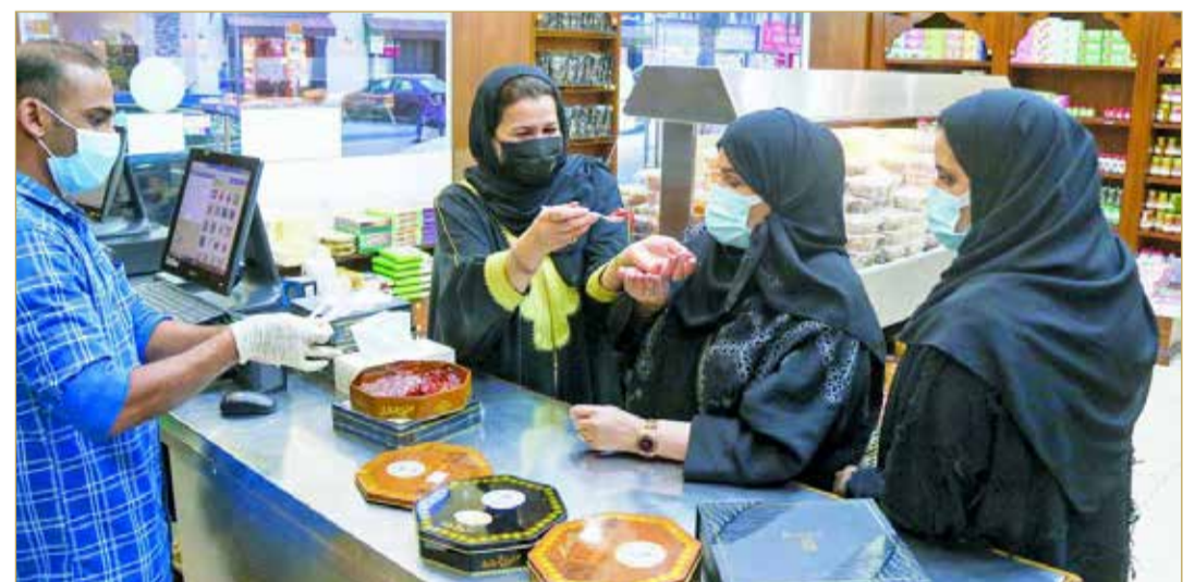
نساء سعوديات: "ولهنا على الحلوى البحرينية"