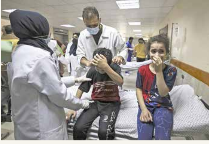
طفلان في مستشفى الشفاء بكيان مقتل أقرانهم في غارة جوية إسرائيلية على منزل العائلة في مدينة غزة

وأمس دعت اللجنة المركزية لحركة "فتح" إلى إضراب شامل في الضفة الغربية اليوم الثلاثاء انسجاما مع دعوة لجنة المتابعة العربية العليا في إسرائيل إلى إضراب شامل "ردا على العدوان الإسرائيلي المتواصل على شعبنا الفلسطيني".