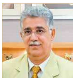
رئيس تحرير مجلة رويال

"خليفة بن سلمان... الى جنة الخلد... مقال للشيخ صلاح الجودر جاء فيه: الأمير الراحل خليفة بن سلمان هو امتداد الماضي بالحاضر، بين الأصالة والحداثة، وحجر الزاوية في هذا الوطن، فقد كان مدرسة بحد ذاتها، وفي جميع المجالات، وكانت عباراته حكم ودروس ينقلها أصحاب الأقلام، بأسلوبه السهل الممتنع يشد كل الحاضرين إليه دون ملل ولا كآبة، فقد كان مقبلا على الناس بقلب مفتوح