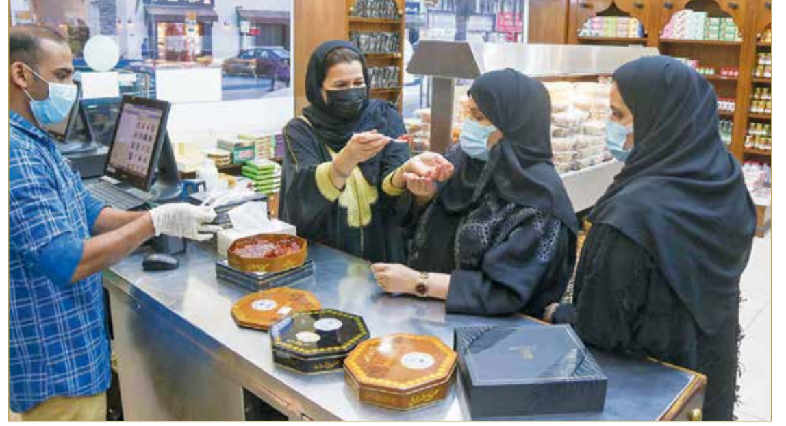
نساء سعوديات: "ولهننا على الحلوى البحرينية"