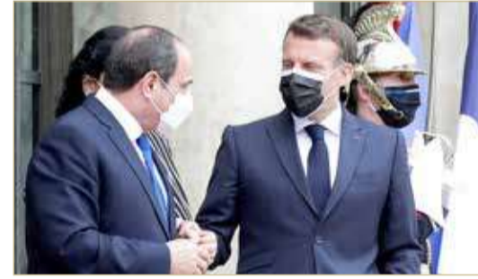
الرئيس الفرنسي ونظيره المصري

قال الرئيس المصري عبدالفتاح السيسي، أمس الإثنين، إن بلاده تمسك بوقف أعمال العنف في أسرع وقت ممكن في فلسطين وإسرائيل. وذكر السيسي، خلال لقاء جمعه بالرئيس الفرنسي إيمانويل ماكرون: "مصر تتمسك بوقف أعمال العنف في أسرع وقت ممكن والتوصل إلى حل عادل وشامل يضمن حقوق الشعب الفلسطيني وإقامة دولته المستقلة وفق المرجعيات الدولية". من جهته، قال ماكرون: "تقدر الدور المصري في محاولة التوصل لتهدئة ومستمرين بالتشاور مع القاهرة في هذا الصدد". وأعرب ماكرون عن تطلع فرنسا لتكثيف التنسيق المشترك مع مصر حول قضايا الشرق الأوسط، وذلك في ضوء النقل السياسي المصري في محيطها الإقليمي، مشيدا في هذا السياق بالجهود التي تبذلها مصر لدعم مساعي التوصل إلى حلول سياسية للأزمات القائمة.