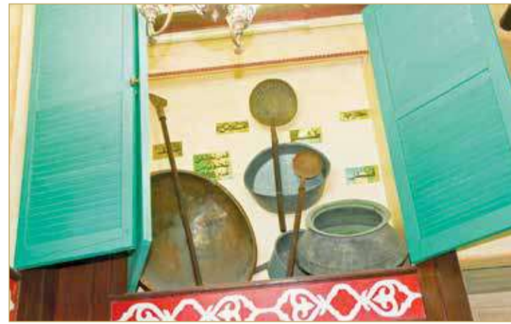
أقدم قدر لصناعة الحلوى في محل حسين شويطر في المحرق الذي يعود 1856

وأشار بالقول إلى أن "الحلوى البحرينية لا تحلو إلا بأهل الخليج، نرحب بإخواننا الخليجيين بمحلاتهم، وأهلا وسهلا بهم، حيث تعتبر الحلوى صوغتهم حين يعودون لأوطانهم، وهناك عشق