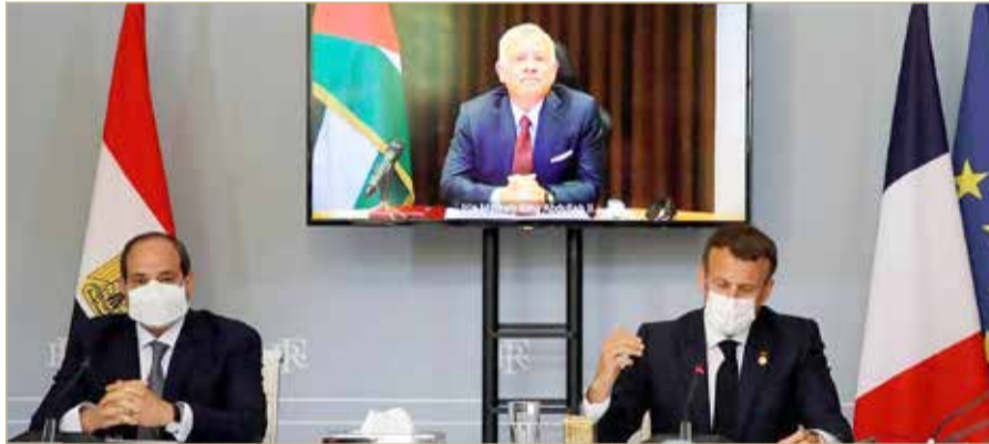
قمة ثلاثية بين الرئيسين الفرنسي والمصري والعاهل الأردني

أعلنت مصر أمس الثلاثاء تقديم مساعدة قيمتها 500 مليون دولار إلى غزة للمساهمة في إعادة إعمار القطاع بعد القصف الإسرائيلي الذي يتعرض له منذ أكثر من أسبوع. في حين أجرى الرئيس الفرنسي إيمانويل ماكرون ونظيره المصري عبد الفتاح السيسي مباحثات عبر الفيديو مع عاهل الأردن الملك عبد الله الثاني، إذ قال قصر الإليزيه إنها سعيًا لوساطة في التصعيد بين إسرائيل والفلسطينيين "مع هدف تحقيق وقف إطلاق نار سريع وتجنب توسع النزاع". وأعلن الديوان الملكي الأردني بدوره في بيان أن العاهل الأردني أجرى مباحثات عبر تقنية الاتصال المرئي مع ماكرون والسيسي حول التصعيد الأخير بين إسرائيل والفلسطينيين. وبحسب البيان، أكد الملك "ضرورة حماية الفلسطينيين ووقف جميع الاعتداءات والإجراءات الإسرائيلية غير القانونية في القدس، وإنهاء العدوان على غزة". كما أكد أنه "لا بد من وضع حد للانتهاكات والاستفزازات الإسرائيلية المتكررة التي قادت إلى التصعيد وتفاقم الأوضاع". ودعا العاهل الأردني إلى "بلورة جهد دولي فاعل يوقف التصعيد في الأراضي الفلسطينية، ويدفع باتجاه