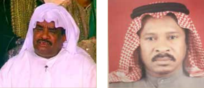
الفنان الراحل إبراهيم المسعد

وهي من الدور الشعبية المتميزة بالحفاظ على فنون السمرة وتختص هذه الدار بغناء الأصوات البحرينية والفنون الأخرى، ولها مشاركات عديدة في المناسبات العامة، وتعود سنة تأسيسها إلى العام 1959.