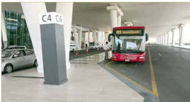
بوابة المطار وقد بدت خالية من سيارات الأجرة