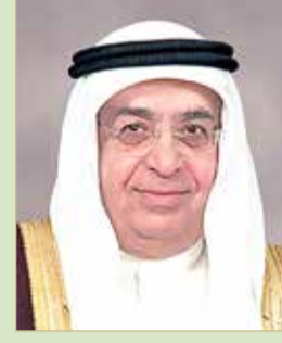
نائب رئيس مجلس الوزراء