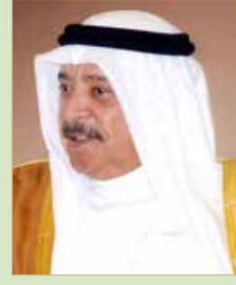
وزير الديوان الملكي