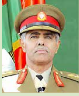
رئيس هيئة الزركان

هناؤه سموه بتعيينه رئيساً للمجالس إدارة الهيئات العامة للرياضة