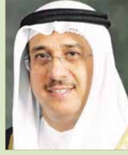
مستشار جلالة الملك لشؤون الاعلام