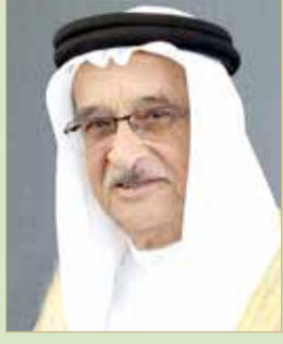
رئيس المجلس الأعلى للصحة