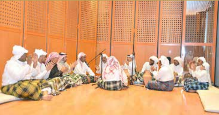
فرقة دار قلاي