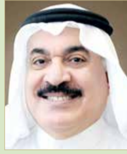
الرئيس التنفيذي لشركة "بنا غاز"