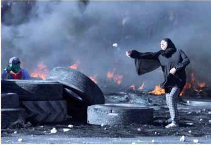
فلسطينية في مواجهة مع قوات الاحتلال جنوب مدينة نابلس بالضفة الغربية المحتلة

تصاعدت حدة القصف المتبادل على جانبي الحدود مع قطاع غزة، مع تأكيد وزير الدفاع الإسرائيلي أن "الحرب مستمرة"، فيما شهدت الضفة الغربية احتجاجات وصلت حد الاشتباكات المسلحة بين مسلحين فلسطينيين والقوات الإسرائيلية.