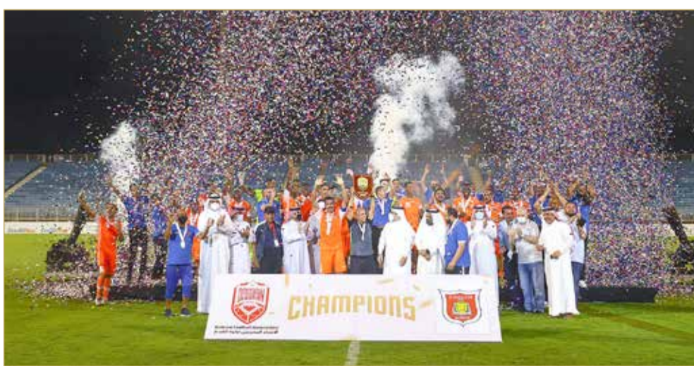
البلاد | أحمد مهدي

توج رئيس الاتحاد البحريني لكرة القدم الشيخ علي بن خليفة آل خليفة، نادي الحالة بطلا لدوري الدرجة الثانية للموسم الرياضي 2021/2020. جاء ذلك على هامش المباراة الختامية للدوري التي أقيمت مساء الثلاثاء على استاد مدينة خليفة الرياضية، وشهدت فوز الحالة على الخالدية بهدفين مقابل واحد، إذ سجل للحالة عبدالفتاح بشير هدفين وللخالدية تياغو أوغستو. وأنهى الحالة الدوري متصدراً برصيد 41 نقطة بفارق 3 نقاط عن الخالدية الوصيف وصعدا معا إلى دوري ناصر بن حمد الممتاز، فيما جاء الاتفاق ثالثاً برصيد 33 نقطة. وكان الاتفاق تعادل سلبيا مع الشباب يوم أمس أيضا.