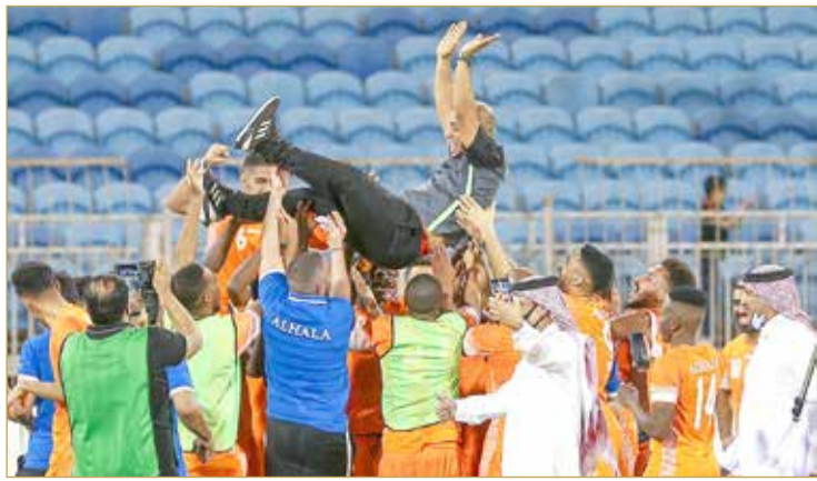
لقطات متنوعة من التتويج