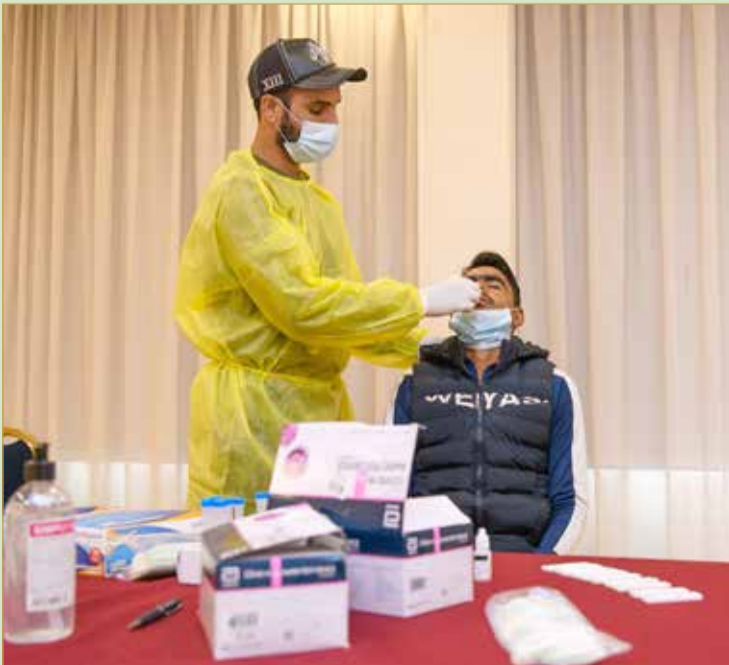
إجراءات طبية احترازية

وأوضح جناحي أن الفريق خاض معسكراً مغلقاً في البحرين قبل القدوم إلى إيطاليا، إذ اعتمد على تطبيق الخطة الفنية التي سيعتمد