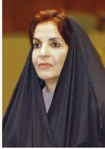
سمو الأميرة سبيكة بنت إبراهيم

ويأتي هذا القرار متسقاً مع توجيهات سموها حفظها الله في سرعة الاستجابة لما تمر به المملكة من ظروف استثنائية ومواكبة للأحداث في التصدي لجائحة كوفيد-19- وخصوصاً ما يتعلق باتخاذ الإجراءات والتدابير الاحترازية على المستوى المؤسسي للمجلس، وذلك من خلال المرونة في التخطيط والتنفيذ وإدارة المخاطر والتحديات مع الاعتماد على آليات مبتكرة