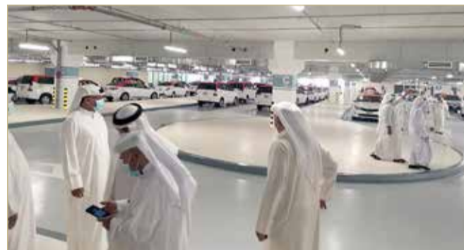
مواقف التاكسي بموقع بعيد عن بوابة المطار

ومن دون لافتات واضحة تدل على وجودهم، علمًا أن أجواء المملكة حارة في الصيف، مما يضطر الزائر إلى الخروج مع أغراضه الثقيلة وطلب سيارة لإيصاله إلى وجهته من أقرب موقف، ولذا يتعامل الزائرين مع السيارات الخاصة لإيصالهم إلى وجهاتهم داخل المملكة وبأى مبلغ.