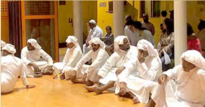
فرقة دار جناح