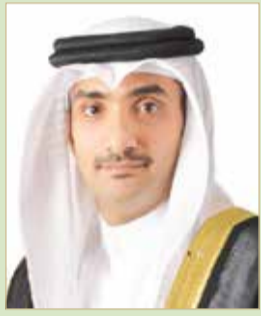
عبدالله بن خليفة