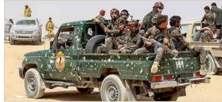
ميليشيا تابعة للحوثي