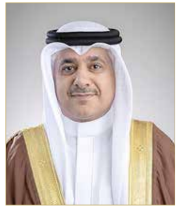
وزير المواصلات والاتصالات

♦ وزير “المواصلات” يهنئ ويدعو لمواصلة تطوير الخدمات