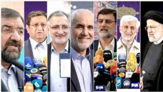
المرشحون للانتخابات الرئاسية الإيرانية