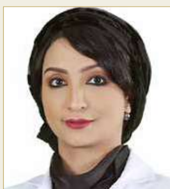
غفران أحمد جاسم

صاحب السمو الملكي الأمير سلمان بن حمد آل خليفة ولي العهد رئيس مجلس الوزراء.