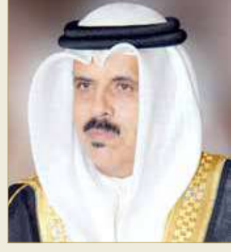
وزير التربية والتعليم

وأشار إلى أن هاتين الخدمتين الجديدتين تضافان إلى الخدمات الأخرى التي توفرها البوابة التعليمية، وتشمل الخدمات التعليمية، مثل الجدول الدراسي، وجدول الامتحانات، والدرجات، والحضور اليومي، والدروس، والإثراءات، والمحتوى التعليمي الرقمي، والأنشطة والتطبيقات، إلى جانب الخدمات الإدارية، مثل الإعلانات المدرسية، والفعاليات المدرسية، والتقارير والملفات الإدارية.