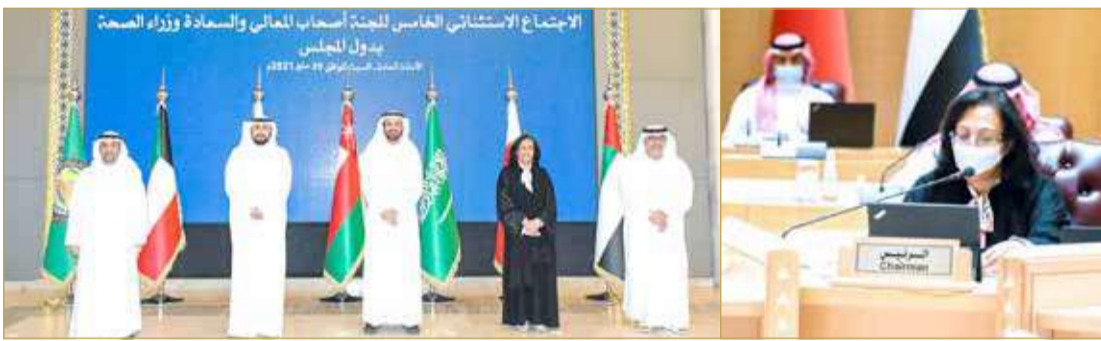
وزيرة الصحة تتراأس جلسة الاجتماع الخامس الاستثنائي لمعالي وزراء الصحة مجلس الصحة لدول التعاون الذي عقد بالعاصمة السعودية الرياض

وبعد المناقشات والمداولات قرر الوزراء في البيان الختامي عدداً من القرارات التي اعتمدها الوزراء، حيث تضمنت التوصيات الاستمرار في مجابهة فيروس كورونا المستجد، والتي تعزز من التنسيق والتعاون بين الدول الأعضاء.