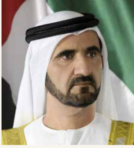
سمو الشيخ محمد بن راشد