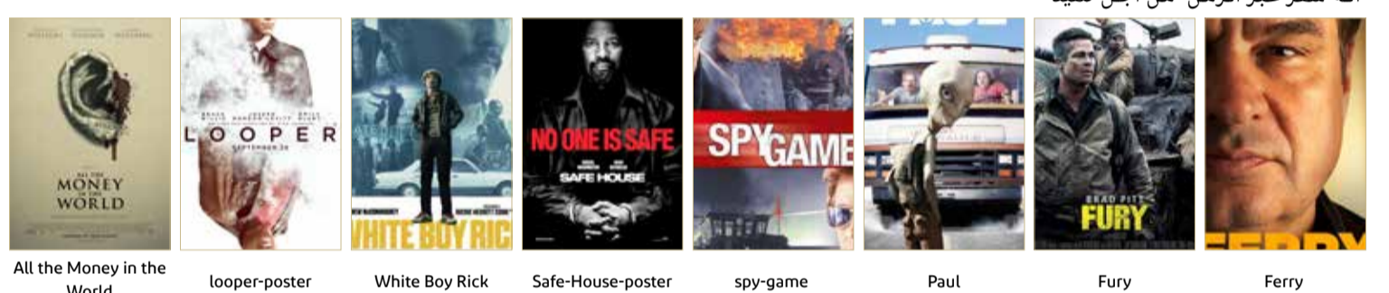
All the Money in the World | looper-poster | White Boy Rick | Safe-House-poster | spy-game | Paul | Fury | Ferry

عشاق أفلام الحروب، هذا اختار ممتاز من العام 2014 عن قائد دبابة يقود مهمة مليئة بالتضحيات والمواقف البطولية برفقة طاقمه، خلال الحرب العالمية الثانية بطاقم تمثيل كبير، وهو فيلم حربي ممتع مليء بالأكشن.