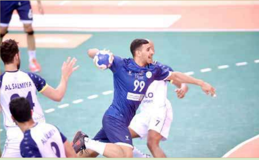
لقاء النجمة والسالمية