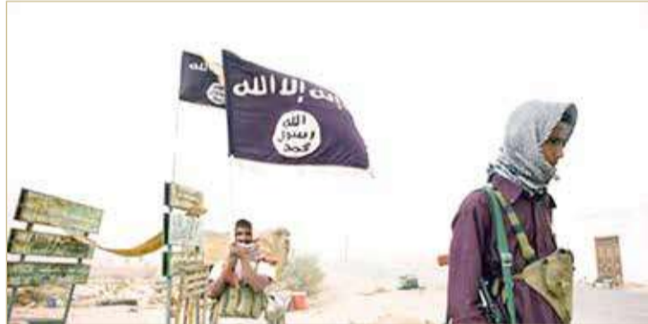
نقطة تفتيش لتنظيم "القاعدة" باليمن

خطف تنظيم القاعدة 6 عناصر في قوات الأمن في محافظة شبوة في اليمن، وفق ما أعلن مسؤول أمني يمني، في عملية نادرة تأتي في توقيت تشهد فيه البلاد حرباً مدعومة أتاحت عودة جماعات جهادية. ويسعى تنظيم القاعدة في شبه الجزيرة العربية وغيره من الجماعات المتطرفة إلى استغلال الفراغ الأمني الذي نجم عن النزاع الدائر منذ أكثر من 6 سنوات بين القوات الحكومية المدعومة من "التحالف" بقيادة السعودية والمتطرفين الحوثيين المدعومين من إيران. وجاء في تصريح أدلى به مسؤول أمني "خطف تنظيم القاعدة منفصلتين في محافظة شبوة".