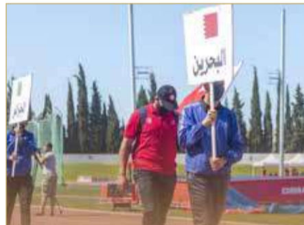
افتتاح منافسات البطولة العربية