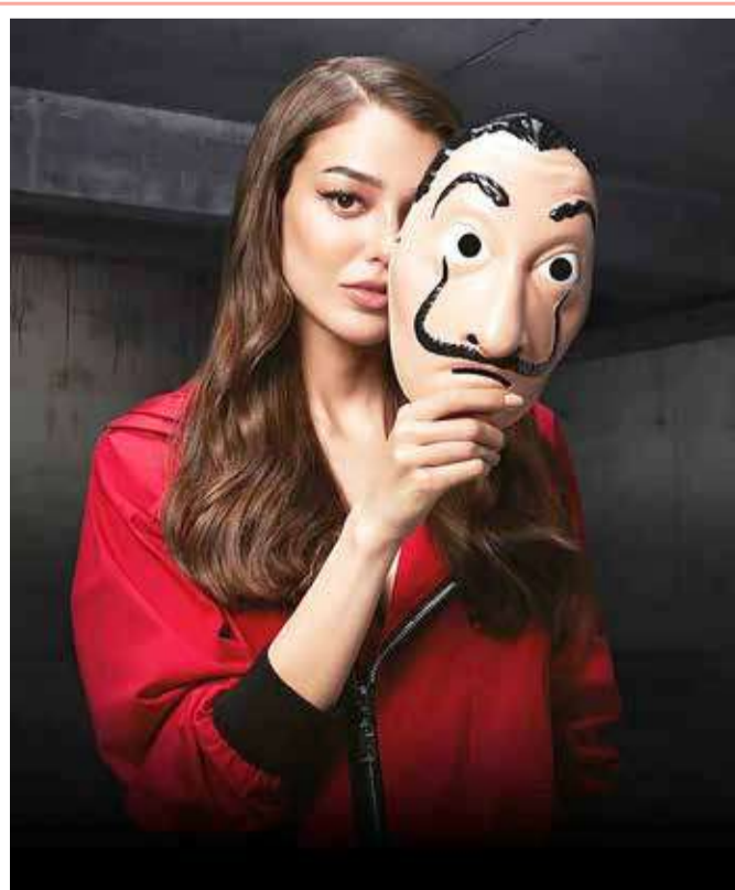
الممثلة التركية الحسنة "ديلان دينيز" تظهر بشخصية من شخصيات المسلسل الإسباني الشهير "البروفيسور" ضمن إعلان خاص له.

أكد عدد من الخبراء والمديرين التنفيذيين لمجموعة من الشركات أن العمل لمدة 5 ساعات فقط في اليوم يمكن أن يحسن الإنتاجية ويعزز الصحة العامة. وبحسب "ديلي ميل" البريطانية، فقد أكد الخبراء أن الدراسات تشير إلى أنه كلما زادت ساعات العمل انخفض تركيزنا وأصبحنا أقل حماسًا في أداء عملنا، الأمر الذي يدفعنا لارتكاب الأخطاء. والشهر الماضي، قالت منظمة الصحة العالمية: إن العمل لساعات طويلة يقتل مئات الآلاف من الأشخاص سنويًا. وأوضحت ورقة بحثية نُشرت في دورية (البيئة الدولية) أن 745 ألف شخص ماتوا بسبب الإصابة بسكتة دماغية أو أمراض القلب المرتبطة بالعمل لساعات طويلة في 2016.