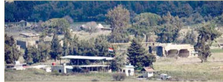
الشريط الحدودي عند منطقة القنيطرة