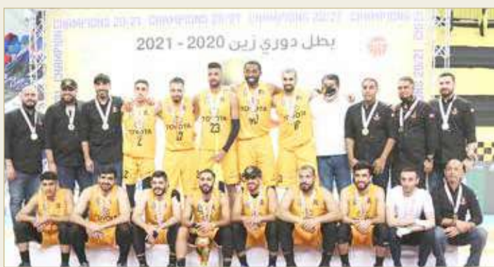
فريق الأهلي لكرة السلة

يستهل ممثل كرة السلة البحرينية فريق الأهلي اليوم (الجمعة) مشواره في البطولة الخليجية 40 للأندية أبطال الدوري بمواجهة فريق الشمال القطري وذلك في تمام الساعة الثالثة عصراً بتوقيت مملكة البحرين، والمباراة منقولة على قناة البحرين الرياضية. وتستضيف دولة الإمارات منافسات البطولة التي ستنتقل بضيافة نادي شباب الأهلي من 16 حتى 26 يونيو الجاري بجانب (الأهلي، النصر السعودي، الكويت الكويتي، الشمال