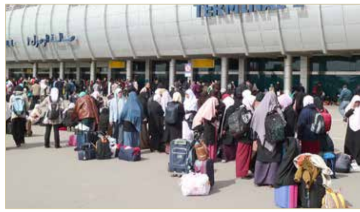
مجموعة من المسافرين الأجانب خارج مطار البحرين (أرشيفية)

◆ المملكة تحتضن 423 ألف وافد بمتوسط راتب 352 ديناراً