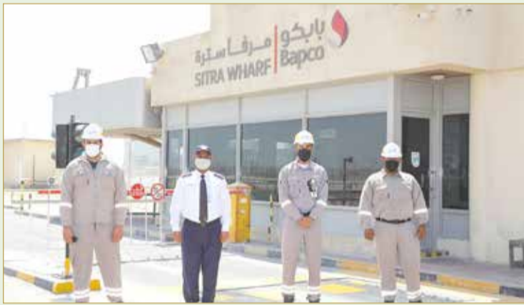
موظفو بابكو الذين قاموا بعملية الإنقاذ

في المياه، وأنهما طلبا المساعدة لإنقاذهما. وتم على الفور الاتصال بخفر السواحل والإسعاف الطبي، كما تم إخطار قسم العمليات البحرية في الميناء باستخدام أحد قوارب الإنقاذ لانتشال الشخصين. وعلى وجه