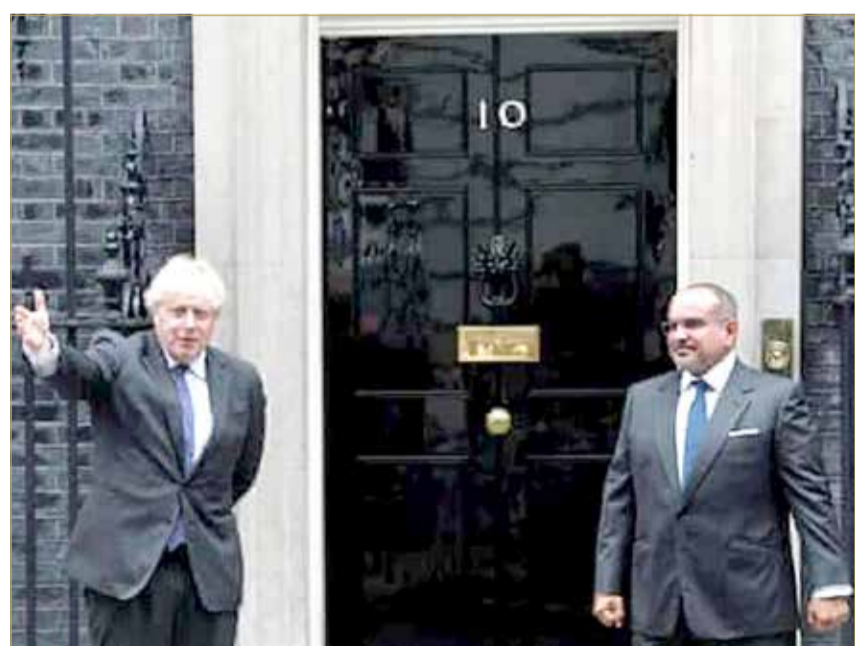
رئيس وزراء المملكة المتحدة مستقبلاً سمو ولي العهد رئيس مجلس الوزراء

سمو ولي العهد رئيس الوزراء: مواصلة التعاون العسكري والتجاري