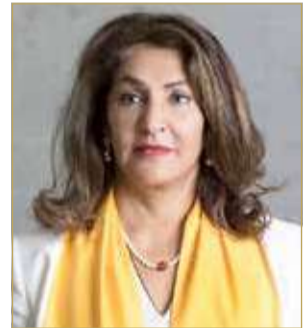
الشيخة هند بنت سلمان

المنامة - الاتحاد العالمي لصاحبات الأعمال