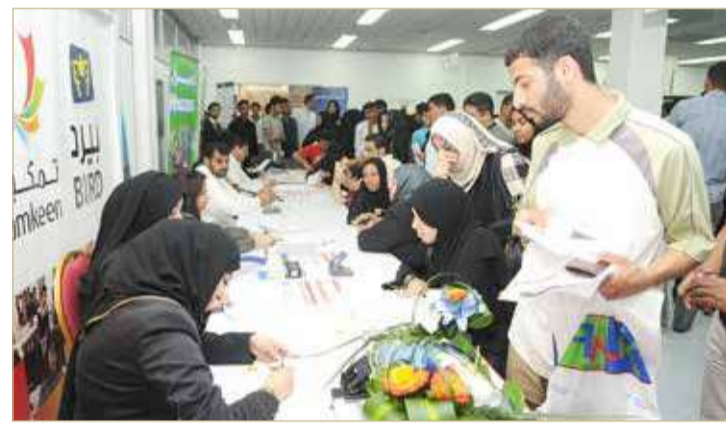
جانب من أحد معارض التوظيف (أرشيفية)

◆ 322 ديناراً لمن تقل أعمارهم عن 20 وتصل لـ 1656 لمن يتجاوز 60