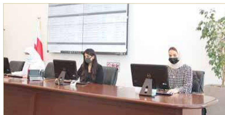
فتح 6 مناقصة تابعة لـ 4 جهات حكومية

عليها شركتان وكان أقل عطاء لـ (Onomo Hotel Casablanca City Center) بـ 28.6 دينارًا، والآخر بـ 29 دينارًا. وفتح المجلس مناقصتين لهيئة الكهرباء والماء، أولها لتوقيع عقد سنتين لصيانة الضواغط بنظام الهواء المضغوط في المحطات التابعة لإدارة نقل الكهرباء، تقدمت