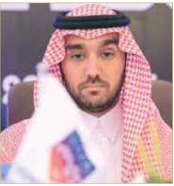
عبدالعزیز بن ترکی

مناسبة تزكيتهم رئيسًا للاتحاد العربي لكرة القدم