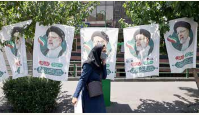
البرانيون يختارون رئيسا جديدا اليوم

جموع الناس. وفي هذا الدرب، تنكل على شعار الثورة، وهو "استقلال، حرية، جمهورية إسلامية"، لحد من مساعي البعض لإضعاف الجمهورية، معتبرين أن تحركهم يهدف للحؤول دون "الانسداد السياسي" وتفشي الإحباط. وذكر الناشطون أن "التيار الإصلاحي جرب مرارة التشتت والفرقة في انتخابات 2005 ولاحظ الجميع النتائج الممطرة لذلك، لذا ندعو قادة الإصلاحات والاعتدال والعقلاء في إيران لأن ينزلوا فوراً إلى الساحة ويعلموا خيارهم الجماعي ويقنعوا ويشجعوا الشعب الإيراني بغية المشاركة في الانتخابات والتصويت لهذا المرشح".