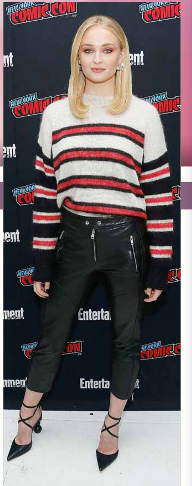
« احتفلت صوفي تيرنر منذ عدة أسابيع، بعيد زواجها من النجم جو جونس، بعد قصة حب دامت عدة سنوات طويلة، ونشرت مجموعة صور جديدة من كواليس حفل زفافهما، عبر حسابها بموقع "إنستغرام"، لتتغزل في زوجها بمناسبة العام الثاني من زواجهما، وكتبت "ذكرى زواج سعيدة لمدة عامين".»

بات الأشخاص الذين يتولون تحصيل الأجور والأموال في المتاجر على سبيل المثال مهدين يفقد وظائفهم، إذ توقع