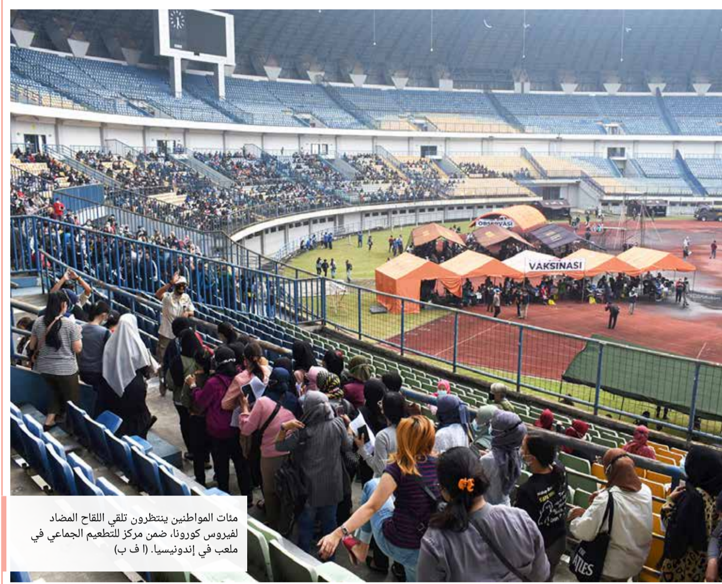
مئات المواطنين ينتظرون تلقي اللقاح المضاد لفيروس كورونا، ضمن مركز للتطعيم الجماعي في ملعب في إندونيسيا. (ا ف ب)

إدارة التحرير: +973 17111444 +973 17111467 385 @albiladpress.com 2008 تصدر عن دار البلاد للصحافة والنشر والتوزيع • س ت 67133 • تطبع في مؤسسة الأبرام للنشر • قسم الإعلانات: 508 / 17111501 +973 32224492 / 39615645 +973 17111432 +973 17111434