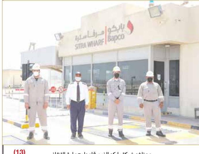
موظفو شركة بابكو الذين قاموا بعملية الإنقاذ (13)