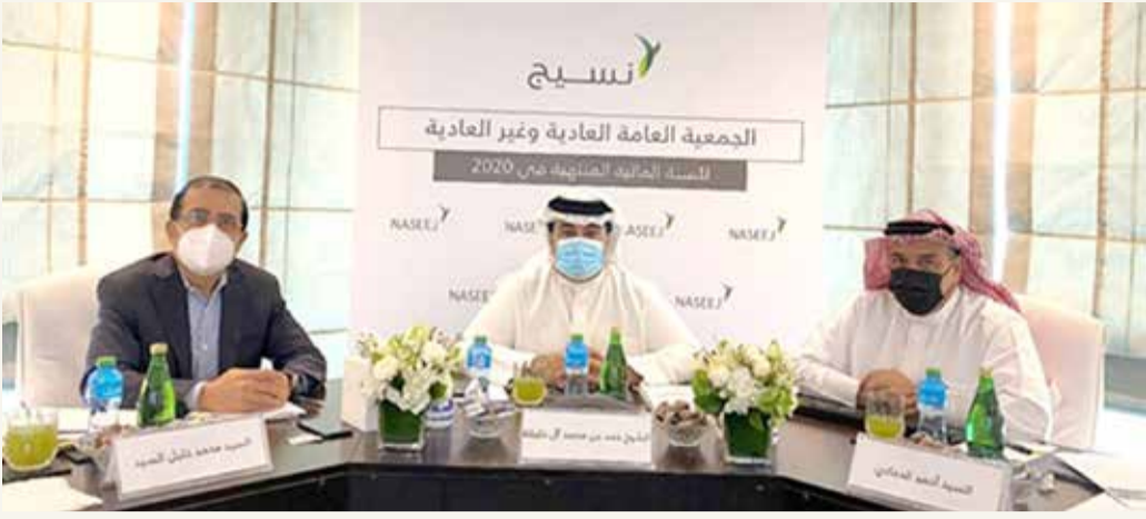
جانب من اجتماع "عمومية نسيج"

عقدت "عموميتها" عن بعد وتوزع أرباحا نقدية بـ 1.6 %