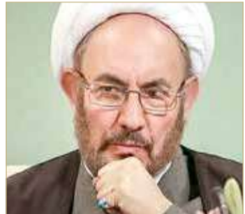
وزير الاستخبارات الإيراني السابق علي بونسي

توغل بمختلف القطاعات.. والمسؤولون لدينا قلقون على أرواحهم