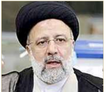
الرئيس المنتخب إبراهيم رئيسي

ل دوره في إعدام آلاف السجناء السياسيين سنة 1988