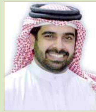
سلمان بن محمد

شهدته رياضة السامبو البحرينية من تطور في الفترة الماضية، شمل تأسيس اللعبة وإشهار الاتحاد البحريني للسامبو، وجهودها الواضحة في الحصول على عضوية الاتحادين الآسيوي والدولي، ومشاركتها الفاعلة في مختلف البطولات، وتحقيقها للعديد من الإنجازات، التي عززت من حضورها القوي قارياً ودولياً. وقد رفع سمو الشيخ سلمان بن محمد آل خليفة نائب رئيس الهيئة العامة للرياضة رئيس المجلس البحريني