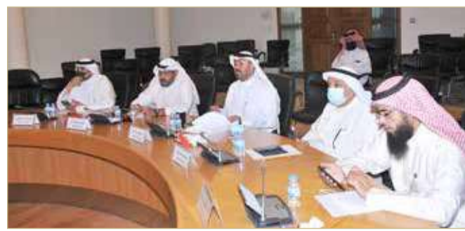
أعضاء مجلس المحرق البلدي خلال حضورهم الاجتماع الاعتيادي

أغلق مجلس بلدي المحرق باب اجتماعاته الاعتيادية للدور الثالث من الفصل التشريعي الخامس على صدمة أعضائه بعد العرض الأخير لمشروعات شؤون البلديات في المحافظة والبالغة 17 مشروعا بتكلفة تقديرية بلغت لعدد 10 منها 32 مليوناً و120 ألف دينار، توزعت على 8 ملايين دينار لمشروعات استثمارية و8 ملايين دينار لصالح مشروعات بعضها منجز وبعضها قيد الإنجاز، وعبر رئيس المجلس غازي الرباطي عن صدمة الأعضاء واستيائهم من التقرير الذي تضمن في أغلبيه مشروعات قائمة ومنجزة فعلا من ميزانيات السنوات السابقة، أو مشروعات يتولى القطاع الخاص تنفيذها، وتمثل مصدر إيراد للوزارة. وقال إن المشروعات الفعلية التي تضمنها التقرير لم تتجاوز تكلفتها 1% من الميزانية