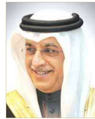
الشيخ سلمان بن إبراهيم

رفع الأمين العام للمجلس الأعلى للشباب والرياضة الشيخ سلمان بن إبراهيم آل خليفة فائق الشكر وعظيم الامتنان إلى مقام عاهل البلاد صاحب الجلالة الملك حمد بن عيسى آل خليفة؛ بمناسبة صدور الأمر الملكي السامي بإطلاق اسم المغفور له بإذن الله تعالى أحمد سالمين (رحمه الله) على الشارع المحاذي لنادي المحرق. وأكد الشيخ سلمان بن إبراهيم آل خليفة أن الأمر الملكي السامي يجسد الرعاية الفائقة التي تحظى بها الحركة الرياضية من لدن جلالته لأبناء البحرين المخلصين الذين بذلوا الغالي والنيس في خدمة الرياضة البحرينية وساهموا في وضع اللبنة الأساس لتطوير لعبة كرة