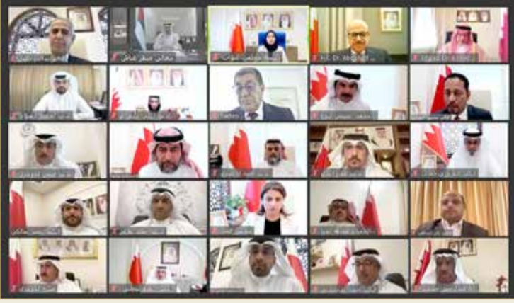
دعوة اليوم الدولي للعمل البرلماني

الدعوة لنمو اقتصادي "معقول" يولد فرص عمل للمواطنين ويقضي على البطالة