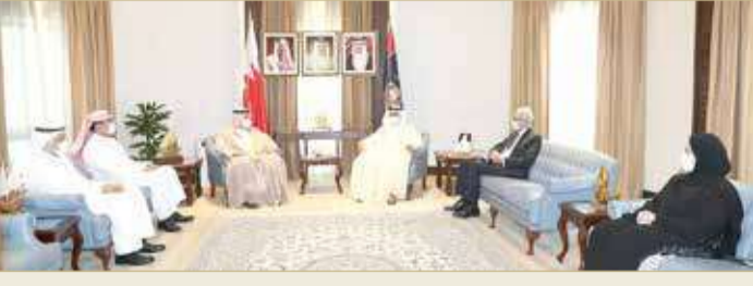
المنامة - وزارة الداخلية

♦ وزير الداخلية: تعزيز التنسيق بين الوزارات والجهات المعنية