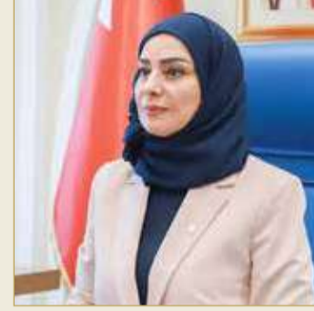
رئيسة مجلس النواب