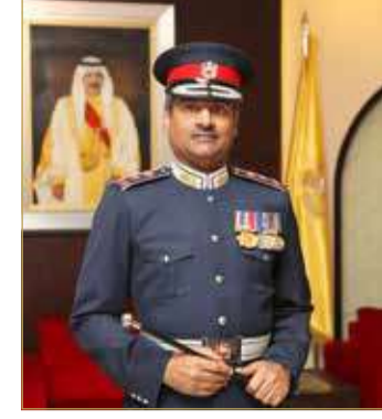
أمر الأكاديمية الملكية للشرطة

أماكن اللجان، والتأكد من الالتزام بالإجراءات الاحترازية التي تم اتخاذها، ومن بين هذه التدابير أن يكون المتقدم قد أتم جرعتي التطعيم ضد فيروس كورونا وإبراز الدرغ الأخضر ضمن تطبيق "مجتمع واعى" عند بوابة الدخول للأكاديمية، بالإضافة إلى إبراز نتيجة فحص (PCR) سلبية قبل الامتحان بـ (48) ساعة.