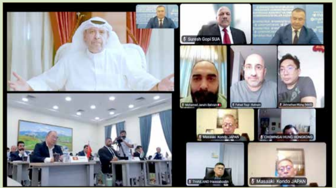
جانب من اجتماع الجمعية العمومية للاتحاد الآسيوي للسامبو

للألعاب القتالية، أسمى آيات التهاني والتبريكات إلى مقام حضرة صاحب الجلالة الملك حمد بن عيسى آل خليفة عاهل البلاد المقدي حفظه الله ورعاه، وإلى صاحب السمو الملكي الأمير سلمان بن حمد آل خليفة ولي العهد رئيس الوزراء حفظه الله ورعاه، وإلى سمو الشيخ ناصر بن حمد آل خليفة ممثل جلاله الملك للأعمال الإنسانية وشؤون الشباب رئيس المجلس الأعلى للشباب والرياضة، وإلى سمو الشيخ خالد بن حمد آل خليفة النائب الأول لرئيس