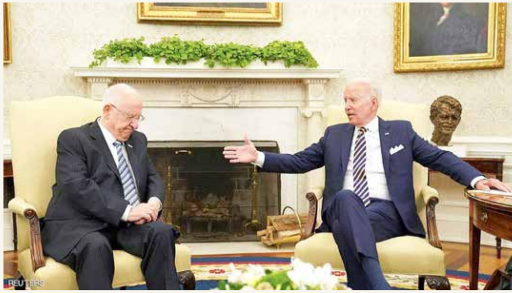
عواصم - وكالات

طهران تدرس تمديد الاتفاق التقني مع وكالة الطاقة الذرية