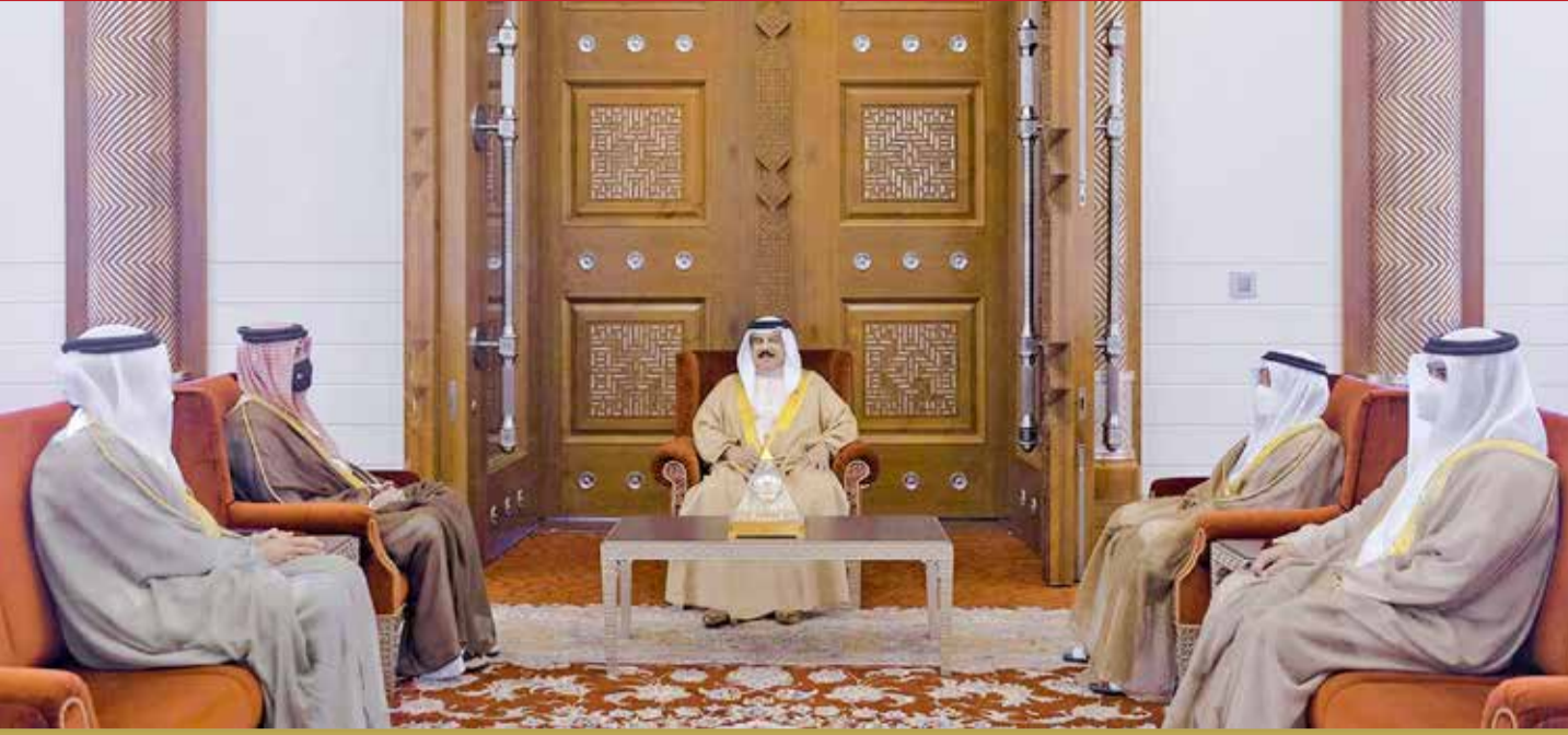
جلالة الملك مستقبلاً السفير خالد الجلاهمة