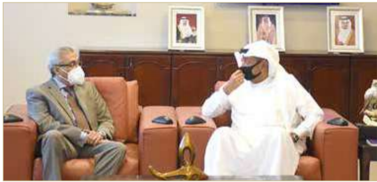
ناس مستقبلاً السفير المصري

♦ مشيدا بالنتائج المثمرة لزيارة وفد الخرفة للقاهرة