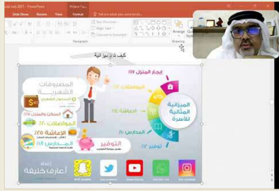
خليفة مستعرضاً خطة الميزانية المثالية للأسرة

وأكد خليفة ضرورة تجنب الوصول إلى هذه المراحل، إذ إن معظم أسباب الوصول لهذه المراحل هي الاقتراض من أجل الكماليات والرفاهية، مشيراً إلى أن حوالي 40 % من الأشخاص الذين يبلغون مراحل الاكتتاب المالي أو الإفلاس المالي يكون سبب حالهم أخذ القروض على القروض من أجل الكماليات.