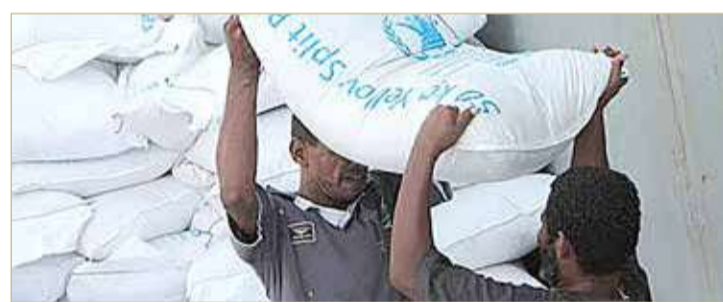
السعودية تمنح برنامج الأغذية العالمي 50 مليون يورو لدعم اليمن

منحت السعودية 50 مليون يورو لبرنامج الأغذية العالمي لمساعدة اليمن الفارق في أسوأ أزمة إنسانية في العالم، وفق ما أعلنت الوكالة الأممية أمس الخميس. في بيان له، رحب برنامج الأغذية العالمي الذي يتخذ مقراً له في روما بـ "مساهمة مركز الملك سلمان لإغاثة والأعمال الإنسانية بمبلغ 60 مليون دولار للمساعدة في تلبية الاحتياجات الغذائية العاجلة في اليمن".