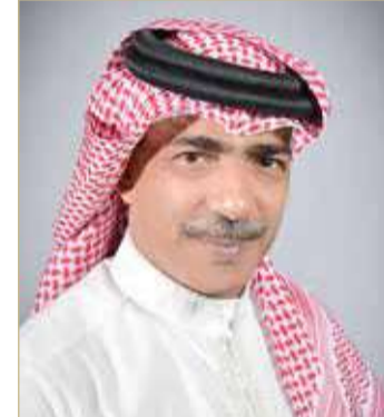
الشيخ علي بن محمد

أكد حرص اتحاد الطائرة على العمل وفق توجيهات سموه