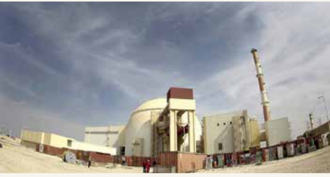
منشأة نطنز النووية

بدوره قال دبلوماسي آخر موجود في فيينا للوكالة إن الحادث في منشأة تخصيب اليورانيوم في نطنز في أبريل أسفر عن "تقييد بعض