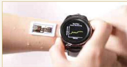
جهاز جديد قابل للارتداء يمكنه تحليل عرق الإنسان

ويتميز الجهاز بأنظمة موانع دقيقة ومتقدمة، إلى جانب كواشف كيميائية لونية لجمع قياسات الأس الهيدروجيني، وتحديد تركيز الكلوريد والكرياتينين والغلوكوز في عرق المستخدم. وعن أهمية المؤشرات التي يرصدها الجهاز، تقول كوون إنها قابلة للاستخدام في تشخيص الأمراض المختلفة المتعلقة بالتعرق مثل التليف الكيسي والسكري واختلال وظائف الكلى والقلاء التنفسي. وأوضحت: "نظراً لانفصال العرق المتدفق في قناة الموانع الدقيقة تماماً عن الدائرة الإلكترونية، تغلب الجهاز الجديد على أوجه القصور في أجهزة قياس معدل التدفق المتاحة الحالية، والتي كانت عرضة للتآكل والشيخوخة".