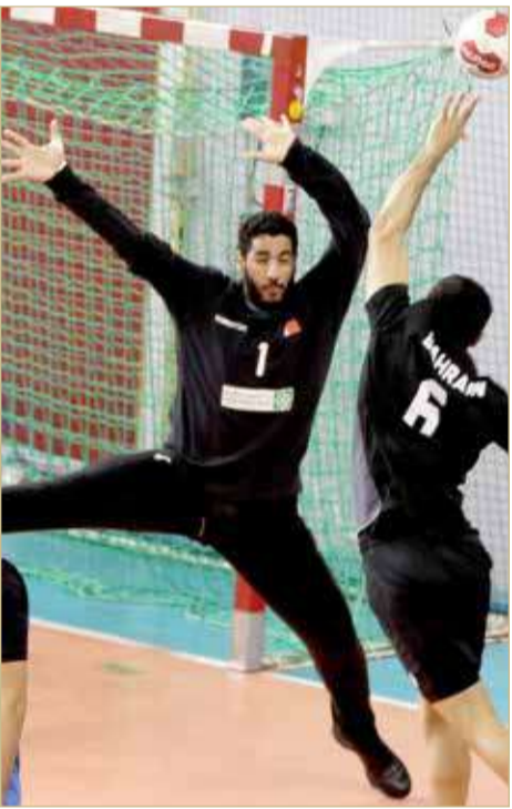
جانب من التدريب

استعداداً لدورة الألعاب الأولمبية باليابان