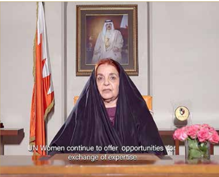
UN Women continue to offer opportunities for exchange of expertise

كلمة أريشيفية مسجلة لسمو الأميرة سبيكة بنت إبراهيم بنت أثناء الفعالية