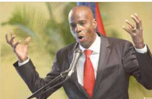
رئيس هايتي جوفينيل موز

المفترض تغييره هذا الأسبوع بعد ثلاثة أشهر في المنصب. إضافة إلى الانتخابات الرئاسية والتشريعية والمحلية، كان من المفترض أن تنظم هايتي استفتاء دستوريا في سبتمبر بعد إرجائه مرتين بسبب جائحة كوفيد. وتشهد هايتي تدهورا في الوضع الأمني لا سيما في شوارع العاصمة بور أو برنس. منذ مطلع يونيو تدور مواجهات بين عصابات متنافسة في غرب بور أو برنس وتشمل حركة السير بين النصف الجنوبي للبلاد والعاصمة الهايتية.