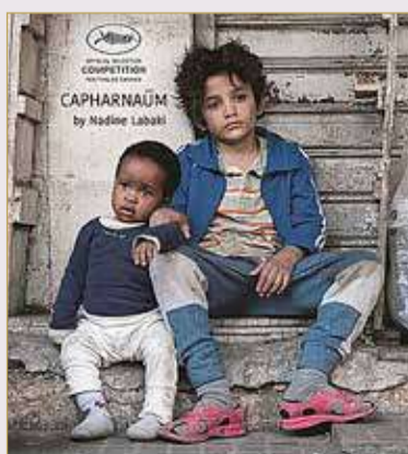
"كفرناحوم" لنادين لبكي

29. عرس الجليل، إخراج ميشيل خليفي. 30. وجدة، إخراج هيفاء المنصور. 31. كفرناحوم، إخراج نادين لبكي. 32. شباب امرأة، إخراج صلاح أبو سيف. 33. ربح الأوراس، إخراج محمد لاخضر حامينا. 34. الراعي والنساء، إخراج علي بدرخان. 35. ميرامار، إخراج كمال الشيخ. 36. مراتي مدير عام، إخراج فطين عبد الوهاب. 37. أسرار البنات، إخراج مجدي أحمد علي. 38. في شقة مصر الجديدة، إخراج محمد خان. 39. شقيقة ومتولي، إخراج علي بدرخان. 40. نورة، إخراج هالة خليل. 41. وهلاً لوين، إخراج نادين لبكي. 42. عفوا أيها القانون، إخراج إيناس الدغدي. 43. البوسطجي، إخراج حسين كمال. 44. شاطئ الأطفال الضائعين، إخراج الجيلالي فرحات. 45. أخضر يابس، إخراج محمد حماد. 46. عرائس من قصب، إخراج الجيلالي فرحاتي. 47. بنات وسط البلد، إخراج محمد خان. 48. يد الهبة، إخراج إيليا سليمان. 49. 3000 ليلة، إخراج مي المصري. 50. الطريق المسدود، إخراج صلاح أبو سيف.