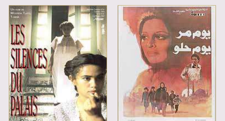
"يوم مر.. يوم حلو" لخيري بشارة "صمت القصور" لمفيدة التلاتي

يسعى الاستفتاء الذي نظمه المهرجان بمشاركة نحو 70 ناقداً من مختلف الدول العربية من المحيط إلى الخليج، إلى الإشارة لإبداع أجيال مختلفة من صناع السينما العربية، قدموا أعمالاً مهمة