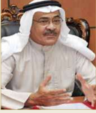
الشيخ خالد بن خليفة

الرسمية لجمهورية البرازيل الاتحادية، وما حقته هذه الزيارة من أصداء ناجحة على مستوى القارة الأمريكية الجنوبية والعالم. كما بحث المجلس في اجتماعه مستجدات برنامج الملك حمد للإيمان في القيادة مع جامعتي أكسفورد وكامبريدج العريقتين، إلى جانب برامج ودورات كرسي الملك حمد للحوار بين الأديان والتعايش السلمي في جامعة سايبينزا الإيطالية بالعاصمة روما، وإطلاق أكاديمية الملك حمد للسلام السيبراني، مؤكداً نجاح هذه البرامج والمبادرات في تأهيل جيل جديد من القادة الشباب والباحثين الطامحين لنشر السلام والمحبة بين كافة الشعوب.