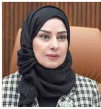
رئيسة مجلس النواب

وأكدت زينل أن مجلس النواب يدعم حرية الصحافة ويساند كل ما من شأنه تطوير المهنة، والاستعداد التام لمناقشة وإقرار مشروع قانون الصحافة والإعلام الجديد، عبر تبادل الآراء والملاحظات والمقترحات للعاملين في الصحافة الوطنية والوسائل الإعلامية البحرينية المختلفة، وذلك تعزيزاً للشراكة المجتمعية في صنع القرار الوطني ووصولاً لرؤية توافقية تهدف المصلحة العليا للوطن ومستقبله، ودعماً لحرية الإعلام المسؤول، وبما يعكس النهج الحضاري العصري المتطور لمملكة البحرين.