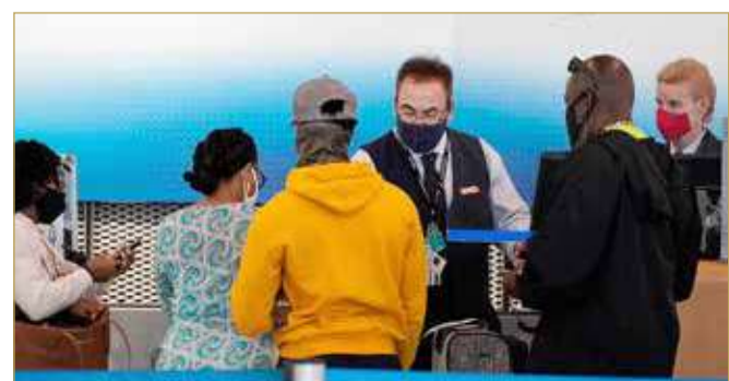
وأوضحت وسائل إعلام محلية أن المجموعة كانت تضم أكثر من 30 مرافقا من تلامذة الصفوف الثانوية آتين من بوسطن للاحتفال بتخرجهم. وإنه الأمر بموافقهم في اليوم التالي على وضع كمامات بعدما أمضوا ليلة في المطار، ولم تحجز الشرطة أي منهم.

تأخر موعد إقلاع طائرة تابعة للخطوط الجوية الأميركية "أميريكن إيرلاينز" من تشارلوت في ولاية نورث كارولينا إلى جزر الباهاماس يوما كاملا؛ بسبب رفض نحو 30 شابا وضع الكمامات، على ما أفادت وسائل إعلام محلية الثلاثاء. وأقفلت صباح الثلاثاء رحلة "أميريكن إيرلاينز" الرقم 893 أخيرا وبين ركابها الشبان المشاغبون بعدما كان من المقرر أن تغادر مطار تشارلوت دوغلاس الدولي الإثنين. وتأخرت الطائرة أولا ساعات عدة بسبب مشكلات ميكانيكية، ثم شهدت بعد ذلك اشتباكات بين مجموعة من الشبان الذين رفضوا الامتثال للقواعد المعمول بها في الولايات المتحدة، لجهة الإلزامية وضع جميع الركاب وأفراد الطاقم كمامات؛ من أجل مكافحة جائحة كوفيد-19. كما ذكرت قناة "ديليو إس أو سي" المحلية.