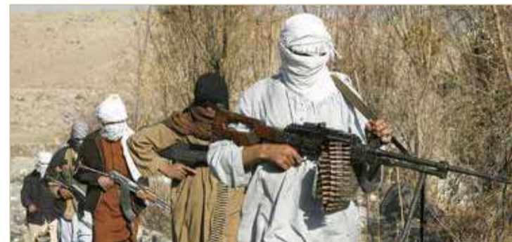
قتال عنيف في مدينة قلعة نو عاصمة ولاية بادغيس