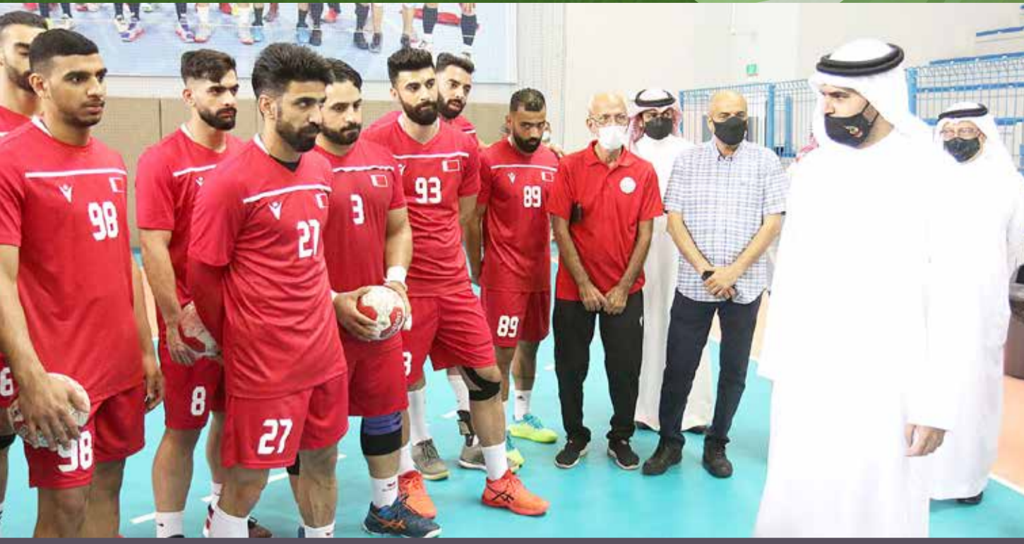
جانب من زيارة سمو الشيخ عيسى بن علي لمنتخب اليد