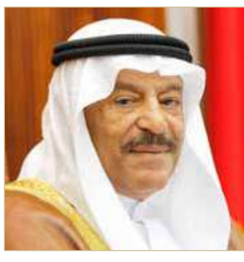
رئيس مجلس الشورى

الأمير خليفة بن سلمان آل خليفة (رحمه الله)، وما قدمه من مساندة ورعاية للصحافة البحرينية والصحافيين والإعلاميين على مدى عقود. وأشاد رئيس مجلس الشورى بالدور الذي يقوم به وزير شؤون الإعلام علي الرمحي ومساندته للصحافة البحرينية ووسائل الإعلام، مقدراً الجهود التي قامت بها الوزارة في تنظيم وإقامة جائزة سمو رئيس مجلس الوزراء للصحافة في نسختها الخامسة.