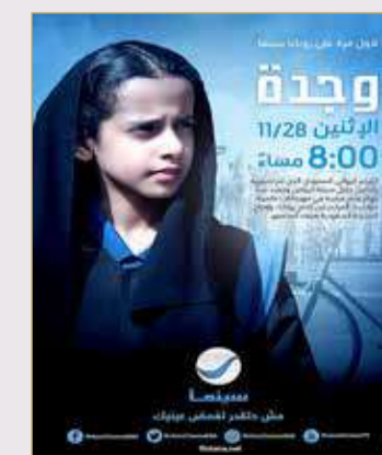
"وجدة" لهيفاء المنصور