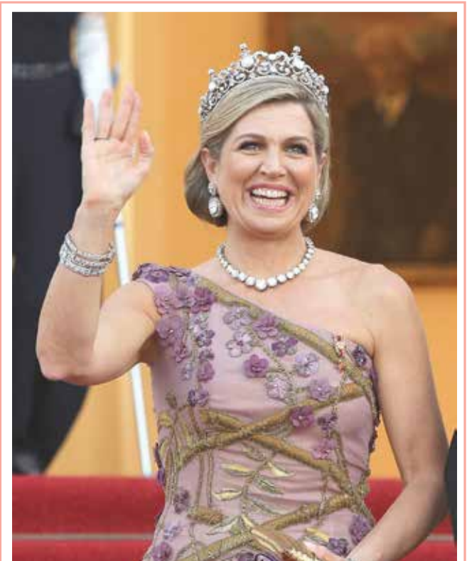
ملكة هولندا ماكسيما تلوح مع وصول الزوجين الملكيين لتناول عشاء رسمي على شرفهما في قصر بلفيو الرئاسي في العاصمة الألمانية، برلين