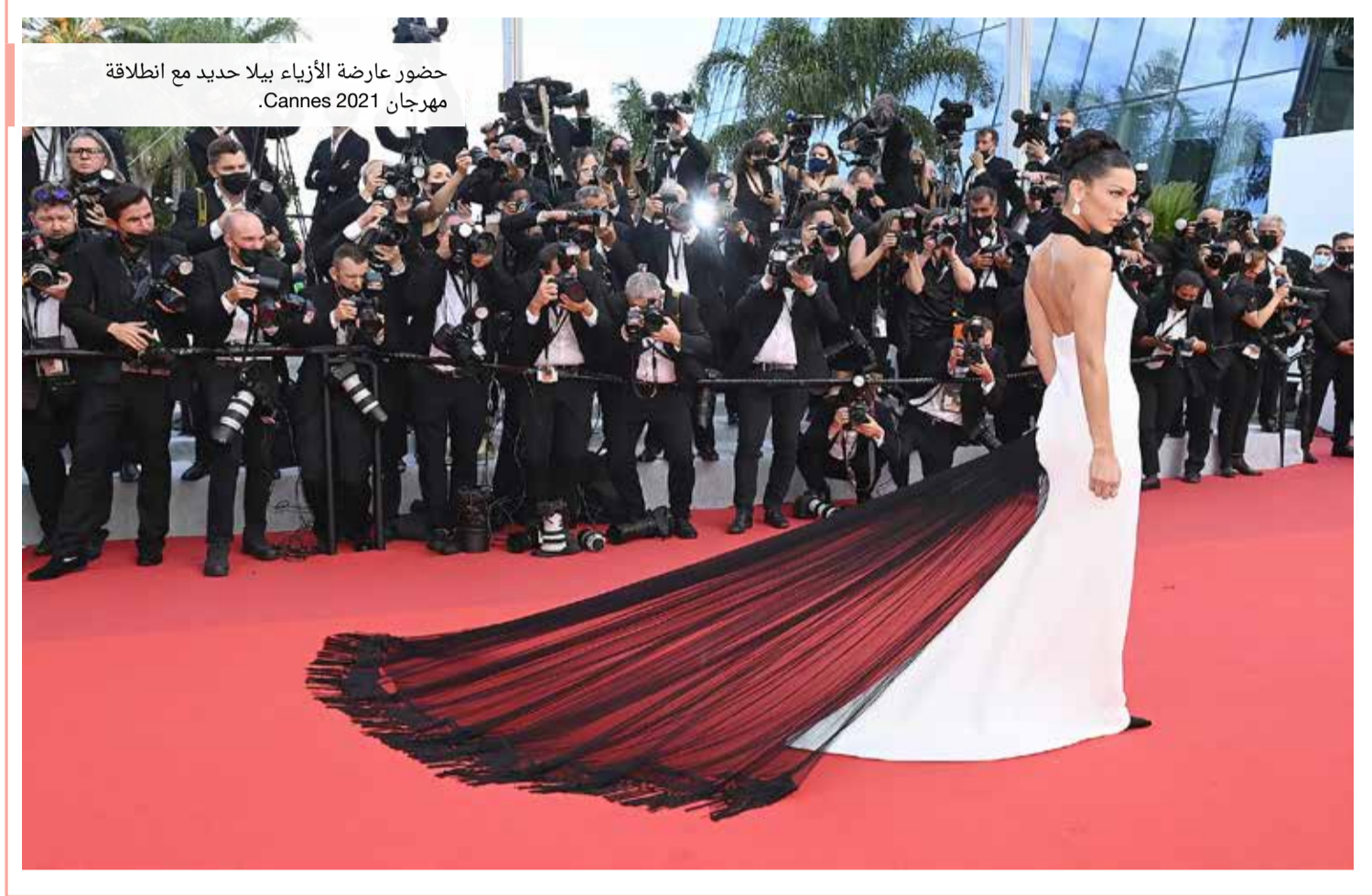
حضور عارضة الأزياء بيلا حديد مع انطلاق مهرجان Cannes 2021.

إدارة التحرير: +973 17111444 / +973 17111467 / 385 @albiladpress.com / 2008 تصدر عن دار البلاد للصحافة والنشر والتوزيع • س ت 67133 / طبع في مؤسسة الأبرام للنشر قسم الإعلانات: +973 17111501 / 508 / +973 32224492 / 39615645 / +973 17580939 / +973 17111432 / +973 17111434