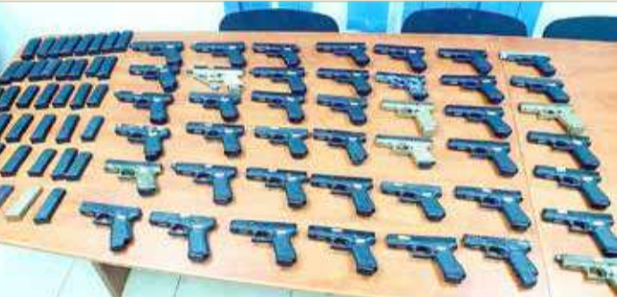
الجيش الإسرائيلي ضبط 43 قطعة سلاح

الحدود مع لبنان منذ بداية العام الحالي. وفي 18 يونيو الفائت، أعلن أدري عن إحباط الجيش والشرطة الإسرائيلييين محاولة تهريب أسلحة على الحدود مع لبنان بعد رصد مشتبه به قام بنقل حقيبة من لبنان في محيط بلدة المطلة، لافتاً إلى أنه بعدها جاء مشتبه به آخر لأخذ الحقيبة من الجانب الإسرائيلي.