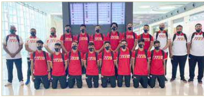
منتخب ناشئي السلة خلال مغادرته

استعداداً للبطولة الخليجية المؤهلة للآسيوية