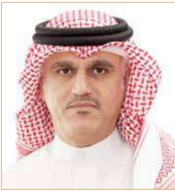
الشيخ محمد بن أحمد

بصفة دورية لضبط مخالفات الإشغالات التي تتسبب في الإضرار بالبيئة والطابع العمراني والجمالي للمناطق، وتشويه المظهر العام للمناطق، وللحد من شكاوى المواطنين من وجود هذه السيارات على أطراف الطريق العام، مما يصعب من حركة تنقلهم أثناء القيادة، علاوة على حجزها لأجزاء من الشوارع والأماكن المفتوحة وإشغالها للطريق العام. وأكد أن البلديات تتلقى الكثير من الشكاوى من المواطنين والمقيمين بشأن ترك السيارات بالقرب من منازلهم أو على أطراف الشوارع الداخلية أو وسط الحي السكني، وهي في حال مهمله ومهجورة ولا يعرفون أصحابها. ونوه وكيل البلديات إلى أن أمانة العاصمة والبلديات مستمرة في تنفيذ