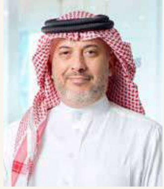
الشيخ خليفة بن إبراهيم آل خليفة

ما يعكس قطاعات السوق بشكل أدق. وتم تطوير معيار (GICS) من قبل S&P وMSCI العالميتين والمختصتين في مجال المعلومات المالية. وسيتم تصنيف الشركات المدرجة في بورصة البحرين حالياً وفق 7 قطاعات من أصل 11 قطاعاً رئيساً في المستوى الأول لمعيار GICS، وذلك بناءً على نشاط هذه الشركات المدرجة الأساسي، وهي: قطاع المواد الأساسية ويشمل (شركة مدرجة واحدة)، قطاع الصناعات ويشمل (السلع الرأسمالية، الخدمات التجارية والمهنية، والنقل)، وسيتم تضمين (3 شركات مدرجة)، قطاع السلع الاستهلاكية الكمالية ويشمل (الخدمات الاستهلاكية، تجزئة السلع الكمالية، السيارات ومستلزماتها، السلع المعمرة والملابس) وسيتم تضمين (5 شركات)، وقطاع السلع الاستهلاكية الأساسية ويشمل (تجزئة الأغذية، الأغذية والمشروبات والتبغ، المنتجات المنزلية والشخصية) وسيتم تضمين (4 شركات)، قطاع المال ويشمل (البنوك، التأمين، الاستثمار والتمويل) وسيتم تضمين (22 شركة