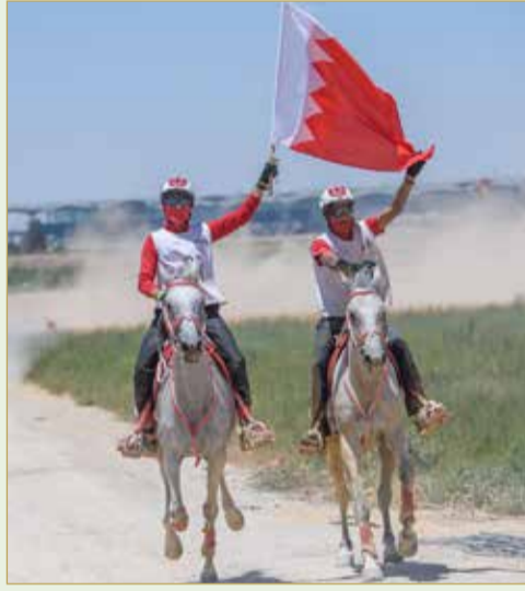
علم البحرين يرفرف