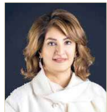
الشيخة هند بنت سلمان

في إطار استعدادات تنظيم مؤتمر «جائزة تحدي ريادة الأعمال 2021»