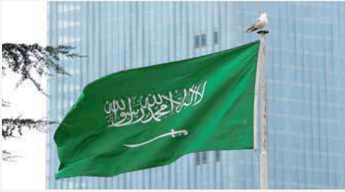
السعودية، القضية الفلسطينية كانت ومازالت القضية الأولى للمملكة

وأوضح أن "تقرير مايكل لينك يوضح بشكل جلي تدهور حالة حقوق الإنسان للفلسطينيين في الضفة الغربية والقدس الشرقية وغزة هذا عدا التصعيد الأخير للغنف في حي الشيخ جراح وسلوان، وما صاحبه من عمليات إخلاء قسرية للعائلات الفلسطينية من منازلهم، واستخدام القوة المفرطة داخل المسجد الأقصى، ومنع وصول المصلين خلال شهر رمضان". وكان لينك قد قدم لمجلس حقوق الإنسان خلال الحوار التفاعلي، تقريراً أكد فيه أن المستوطنات الإسرائيلية ترقى إلى مستوى جرائم الحرب بموجب نظام روما الأساسي للمحكمة الجنائية الدولية.