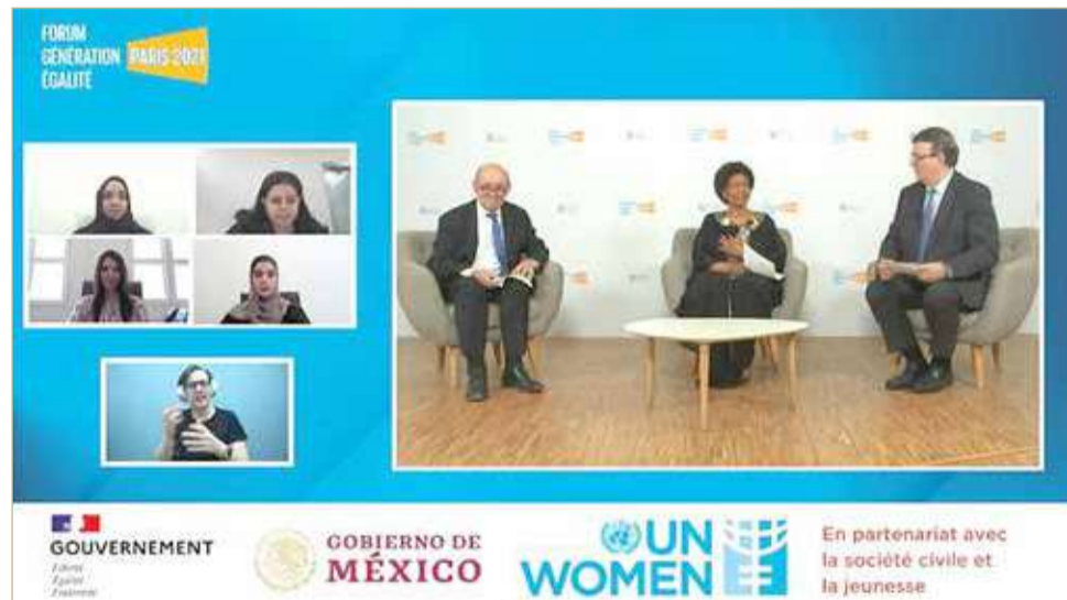
مشاركة المجلس الأعلى للمرأة في الجلسة الختامية لمنتدى جيل المساواة بباريس

وكانت من أهم مخرجات المنتدى إقامة شراكات عابرة للأجيال ومتعددة الأطراف ومستدامة تهدف إلى تكثيف الجهود المبذولة وتقديم التعهدات وإقامة الأنشطة العالمية بشأن القضايا الرئيسية المتعلقة بتحقيق المساواة والتوازن بين الجنسين، لاسيما في سياق الوضع الراهن مع انتشار جائحة (كوفيد 19) وتداعياتها، إضافة إلى العمل على التنسيق الفعال للقضاء على العنف ضد النساء والفتيات واتخاذ إجراءات ملموسة في الوقت المناسب للتخفيف من المخاطر، إلى جانب تعزيز المساءلة والدعم والمشاركة للمنظمات النسائية والمنظمات ذات الشأن النسائية المستقلة، والقضاء على ظاهرة زواج الأطفال والقتل