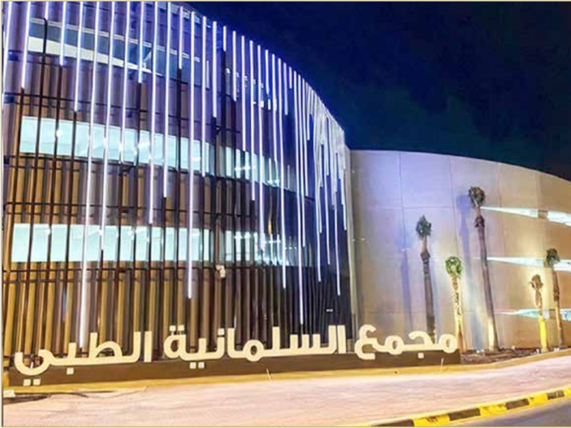
مجمع السلامة الطبية

«الطوارئ» يستقبل 394 ألف مراجع منذ 2020 حتى مايو 2021