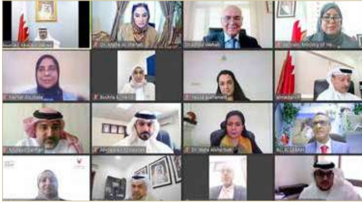
المنامة - وزارة الداخلية

تعميم المشروع على جميع المدن ومناطق المحافظة