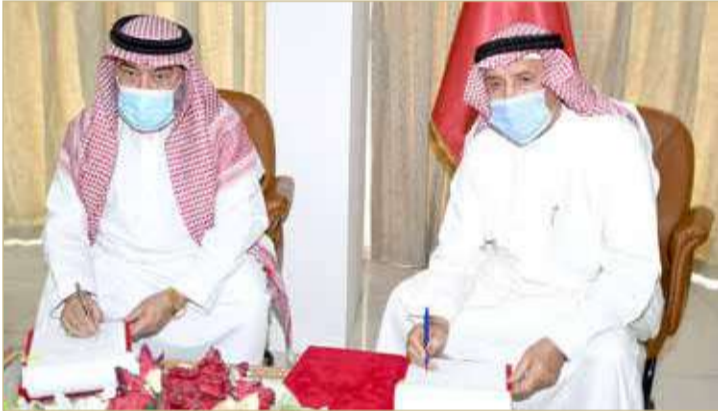
البيستين - محافظة المحرق

بن هندي يشيد برغبة الشباب في التحصيل العلمي