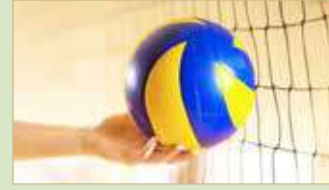
هل تحضن تونس البطولة العربية للناشئين؟

هل تعيد الجامعة التونسية والاتحاد النظر في تنظيم الحدث؟