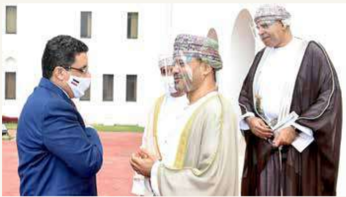
وزير الخارجية العماني بدر بن حمد بن حمود البوسعيدي مع نظيره اليمني

وعلى صعيد الملف السوري، أكد وزير الخارجية دعم بلاده لعودة سوريا إلى الجامعة العربية. يذكر أن مسقط كانت استقبلت في شهر مارس الماضي وزير الخارجية السوري فيصل المقداد.