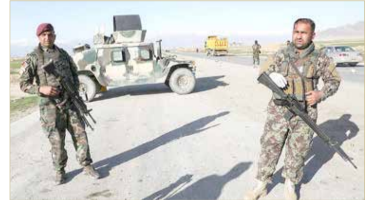
قوات أفغانية في كابول

تستعد لاستعادة معبر حدودي رئيسي، سيطر عليه مسلحو حركة "طالبان". وقال المتحدث باسم حاكم هرات، جيلاني فرهاد، إن السلطات تستعد لنشر قوات جديدة لاستعادة إسلام قلعة، أكبر معبر تجاري بين إيران وأفغانستان.