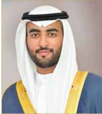
الشيخ نايف بن خالد

نشرها في الموقع الإلكتروني للمجلس وتحديثها بصورة ربعية