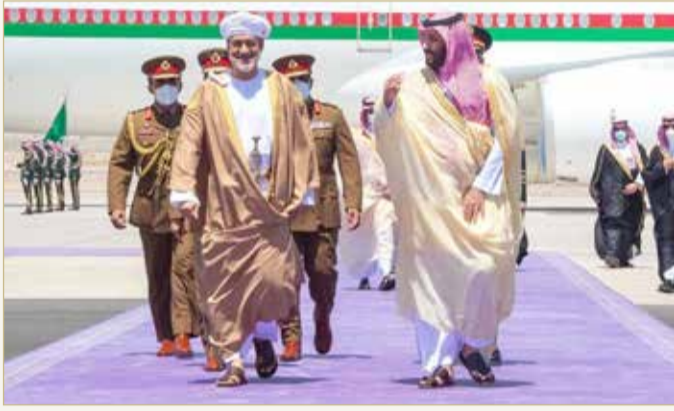
ولي العهد السعودي مستقبلا بمطار خليج نيوم السلطان هيثم بن طارق

ووقع الجانبان مذكرة تفاهم لإنشاء "مجلس التنسيق المشترك" بهدف