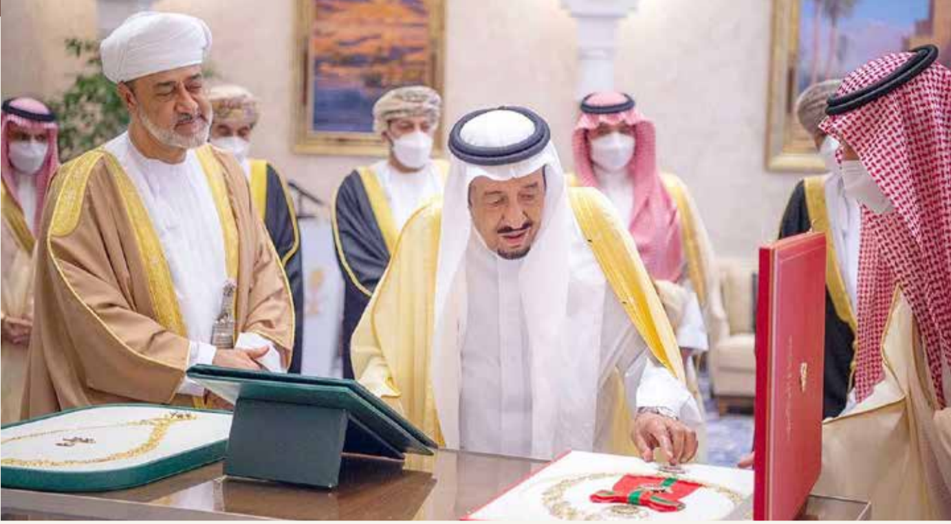
وسام عُثَماني رفيع لخدام الحرمين وقلادة الملك عبدالعزيز لسلطان عمان

ونقلت وكالة رويترز للأنباء عن مسؤول دفاعي أميركي أن نيراناً غير مباشرة استهدفت القوات الأميركية في شرق سوريا يوم السبت، لكن التقارير الأولية لم تشر إلى وقوع أي إصابات أو أضرار.