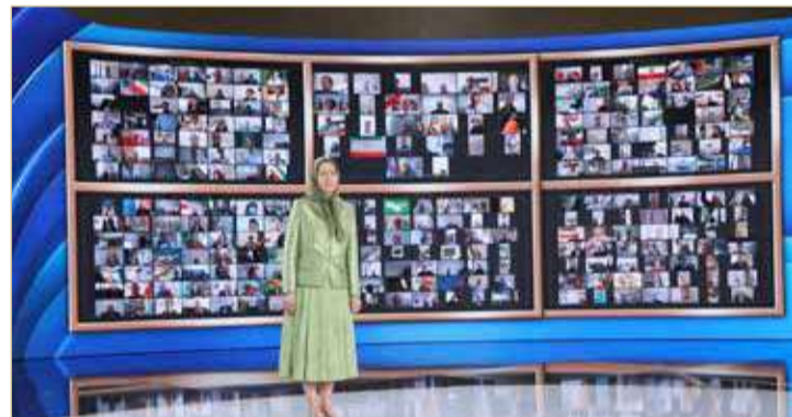
مريم رجوي خلال المؤتمر

وكانت "منظمة مجاهدي خلق" الإيرانية المعارضة قد افتتحت مؤتمرها السنوي العام يوم السبت بتوجيه انتقادات حادة للرئيس الإيراني المنتخب إبراهيم رئيسي. وأدانت رئيسة "المجلس الوطني للمقاومة الإيرانية" مريم رجوي في كلمتها الانتخابية الرئاسية الإيرانية ووصفتها بـ "الزائفة". ومؤتمر "منظمة مجاهدي خلق" هذا العام يُعتبر غير مسبق من حيث الحجم.