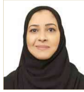
الشبيخة مي آل خليفة

وبهذه المناسبة، ثمنت مدير إدارة التحريات المالية، الدعم والمساندة من قبل وزير الداخلية، رئيس لجنة مكافحة التطرف والإرهاب وتمويله وغسل الأموال لدور مملكة البحرين وجهودها الوطنية في مجال مكافحة جرائم غسل الأموال وتمويل الإرهاب وتحجيف منابعه، مشيدة بانعكاس هذا الدعم