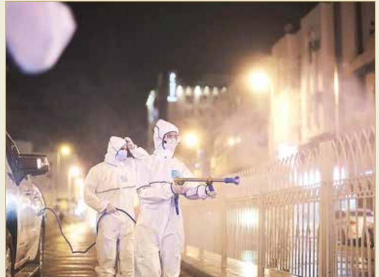
جهد كبير للمتطوعين في مواجهة "كوفيد 19"

التعليم الافتراضي وتمكن مملكة البحرين إلى حد كبير من مواصلة العملية التعليمية عن بعد، استناداً إلى ما توصلت إليه البنية الرقمية في التعليم في مدارس مملكة البحرين من إمكانية متقدمة، سهلت على المؤسسات التعليمية عمليات تطبيق تقنية المعلومات والاتصالات في إدارة الفصول الدراسية والوصول إلى الطلبة بالمواد الأساسية لضمان سير العملية التعليمية بأقصى ما يمكن. واتخذت مؤسسات التعليم الخاص الأساسي والتعليم العالي خطوات سباقية على مستوى المنطقة بدمج التقنية في التعليم وتوفير منصات التعلم الإلكتروني المختلفة للطلبة عبر استخدام تقنيات المعلومات والاتصالات والأدوات التعليمية الرقمية، حيث بلغت