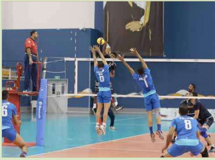
عالي في إحدى لقاءاته بدوري عيسى بن راشد الموسم الماضي

الميزانية تشكل تحدياً كبيراً للنادي عالي، ومع ذلك فإن النادي سيعمل على إحداث نوع من التوازن بين التعاقدات والمصروفات بما لا يؤدي إلى وقوعه في المزيد من الديون خصوصاً وأنه على اعتاب نهاية دورة انتخابية وبما يسهم في تحقيق نتائج إيجابية وواقعية في الوقت ذاته. وأوضح أن النادي يسعى لوضع خطة