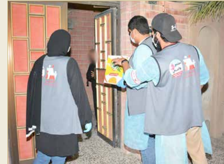
العمل الميداني في حملة "متكافئين"