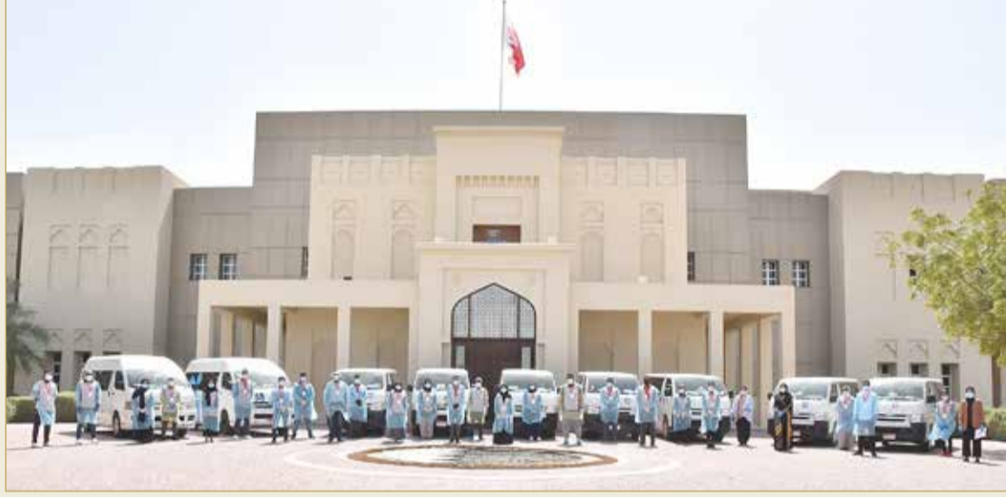
الصورة الجماعية للمتطوعين بحملة "متكافئين"

"الوطنية للتطوع" ومن مبدأ المسؤولية المجتمعية وتعزيزًا للتكافل والتعاون بين أفراد المجتمع في مملكة البحرين في ظل جائحة "كوفيد 19" تم تفعيل المنصة الوطنية للتطوع، وهي منصة إلكترونية تتيح للمواطنين والمواطنات من كافة الأعمار ومجالات الاختصاص فرص التطوع وتلبية النداء الوطني من خلال المساهمة في المجالات المختلفة ضمن الحملة الوطنية للتصدي للجائحة، إذ تم توفير فرص تطوعية في مجالات الدعم الطبي واللوجستي والإداري والعمل الميداني. وقد شهدت المنصة تجاوبا وإقبالا كثيفا من المواطنين والمقيمين للمساهمة من خلال التطوع بالوقت والجهد، وبما يعكس مرة أخرى ريادة مملكة البحرين في مجال العمل التطوعي بمختلف الميادين والمجالات، وقد بلغ عدد المسجلين على المنصة منذ إنطلاقها ما يزيد عن 30 ألف متطوع وصلت نسبة النساء من بينهم إلى 49%.