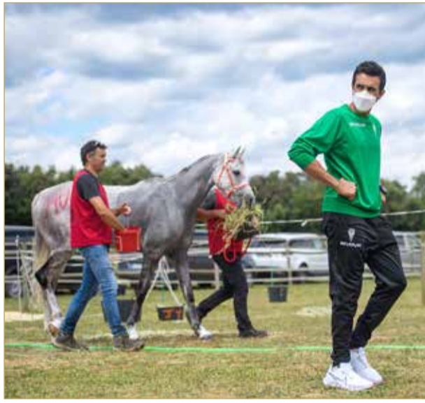
سمو الشيخ ناصر بن حمد خلال حضوره المنافسات

الفريق الملكي يتوج بلقب سباق 160 كم بجدارة واستحقاق