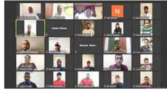
جانب من الدورة

مشيراً إلى أن الدورة جاءت الثانية من نوعها التي ينظمها الاتحاد بعدما تم تنظيم الدورة الأولى في أبريل الماضي. واشتملت الدورة على محاور متنوعة تهدف لإكساب الإداريين خبرات مختلفة في مجالات عدة تضمن أداء عملهم باحترافية ومهنية كبيرة ومواكبة للعمل الإداري الحديث في كرة القدم. ولفت البوعيين إلى النجاح الواسع الذي حققته الدورة في دفعها الثانية