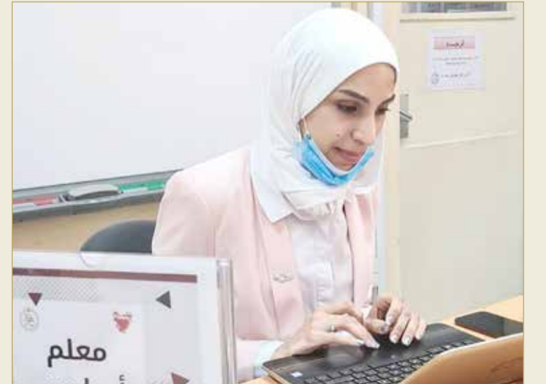
مواصلة التعليم عن بعد