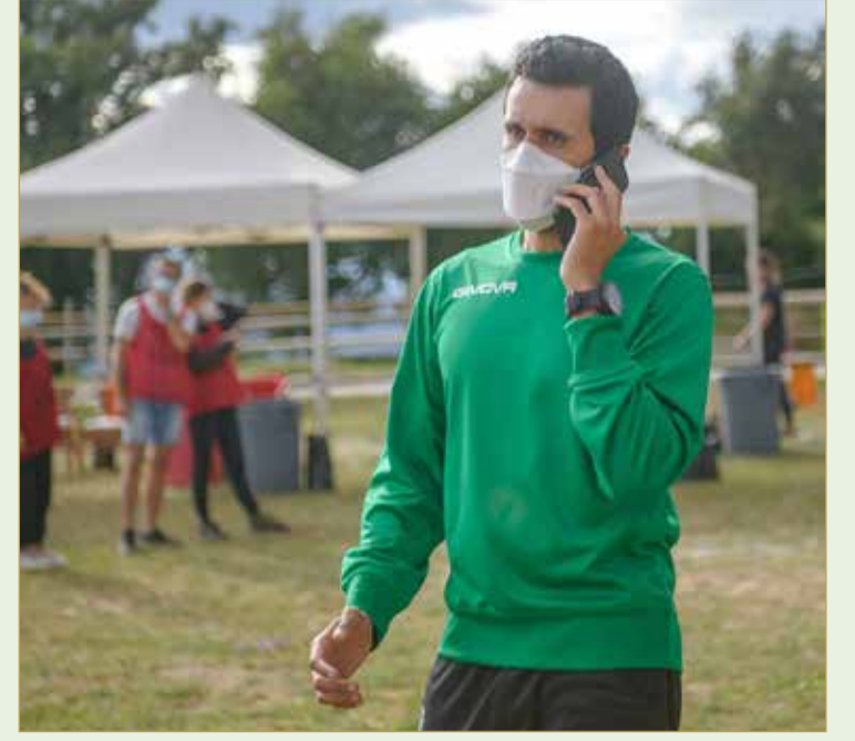
اتصال جلالة الملك إلى سمو الشيخ ناصر بن حمد

الملك الهنائي سمو الشيخ ناصر بن حمد آل خليفة؛ بمناسبة حصول الفريق الملكي للقدرة على لقب بطولة إسبانيا الدولية للقدرة لمسافة 160 كم عبر فوز الفارس راند محمود بالمركز الأول في السباق الذي أقيم في إسبانيا بمشاركة واسعة، مشيداً سموه برعاية جلالة الملك لرياضة القدرة، الأمر الذي ساهم بمواصلة حصد الإنجازات الخارجية لمملكتنا الغالية وتأكيد ريادة القدرة البحرينية في جميع المحافل الخارجية. وأشاد سمو الشيخ ناصر بن حمد آل خليفة باهتمام ولي العهد رئيس مجلس الوزراء صاحب السمو الملكي الأمير سلمان بن حمد آل خليفة، إذ إن هذا الاهتمام والدعم له الأثر الإيجابي الكبير على الفريق، الذي كتب من خلاله اسمه بأحرف ذهبية.