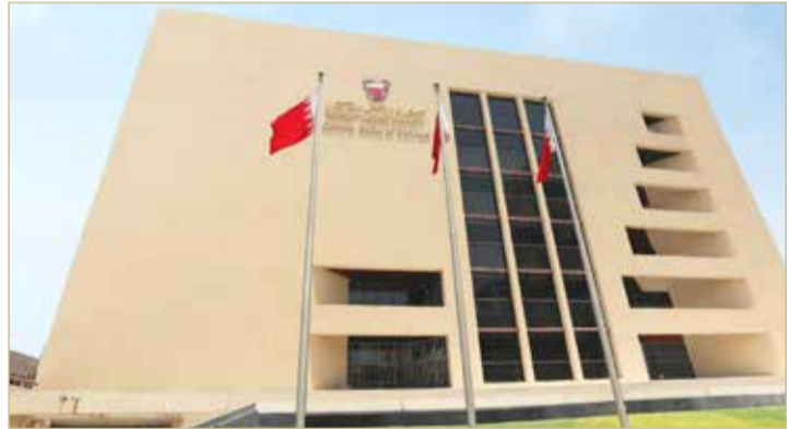
البلاد | علي الفردان

تلقى مصرف البحرين المركزي ما مجموعه 54 شكوى من عملاء البنوك التجارية وشركات التأمين.