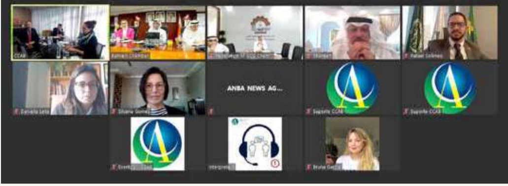
السنابس - بيت التجار

خلال لقاء بين اتحاد الغرف الخليجية والغرفة العربية البرازيلية