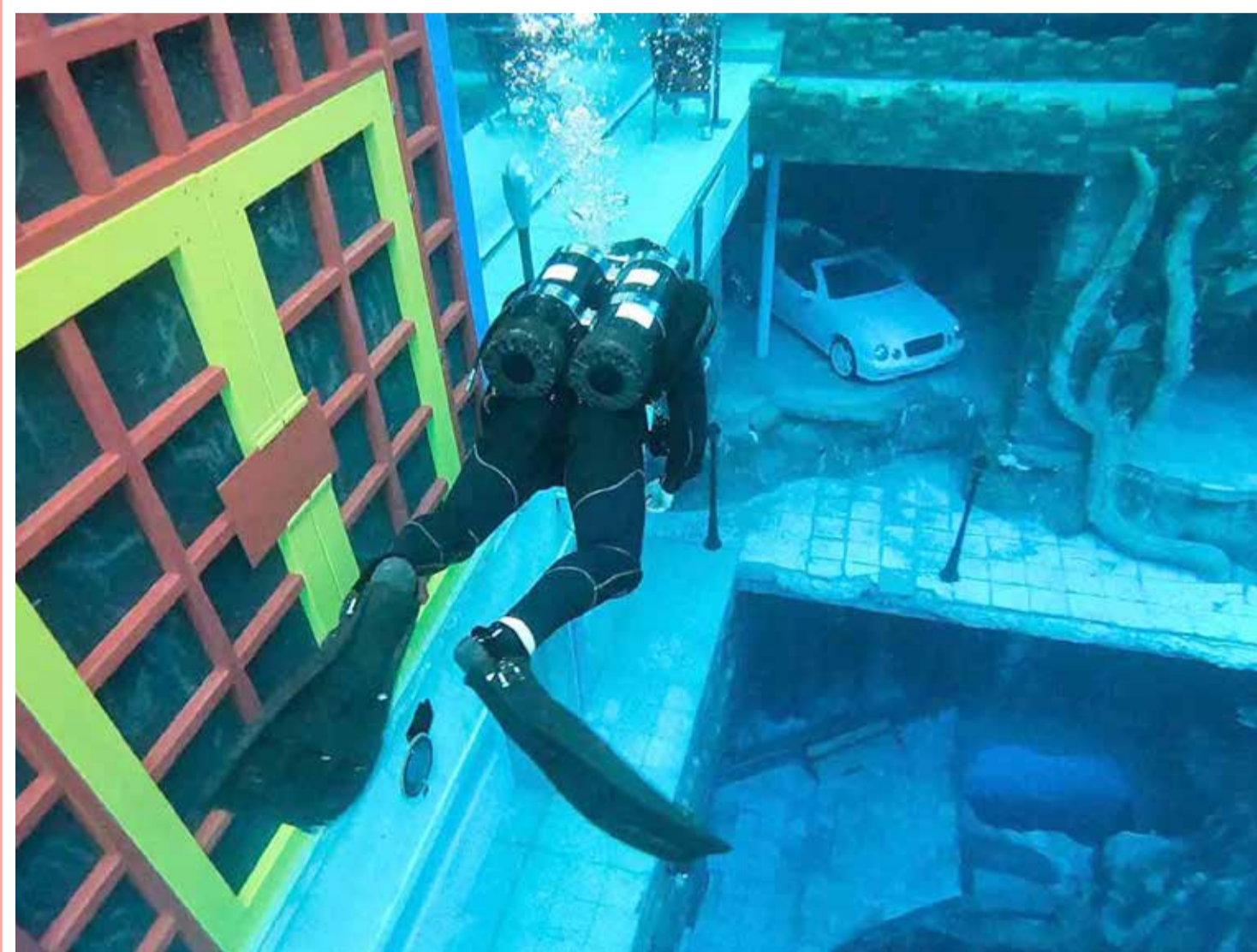
غواص يتجه نحو "المدينة الفارقة" في أعماق مسبح للفطس في العالم، "ديب دايف دبي"، الإمارات العربية المتحدة

إدارة التحرير: +973 17111444 | +973 17111467 | 385 @local@albiladpress.com | تأسست سنة: 2008 | تصدر عن دار البلاد للصحافة والنشر والتوزيع | س.ت 67133 | تطبع في مؤسسة الأبرام للنشر | قسم الإعلانات: +973 17111501 / 508 | +973 32224492 / 39615645 | +973 17580939 | الاشتراكات والتوزيع: +973 17111432 | +973 17111434