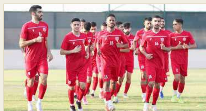
من تدريب منتخبنا الأولمبي

تحضيراً للمشاركة في تصفيات كأس آسيا تحت 23 عامًا