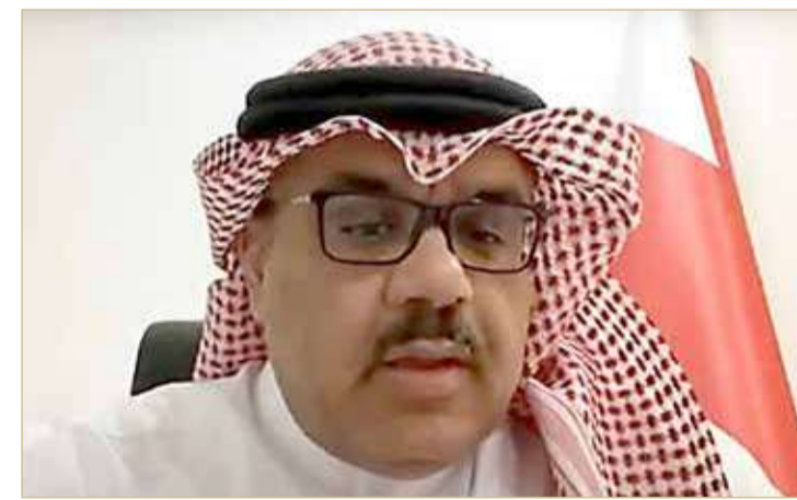
الذوادي: لريادة الرقابة على الكبائن غير المرخصة

البلاد نوه النائب عبدالله الذوادي بجهود مملكة البحرين في بناء دور العبادة برعاية عاهل البلاد صاحب الجلالة الملك حمد بن عيسى آل خليفة، بالإضافة إلى جهود إدارتي الأوقاف السنوية والجعفرية. وأشار إلى أنه وحسب آخر الإحصائيات المعروفة يوجد أكثر من 2000 دور عبادة في البحرين، وأنها بزيادة بشكل سنوي، بمتابعة من الحكومة برئاسة ولي العهد رئيس مجلس الوزراء صاحب السمو الملكي الأمير سلمان بن حمد آل خليفة.