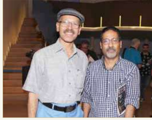
تتلاشى الكلمات حين وصفه ويخفق الفكر