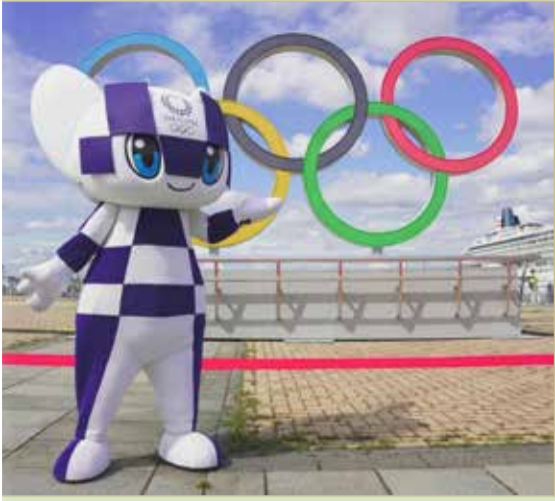
طوكيو تشهد انطلاق النسخة الـ 32 لدورة الألعاب الأولمبية