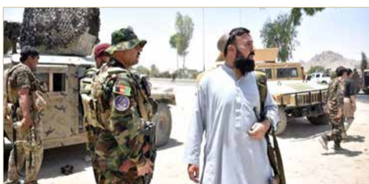
روسيا، "طالبان" أبلغتنا استعدادها لتشكيل حكومة شاملة مع السلطات في كابول

◆ الحركة لن تسمح بوجود تركيا عسكريا وتطالبها بسحب قواتها