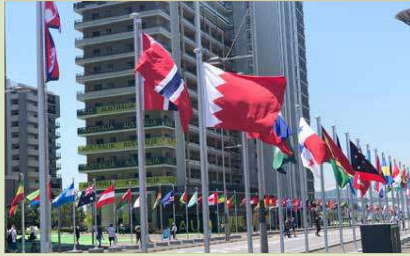
علم البحرين يرفرف في القرية الرياضية