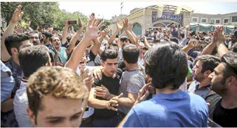
طهران تفود محاولات مضنية للحد من قدرة الشارع على التعبير عن السخط السياسي

◆ نظام طهران يقر بالتقصير ويعطل الإنترنت تزامنا مع "ثورة العطش"