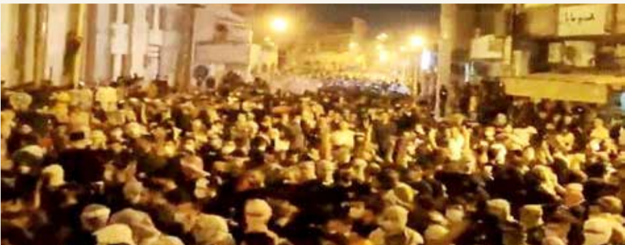
من احتجاجات الأهواز

ونقل موقع نور نيوز عن شمخاني قوله على حسابه في تويتر عقب لقائه الرئيس الإيراني المنتخب إبراهيم رئيسي عن مشكلة الجفاف في خوزستان "بالطبع معضلة الجفاف واقع لا يمكن إنكاره". وتشهد منطقة جنوب غرب إيران احتجاجات على نقص المياه، وتخلل الاحتجاجات مصادمات أسفرت عن سقوط قتلى ومصابين. وتعطلت خدمة الإنترنت عبر الهاتف المحمول في إيران، بعد احتجاجات في جنوب غرب البلاد بسبب نقص المياه، حسبما ذكرت جماعة مراقبة أمس الخميس. وعزت مجموعة الدفاع عن الوصول إلى الإنترنت "تيلوكس دوت كوم" جزءا من العطل إلى "ضوابط معلومات الدولة أو إغلاق الإنترنت المستهدف". فيما حددت حالات الانقطاع بداية من 15 يوليو عندما بدأت الاحتجاجات في خوزستان، وسط جفاف أثر على المنطقة الغنية بالنفط المجاورة للعراق. وبينما واصلت خدمة الخطوط الأرضية العمل، حذرت "تيلوكس دوت كوم" من أن تحليلها وتقارير