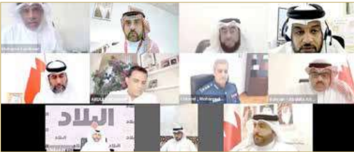
المشاركين بدعوة صحيفة “البلاد”

البغددي: تشكل خطراً.. ومستعدون لتدريب كوادرها للتعامل مع المخاطر