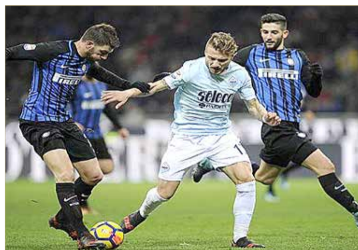
منافسات الدوري الإيطالي

به قبل أسابيع من انطلاق منافسات الدوري الإيطالي، والذي من المقرر أن يبدأ في 21 أغسطس المقبل. ويشار إلى أن معظم المناطق في إيطاليا، رفعت معظم الإجراءات الاحترازية ضد كورونا، وأبقت فقط على استخدام القناع الطبي في الأماكن المغلقة. وشهدت الأسابيع الماضية، زيادة عدد الحالات داخل إيطاليا، ووصلت إلى 4259 حالة في آخر 24 ساعة، وهو ما يعتبر ضعف العدد الذي تم تسجيله في نفس اليوم الأسبوع الماضي.