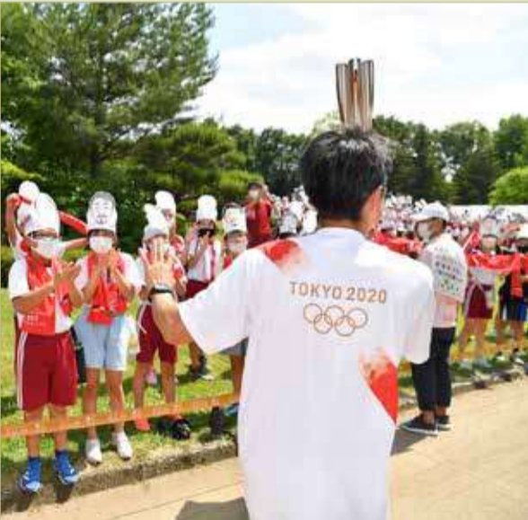
من مراسم سير الشعلة في اليابان