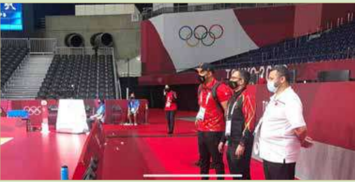
النصف يتابع تدريبات منتخب اليد

العاصمة اليابانية تشهد اليوم انطلاق أكبر تظاهرة رياضية عالمية