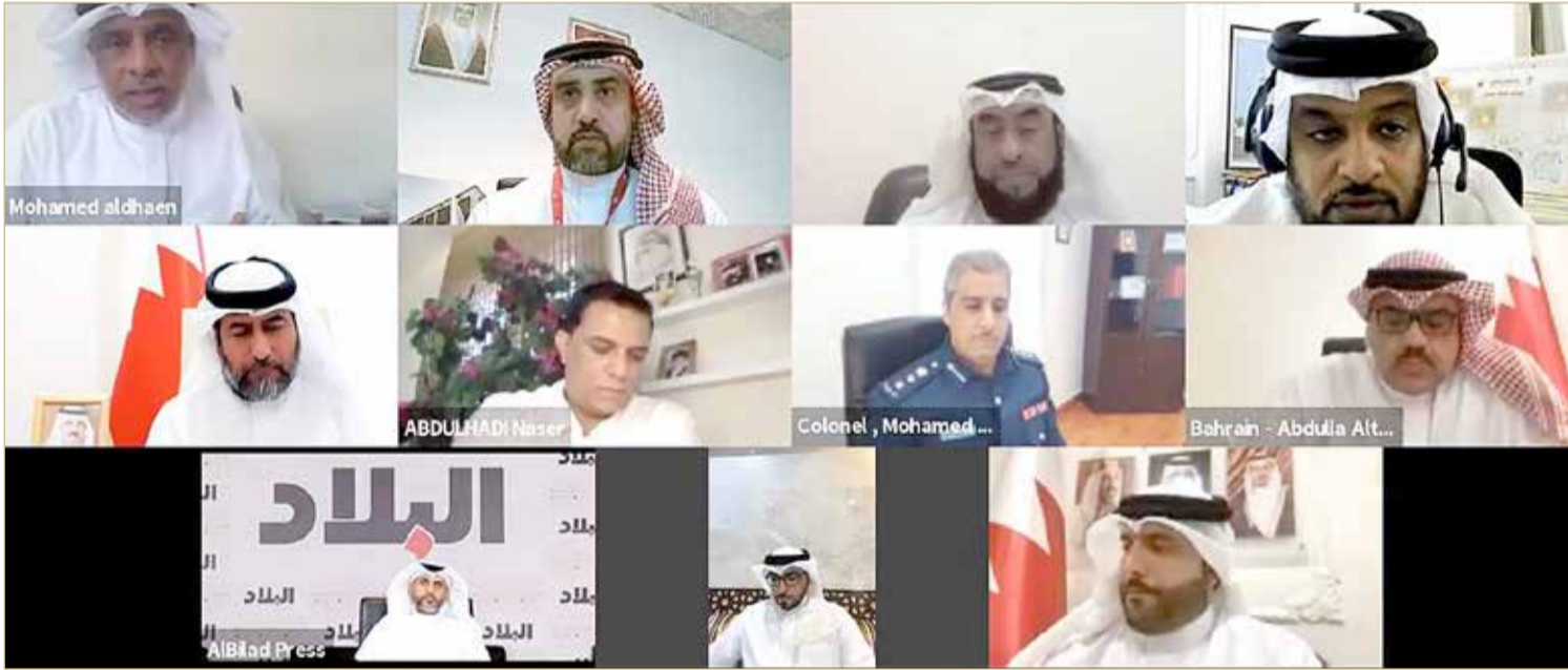
المشاركون بندوة صحيفة "البلاد"

مدير السلامة: تشكل خطراً.. ومستعدون لتدريب كوادرها للتعامل مع المخاطر