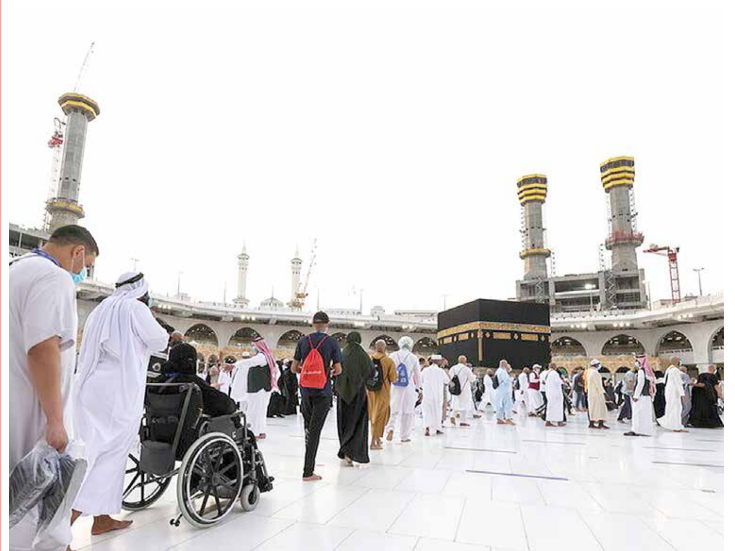
استقبل المسجد الحرام قوافل الحجاج من المتعجلين لأداء طواف الوداع، بعد أن قاموا برمي الجمرات الثلاث، وسط تنظيم دقيق وإجراءات احترازية عالية.

إدارة التحرير: +973 17111444 / +973 17111467 / 385 @local@albiladpress.com / 2008 / تصدر عن دار البلاد للصحافة والنشر والتوزيع / س.ت 67133 / تطبع في مؤسسة الأبرام للنشر / قسم الإعلانات: 508 / +973 17111501 / 39615645 / +973 32224492 / 17580939 / +973 17111432 / +973 17111434