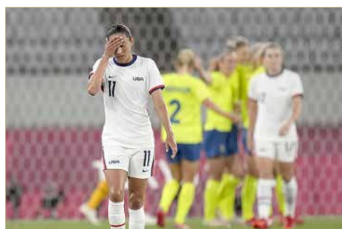
لاعبات أميركا بعد الخسارة من السويد

بعد الخسارة بثلاثية من السويد في افتتاح الأولمبياد