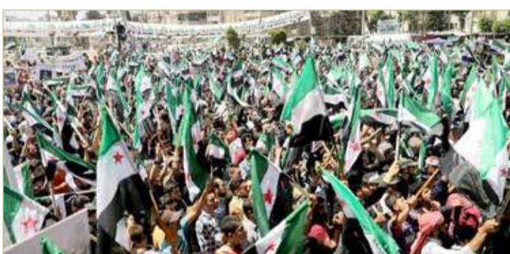
التظاهرات انقذت الصمت التركي حيال الانتهاكات رغم دورها "الضامن"

◆ احتجاجات في بلدات ريف إدلب ضد قوات أنقرة المتمركزة