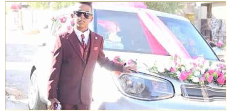
وضجت مواقع التواصل الاجتماعي بالتعليقات المنددة بمثل تلك الزيجات، المطالبة بوقف هذه الظاهرة التي بدأت بالانحسار خلال السنوات الأخيرة.

ضجت مواقع التواصل الاجتماعي في العراق بحفل زفاف طفل عمره أقل من 11 عاما، شرقي بغداد، وسط حالة من الغضب بسبب انتشار الزواج المبكر وما يترتب عليه من آثار سلبية على المجتمع. وبت المصور الشهير زهير العطواني، وهو مختص في تغطية الأعراس والعزائم، حفل زفاف الطفل سجاد، من سكان منطقة البلديات شرقي