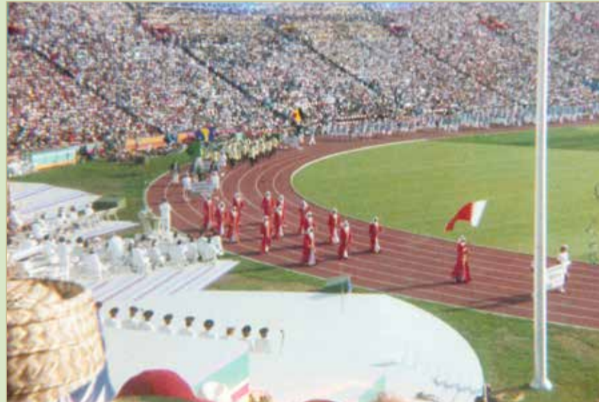
دورة الألعاب الأولمبية بلوس أنجلوس 1984

البلاد | حسن علي من طوكيو