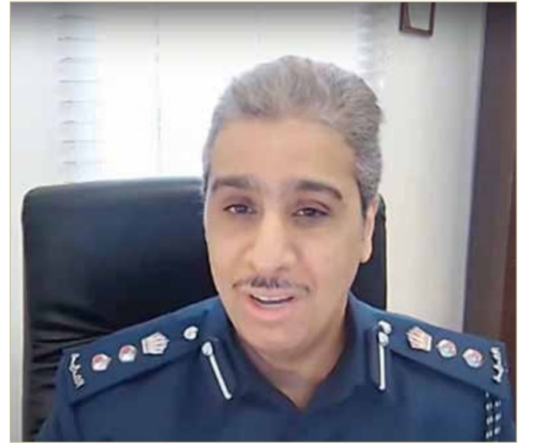
العقيد الركن البغدادي: أهمية أن تكون الكبائن مقاومة للحريق

الخطر، مع ضرورة التأكيد على كون الطلبات مقدمة عبر القنوات الرسمية. وأكد أهمية أن تكون المواد المصنعة لهذه الكبائن مقاومة للحريق حتى وإن كانت مؤقتة، وذلك من خلال بحث كيفية تطبيق ذلك مع الجهات المعنية. وقال إنه من الأهمية بمكان أن تكون الإدارة القائمة على هذه الكبائن مدربة للتعامل مع الحوادث العرضية. ولفت إلى أن إدارة الحماية والسلامة على أتم الاستعداد للقيام بتدريب الكوادر؛ لرفع مستويات التعامل مع أي خطر يربص.