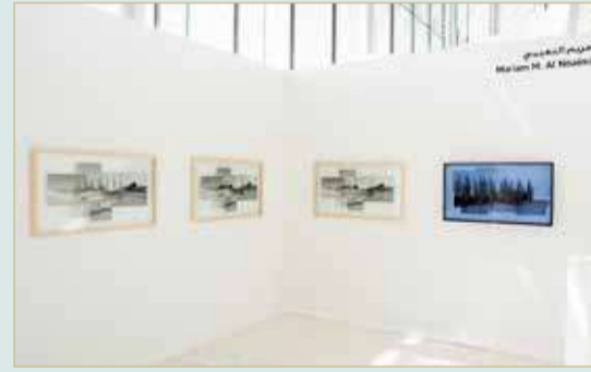
العمل الفائز. تبدلات الماء