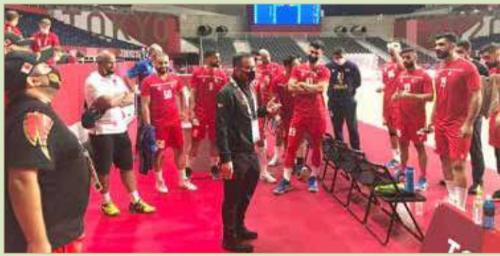
النصف لدى زيارته للاعبين