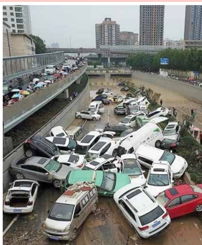
منظر جوي لآثار الفيضانات الناجمة عن أمطار غزيرة في مدينة تشنغتشو، وسط محافظة هينان، الصين (أ ف ب)

بعدها أثار الرعب خلال الشهرين الماضيين، أعلنت نيودلهي أنها سجلت أكثر من 45 ألف إصابة بداء "الفطر الأسود" خلال تلك المدة، والذي زاد معدل الوفيات فيه عن 50% ويتفشى خصوصا في صفوف أشخاص أصيبوا بفيروس كورونا. وأوضح نائب وزير الصحة الهندي، بهاراتي برفاين باوار، أمام البرلمان أن أكثر من 4200 شخص لقوا حتفهم بسبب "الفطر العفني"، وهو في العادة مرض نادر لكنه انتشر في الهند في صفوف أشخاص تعافوا من كورونا. ويعتبر المرض الفطري شديد العدوانية، ويزيد معدل الوفيات فيه عن 50%. حيث أجبر الجراحين على إزالة عيون وأنف وعظام الفكين لدى بعض المرضى لمنع العدوى من الوصول إلى الدماغ.