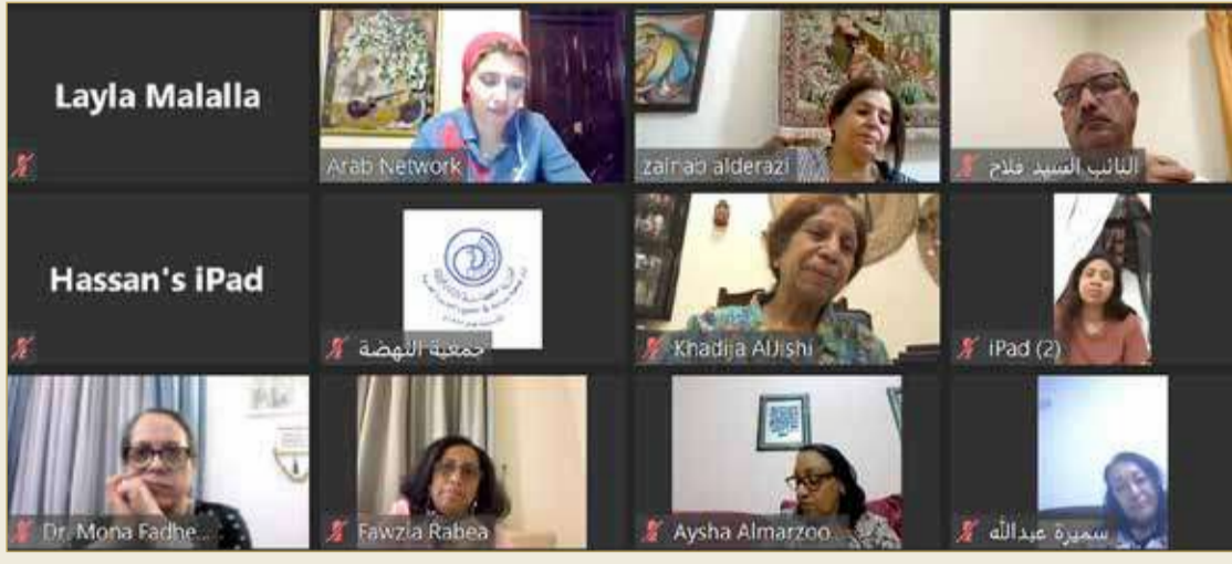
جانب من المشاركين بالفعالية

يضم أكثر من 50 ألف امرأة عاملة... وعدم حمايتهن يعوق تنفيذ أهداف التنمية المستدامة