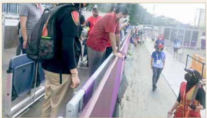
سمو الشيخ عيسى بن علي يؤازر لاعبة مريم حساني

تمتني لها المزيد من التوفيق والنجاح في منافسات الجولة الرابعة والخامسة. والتقى سموه أثناء وجوده بمنافسات الرماية الأمين العام المساعد للجنة الأولمبية الإماراتية المهندس عزة بنت سليمان، ومدير بعثة الإمارات بالأولمبياد أحمد الطيب. وعبرت لاعبة عن بالغ شكرها وتقديرها على دعم واهتمام سموه بمشاركتها، متمنية أن تنهي مشاركتها بتحقيق رقم جديد.