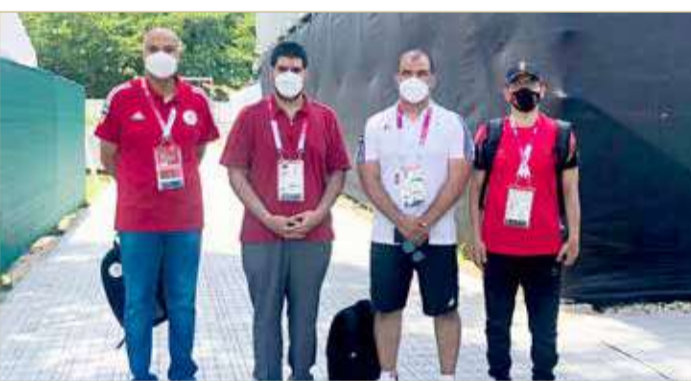
سمو الشيخ عيسى بن علي مع الوفد الإماراتي