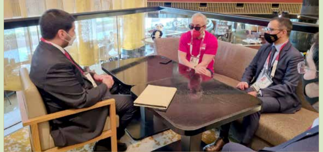
سمو الشيخ عيسى بن علي لدى لقائه رئيس اللجنة الأولمبية الإسبانية

اللجنة الأولمبية الإسبانية ونظيرتها البحرينية منوها بالجهود التي تبذلها مملكة البحرين في دعم الرياضة وحرصها على تطبيق العديد من البرامج التي تتناغم مع القيم الأولمبية، متمنيا للبعثة البحرينية التوفيق والنجاح في دورة الألعاب الأولمبية 2020.