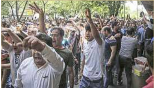
تظاهرات الأهواز مستمرة بسبب شح المياه والظروف المعيشية الصعبة

بين المتظاهرين والأمن الإيراني. لم يكن ما شهدته محافظة الأهواز مؤخراً من أزمة مياه واحتجاجات أمراً غير متوقّع. ففي عام 2015 حذّر عيسى كالانتاري، وزير الزراعة الإيراني الأسبق من أن ندرة المياه سترغم 50 مليون إيراني أي ما يوزاي ستين في المئة من السكان على مغادرة البلاد.