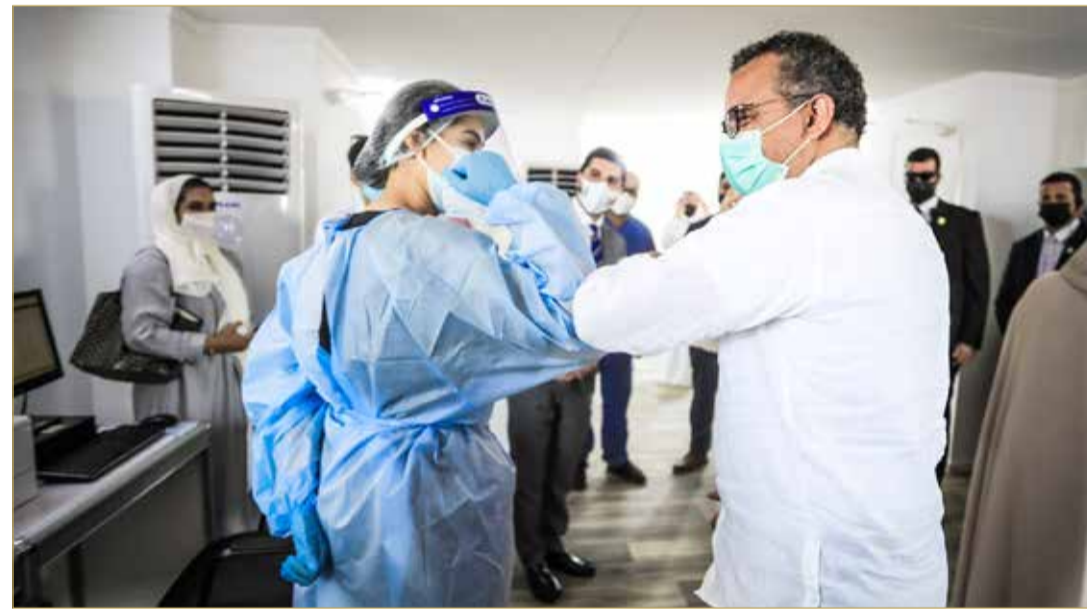
المدير العام لمنظمة الصحة العالمية في زيارة لمركز الفحص من المركبة في منطقة الساية

◆ مدير “الصحة العالمية”: المملكة تعاملت بشكل شمولي مع الجائحة