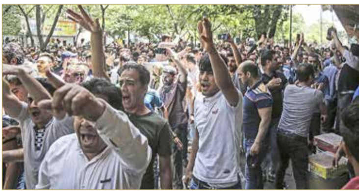
تظاهرات الأهواز مستمرة بسبب شح المياه والظروف المعيشية الصعبة

◆ إلقاء اللوم في أزمة شح المياه على ارتفاع درجة الحرارة وتراجع الأمطار