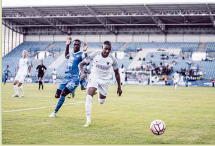
لقطة لباريس أف سي

تفوق على جرينوبل برباعية نظيفة بشعار "فيكتوروس البحرين"