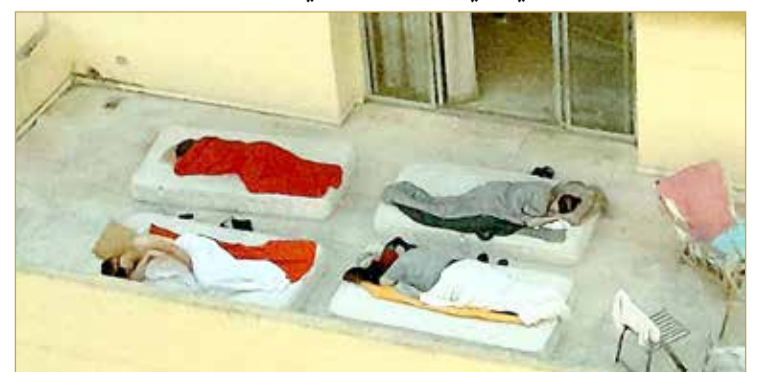
وانقسمت اللراء بين معارض لنشر الصورة وبين من اعتبر أنه يجب أن تنتشر لأنها تمثل الواقع اللبناني الذي بات لا يمكن الاختباء منه بعد اليوم.

انتشرت بوسائل التواصل الاجتماعي في لبنان صورة أثارت جدلاً كبيراً في المجتمع اللبناني، خصوصاً مع الأزمة الاقتصادية والمالية التي تشهدها البلاد. ونشر المصور اللبناني زكريا جابر صورة التقطها أثارت تساؤلات وجدلاً كبيراً في لبنان، إذ ظهرت عائلة من 4 أفراد يقضون ليلتهم على شرفة منزلهم بسبب الحر الشديد وانقطاع الكهرباء. وروى المصور جابر لموقع "رصف 22" قصة الصورة قائلاً: "التقطت الصورة في منطقة الأشرفية الساعة السادسة صباحاً، حيث كنت قد استيقظت من النوم أتصعب عرقاً بسبب انقطاع الكهرباء، وأردت أن أفتح النافذة كي يدخل القليل من الهواء إلى الغرفة التي احتقت فيها. هكذا رأيت 4 أشخاص يغطون عيونهم وأجسادهم بالكامل وينامون فوق فراشهم على الشرفة بسبب موجة الحر. والتقطت الصورة، ونشرتها عبر صفحتي مرفقة بعبارة "الموت البطيء في مدينة بيروت التي تنعدم فيها الحياة".