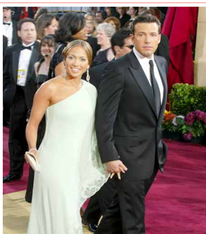
أعلنت النجمة الأميركية جينيفر لوبيز عن عودة العلاقة بينها وصديقها الممثل الأميركي بن أفليك. وجاء إعلان لوبيز أثناء صورة شاركتها عبر حسابها على "إنستغرام"، والتي تبين تبادلها القبلة على متن يخت، احتفالاً بعيد ميلادها الـ 52.

منحت إدارة الطيران والفضاء الأميركية "ناسا"، شركة "سبيس إكس" التي يملكها إيلون ماسك عقداً قيمته 178 مليون دولار، لإطلاق أول مهمة لناسا تركز على القمر الجليدي يوروبا لكوكب المشتري، وما إذا كانت تتوافر فيه ظروف مناسبة للحياة. وقالت "ناسا" في بيان: إنه من المقرر أن يطلق صاروخ "فالكون هيفي" التابع لشركة "سبيس إكس" المهمة "يوروبا كليبر" من مركز كينيدي للفضاء في ولاية فلوريدا الأميركية. وسيقوم المسبار بإجراء مسح مفصل للقمر "يوروبا" التابع للمشتري والمغطى بالجليد وهو أصغر قليلاً من قمر الأرض، وهو من المناطق التي يبحث العلماء عن احتمال وجود حياة فيه في النظام الشمسي.