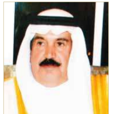
دعيج بن سلمان

وأكد الشيخ دعيج بن سلمان آل خليفة أن الفقيد ترك بصمته في تاريخ كرة القدم البحرينية، من خلال عطاءاته كلاعب في فترة ستينات القرن الماضي وتمثيله للمنتخب الوطني والنادي الأهلي، ومن ثم كمدرّب استطاع تحقيق العديد من الألقاب، علاوة عن المساهمة في بناء جيل مميز كان له دور كبير في تطوير كرة القدم البحرينية على مدى سنوات طويلة.