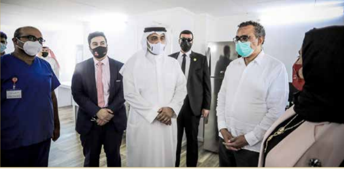
تيدروس غيبريسوس يتطلع على الإجراءات الاحترازية التي قامت بها مملكة البحرين للتصدي لفيروس كورونا

الفحص وتوفير العلاج والتطعيم "مجانا" و70% من السكان أخذوا الجرعتين