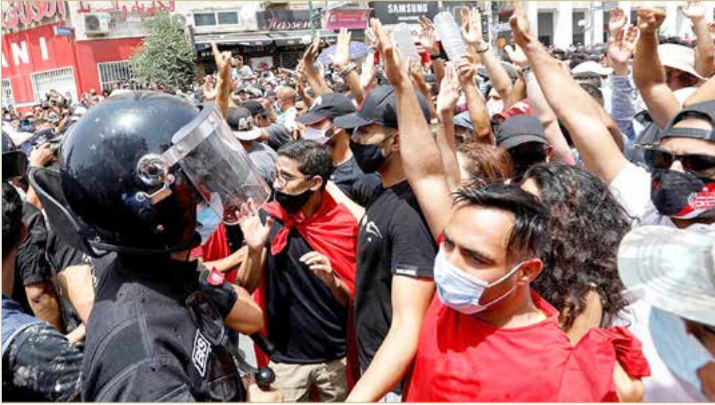
رفع المتظاهرون شعارات ضد الحكومة

شهدت عدد من المدن التونسية، أمس الأحد، الذي يصادف عيد الجمهورية في تونس، مظاهرات مناهضة لحكومة هشام المشيشي ولحركة "النهضة" التي تدعمها. وتوافد مئات المتظاهرين إلى ساحة البرلمان بباردو، مطالبين بحله، فيما ذكرت وسائل إعلام محلية أن متظاهرين هاجموا مقرات حركة "النهضة" في عدد المدن.