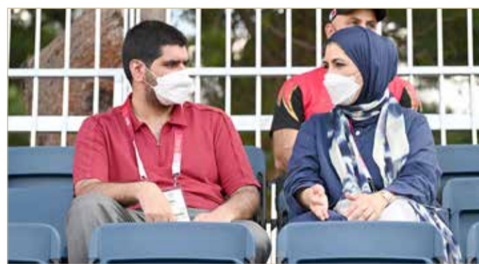
سمو الشيخ عيسى بن علي مع الأمين العام المساعد للجنة الأولمبية الإماراتية

البلاد | حسن علي: