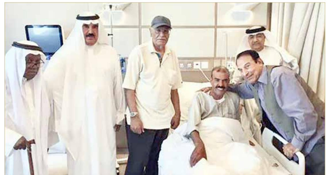
صورة تجمع الفقيد مع عدد من الشخصيات الرياضية