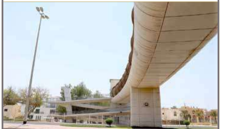
غالبية جسور المشاة لا تحظى بالصيانة الدورية

البلاد | مروة خميس | تصوير: رسول الحجيري وخلييل إبراهيم