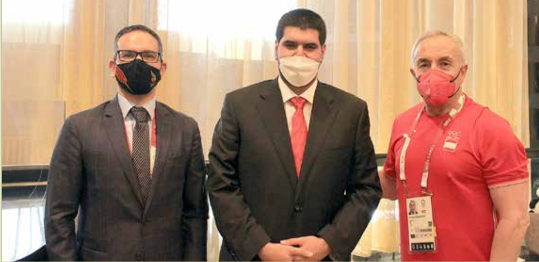
سمو الشيخ عيسى بن علي والنصف أثناء لقائهما برئيس اللجنة الأولمبية الإسبانية