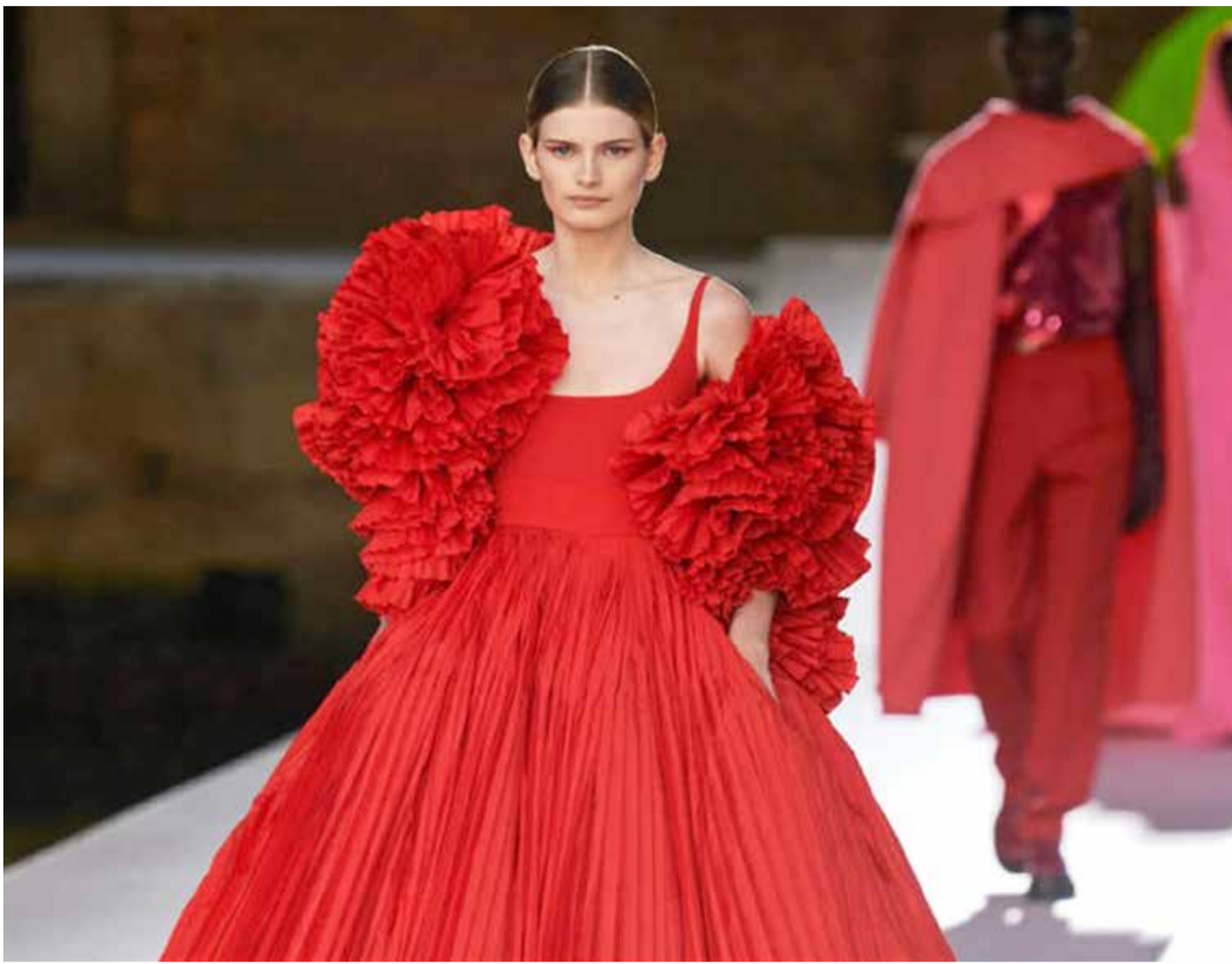
زي من مجموعة فالنتينو كوتور لخريف 2021 أثناء احتفال الألوان والإبداع في مدينة كانالز البندقية.

بعد عام من عدم وجود إصابات بعدوى الإنفلونزا أو الفيروسات الأخرى تقريباً، عادت نزلات البرد والإنفلونزا بقوة انتشار أشد ضراوة، حسب ما نشرته "ديلي ميل" Daily Mail البريطانية. وترجع بعض الأسباب إلى أن الالتزام بالمبادئ التوجيهية التي وضعتها منظمة الصحة العالمية والهيئات الصحية الإقليمية والمحلية الخاصة للتباعد الجسدي وارتداء الكمامات الواقية للحماية من العدوى أثناء جائحة كوفيد-19، والتي أدت عن دون قصد إلى قلة قدرة أجهزة المناعة على مكافحة الجراثيم والبكتيريا الأخرى، ومع بدء التخفيف التدريجي من التدابير الاحترازية عادت الإنفلونزا إلى الانتشار مجدداً بقوة عقب عام من الأمان النسبي. ويعد الأطفال الصغار والرضع من الفئات الأكثر عرضة لخطر العدوى بنزلات البرد والإنفلونزا بشكل خاص والتي تنتقل بشكل تلقائي إلى ذويهم. وقال بول سكولنيك، اختصاصي الفيروسات المناعية ورئيس الطب الباطني في كلية طب فيرجينيا تيك كارليسون، في تصريح لـ"نيويورك تايمز" New York Times: إن "تكرار التعرض للعديد من مسببات الأمراض يؤدي إلى تنشيط الجهاز المناعي ليكون جاهزاً للاستجابة ومقاومة هذا العامل الممرض"، ولكن من لم يتعرضوا