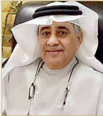
رئيس مآتم العجم الكبير