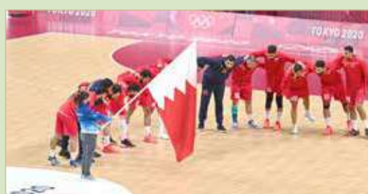
منتخبنا سيلعب من دون ضغوط نفسية

البلاد | حسن علي من طوكيو