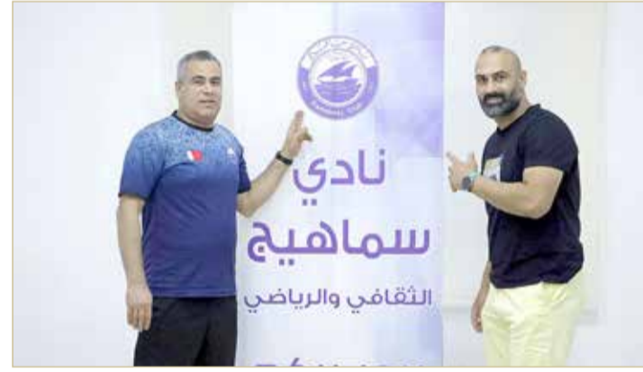
جانب من توقيع العقد

◆ أكد أنه لمس رغبة وجدية كبيرة من مسؤولي النادي