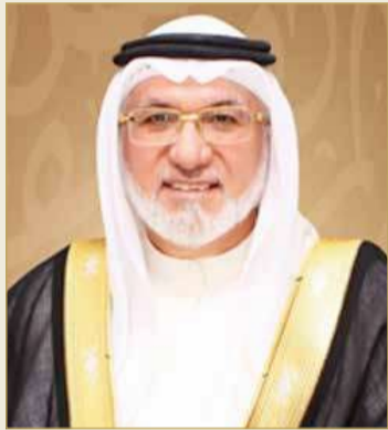
عبد اللطيف الشيخ