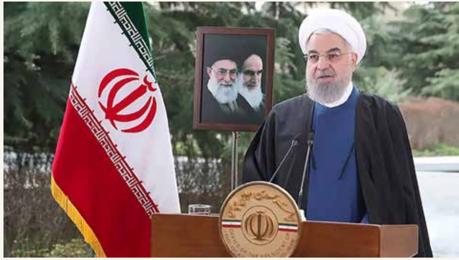
الرئيس الإيراني حسن روحاني

تداعيات استهداف ناقلة النفط.. استدعاء سفراء بين لندن وطهران