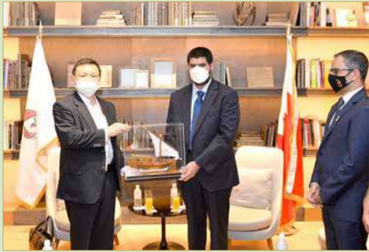
سموه يقدم هدية اللجنة الأولمبية التذكارية

البلاد | حسن علي من طوكيو