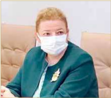
السيدة إسبين تشاكيل سفيرة الجمهورية التركية لدى مملكة البحرين

◆ فتح قنوات تعاون مع تركيا بمجالات التمكين الاقتصادي