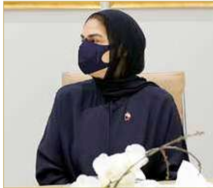
الأمين العام للمجلس الأعلى للمرأة