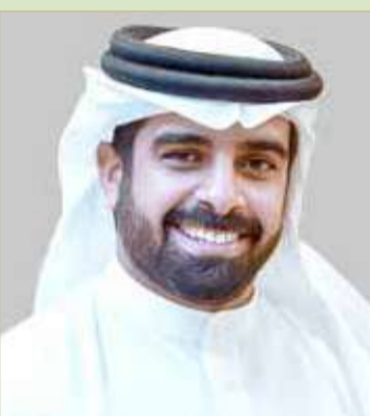
سمو الشيخ سلمان بن محمد