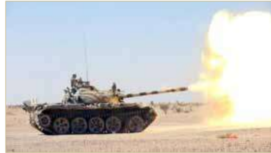
دبابة للجيش اليمني في الجوف

الجيش اليمني يدمر عربة مدرعة وطقما قتاليا للمليشيات بجبهة الخنجر