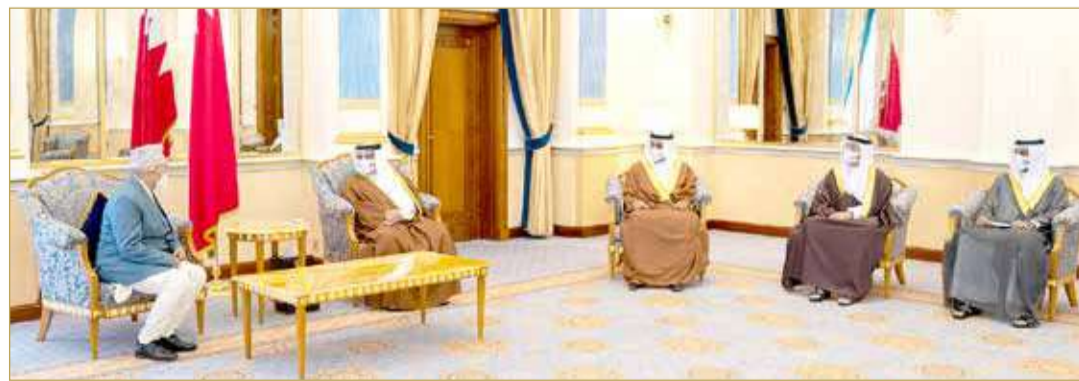
سمو ولي العهد رئيس مجلس الوزراء يستقبل سفير جمهورية نيبال

فتح مزيد من الآفاق بمسار التعاون المشترك