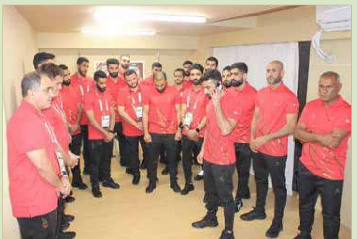
سمو الشيخ خالد بن حمد يتحدث مع حسين الصياد

سموه يوجه بصرف مكافآت للمنتخب بمناسبة تأهله لدور الثمانية