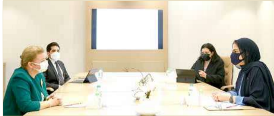
الأنصاري تستقبل السفيرة التركية لدى مملكة البحرين