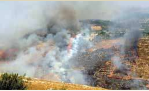
القصف الإسرائيلي طال مناطق في جنوب لبنان

إلى ذلك، علقت الرئاسة اللبنانية، أمس الخميس، على القصف الإسرائيلي الذي استهدف قرى لبنانية يوم الأربعاء، معتبرة إياه انتهاكاً خطيراً لقرارات مجلس الأمن ويهدف للتصعيد.