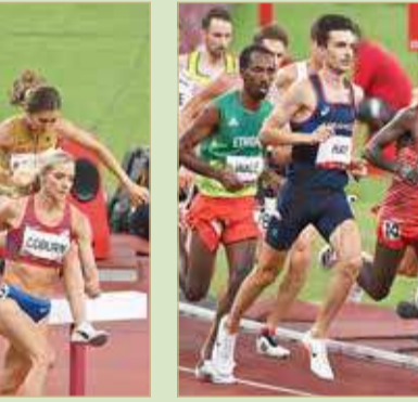
هل يحقق بيرهانو المفاجأة اليوم؟