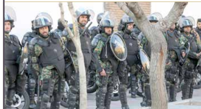
عناصر من الشرطة الإيرانية في طهران