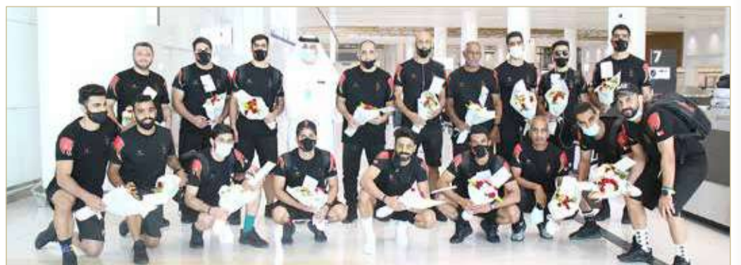
لقطات من استقبال منتخبنا الوطني لكرة اليد

الوطني لكرة اليد ضمن الضوابط والاحترازمات الطبية المعتمدة من قبل الفريق الوطني للتصدي لفيروس كورونا، والالتزام بقواعد التباعد الاجتماعي، وذلك بعد إجراء اللابيين وأفراد الوفد للفحص الطبي الخاص لدى وصولهم أرض الوطن.