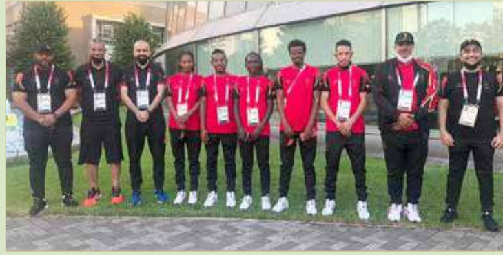
الوفد الإداري مع العدائين والعداءات