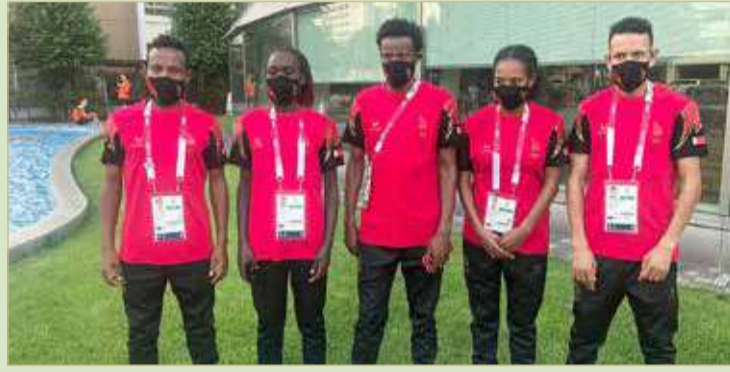
لاعبو ولاعبات الماراثون

النصف يهنئ جلالة الملك وولي العهد بإنجاز اليد رفيع الأمين العام للجنة الأولمبية البحرينية نائب رئيس وفد مملكة البحرين بأولمبياد طوكيو 2020 أسمى آيات النهائي والتبريكات إلى مقام حضرة صاحب الجلالة الملك حمد بن عيسى آل خليفة عاهل البلاد المفدى حفظه الله ورعاه، وإلى صاحب السمو الملكي الأمير سلمان بن حمد آل خليفة ولي العهد رئيس الوزراء حفظه الله ورعاه وإلى سمو الشيخ ناصر بن حمد آل خليفة ممثل جلالة الملك للأعمال الإنسانية وشؤون الشباب رئيس المجلس الأعلى للشباب والرياضة، وسمو الشيخ خالد بن حمد آل خليفة النائب الأول لرئيس المجلس الأعلى للشباب والرياضة، رئيس الهيئة العامة للرياضة، رئيس اللجنة الأولمبية البحرينية بمناسبة التأهل التاريخي للمنتخب الأول لكرة اليد