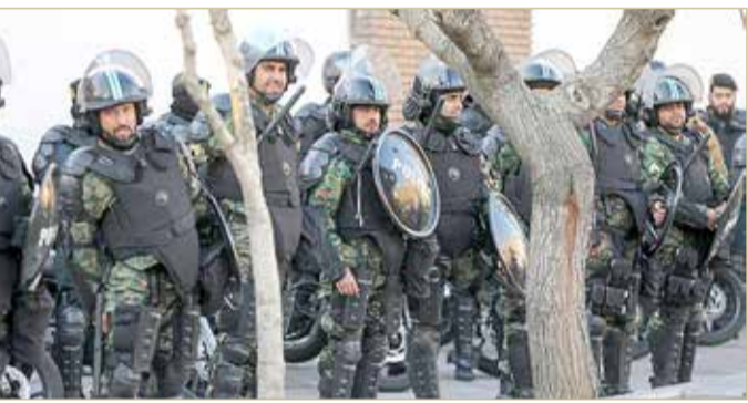
عناصر من الشرطة الإيرانية في طهران

سوسنغرد أي الخفاجية، إلى 12 ألف متظاهر، مشيرة إلى أنها أكبر وأطول فترة تجمعات عامة في المنطقة. وأوضحت أيضاً أنه منذ اليوم الرابع، دخلت وحدة الشرطة الخاصة وغير المحلية، دون أي معرفة بالمنطقة، وواجهت الاحتجاجات السلمية في المدينة بعنف شديد، كما اعتقلت 300 متظاهر فيها وحدها.