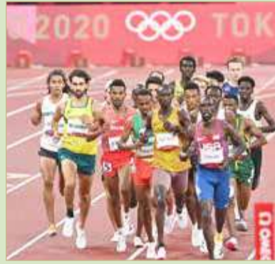
داويت يسعى لتحقيق نتيجة إيجابية

يقوم الطاقم الفني والإداري لمنتخب ألعاب القوى المقيم في مدينة سابورو التي ستحتضن سباقات الماراثون بجهود كبيرة منذ وصولهم إلى هناك في سبيل تقديم