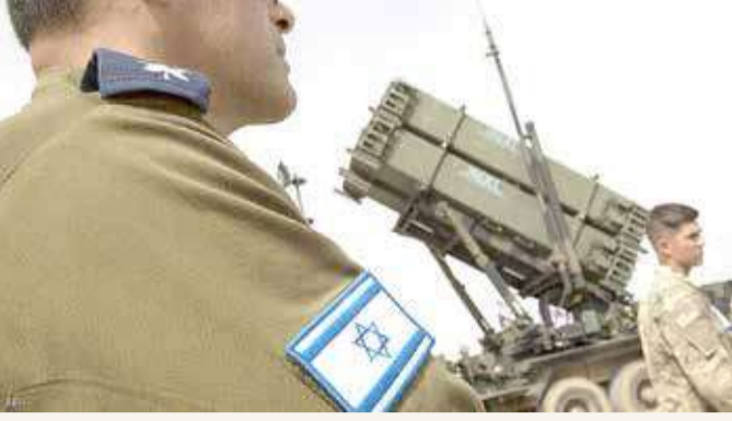
إسرائيل صعدت لهجتها تجاه إيران

قال وزير الخارجية البريطاني دومينيك راب، أمس الخميس، إن إيران ستدفع ثمناً لو اختار رئيسها الجديد إبراهيم رئيسي العدائية، مؤكداً أن طريقة تعامل المملكة المتحدة مع إيران أصبحت في مفترق طرق.