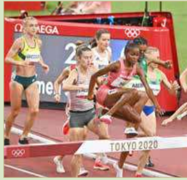
وينفرد تتخطى أحد الموانع