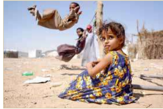
نازحون في مارب

بينما تواصل ميليشيا الحوثي نهجها وسلوكها العدواني والتدميري لمقدرات اليمن ونسيجه الاجتماعي، أكد المتحدث باسم وزارة الخارجية الأميركية، نيد برايس، أن الميليشيا مسؤولة عن الكثير من المعاناة التي شهدها الشعب اليمني. وأشار إلى أن اليمن بات يمر بأسوأ كارثة إنسانية في العالم، مؤكداً أن معظمها من صنع الإنسان، وأن الفاعل في هذه الحالة هم الحوثيون. كما أوضح برايس خلال الإيجاز الصحفي اليومي، أمس الخميس، أن المبعوث الأميركي الخاص إلى اليمن تيموثي ليندركينغ، دعا عند زيارته الأسبوع الماضي للمنطقة، الحوثيين إلى وقف إطلاق النار في مارب وجميع أنحاء البلاد، إلا أن الميليشيا رفضت ذلك. وشدد على أن القتال زاد من معاناة الشعب اليمني، لافتاً إلى استمرار رفض الحوثيين في الانخراط في اجتماع لوقف إطلاق النار وإجراء محادثات سياسية. إلى ذلك أكد أن أميركا تواصل دعم تلك الدبلوماسية لمعالجة الظروف الإنسانية وللتوصل إلى اتفاق بين الأطراف يمكن أن يخفف من معاناة الشعب اليمني. من جانب آخر، أعلن تحالف دعم الشرعية في اليمن، في ساعة مبكرة أمس الخميس، أن الدفاعات الجوية اعترضت