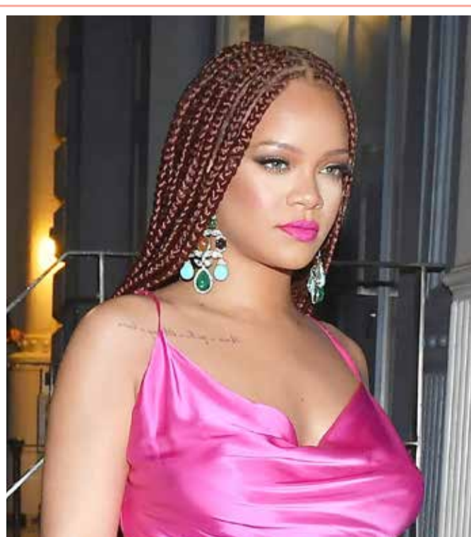
دخلت النجمة العالمية ريهانا، نادي المليارديت بعد تحقيق علامتها التجارية "Fenty Beauty" قيمة تسويقية ضخمة في الفترة الأخيرة. وبحسب ما نشر موقع "فوربس"، فإن ثروة ريهانا وصلت إلى 1,7 مليار دولار، لتصبح أغنى مطربة في العالم.

وفي تفاصيل الحادثة، قالت شرطة العاصمة بغداد، إن "مفازر الشرطة المجتمعية في دائرة العلاقات والإعلام بوزارة الداخلية تمكنت من إيقاف 3 عمليات تعنيف أسري تعرضت له سيدتان مستتان وامرأة وأطفالها من قبل ذويهم، في ثلاث عمليات منفصلة في العاصمة بغداد". وأضاف البيان أن "إحدى النساء المتقدمات بالسن عمرها (100 عام) تعرضت إلى التعنيف والطردها من منزلها".