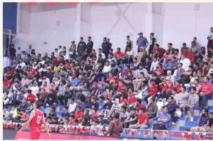
لقطة للجمهور البحريني

للصاله، مضيفاً بأنه سيتم توفير 230 تذكرة لكل مباراة. وذكر يوسف أنه يجب على الجماهير الإفصاح على شروط وأحكام اقتناء التذاكر، وهي التأكد من الحصول على الدرع الأخضر من خلال تطبيق مجتمع واع، حيث سيتم السماح لدخول المطعمين أو المتعافين الحاصلين على الدرع الأخضر فقط.