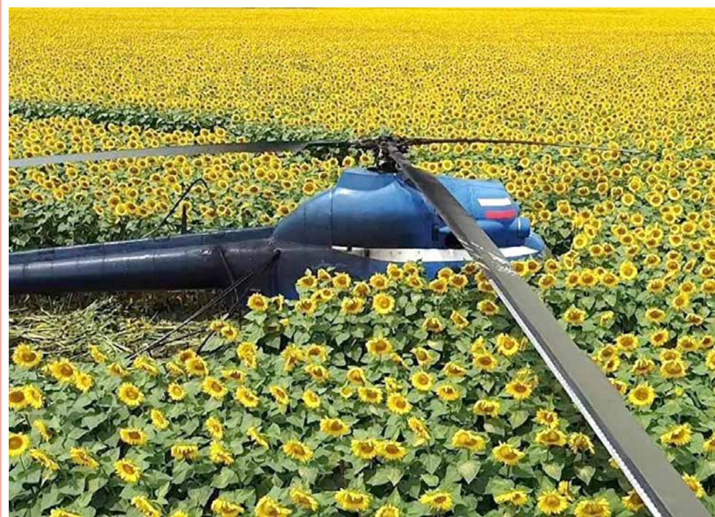
مروحية روسية من طراز "مي 2" هبطت اضطرارياً في حقل زراعي بالقرب من بلدة بروخلادني في قبردينو - بلقاريا، روسيا.

أغانيها، تقول فيه "هل تسمعون؟.. مات أهلي"، وهو ما اعتبره متابعوها تعبيراً عنها عن حزنها على الضحايا. من جانبهم، أعرب كثير من الفنانين في لبنان والوطن العربي عن حزنهم عبر مواقع التواصل الاجتماعي، فقد أعاد كثير من الفنانين اللبنانيين نشر مقاطع فيديو لمنزلهم وأحيائهم التي دمرت جراء الانفجار، وأبرزهم نادين نجيم، وراغب علامة، وعاصي الحلاني، ومي الحريري وغيرهم. وأحيا اللبنانيون، يوم الأربعاء، الرابع من أغسطس، الذكرى السنوية الأولى لانفجار مرفأ بيروت، وخرج أهالي ضحايا انفجار المرفأ في تظاهرات حاشدة، إضافة إلى وقفة احتجاجية أمام القصر العدلي في بيروت.