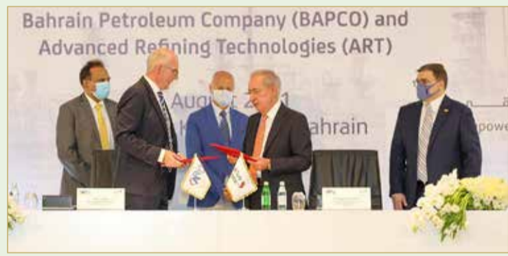
عقب توقيع العقد

يمتد لـ 5 سنوات وتبلغ قيمته ملايين الدولارات