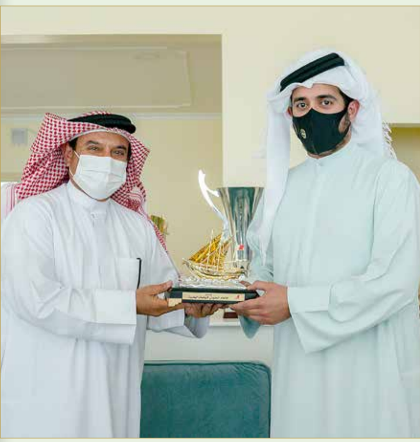
الحسن يقدم هدية تذكارية لسمو الشيخ خالد بن حمد

وتأتي هذه الزيارة ضمن الزيارات التي يقوم بها سموه للاتحادات الرياضية؛ بهدف تعزيز التواصل مع