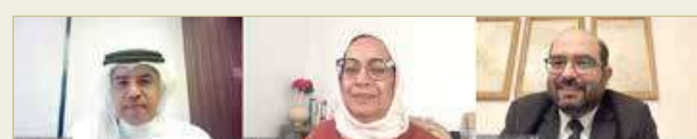
لجنة الحقوق والحريات العامة بمؤسسة حقوق الإنسان

على تنفيذ العقوبات في مراكز الإصلاح والتأهيل ومراكز الاحتجاز والتوقيف لتعريفهم بحقوقهم وواجباتهم. واختتمت اللجنة اجتماعها بتأكيد ضرورة التحقق من اتباع الإجراءات الاحترازية في موسم عاشوراء للنزلاء والمحتجزين، وقيام جميع النزلاء والنزيلات بممارسة حقوقهم وشعائرهم الدينية خصوصاً في الأيام الأولى من شهر محرم.