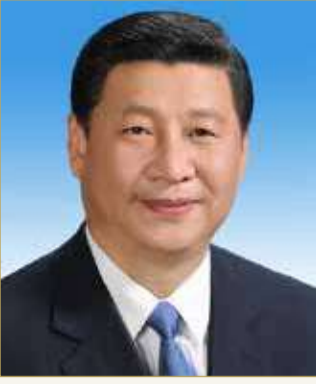
رئيس جمهورية الصين الشعبية