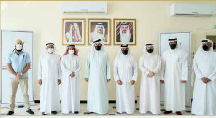
سمو الشيخ خالد بن حمد يتوسط مسؤولي اتحاد الرياضات البحرية

سموه يحث على مضاعفة الجهود لتحقيق مزيد من النجاحات في القطاع الرياضي