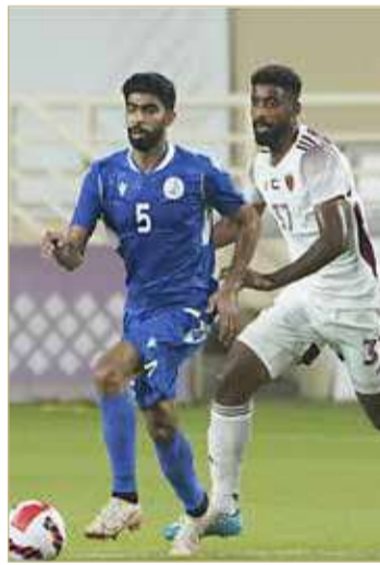
من لقاء الحد والوحدة الإماراتي

نادي الوحدة الإماراتي للبطولة التحضيرية للموسم الجديد 2021-2022.