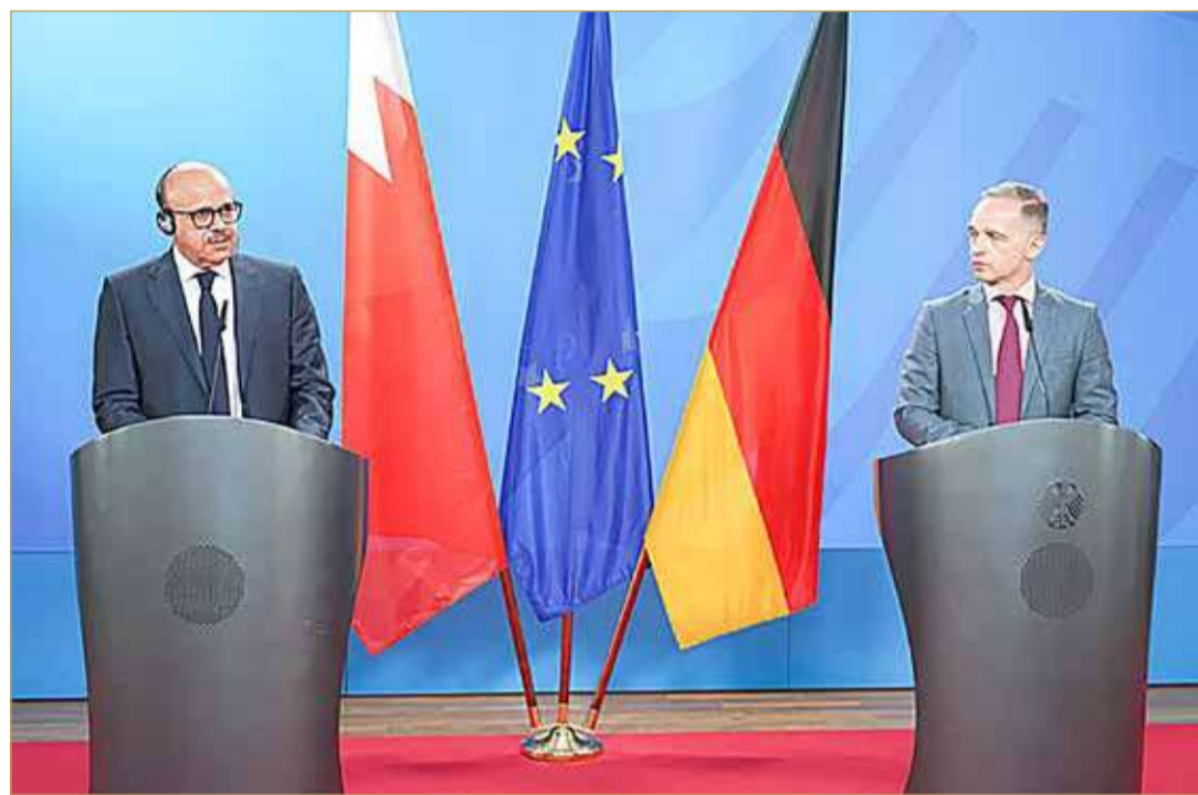
وزير الخارجية خلال المؤتمر الصحفي مع نظيره الألماني

عقد وزير الخارجية عبداللطيف الزياتي، ووزير خارجية جمهورية ألمانيا الاتحادية هايكو ماس، مؤتمرا صحافيا في أعقاب جلسة المباحثات الرسمية المشتركة بحضور وفدين من البلدين. وبين أن مملكة البحرين أحرزت تقدما محرزاً في إعداد الخطة الوطنية لحقوق الإنسان الرائدة في المنطقة، وأن المملكة وقعت على إعلان النوايا مع الأمم المتحدة للتعاون في صياغة الخطة، مشدداً على أن مملكة البحرين ليس لديها ما تخفيه في مجال حقوق الإنسان، وأنها عازمون على الالتزام بأعلى معايير الشفافية، كونها أفضل طريقة لمواجهة الادعاءات الكاذبة الموجهة ضد المملكة.