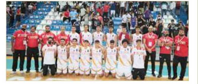
منتخب الناشئين لكرة السلة