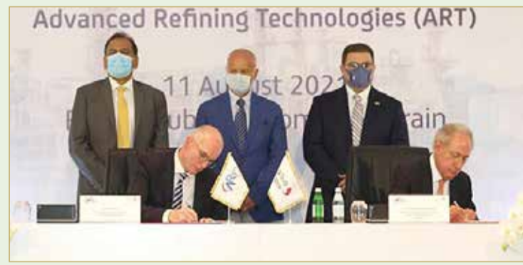
توقيع العقد بين الجانبين