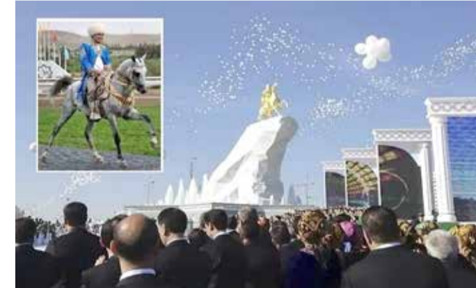
الرئيس الذي يظهر على التلفزيون ليغني ويسابق بالخيل أمر بنحت تمثال له مطليا بالذهب

تمثال ضخم له، من أوراق الذهب، نصبوه له في العاصمة "عشق آباد" بارتفاع 28 مترا، ويبدو فيه ممتطيا جواده المفضل "آكان" ويبيده اليمنى حمامة، في تقليد واضح لتمثال "الفارس البرونزي" المسجد للقيصر الروسي، بطرس الكبير، في مدينة سان بطرسبرغ.