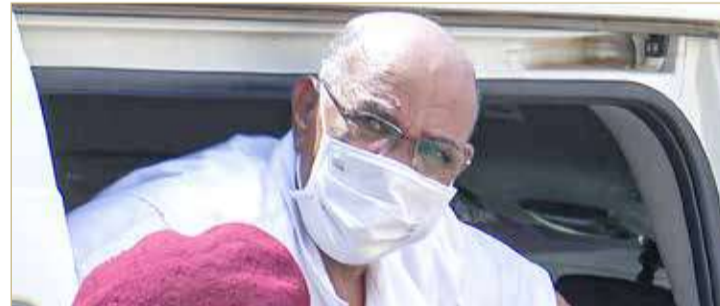
عمر البشير (أرشيفية)