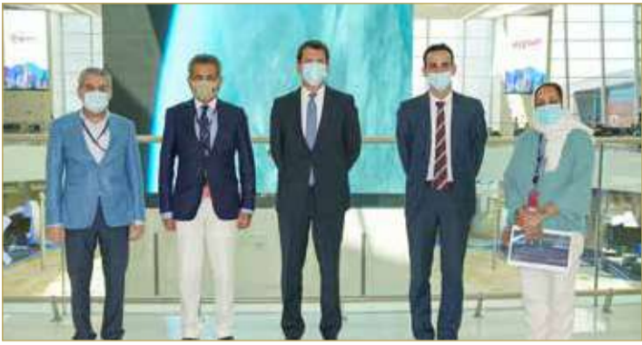
زيارة وفد شركة ويز إير لمطار البحرين

بين إمارة أبوظبي والبحرين، والتي تعتبر وجهة جذابة نظراً لقربها من الإمارات، فضلاً عن تمتعها بثروة تاريخية وثقافية فريدة، ونحن على يقين أن البحرين ستكون إضافة مرحب بها إلى قائمة رحلاتنا. وسيتم تسيير الرحلات من مطار أبوظبي الدولي إلى مطار البحرين الدولي أيام الأحد والثلاثاء والخميس.