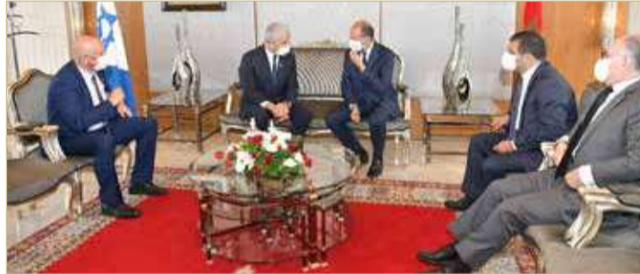
يائير لبيد سيلتقي نظيره المغربي ناصر بوريطة