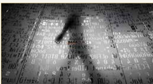
الشركة طلبت تجنب الرموز المسروقة لمنصات عملات رقمية

يسيطر عليها الهاكرز، كما نشرت عناوين يستخدمها المخترقون.