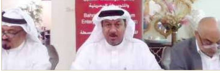
المؤتمر الصحافي لـ “الصغيرة والمتوسطة” أمس

الجمعية بتنسيق مع مختلف الجهات البحرينية، إذ أقيمت برعاية رئيس تارستان رستم مينخاوف، وبدعوة من وكالة الاستثمارات في تارستان، إذ شاركت هيئات من 26 دولة و25 رئيس غرفة تجارة وهيئات الاستثمار، إلى جانب مستثمرين من 64 دولة و41 إقليم في روسيا، وتضمنت 90 جلسة في مختلف المجالات، وتخللها ملتقى رواد الأعمال الشباب للدول الإسلامية ومعرض للمنتجات الحلال.