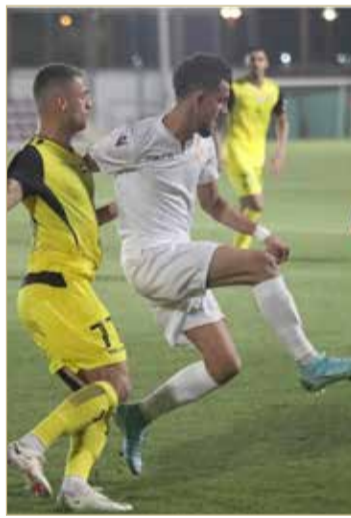
من لقاء الرفاع الشرقي والوصل الإماراتي

الحد يخسر من الوحدة في افتتاح البطولة الودية بالإمارات