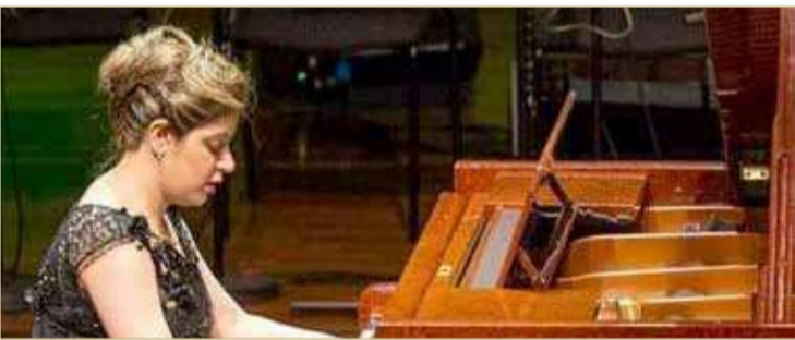
الفنانة البحرينية نور القاسم

بأداء منفرد، كما تمثل فرصة ثمينة للشباب لإثبات قدراتهم في العزف. والمعروف أن مملكة البحرين لديها عازفة البيانو الشهيرة الفنانة نور القاسم التي تعد من أبرز عازفات البيانو على مستوى العالم العربي ولها مشاركات دولية واسعة في مختلف المحافل، وتخرجت من معهد فيينا للموسيقى والفنون الدرامية على يد الأستاذة النمساوية اليزابيث بولمان، وحصلت على الرخصة النمساوية للدراسات العليا في البيانو تخصص الأداء.