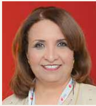
الشيخة حياة بنت عبدالعزيز

أشادت بدعم واهتمام ناصر بن حمد وخالد بن حمد