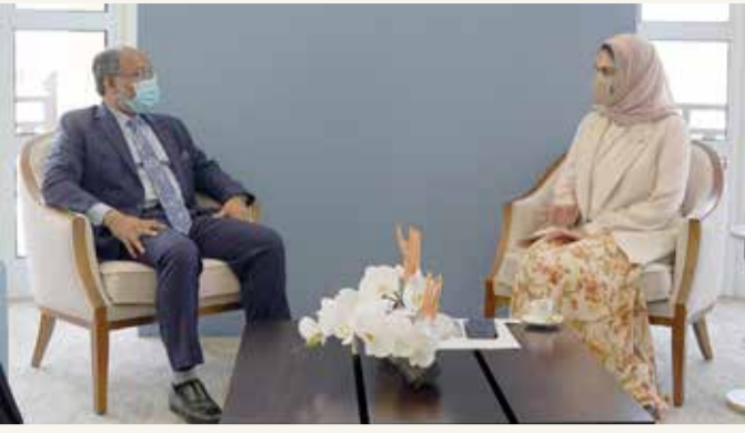
الأنصاري تستقبل سفير جمهورية بنغلاديش لدى البحرين

♦ الأنصاري: مشاركتنا فاعلة في مختلف مسارات التنمية الوطنية