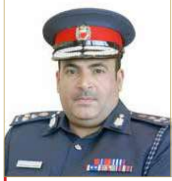
المدير العام للإدارة العامة للمرور

الحركة المرورية، والالتزام بالتحويلات المرورية في حالة غلق الشوارع، مع ضرورة التعاون مع رجال المرور من خلال الدوريات المتحركة والراجلة في جميع النقاط والطرق.