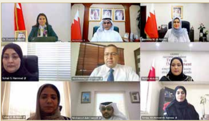
العصفور يؤكد أهمية تعزيز دور المرأة

وفي السياق ذاته، استعرضت الأمين العام المساعد للموارد البشرية والمالية والمعلومات نائب رئيس لجنة تكافؤ