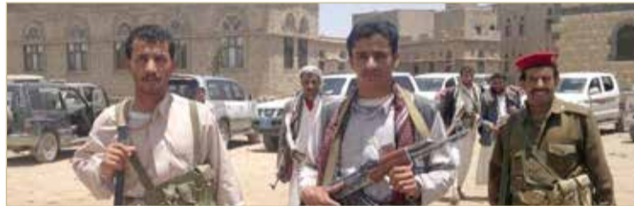
اليمن يواجه تحديات أمنية وسياسية جمة

سيارة "راف فور" أطلقوا النار على نعيم وأردوه على الفور. من جهة أخرى، يواجه المبعوث الأممي الجديد الى اليمن هانز غرونديغ تحديات وعراقيل كثيرة على الرغم من ترحيب الحكومة اليمنية وجماعة الحوثي به إلا أنهما استمرت في التمسك بمواقفهما "المتصلبة" إزاء شروط تحقيق السلام. وحتى اليوم، عقد غرونديغ لقاء واحداً، عبر اتصال مرئي، مع رئيس الحكومة، معين عبدالملك، بينما لم