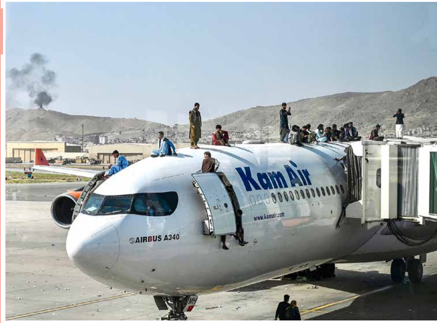
يتسلق الأفغان على متن طائرة أثناء انتظارهم في مطار كابول، بعد نهاية سريعة للحرب التي استمرت 20 عاماً في أفغانستان، إذ احتشد آلاف الأشخاص في مطار المدينة في محاولة للفرار من حركة ”طالبان“..