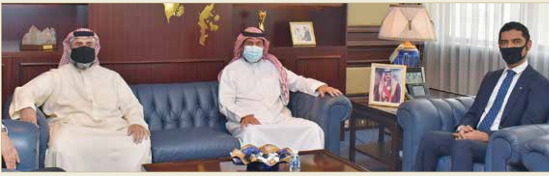
وزير الكهرباء مستقبلاً بوحمود والنصاري