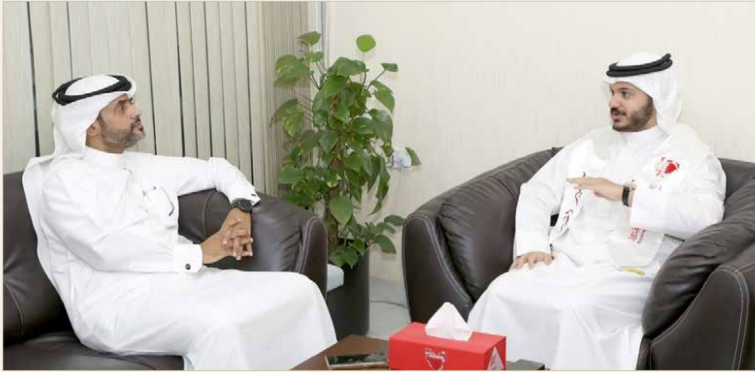
سفير الخير والرئيس إبراهيم الختام

ولقد تم اختياري أخيراً كرئيس للجنة الشباب والرياضة في برلمان الشباب العربي، وهي فرصة جديدة للتعلم، وخدمة الآخرين، وأنا أصنف نفسي منذ الصغر بأنني رجل وطني بحت، وأحداث 2011 المؤسسة كانت نقطة تحول كبيرة في حياتي، فالبحرين هي الأولوية القصوى لي، وهي أمانة في أعناقنا جميعاً.