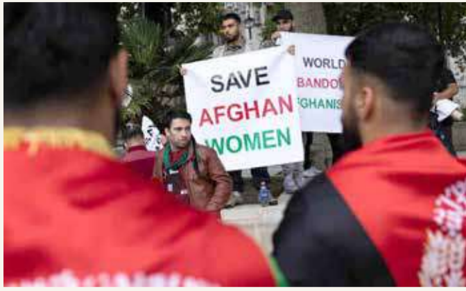
تظاهرة في لندن دعماً للمرأة الأفغانية