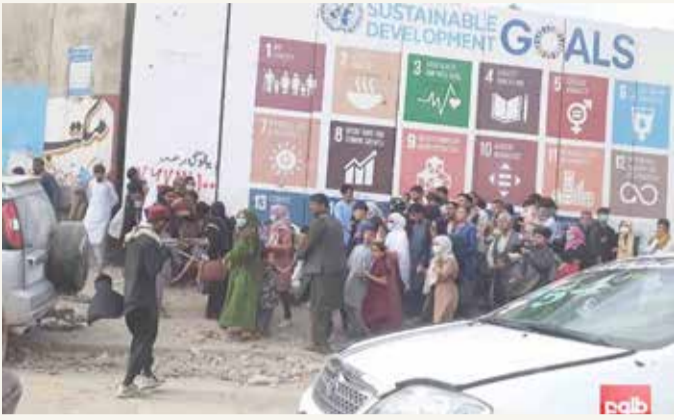
أحد المسلحين يشرح سلاحه أمام مدنيين أفغان

طالبان: سنشارك في حوار سلمي مع مسؤولي الحكومة السابقة