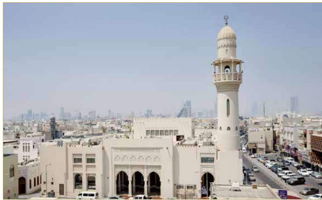
جامع الشيخ حمد بالمحرق

البلاد تعذ المساجد من أفضل البقاع في الأرض، وأحبها إلى الله عز وجل كما جاء في الحديث الشريف أن الرسول (ص) قال: (أحبُّ البِلَادِ إلى الله مساجِدُها)، وهي أيضاً من أفضل أماكن التربية، وإصلاح المجتمعات، والأفراد، وذلك بالتربية الإيمانية المتكاملة.