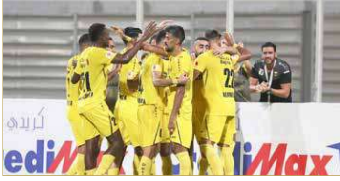
فرحة الخالدية بأحد الهدافين