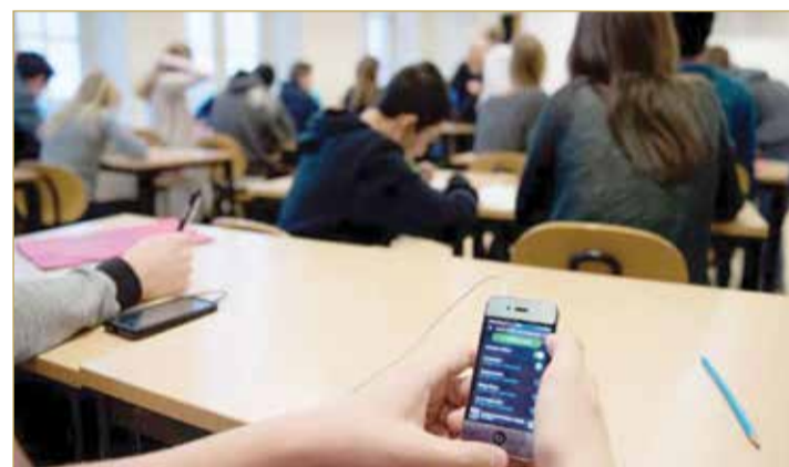
تطبيق نظام إحضار واستخدام الأجهزة الشخصية في عملية التعلم

استعمال الأجهزة الشخصية خضع للتقييم في 84 مدرسة