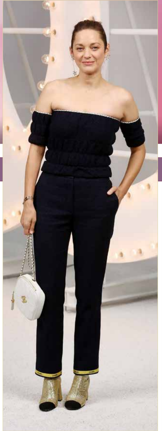
« ستحصل الممثلة الفرنسية ماريون كوتيار التي تعتبر من الأكثر عالمية بين الممثلات الفرنسيات المعاصرات الشهر المقبل في مهرجان سان سباستيان السينمائي في إسبانيا على جائزة عن مجمل مسيرتها.

كشفت الفنانة المصرية، فرح الزاهد، عن معاناتها من مرض الـ (OCD) أو الوسواس القهري، والذي وصفته بـ "الكابوس". وقالت فرح خلال لقاء ضمن برنامج معكم مني الشاذلي على تلفزيوني "سي بي سي"، إنها كانت تعاني من ثلاثة أنواع من هذا المرض، ولكن حالتها الصحية في الوقت الحالي أصبحت أفضل من السابق؛ إذ كانت تخجل سابقاً من التصرفات التي توضح أنها مصابة. وأضافت الممثلة المصرية الشابة (25 عاماً) "عندي منه 3 أنواع، هي الشخص الذي ينظم أشياء كثيرة جداً، ويتأكد من أغراضه أكثر من مرة، ويرتب أفكاره جداً؛ مثلاً الأرقام عندي لها مدلول وكل يوم علي أن أتذكر كل رقم عندي وأعيش في كابوس". وأشارت إلى أن "المريض بالوسواس القهري يحاول ألا يظهر ذلك، مضيفة "كنت أجعل أن أقول أو أفعل أي تصرفات من هذه أمام أي شخص، وهو مرض في الآخر". واستكملت فرح حديثها بالقول "مررت على فترة كنت لا أنام بغرفتي خوفاً من أن تتسخ، وأتمنى من الأهالي أن يكون عندهم وعي،