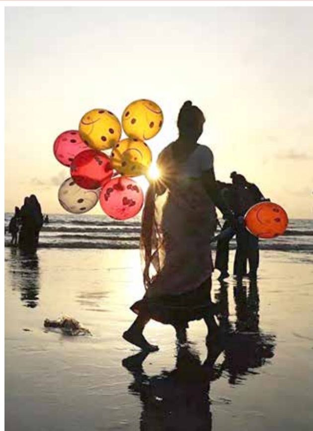
امراة تبيع البالونات على شاطئ جوهو في مومباي، الهند

اتخذ العلماء البرازيليون خطوة مهمة في البحث عن علاج لفيروس كورونا، حيث تمكنوا عن طريق سم ثعبان الزاراكوس من عزل عنصر البيبتيد الذي تمكن، في ظل ظروف مخبرية، من تقليل قدرة الفيروس على التكاثر بنسبة 75%. ووفقاً لموقع "روسكايا غازيتا"، جاء الاكتشاف بالصدفة من قبل باحثين في معهد الكيمياء التابع لجامعة بولستان الإقليمية، حيث اكتشفوا التأثير المضاد للبكتيريا لأحد البيبتيدات المستخرجة من سم ثعبان الجاراكوس. وقرروا على الفور تجربته على الفيروسات.