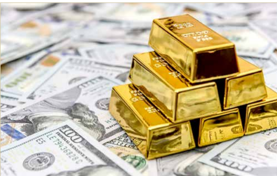
عواصم - رويترز

المعدن الأصفر أخفق في البقاء فوق ذلك المستوى خلال الأشهر الماضية