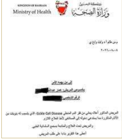
صورة ضوئية من افادة مرض عمار