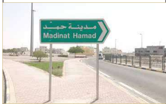
استكمال الإجراءات حالياً تمهيداً لتنفيذ المشروع