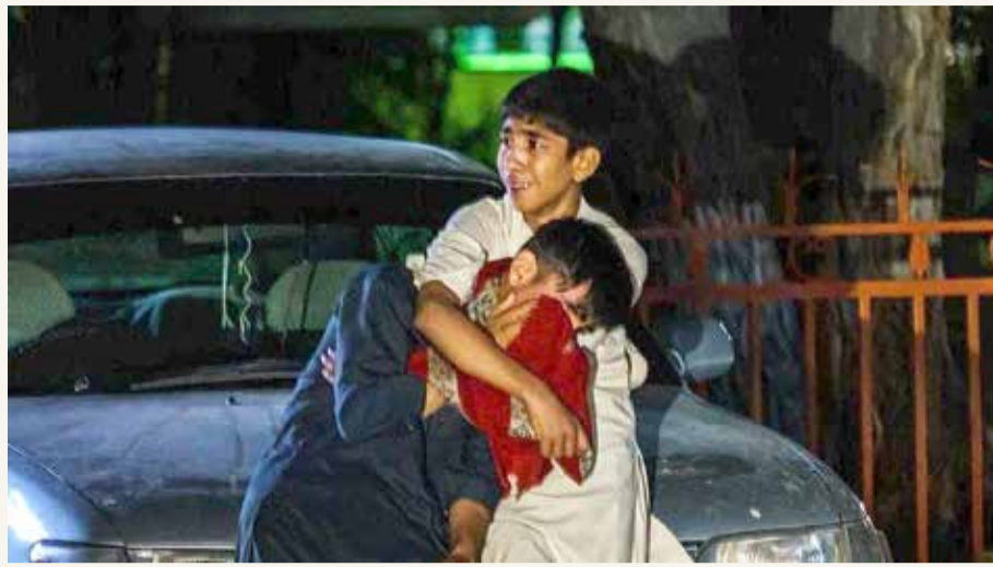
أطفال نجوا من التفجير في مطار كابل

الأمم المتحدة: الوضع الإنساني في أفغانستان كارثي وثلث السكان سيواجهون خطر المجاعة