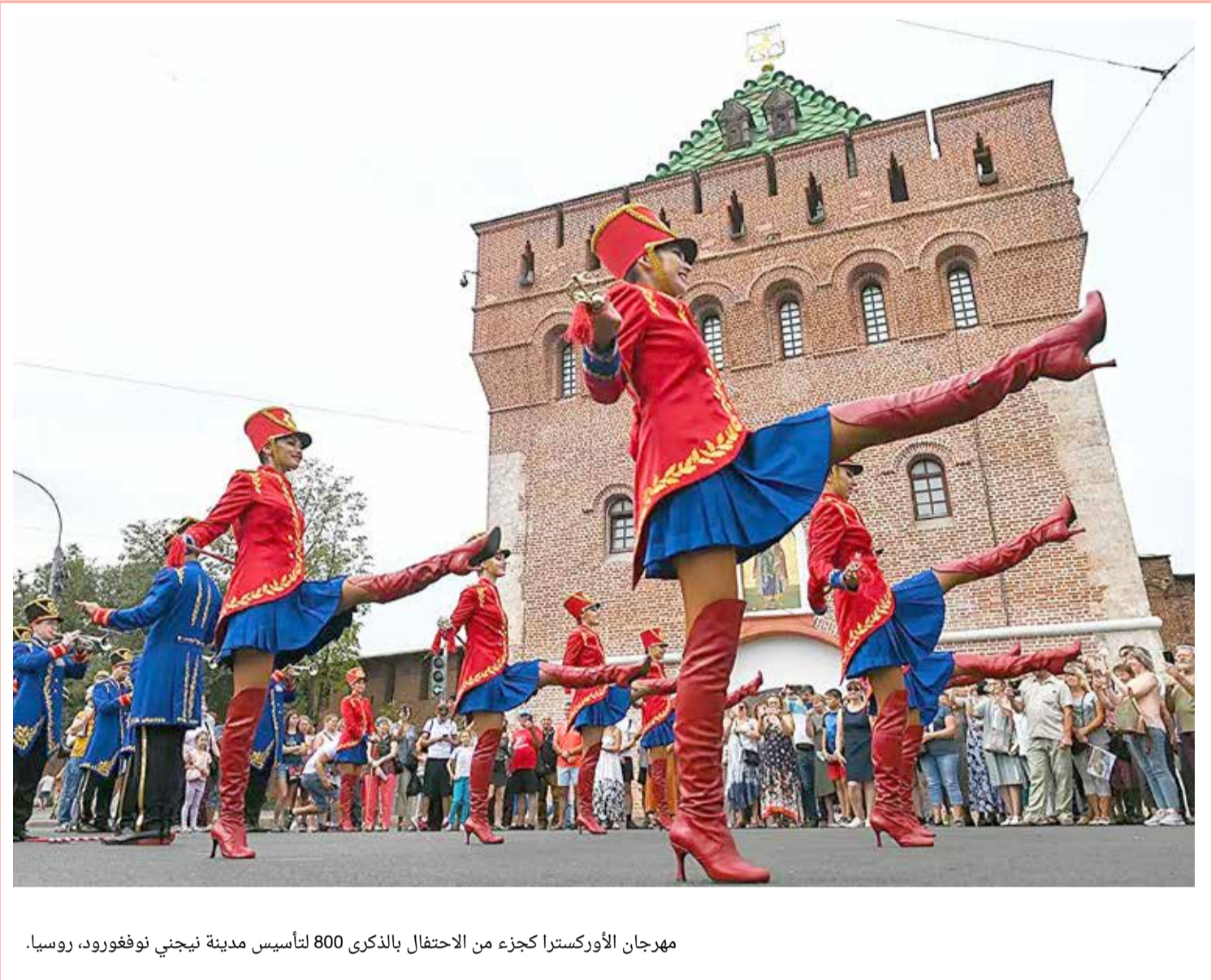
مهرجان الأوركسترا كجزء من الاحتفال بالذكرى 800 لتأسيس مدينة نيجني نوفغورود، روسيا.

أحدث توم كروز ضجة، يوم الخميس، خلال مهرجان "سينماكون" مدينة في لاس فيغاس يكشفه النقاب عن المشاهد الأولى من فيلمه المرتقب جداً "ميشن: إمبوسيل 7"، الجزء الجديد من سلسلة أفلام "المهمة المستحيلة". وفي هذا الفيلم، يؤدي توم كروز حركة مخاطرة مذهلة تتمثل في قفزة في الفراغ على دراجة نارية تسير بأقصى سرعة. وقال كروز (59 عاماً) خلال تناوله هذه المخاطرة في أحدث توم كروز ضجة، يوم الخميس، خلال مهرجان "سينماكون" مدينة في لاس فيغاس يكشفه النقاب عن المشاهد الأولى من فيلمه المرتقب جداً "ميشن: إمبوسيل 7"، الجزء الجديد من سلسلة أفلام "المهمة المستحيلة". وفي هذا الفيلم، يؤدي توم كروز حركة مخاطرة مذهلة تتمثل في قفزة في الفراغ على دراجة نارية تسير بأقصى سرعة. وقال كروز (59 عاماً) خلال تناوله هذه المخاطرة في