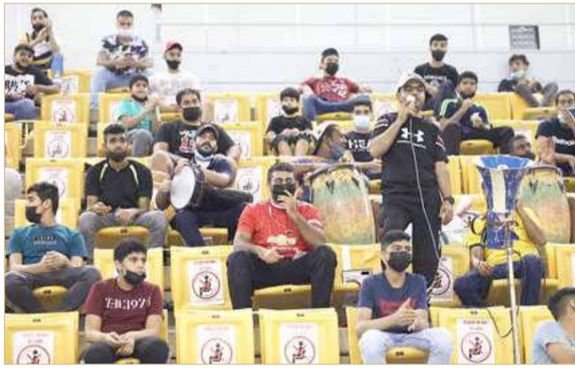
الرابطة الجماهيرية كانت حاضرة بقوة

المنتخبين القطري والعماني لأسباب وظروف خاصة بهما. أما بشأن المستوى الفني قال سلمان أن المستوى أفضل من المتوسط بشكل عام وأن اللقب منحصر بين المنتخبين البحريني والسعودي، مضيفاً بأن منتخب الإمارات حرص على المشاركة انطلاقاً من حرصه على نجاح البطولة وأن هذه المشاركة هي الأولى لجميع اللاعبين على المستوى الخارجي وهي أول بطولة رسمية للاعبين الناشئين وهي تأتي في إطار حرص الاتحاد الإماراتي على الاهتمام بفرق الفئات العمرية التي تشكل عدة المستقبل لكرة الطائرة الإماراتية، متمنياً لجميع المنتخبين المشاركة التوفيق والنجاح.