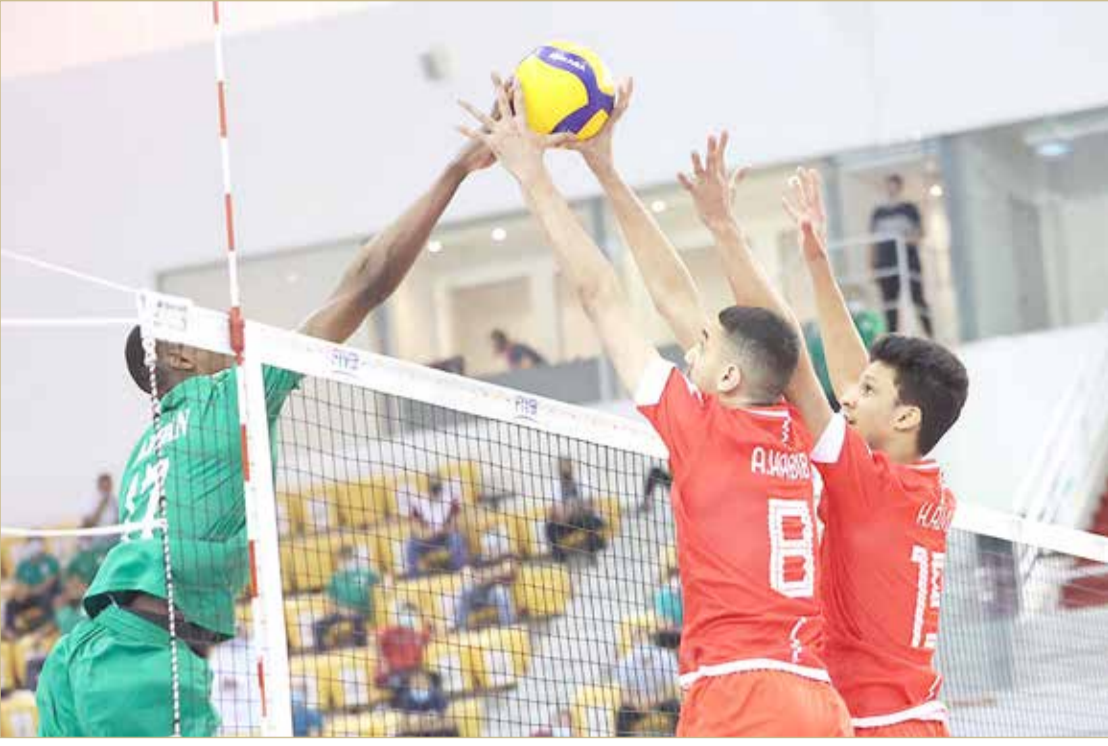
من لقاء منتخبنا والسعودية