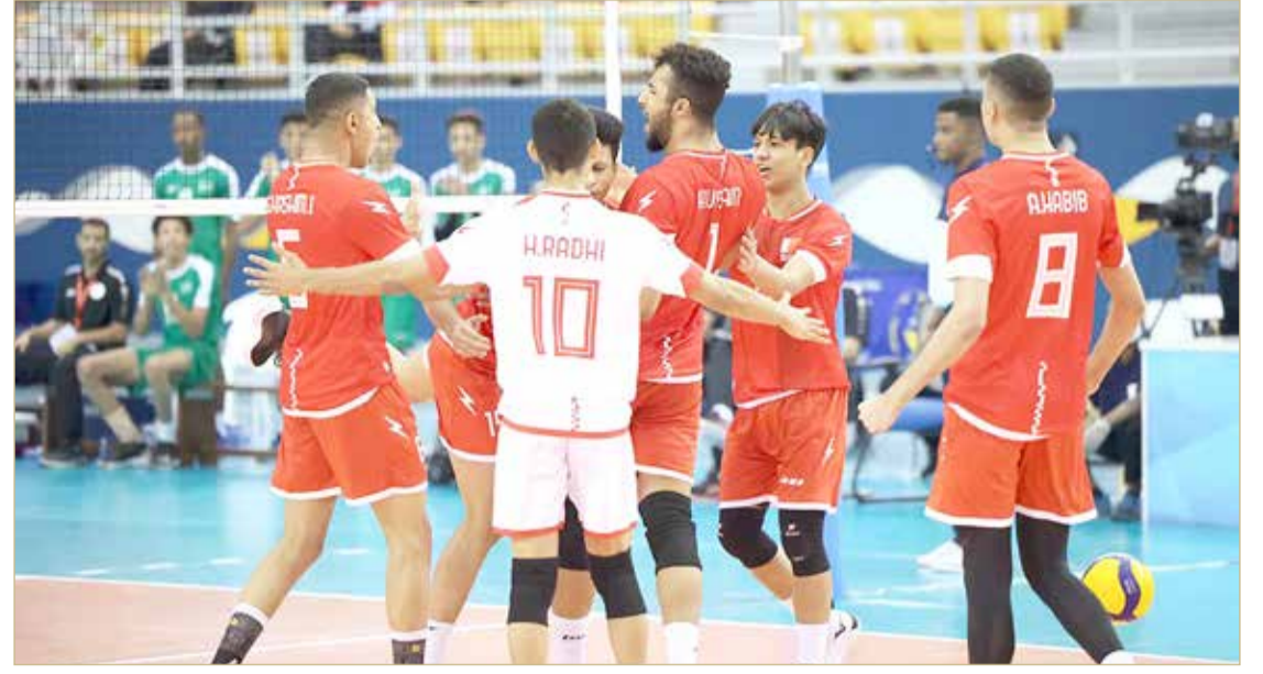
منتخبنا فاز على السعودية وتأهل لنصف النهائي