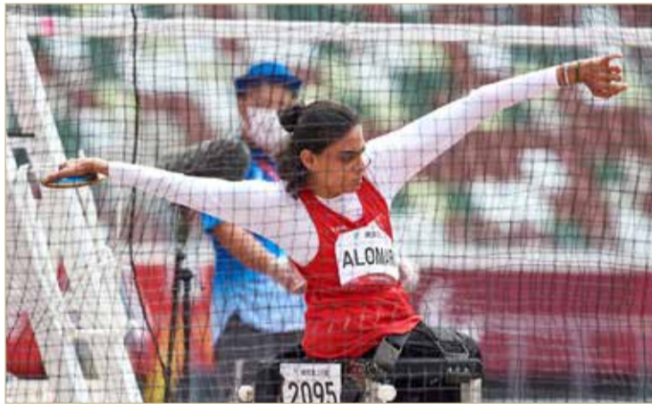
من المشاركة البحرينية في دورة الألعاب البارالمبية

بأرقام شخصية جديدة في دورة الألعاب البارالمبية طوكيو 2020