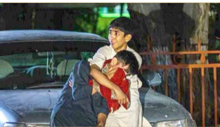
أطفال نجوا من التفجير في مطار كابل

الأمم المتحدة: الوضع الإنساني في أفغانستان كارثي وثلاث السكان يواجهون خطر المجاعة