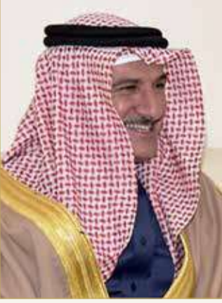
الشيخ أحمد بن عطية الله