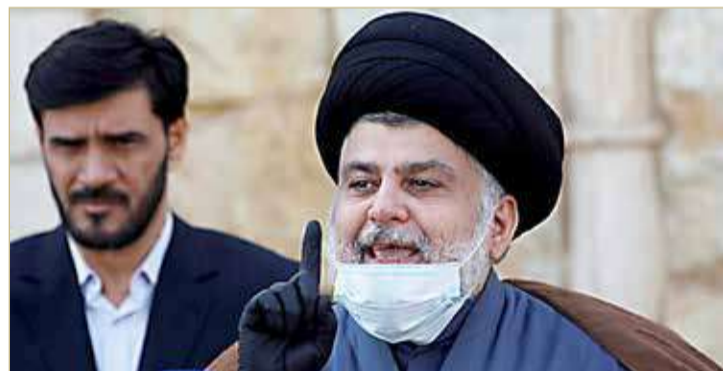
زعيم التيار الصدري مقتدى الصدر

أكد خوضها بعزم وإصرار لأن "المصلحة اقتضت"