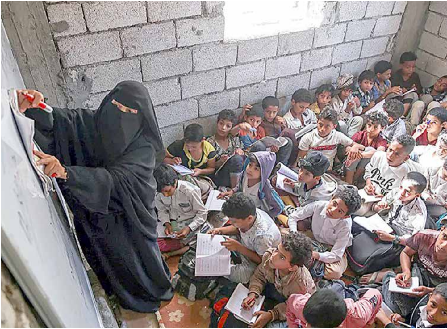
يحضر الطلاب اليمينيون دروسا في ميان سكنية وتجارية غير مكتملة تم تحويلها إلى فصول دراسية في مدينة تعز