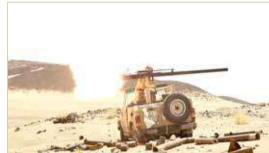
مقاتل تابع للحكومة اليمنية

والخطط العسكرية بما يحقق النصر ويخفف من الفاتورة الإنسانية.