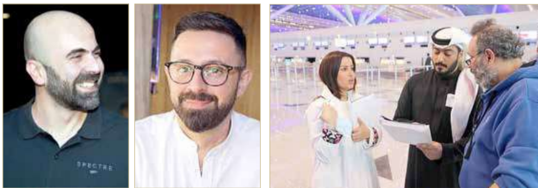
المخرج السعودي خالد الحربي وفريق العمل

انتهى المخرج السعودي خالد الحربي من تصوير آخر مشاهد فيلمه 90 يوم، في مطار جدة، كما نشر صوراً جمعت أبطال الفيلم من كواليس التصوير، وهو دراما اجتماعية وكوميديّة عن فترة العدة التي يجب شرعاً أن تبقى فيها المرأة بيت زوجها وكيف تعلق سطور العادات والتقاليد أحياناً على حكم الدين، ومن المرتقب إطلاقه قريباً في دور العرض السعودية وعدة دول عربية، وهو من إنتاج أفكار الغد للإنتاج الفني التي أسسها خالد وفيصل الحربي، وتتولى شركة MAD Solutions توزيع ومبيعات الفيلم عالمياً. ويقول المخرج خالد الحربي "نحاول من خلال أفكار الغد خلق قاعدة جماهيرية أكبر للسينما المحلية خلال السنوات المقبلة من خلال تقديم أفكار قريبة من المواطن السعودي والخليجي وكذلك ممثلين محترفين ومحجوبين؛ لأن الفيلم المحلي حتى الآن لا يمتلك أرضية