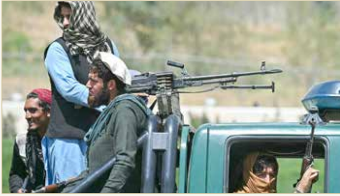
عناصر من طالبان في أحد شوارع كابول

وقال "ستتأكد من وجود آلية لإخراجهم من البلاد إذا أرادوا العودة مستقبلا"، مؤكدا أن "طالبان تهدت في هذا الصد".