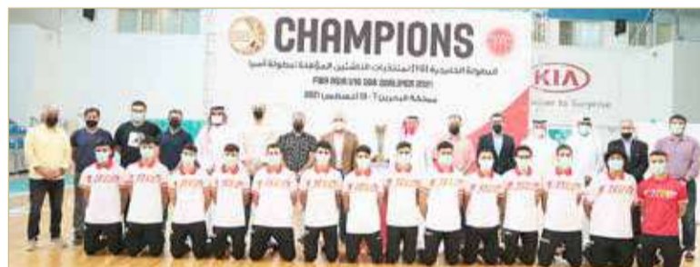
منتخب الناشئين لكرة السلة

العلوي: اللاعبون كانوا عند حسن الظن وأهل للمسؤولية