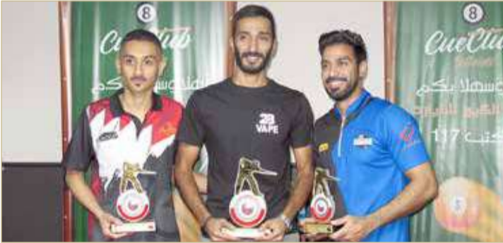
أصحاب المراكز الثلاثة الأولى

خطف الأنظار وحقق البطولة في ثاني مشاركاته