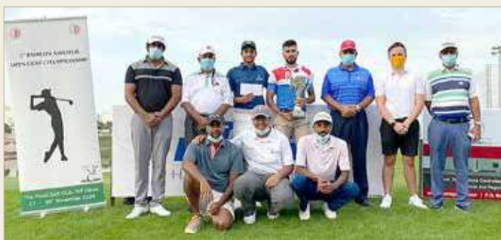
من منافسات الجوف