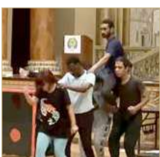
جانب من البروفات

اهتمام من قبل الأكاديميات ومراكز البحوث العربية والدولية، ويعد واحدا ممن تستثمر دراساتهم في المعاهد والأكاديميات المسرحية في عالمنا العربي.