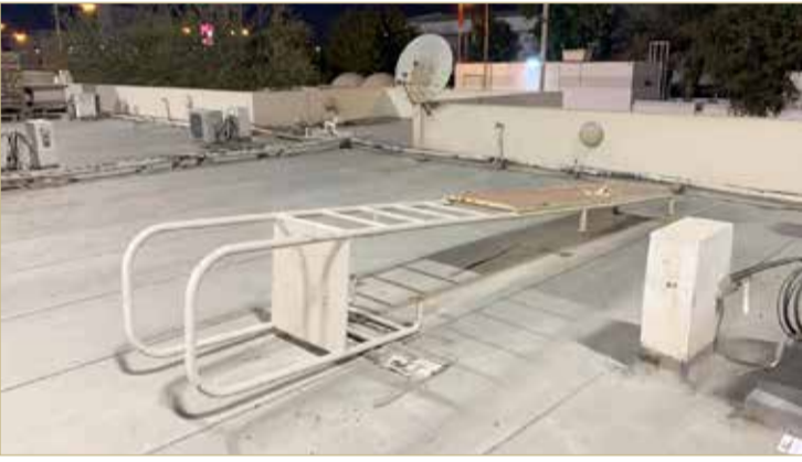
صورة للسلم الحديد لملاعب مدينة حمد

بشأن شكوى الإعلاميين عن السلم الخشبي المتهاك بملاعب مدينة حمد