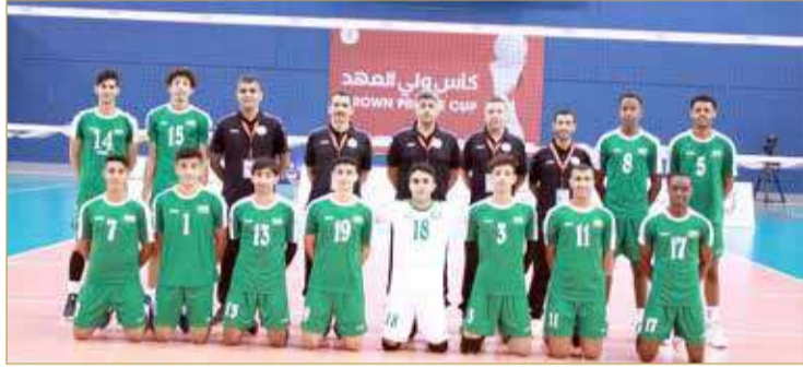
منتخب السعودية لكرة الطاائرة

منتخبنا يواجه السعودية في نهائي خليجي 6 للناشئين