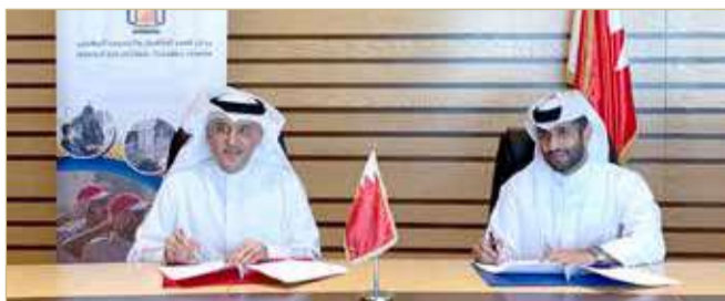
أثناء توقيع مذكرة التفاهم

التأهيل والتدريب المهني بموجب هذه المذكرة تنمية الشباب من خلال تعليم مهارات ريادة الأعمال التي تشمل مجموعة متنوعة من مجالات الأعمال. وستتجه الجهود التعاونية نحو دعم وتطوير رواد الأعمال الطموحين بالمعرفة الضرورية لإنشاء الأعمال وإطلاقها وتنميتها. إضافة إلى ذلك، ستعمل هذه الشراكة