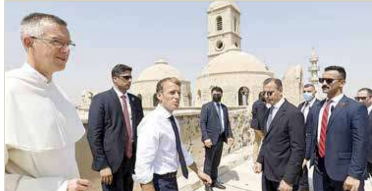
ماكرون يزور مسجد النوري وكنيسة الساعة في الموصل

ووصفه بأنه دفعة كبيرة للعراق وقيادته. كذلك، تعهد ماكرون بالإبقاء على القوات الفرنسية في العراق بغض النظر عن خيارات الأميركيين، طالما أن الحكومة العراقية تطلب دعما.