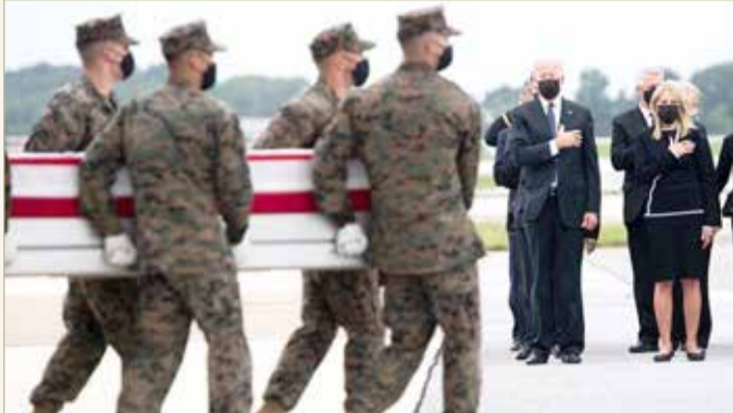
بايدن يستقبل جنابمين القنصل الأميركيين بتفجير مطار كابل

الضربة لن تكون الأخيرة. وتزامن إعلان الضربة الجوية الأخيرة مع وجود الرئيس الأميركي وزوجته جيل بايدن صباح الأحد في قاعدة دوفر العسكرية شرق