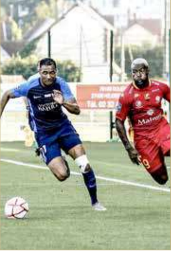
لقطة لفريق باريس أف سي الفرنسي