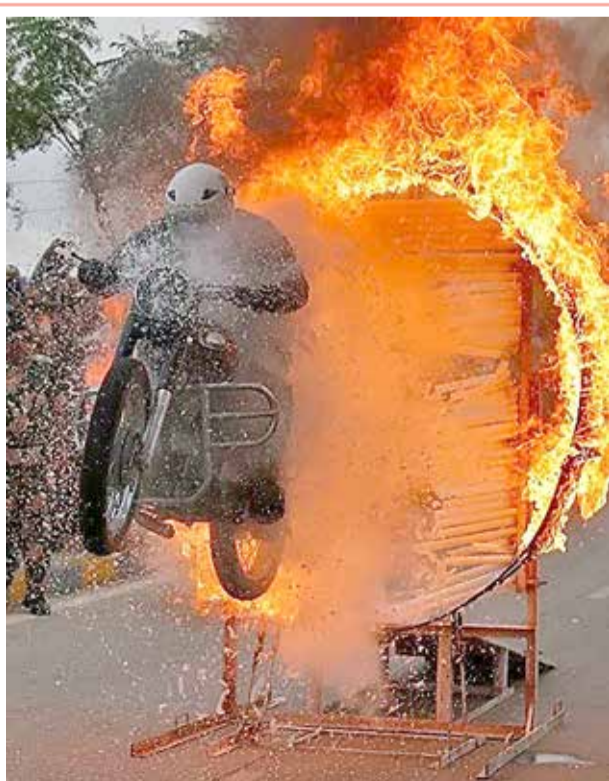
جندي من قوة حراسة الحدود ينفذ حركة بهلوانية على دراجته النارية أثناء عرض على الطريق للاحتفال بمرور 75 عامًا على استقلال الهند، في أحمد آباد

أعلنت الشرطة الفرنسية توقيف رجل في الخامسة والثلاثين من عمره بمدينة ستراسبورغ شرقي البلاد بسبب ذبحه عجلا. وبحسب وكالة "فرانس برس"، فقد تلقت الشرطة الفرنسية مكالمات عديدة للإبلاغ عن سماع صوت حيوان يعاني بعد ظهر الثلاثاء الماضي. وعقب وصول أفراد من الشرطة الذين استجابوا للنداءات، تم العثور على عجل مقطوع الرأس بشكل جزئي وفي حالة احتضار. وقال بيان صادر عن الشرطة إن أطراف العجل الأربعة كانت مقطوعة، وشخص كان يقوم بعملية الذبح. وبعد توقيف الشرطة للجاني، تم استدعاؤه حتى يمثل أمام المحكمة يوم 7 ديسمبر. من جانبها، تقدمت "جمعية حماية الحيوانات" في المدينة الفرنسية بشكوى ضد هذا الشخص لقيامه بقتل جسد العجل بهذه الطريقة.