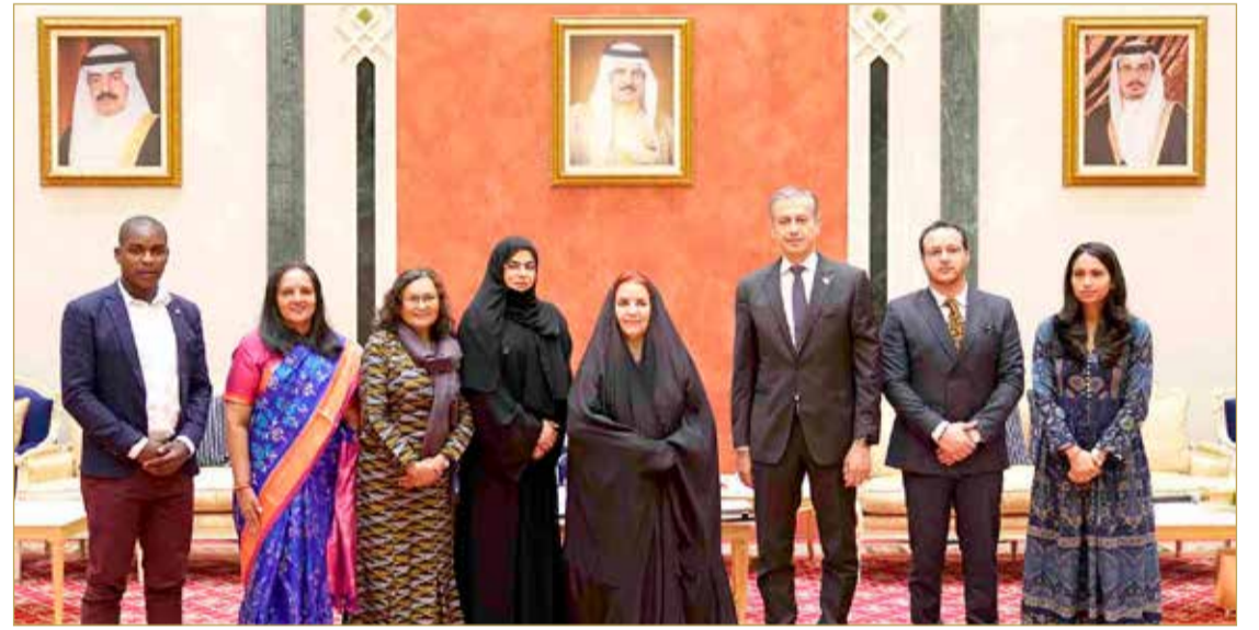
استقبال الفائزين بجائزة صاحبة السمو الملكي الأميرة سبيكة بنت إبراهيم آل خليفة العالمية لتمكين المرأة

يتعارض مع الشريعة الإسلامية ويحفظ سيادة الدولة إلى السلطة التشريعية، وقد التزمت مملكة البحرين بالشراكة مع جميع الجهات المعنية من مؤسسات رسمية ومؤسسات المجتمع المدني بتنفيذ التزاماتها بإحكام هذه الاتفاقية سواء على صعيد برامج التوعية بمواد هذه اتفاقية أو على صعيد إعداد التقارير الرسمية الدورية بشأن متابعة تنفيذ مواد الاتفاقية، أو متابعة ملاحظات لجنة السيدا عن تلك التقارير فيما يتعلق برفع التمييز ضد المرأة بحسب مواد ونود الاتفاقية، فضلاً عن مصادقتها على العهد الدولي لحقوق الإنسان بشقيه السياسي والمدني، والحقوق الاقتصادية والاجتماعية والثقافية، والتزامها بكل مبادئها، ومعاييرها، وتنفيذها عملياً، وبالكل.