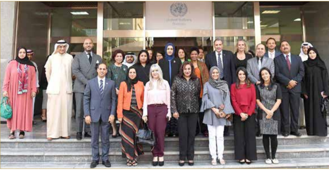
افتتاح المكتب التمثيلي لهيئة الأمم المتحدة للمرأة في البحرين

ترسيخ اسم البحرين في صميم الحراك الإقليمي والدولي المرتبط بتمكين وتقدم المرأة