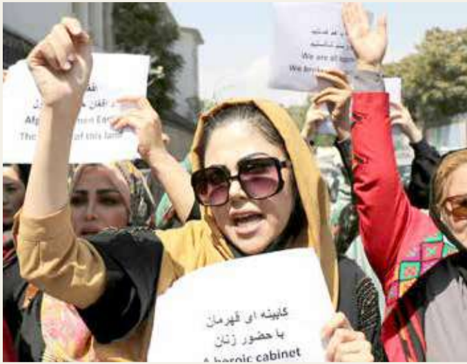
أفغانيات يتظاهرن في كابول ضد طالبان

هذه الحقوق ستكون محترمة. لكنهم ألحوا في الوقت نفسه، إلى أن يحكمهم المقتلة قد لا تضم أية وزيره؛ إذ إن النساء يمكن أن يتسلمن وظائف بمستويات أقل. وتظاهرت ناشطات ضد هذا الاحتمال الخميس في هرات. ورددت المتظاهرات شعارات طالبت بحقوق المرأة وهتفن "من حقنا أن نحصل على تعليم وعمل وأمن". كما رددن "لسنا خائفات، نحن متحدات". ولليوم الثاني على التوالي في كابول، خرجت عشرات النساء الأفغانيات، أمس السبت، متحدين الخوف، للمطالبة بحقوقهن. ورفعت المتظاهرات لافتات وهتافات، بحسب ما أظهرت مقاطع مصورة، بثها ناشطون، تطالب بحقوقهن في التعليم والعمل وصون الحريات، إلا أن حركة "طالبان" منعت المحتجات من التوجه إلى القصر الرئاسي وكرت التظاهرة.