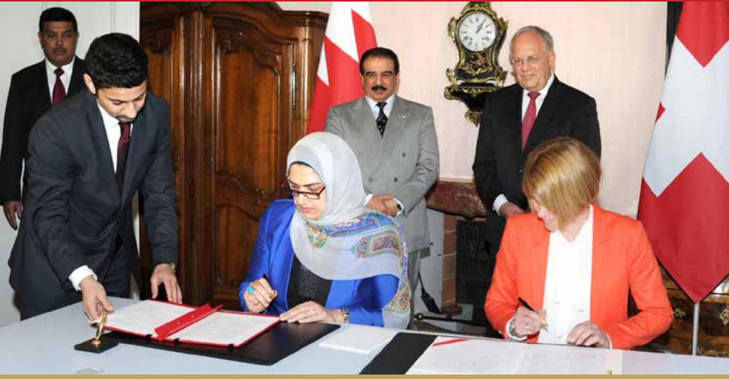
توقيع مذكرة تفاهم بين المجلس الأعلى للمرأة والاتحاد السويسري