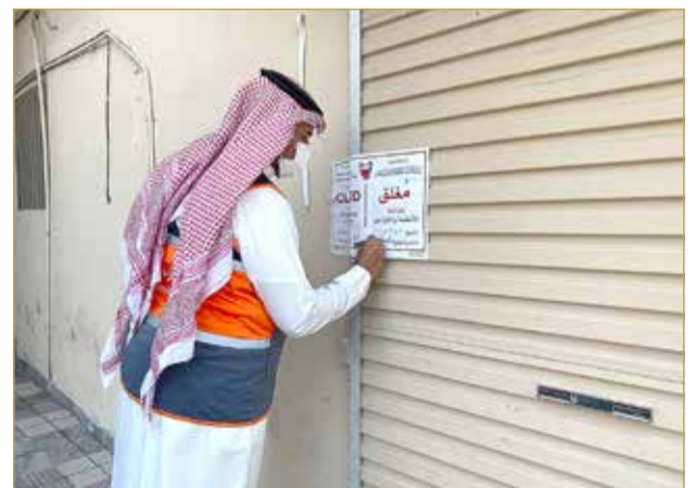
المنامة - الصناعة والتجارة

قامت وزارة الصناعة والتجارة والسياحة باتخاذ كافة الإجراءات القانونية حيال محل لبيع وتجارة المجوهرات بمنطقة المالكية لقيامه بعدة مخالفات تجارية، بالإضافة إلى تلقي الوزارة عدة شكاوى بشراء بعض المجوهرات والذهب واستلام صاحب المحل