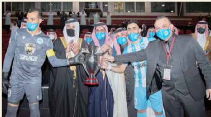
سمو الشيخ خالد بن حمد متوجاً الرفاع بطل النسخة الماضية

تقام عند 8 من مساء الأحد 5 سبتمبر الجاري، مراسم سحب قرعة كأس جلالته الملك، لكرة القدم للموسم الرياضي 2021-2022، وذلك في برنامج مباشر يبث على قناة البحرين الرياضية. وستكون القرعة بدءاً من دور الـ 16 ووصولاً للمباراة النهائية. وستسحب القرعة بشكل موحد، إذ تم تصنيف الأندية على مستويين: الأول يضم أندية الرفاع والرفاع الشرقي والمنامة والمحرق والحد والأهلي والبديع