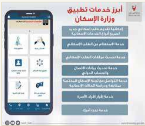
المنامة - وزارة الإسكان

الحمير: خطة شاملة للتحويل الرقمي وتقليص الحضور الفعلي لمبنى الوزارة