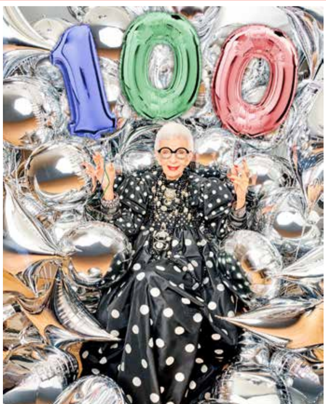
سيدة الأعمال إيريس ابفيل عن بلوغها 100 عام: أشعر أنني أصغر مرافقة في العالم

أعلن نجم البوب البريطاني إلتون جون عن صدور ألبوم جديد الشهر المقبل بعنوان “The Lockdown Sessions” أعده في فترة الحجر بالتعاون مع كوكبة من النجوم. ويتضمّن الألبوم المزعم صدوره في 22 أكتوبر 16 أغنية، من بينها 10 أغنيات جديدة تعاون فيها البعض منها مع فنانين مثل دوا ليبا وغوريلاز وليل ناس اكس ومايلي سايرس ونيكي ميناج وستيفي ووندر وستيفي نيكس. وقال إلتون جون “آخر ما كنت أتوقّع فعله خلال تدابير الحجر هو إعداد ألبوم، لكن مع توسّع انتشار الوباء، راحت مشاريع متفرقة تتبلور”. وأوضح “بعض جلسات التسجيل أجريت عن بعد عبر زووم، وهو أمر لم أعده من ذي قبل”.