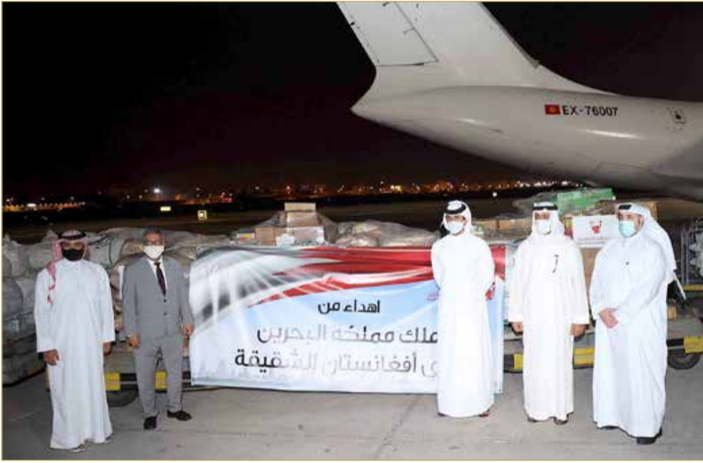
ارسال شحنة مساعدات الى افغانستان

المنامة - المؤسسة الملكية للأعمال الإنسانية