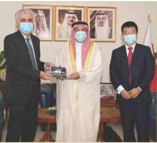
محافظ المحرق مستقبلاً المدير التنفيذي لشركة هواوي البحرين ورئيس المجموعة العالمية للذكاء الاصطناعي

محافظ المحرق: دعم سخي من "هواوي البحرين" للكثير من المشاريع