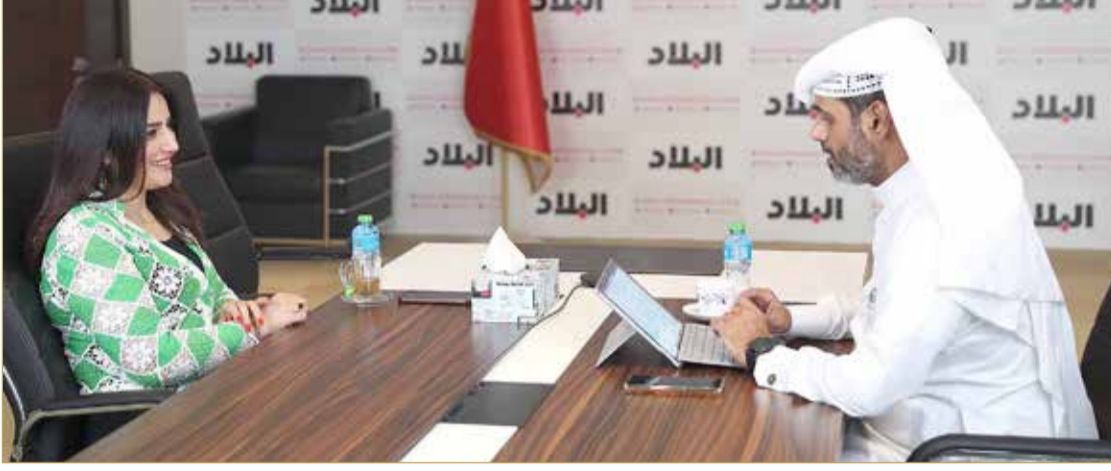
سامية حسين منحة للزميل النهام

رئيس تسويق "الجائزة": سمو الشيخ عيسى بن علي يحرص من خلال جائزة سموه على نشر مفهوم العمل التطوعي