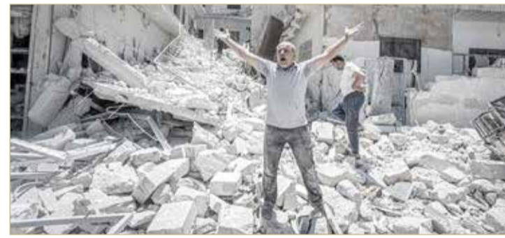
جانب من القصف على منازل بدرا

عدم الكشف عن اسمه لأسباب أمنية)، إن الأسد يحاول الانتقام من أهالي الحي لرفضهم مسرحية الانتخابات الرئاسية الأخيرة (مايو 2021). وأضاف أن الحل الوحيد أمام الشعب للخلاص من انتقام الأسد هو النزوح الجماعي من الحي.