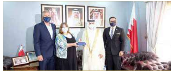
محافظ العاصمة رئيس لجنة "معاً" بطلع وفدا أميركي على جهود المملكة لحماية النشء والشباب

تقديم المساندة لتطوير المناهج والبرامج التدريبية وآليات التقييم