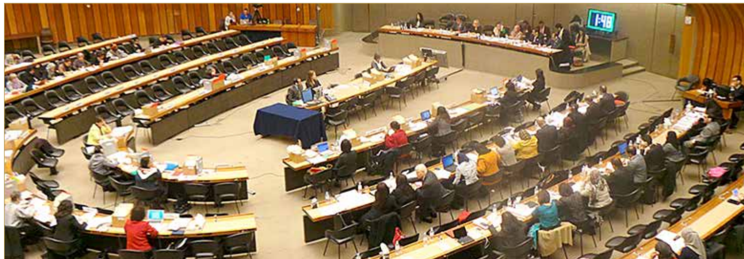
مشاركة المجلس الأعلى للمرأة في تقديم مملكة البحرين لتقريرها عن اتفاقية القضاء على أشكال التمييز ضد المرأة (السيداو)

وبعد مرور 20 عاماً من تأسيسه استطاع المجلس أن يضع أسس ثابتة ليكون مرجعاً رسمياً وبيت الخبرة والمعرفة في شؤون المرأة على المستوى الإقليمي والدولي، ومن منطلق الحرص على تفعيل مبدأ التعاون المشترك والاستفادة من الخبرات والتجارب المختلفة في مجال التعاون الإقليمي والدولي وإبراز مدى تقدم مملكة البحرين في مجال تمكين ونهوض المرأة، فقد عمد المجلس الأعلى للمرأة على تفعيل شراكات متعددة مع المنظمات والوكالات والهيئات الأممية والدولية المتخصصة، من أهمها: هيئة الأمم المتحدة للمرأة