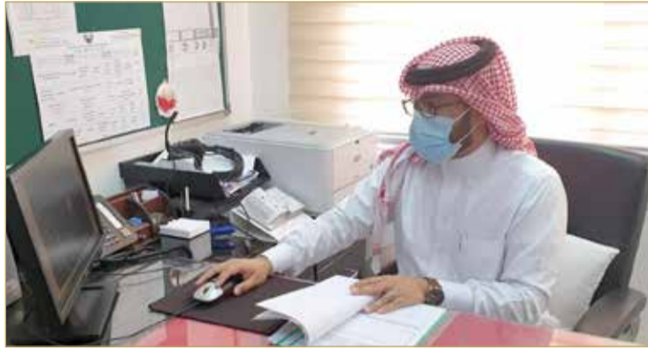
فرق عمل للتعامل مع الظروف وضمان انسيابية اليوم الدراسي