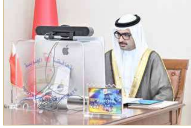
سمو محافظ الجنوبية