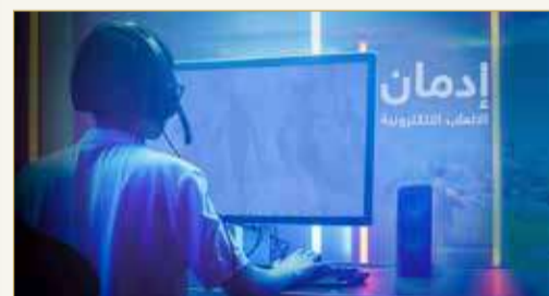
إدمان الألعاب الإلكترونية يدفع الأطفال إلى الإكتئاب

فرضت جائحة كورونا على الأطفال المكوث لساعات أطول أمام الإنترنت خصوصا الألعاب الإلكترونية، كبديل للاحتكاك بالآخرين، مع ما يتبع هذا من أضرار على المخ والجسم، ومن هنا جاءت فكرة بعض الاختصاصيين في البرمجة لتشجيع الأطفال على تحويل هذا اللعب إلى نشاط وإبتكار ينمي المخ ويحميه. فماذا لو صمم طفلك لعبة إلكترونية بنفسه وأصبح مبرمجا ومنتجا لأفلام الغرافيك بدلا من أن يكون مستهلكا لمحتوى ضار وغير آمن؟ فقد استطاع فريق مصري متخصص تحويل اهتمام بعض الأطفال والمراهقين من مجرد مستهلكين لهذه الألعاب إلى مهتمين بتعلم برمجة الألعاب واستخدام تقنيات الغرافيك بما يناسب قدراتهم الذهنية وشغفهم بالإلكترونيات. ويقول مدير إحدى شركات البرمجة ورئيس الفريق أشرف عبد الحميد: إنه في ظل قضاء ساعات طويلة أمام شاشات الكمبيوتر والهواتف النقالة للتسلية بالألعاب الإلكترونية التي استهوت الصغار والكبار، كان لا بد من بديل، لاسيما في حالة العناد التي يشتكي أولياء الأمور منها حين يرفض أبناؤهم البعد عن هذه الألعاب. وأوضح عبد الحميد لـ"سكاي نيوز عربية" أن