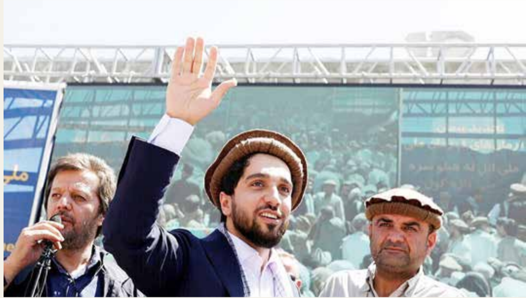
قائد "جبهة المقاومة الوطنية" أحمد مسعود

دعا قائد المقاومة المناهضة لطالبان في وادي بانشير الأفغاني أحمد مسعود، أمس الاثنين، في تسجيل صوتي إلى "انتفاضة وطنية" ضد الحركة، مقرا بسقوط أفغانستان كاملة بيد طالبان. وقال قائد "جبهة المقاومة الوطنية" في رسالة صوتية أرسلت إلى وسائل الإعلام "أينما كنتم، في الداخل والخارج، أحكم على بدء انتفاضة وطنية من أجل كرامة وحرية وازدهار بلدنا".