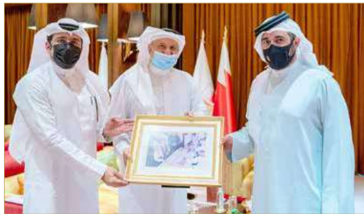
سموه مستقبلاً رئيس اتحاد الألعاب الذهنية

من جانبهم، عبر رئيس الاتحاد الملكي للفروسية وسباقات القدرة، ورئيس الاتحاد البحريني للألعاب الذهنية والإلكترونية، عن تقديرهم الكبير لسمو الشيخ خالد بن حمد آل خليفة، والدور الذي يضطلع به سموه لخدمة القطاع الرياضي، مؤكداً أن الجهود المميزة التي يبذلها سموه، تنعكس إيجاباً على الدفع بعجلة التقدم في هذا القطاع الحيوي، مضيفين أن الاتحادين سيواصلان جهودهما من خلال تنفيذ الخطط والبرامج التي تتوافق مع سياسات الهيئة العامة للرياضة برئاسة سموه؛ لتطوير النظام الرياضي على جميع المستويات بما يخدم حاضر الرياضة ومستقبلها بالمملكة.