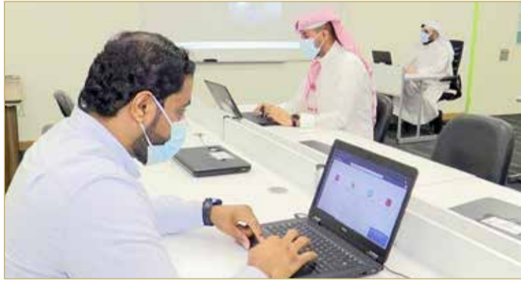
إنشاء 3 مبان أكاديمية بمواصفات عصرية في 3 مدارس