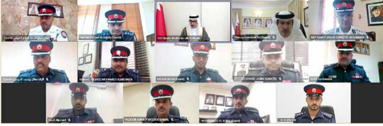
سمو الشيخ خليفة بن علي بن خليفة مترئسا اجتماع اللجنة الأمنية للعام 2021 عبر تقنية الاتصال المرئي "عن بعد"

◆ سمو الشيخ خليفة بن علي يشيد بيقظة الدفاع المدني في إخماد حريق مسجد عسكري