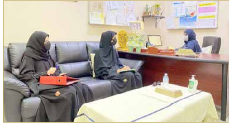
تأليف وتطوير 55 كتاباً ورقياً ورقمياً لتلبية متطلبات العصر