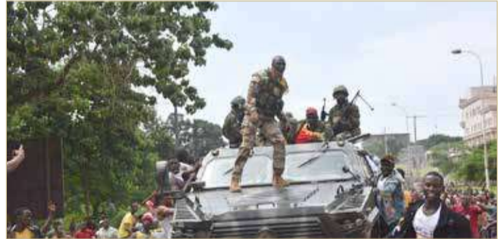
سكان في كوناكري يحتفلون بالانقلاب لدى مرور عناصر من الجيش