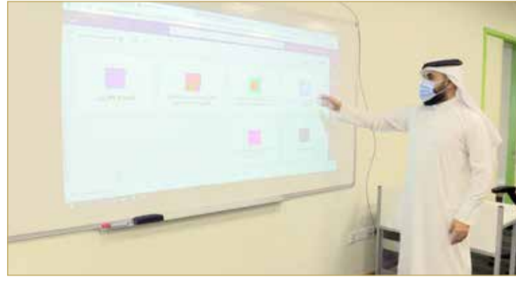
إعداد الخطط الدراسية المبررة للفصلين الأول والثاني