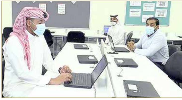
آلية التعلم ستكون وفقاً لمستجدات الإشارة الضوئية