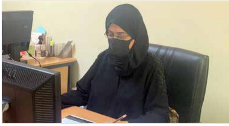
تستمر الوزارة في تطبيق خطط واستراتيجيات التدريب والتمهين