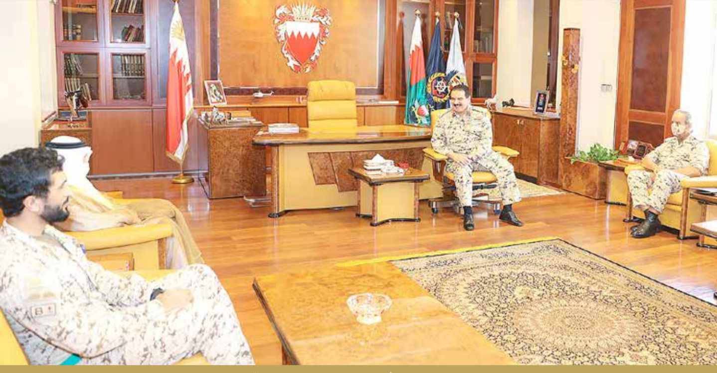
جلالة الملك المفدى القائد الأعلى يزور القيادة العامة لقوة دفاع البحرين