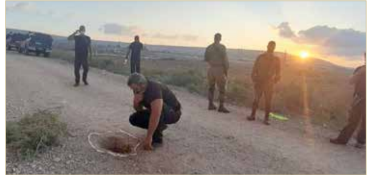
النفق الذي هرب عبره الأسرى الفلسطينيون