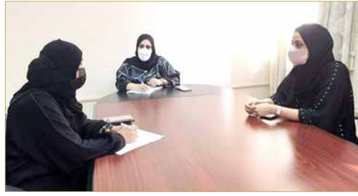
توفير احتياجات إعادة تشغيل 3 مدارس تم إخلاؤها مسبقاً