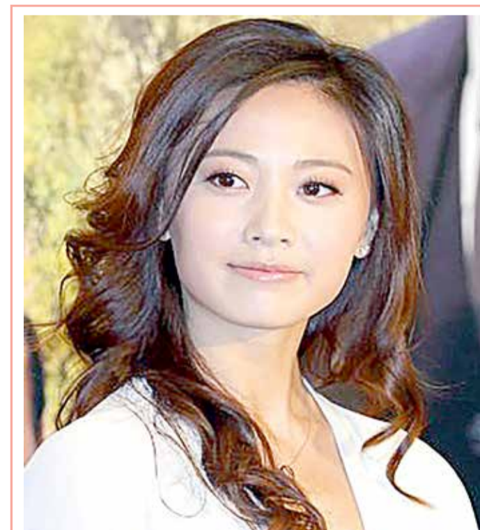
تصدر فيلم المغامرات والحركة الجديد "شانغ- شي وأسطورة الخواتم العشرة" إيرادات السينما في أميركا الشمالية محققا إيرادات بلغت 71.4 مليون دولار. والفيلم بطولة سيمو ليو وأوكوافينا وفالا تشين وتوني لونغ ومن إخراج ديبستين كريتون.