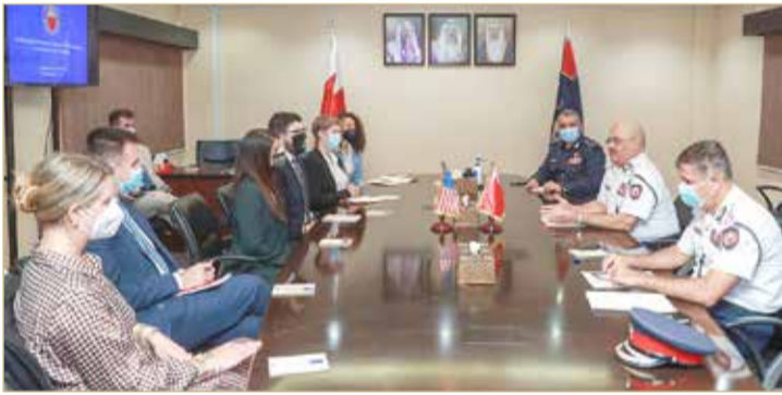
رئيس الأمن العام يستقبل وفداً من موظفي مجلس الشيوخ الأمريكي