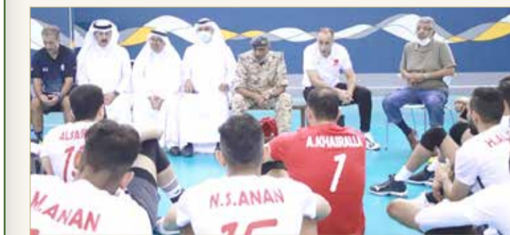
رئيس الاتحاد لدى زيارته تدريبات المنتخب