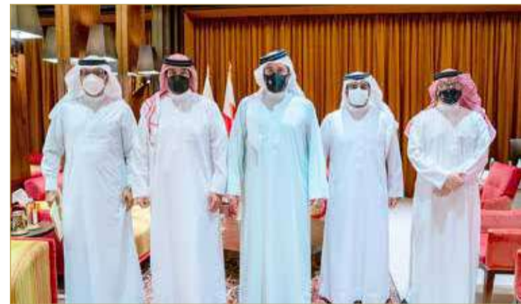
سمو الشيخ خالد بن حمد مستقبلاً رئيس الاتحاد الملكي للفروسية وسباقات القدرة

التقدم في مستوى الألعاب الرياضية ومتنسيبها، والتي تدفع نحو تحقيقها النتائج المميزة. بعدها، أطلع سمو الشيخ خالد بن حمد آل خليفة على الخطط المستقبلية، التي سينفذها الاتحادان في الفترة المقبلة، متطلعاً سموه لاستمرار الجهود