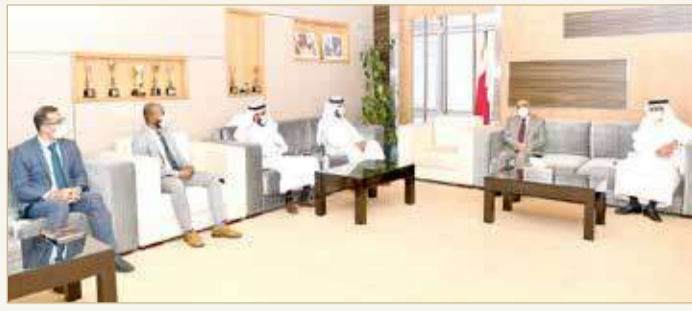
الوزير خلف يلقي المهندسين الزراعيين

♦ طلبات بزيادة مستوى دعم المزارعين المقدم من بنك التنمية و"تمكين"