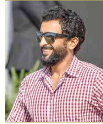
هولندا - المكتب الإعلامي

أكد ممثل جلالة الملك للأعمال الإنسانية وشؤون الشباب سمو الشيخ ناصر بن حمد آل خليفة أن مكانة الفريق الملكي للقدرة في المشاركات الخارجية تجسد الدعم اللامحدود الذي تحظى به رياضة الفروسية من الفارس الأول في المملكة عاهل البلاد حضرة صاحب الجلالة الملك حمد بن عيسى آل خليفة المفدى حفظه الله ورعا، والاهتمام المباشر من ولي العهد رئيس مجلس الوزراء صاحب السمو الملكي الأمير سلمان بن حمد آل خليفة حفظه الله.