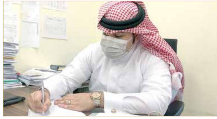
تطبيق نظام المناطق التعليمية ضمن الهيكل المؤسسي الجديد

وأضافت الوزارة أنه بتوجيهات من مجلس الوزراء، وبالتعاون مع وزارة