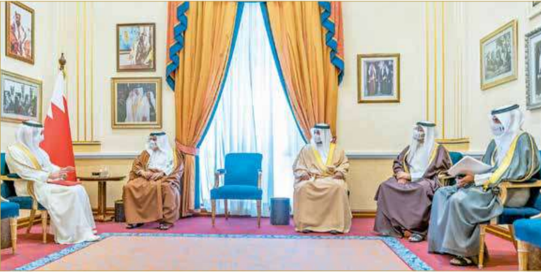
سمو ولي العهد رئيس مجلس الوزراء يستقبل سفير دولة الإمارات العربية المتحدة الشقيقة

♦ سمو ولي العهد رئيس الوزراء يتلقى دعوة محمد بن زايد لزيارة أبوظبي