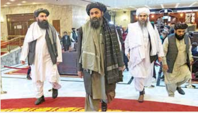
الملك عبدالغني برادر

يذكر أنه بعد سيطرة طالبان على السلطة في أغسطس، دعت الصين إلى تشكيل حكومة منفتحة وممتلئة