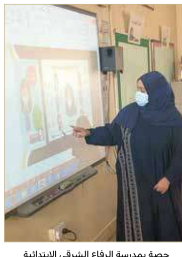
حصة بمدرسة الرفاع الشرقي الابتدائية