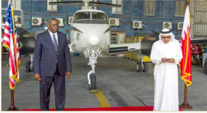
وزير الخارجية يعقد مؤتمراً صحافياً مشتركاً مع وزير الدفاع الأميركي

لشراكتتهما، وتوضح بشكل جلي التزامنا المشترك للحفاظ على السلام والأمن الإقليميين والدوليين. وأعرب وزير الدفاع الأميركي عن شكره لجلالة الملك وصاحب السمو الملكي ولي العهد رئيس مجلس الوزراء على دعم مملكة البحرين الاستثنائي في تسهيل العبور الآمن للأشخاص الذين تم إجلاؤهم من أفغانستان. كما أكد وزير الدفاع الأميركي متانة العلاقة بين الولايات المتحدة الأميركية ومملكة البحرين، معرباً عن هدفه في تعميق الشراكة الدفاعية بين البلدين، مكرراً الشكر للقيادة البحرينية على الالتزام باستضافة القوات الأميركية في البحرين. وأشار إلى لقائه المشير الركن الشيخ خليفة بن أحمد آل خليفة القائد العام لقوة دفاع البحرين، معرباً عن شكره على الدعم الذي حظيت به عملية (ALLIES REFUGE)، وتأكيد التزامه بالهوض بشراكة الدفاع الأميركية البحرينية. كما أشار إلى لقائه بأعضاء فرقة العمل 58، التي كانت مسؤولة عن العمل مع قوة دفاع البحرين لتسهيل الإجلاء الآمن للأفراد من أفغانستان عبر مملكة البحرين.