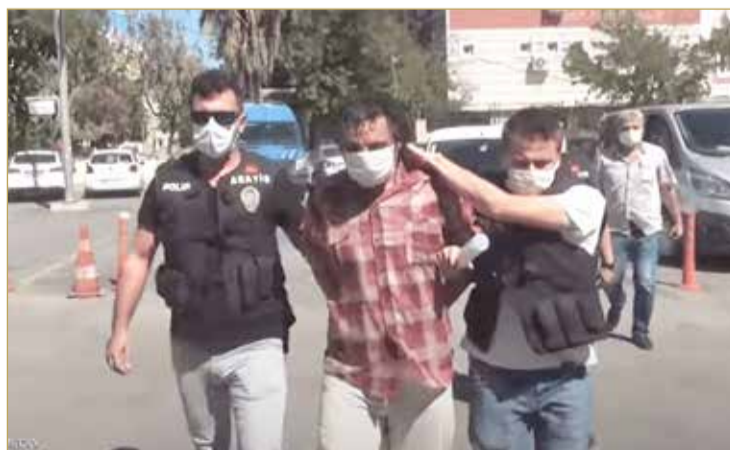
الأب حرق ابنه الطفلة لرفضها الزواج من صديقه

رفض الفتاة الزواج من صديقه، مقابل زواجه هو من ابنة الأخير. وتطرح هذه الحادثة المفجعة مرة أخرى قضية العنف الأسري ضد النساء والفتيات، خصوصاً في المناطق الريفية والنائية في تركيا وغيرها العديد من دول المنطقة وحول العالم.