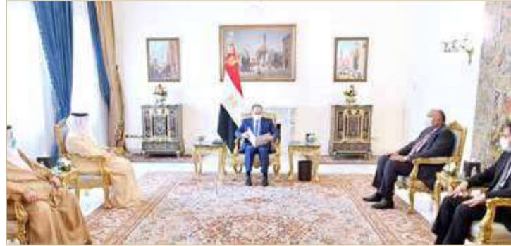
صورة من الاجتماع

خلال مشاركته في مؤتمر بغداد ولقائه رئيس وزراء الكويت الشيخ صباح الخالد الحمد الصباح على خصوصية العلاقات الوثيقة التي تربط البلدين الشقيقين وما يجمعهما من مصير ومستقبل واحد، وحرص مصر على تطوير التعاون الوثيق والتميز بين البلدين على شتى الأصعدة؛ سعياً نحو ترسيخ الأمن