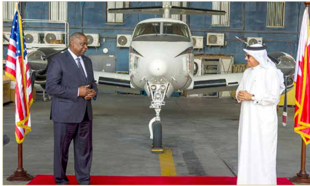
وزير الخارجية يعقد مؤتمراً صحافياً مشتركاً مع وزير الدفاع الأميركي

أعرب وزير الدفاع الأميركي لويد أوستن عن شكره لعاهل البلاد صاحب الجلالة الملك حمد بن عيسى آل خليفة ولولي العهد رئيس مجلس الوزراء صاحب السمو الملكي الأمير سلمان بن حمد آل خليفة، على دعم مملكة البحرين الاستثنائي في تسهيل العبور الآمن للأشخاص الذين تم إجلاؤهم من أفغانستان. وعقد وزير الخارجية عبداللطيف الزياني مؤتمراً صحافياً مشتركاً مع وزير الدفاع الأميركي، على هامش زيارة وزير الدفاع الأميركي الرسمية لمملكة البحرين. وقال وزير الخارجية إن "الجانبين ناقشا التطورات في أفغانستان، وأشاروا إلى التأثير المحتمل لهذا البلد على الأمن الإقليمي الأوسع، وأكدوا أنه لا ينبغي أن يصبح مصدراً لعدم الاستقرار. وأضاف الزياني: "أعرب الوزير أوستن خلالها أيضاً