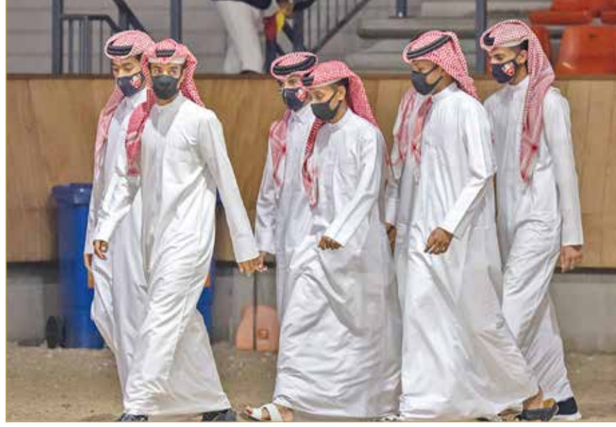
الفريق الملكي يخطف الأنواء في الافتتاح