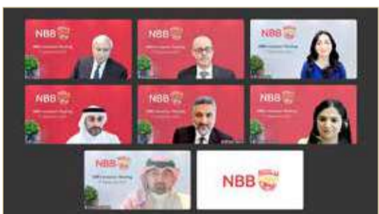
المشاركون في الاجتماع

الاجتماع حضور: الرئيس التنفيذي، رئيس تنفيذي للمجموعة - الشؤون المالية، رئيس تنفيذي للمجموعة - الموارد البشرية والاستدامة، رئيس تنفيذي للمجموعة - الاستراتيجية، رئيس تنفيذي للمجموعة - إدارة المخاطر، والمراقب المالي للمجموعة. ويأتي اجتماع المستثمرين ضمن إطار جهود البنك لتعزيز الشفافية عبر جميع القنوات، إذ تم حديثاً إصدار مقطع فيديو مفصل لإنجازات البنك.