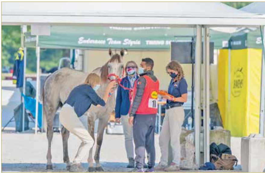
جانب من الفحص البيطري

واجتاز الفريق الملكي الفحص البيطري الذي جرى أمس في قرية البطولة، حيث اجتازت الجياد الفحوصات الطبية وتم ترقيمها وتوزيع الأرقام على الفرسان.