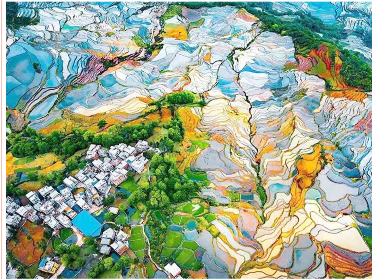
صورة بعنوان "مدرجات ديويوشو" في الصين للمصور ران تيان الحائز على تقدير عال في فئة "التصوير التجريدي" من مسابقة التصوير بواسطة الدرون للعام 2021.

إدارة التحرير: +973 17111444 / +973 17111467 / 385 @albiladpress.com / 2008 تصدر عن دار البلاد للصحافة والنشر والتوزيع • س ت 67133 • تطبع في مؤسسة الأيام للنشر قسم الإعلانات: +973 17111501 / 508 / +973 32224492 / 39615645 / +973 17111432 / +973 17580939 / +973 17111434