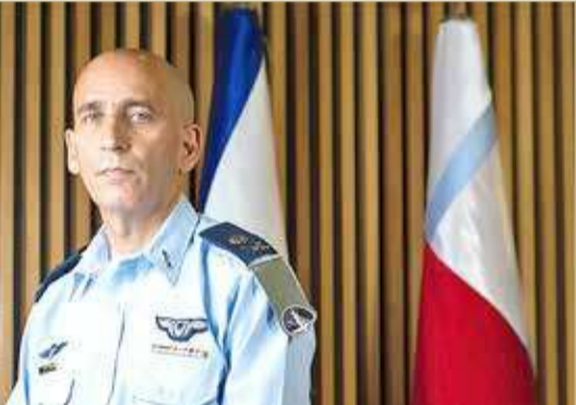
قائد جبهة إيران في الجيش الإسرائيلي "تال كالمان"

تفاصيل مدى اقتربنا من مثل هذا القرار، فإننا نقوم بتقييم الوضع في الساعات الأخرى أيضاً؛ لأن الفرضية السائدة في إسرائيل أنه إذا خاضت حرباً مع لبنان، فلن يكون القتال فقط من هناك، وقد يكون من سوريا أيضاً، وربما من إيران وغزة". وعن إيران قال كالمان إن "عرض خارطة الشرق الأوسط تظهر أن كل ما يحدث فيه تقريباً مرتبط بإيران؛ لأنها لم تعد وحدها، فهناك أيضاً سوريا والعراق واليمن ولبنان، وكذلك غزة".