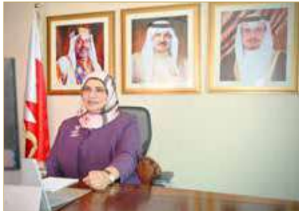
الرئيس التنفيذي لهيئة جودة التعليم والتدريب

المضحكي: البحرين تميزت باستمرار الدراسة حينما توقفت عالمياً