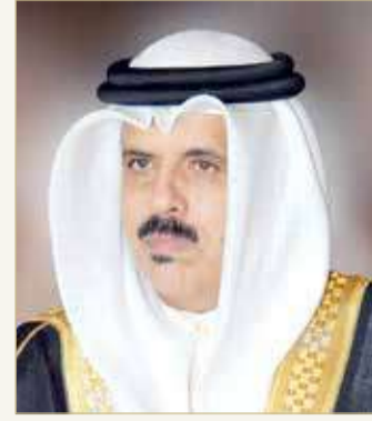
وزير التربية والتعليم

بمناسبة الاحتفال باليوم العالمي لمحو الأمية، الذي يصادف 8 سبتمبر من كل عام، أكد وزير التربية والتعليم ماجد النعيمة "إننا ونحن نشارك العالم هذا الاحتفال السنوي، نستذكر ما تحقق من إنجازات كبيرة على هذا الصعيد؛ بفضل الدعم الذي تلقاه الوزارة من عاهل البلاد صاحب الجلالة الملك حمد بن عيسى آل خليفة ومساندة ولي العهد رئيس مجلس الوزراء صاحب السمو الملكي الأمير سلمان بن حمد آل خليفة حفظه الله ورعاه، إذ أثمرت جهود مملكة البحرين ممثلة في وزارة التربية والتعليم