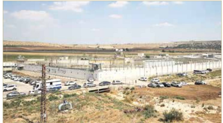
سجن "جلبوع" الإسرائيلي

وقالت هيئة الأسرى: "إن وحدات القمع تقوم حالياً باقتحام عدة أقسام بسجن النقب وسط حالة من التوتر الشديد وأنباع عن اشتعال حريق يقسم رقم 6 بالسجن، ويقع فيه أسرى من الجهاد الإسلامي وفتح". وتحدث مصادر عن إشعال النار في أربع غرف داخل القسم 6. وذكرت أن مواجهات أيضاً تدور في