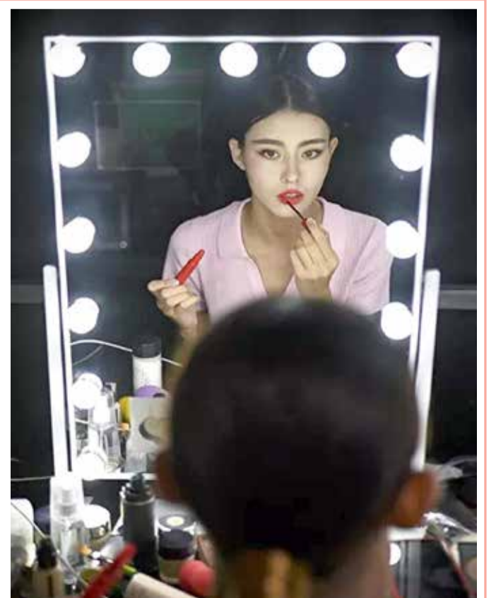
من عرض أسبوع الموضة في العاصمة الصينية، بكين

ورغم قيام الأب بتشغيل موسيقى وأناشيد دينية صاخبة، بحسب روايات سكان الحي، أثناء ارتكابه الجريمة كي لا يفتضح أمره، فإن ساكني البيوت المجاورة سرعان ما سمعوا صراخ الفتاة، فقاموا بمداومة المنزل وإسفافها بعد خلع باب المنزل.