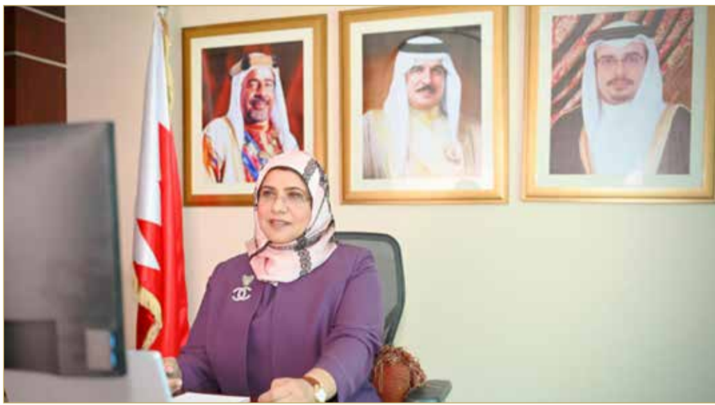
الرئيس التنفيذي لهيئة جودة التعليم والتدريب

وعن الخطط المستقبلية علقت بالقول “نهتم بالاستفادة من مخرجات التقييم في تحديث المقاييس، وتطوير ما يلزم، مع إعطاء أولوية للجوانب التي يجب التركيز عليها في تطوير النظام التعليمي، والتدريبي بشكل عام، وكذلك مراجعة الأطر الاستثنائية لتناسب مع تطورات الأوضاع الجديدة، مع الاستمرار في تقييم المؤسسات وفق الإطار الاستثنائي حال استمرار الجائحة، أو وفق الإطار الاعتيادي حال العودة إلى الوضع الطبيعي”.