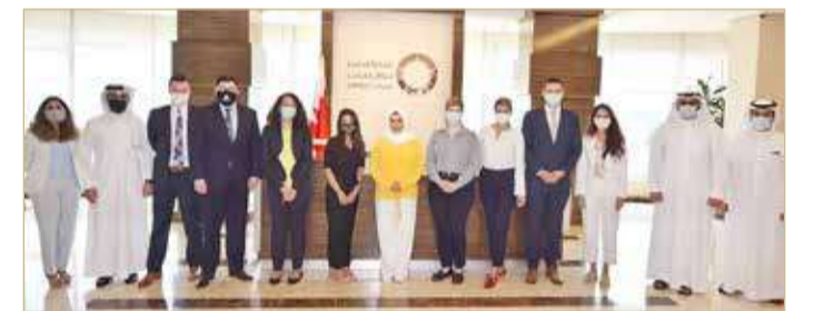
أمانة التظلمات تستقبل وفداً من موظفي البرلمان الأمريكي

♦ في ظل عودة جميع الموظفين الحكوميين بنسبة 100%