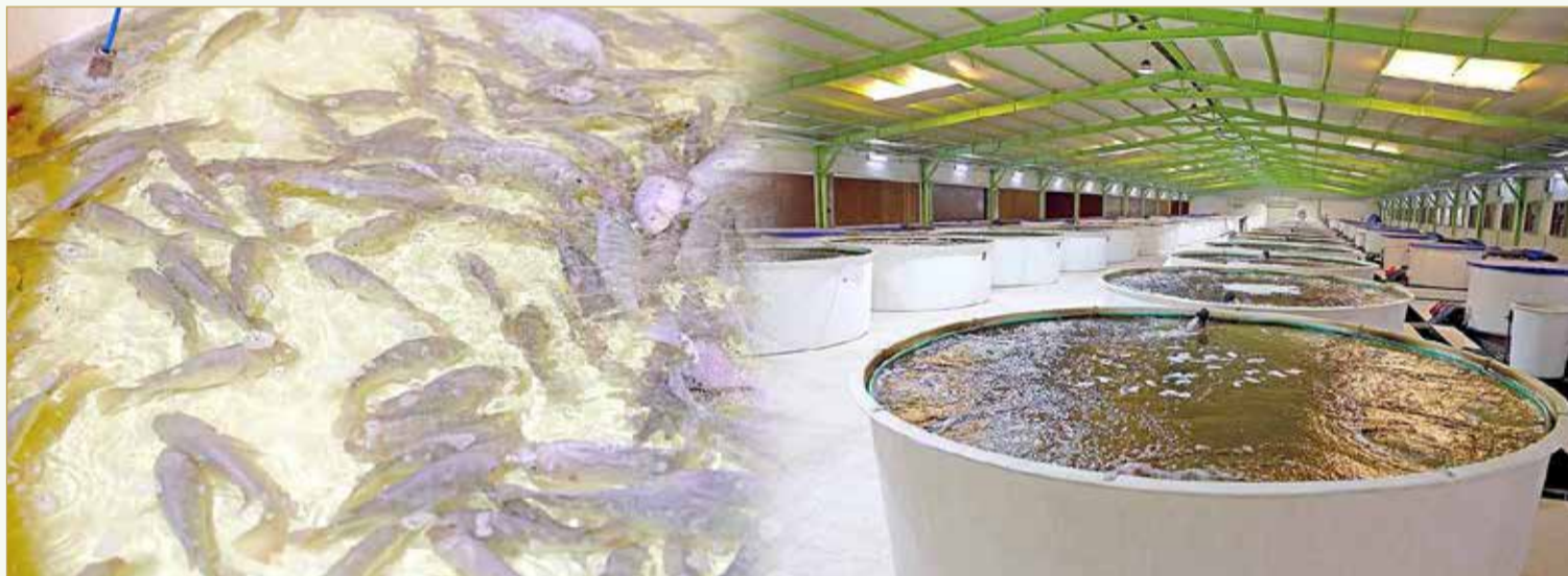
إنتاج سمك البلطي بالأحواض