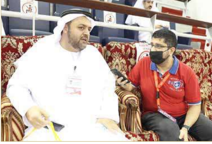
السلامان متحدًا لـ "البلاد سبورت"

« هل ترى واقع الكرة الطائرة الإماراتية حالياً؟