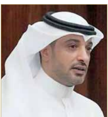
النائب غازي آل رحمة