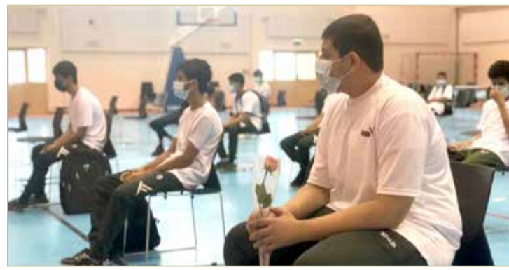
حضور مع تطبيق الاحترازية

وأضاف الشامخ أن اليوم الدراسي الأول قد حمل في طياته علامات الاحتياق والفرح والبهجة في نفوس الجميع، ولأهمية يوم التهيئة قمنا بإعداد خطة لاستقبال الطلبة تحت عنوان "بيتك الثاني".