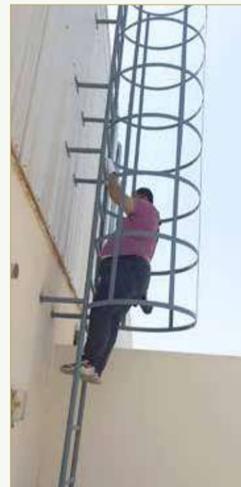
المصور الحجري صاعداً للألواح