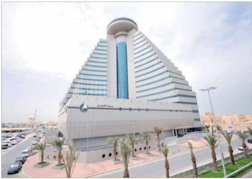
مبنى غرفة صناعة وتجارة البحرين الذي تتخذة (تمكين) مقراً لها

تمكين لـ "البلاد": دعم 315.4 ألف مؤسسة وفرد بأكثر من 2.65 مليار دولار