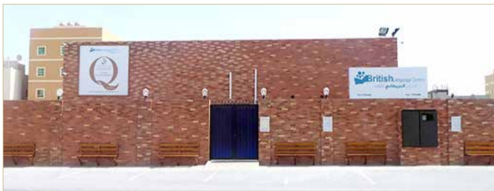
مبنى المركز البريطاني للغات

♦ سجلت ابنتي للدورة بالحضور الشخصي ولكنه عقدها عن بعد