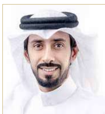
النائب عمار سامي قمبر