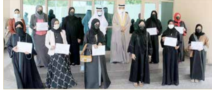
التعيمي مع مديري المدارس الحاصلة على لقب (حاضنة للتكنولوجيا)

استدامة التعلم عن بعد خلال فترة الجائحة عبر القنوات التي وفرتها الوزارة، ومن أبرزها البوابة التعليمية التي بلغ عدد الزيارات لها خلال العام الدراسي الماضي أكثر من (68 مليون) زيارة من داخل المملكة وخارجها، مضيفاً بأن الوزارة قامت، ومنذ انطلاق برنامج التمكين الرقمي في التعليم، بتوفير حسابات مايكروسوفت 365 لجميع منتسبي الوزارة، ومنهم المعلمون والطلبة، حيث تشمل هذه الحسابات العديد من الخدمات والتطبيقات التعليمية والإدارية، والتي ساهمت في تطوير العملية التعليمية من خلال تفعيل الفصول الافتراضية عبر برنامج Microsoft Teams.