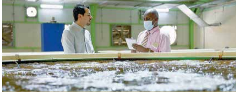
الاطلاع على أحواض الاستزراع السمكي

يهدف للمساهمة بالأمن الغذائي.. 50 حوضاً لإنتاج البلطي.. وربح الكادر من البحرينيين