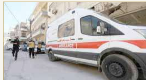
الضحية كانت مصابة بجرح في رقبتهما باله حادة