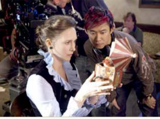
الاهتمام بجميع التفاصيل