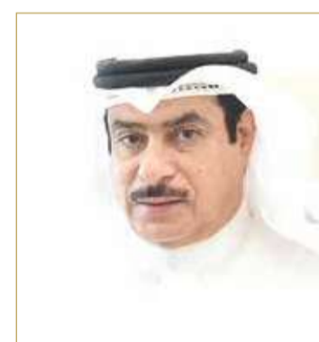
النائب عيسى الدوسري