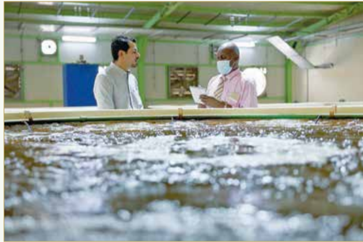
الاطلاع على أحواض الاستزراع السمكي

يساهم بالأمن الغذائي.. وأكثر من 100 حوض لإنتاج البلطي.. وربع الكادر بحرينيون