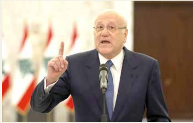
رئيس الحكومة اللبنانية نجيب ميقاتي

أبصرت الحكومة اللبنانية الجديدة النور، أمس الجمعة، بعد أكثر من عام من الفراغ. ووقع الرئيس ميشال عون ورئيس الحكومة المكلف نجيب ميقاتي مرسوم تشكيل الحكومة الجديدة، في حضور رئيس مجلس النواب نبيه بري. وقالت الرئاسة اللبنانية في بيان إن رئيس الوزراء المكلف ميقاتي ورئيس البلاد عون وقعا مرسوما بتشكيل حكومة جديدة بحضور رئيس مجلس النواب.