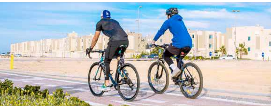
تتضمن مدينة سلمان مسارات للدراجات الهوائية

استكمال بناء 303 بيوت جديدة.. والانتهاء منها في العام المقبل