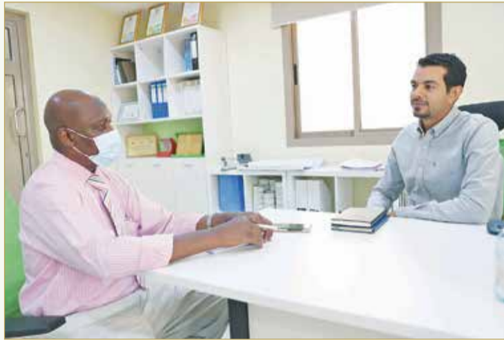
مدير العمليات متحدًا لـ "البلاد"