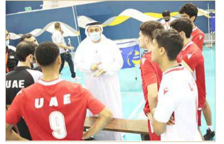
السلامان مع منتخب الإمارات للناشئين