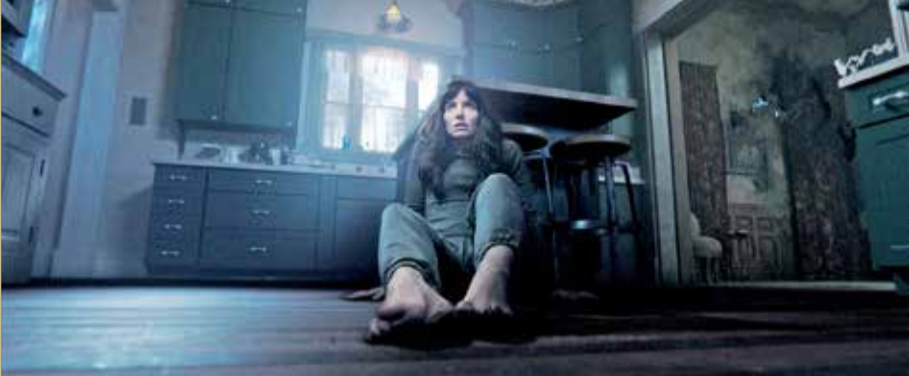
اختيار مهم لعشاق الغرائب والاثارة

القصة كل من وان وإنفريد بيسو وكوبر. وجرى إنتاج الفيلم بواسطة وان ومايكل كلير، مع إنتاج تنفيذي من إريك ماكلود، جادسون سكوت، بيسو، بيتر لو، تشنغ يانغ، ماندي يو ولي هان، وانضم إلى وان عدد من أبرز الأشخاص الذين يتعامل معهم بشكل متكرر، مثل مدير التصوير دون بورغس والمحرم كيرك موري الذي قدم معه أفلام ناجحة مثل Aquaman و The Conjuring 2، ومصممة الإنتاج ديسما مورفي التي أيضا عملت معه في أفلام كبيرة مثل Aquaman و Furious 7، إضافة إلى مصممة الأزياء ليزا نورسيا. وقام بتأليف موسيقى الفيلم جوزيف بشارة الذي ابتكر موسيقى الأفلام السبعة ضمن عالم The Conjuring من بين العديد من الأفلام الأخرى.