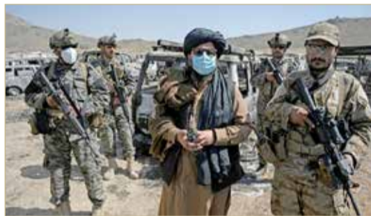
من عناصر طالبان

في بنجشير من الاستيلاء على مستودع كبير مكتظ بالأسلحة والمعدات العسكرية، بما في ذلك السوفيتية الصنع. ووفقاً له، يوجد في المستودع الكثير من الأسلحة والمعدات، لدرجة أن نقلها إلى كابل قد يستغرق عدة أيام. وتمكنت طالبان في الأسبوع الماضي من السيطرة على المناطق الرئيسية في بنجشير، التي كانت آخر ولاية أفغانية لم تسقط حتى ذلك الحين في قبضة الحركة.