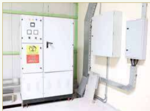
المحولات (inverters) من أساسيات هذه الصناعة