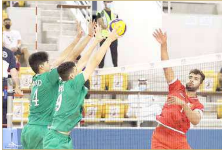
خليجي 6 شهدت عودة البطولات الخليجية للطائرة

إننا نمر بمرحلة انتقالية في الاتحاد الإماراتي لكرة الطائرة وننتظر إقامة الانتخابات للدورة الجديدة المقبلة، والأهم بالنسبة إلينا حالياً العودة للمشاركات الخارجية، سواء على المستوى الخليجي أو العربي أو الخارجي عموماً، وذلك على مستوى الأندية والمنتخبات. وفي الفترة المقبلة