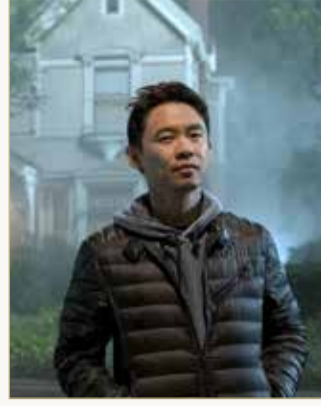
المخرج الكبير "جيمس وان"