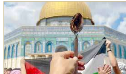
مسيرة تضامنية مع الأسرى الفارين في باحات الأقصى

الزاوية في الخليل، بيتا وبيت دجن جنوب نابلس وبيت أمر شمال الخليل. إلى ذلك، عثرت الشرطة الإسرائيلية على حقيبتين بمنطقة العفولة خلال قيام خبراء الأثر بنمطيش المنطقة بحثاً عن الأسرى الفلسطينيين الفارين من سجن جلبوع. ورجحت صحيفة "معاريف" العبرية، أمس، أن الأسرى الفلسطينيين الستة ربما توجهوا ناحية الحدود الشمالية مع لبنان، بعد العثور على "حاجيات" تخصهم في منطقة العفولة شمالي البلاد.