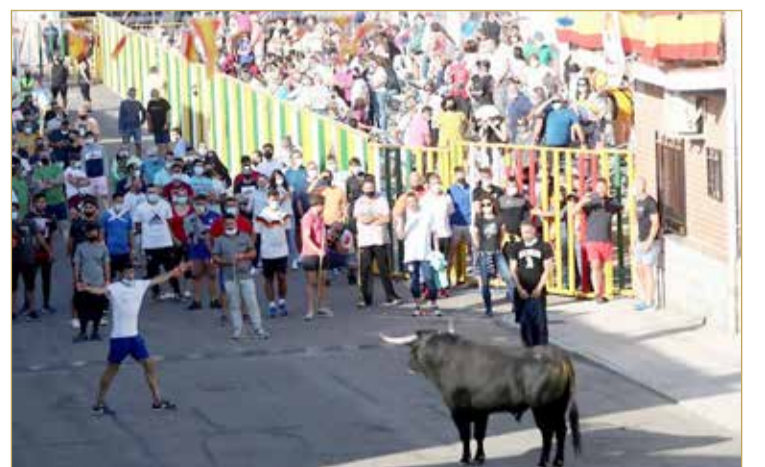
47 في المئة من الإسبان يؤيدون منع مصارعة الثيران

اندفعت عشرة ثيران هائجة عبر شوارع قرية فيلاسكا دو لا ساجرا مطاردة مئات العدائين في أول مهرجان لركن الثيران يقام في إسبانيا منذ اندلاع جائحة كوفيد - 19. ولم يصب أحد بأذى خلال جولة الركن الأولى في القرية التي يبلغ عدد سكانها 1700 نسمة وتقع على بعد 65 كيلومترا جنوبي مدريد. وقال مجلس القرية إنه من أجل الالتزام بالقيود الصحية تم السماح لـ 900 عداء بالركن أمام الثيران كل يوم خلال المهرجان الذي يجري بين يومي 5 و12 سبتمبر الجاري، فيما تم قصر عدد المتفرجين على 1300 فرد في كل مرة.