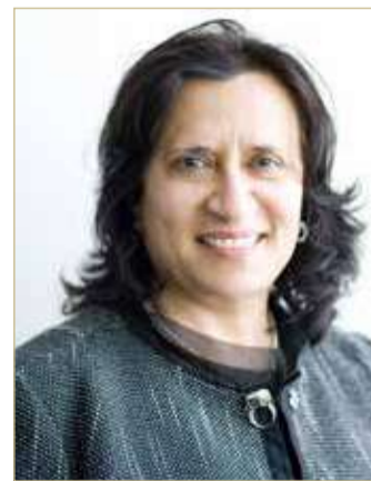
الشيخة هيا بنت راشد

حققت غرفة البحرين لتسوية المنازعات للسنة المنتهية في 31 ديسمبر 2020 إجمالي إيرادات بلغ نحو 2.1 مليون دينار (مليونين و144 ألفاً و953 ديناراً) بزيادة قدرها 908 آلاف و66 ديناراً، أي ما نسبته 73.5 % قياساً بتحقيق نحو 1.2 مليون دينار (مليون و236 ألفاً و179 ديناراً) للفترة المماثلة من العام 2019.