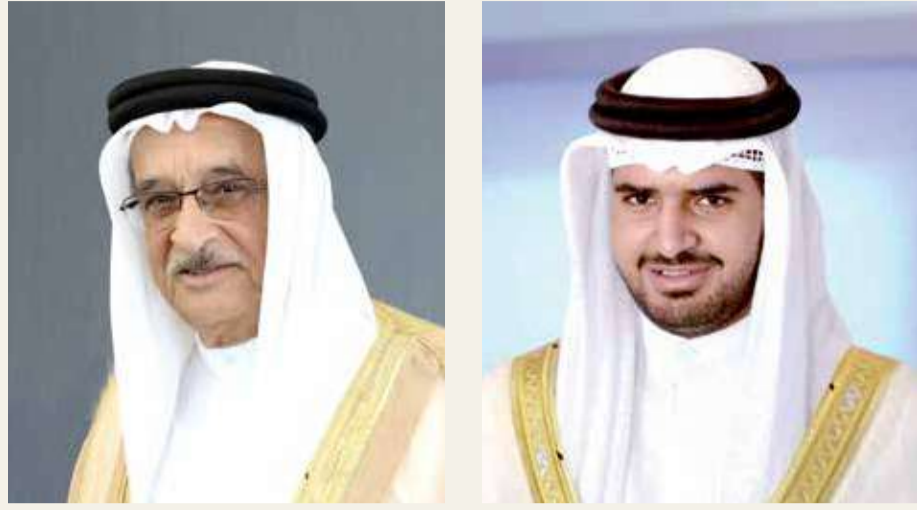
الشيخ محمد بن عبدالله