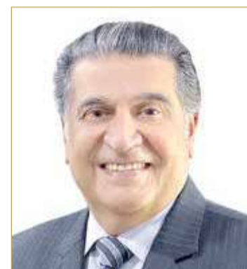
يوسف صلاح الدين

سوق القيصرية في مدينة المحرق العريقة بمملكة البحرين تعد تحفة تراثية تحكي عن ماضٍ تليد يمتد لعشرات السنين. وافتتح مشروع سوق القيصرية الواقع ضمن مشروع موقع ”مسار اللؤلؤ: شاهد على اقتصاد جزيرة“ في شهر مايو الماضي بحضور مدير عام الثقافة والفنون بهيئة البحرين للثقافة والآثار الشيخة هلا بنت محمد آل خليفة. عدسة صحيفة ”البلاد“ جالت في السوق التي حافظت على أنشطة البيع التقليدي ولكن بمظهر عصري حديث يوصف بأنه ”مودرن“.