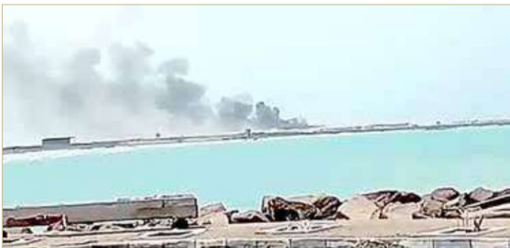
الاعتداء على ميناء المخا

الاستقرار الإقليمي والسلام الدولي. على صعيد متصل، استهدفت ميليشيا الحوثي الانقلابية، أمس، بقصف باليستري وبالطيران المسير، ميناء المخا، غرب اليمن، بعد أسابيع فقط من بدء تشغيل الميناء المتوقع منذ أكثر من 6 سنوات. وقال مدير ميناء المخا