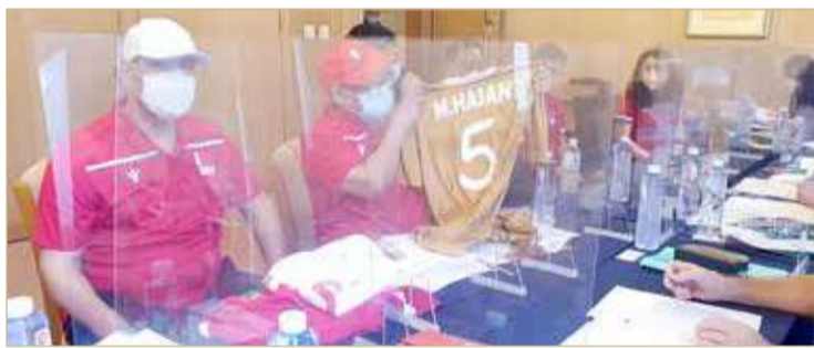
الوفد الإداري في اجتماع الاستعلام المبدي

بينما فاز بلقب البطولة منتخب اليابان. أما المشاركة الأولى لمنتخب الرجال، فقد كانت في النسخة الثانية من البطولة العام 1979 والتي استضافتها مملكة البحرين لأول مرة في تاريخها وحقق فيها المنتخب المركز الرابع عشر تحت قيادة المدرب الياباني "ميكوزوا"، وأقيمت البطولة على صالة مركز الشباب بالجفير. ووفقا لموقع الاتحاد الآسيوي الرسمي، فإن منتخبنا شارك كذلك في النسخة الرابعة التي أقيمت في الكويت العام 1987 وحقق خلالها المركز الثامن، وهو أفضل مركز له في تاريخ مشاركاته القارية، كما شارك في النسخة الخامسة التي أقيمت في كوريا 1989، وحقق