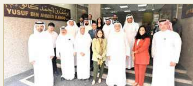
جانب من آخر اجتماع لمجلس الإدارة بالمبنى

ونفخر بتاريخنا التجاري الطويل في سوق المنامة. وسيساهم مشروع المتحف كانو في استمرار دورنا المتميز وتواجدا الحوي في هذه السوق. ويعتبر إنشاء هذا المتحف وسيلة مثالية لتوثيق تاريخ مجموعة يوسف بن أحمد كانو، بالإضافة إلى استعراض القيم العائلية التي