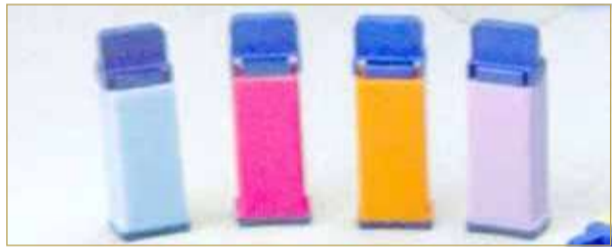
إبر فحص السكري المقصودة