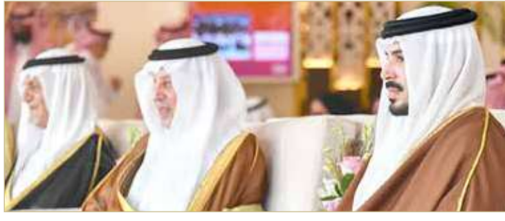
سمو الشيخ محمد بن سلمان يشهد مهرجان ولي العهد للهجن بالطائف

المهرجان الذي أكسب هذا السباق النجاح الذي وصل إليه، متمنيا للمملكة العربية السعودية الشقيقة دوام التوفيق في استضافة السباقات المختلفة وللقائمين على مهرجان ولي العهد للهجن دوام النجاح في النسخ المقبلة.