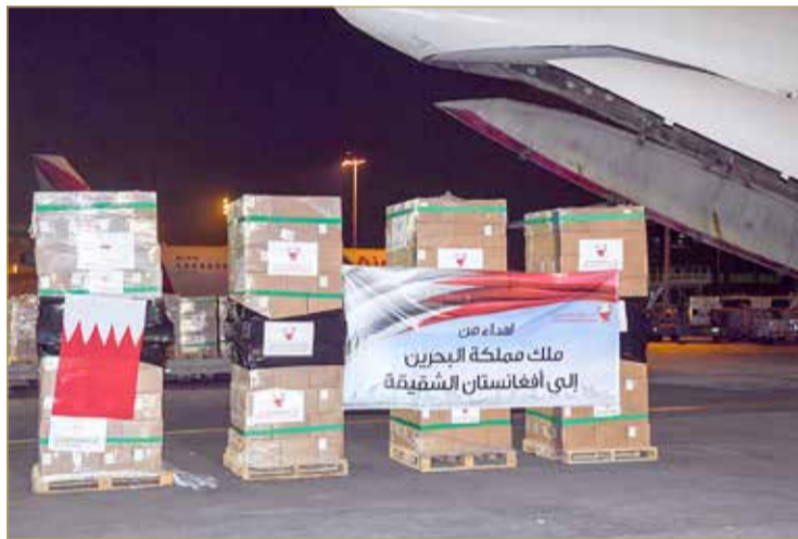
وصول شحنة المساعدات الإغاثية الثالثة إلى أفغانستان