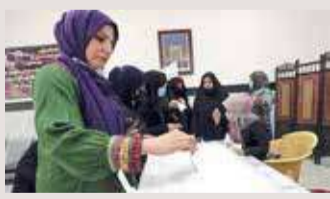
بغداد - المحدثت

نقلت وكالة الأنباء العراقية "واع"، أمس السبت، عن الرئيس برهم صالح قوله إنه يريد أن تكون الانتخابات المقرر إجراؤها في البلاد الشهر المقبل قادرة على تحقيق الإصلاح، الكاطمي لمشاركة فعالة من المرأة في الانتخابات البرلمانية المقبلة. وترأس الكاطمي جلسة استثنائية لمجلس الوزراء خصصت لدعم الانتخابات بحضور المحافظين ورؤساء الهيئات والأجهزة الأمنية ومفوضية الانتخابات. وقال إنه تم إنجاز كل متطلبات العملية الانتخابية لاسيما مسألة تأمينها والحفاظ على نزاهتها بمراقبة أمنية دولية. ونقل المكتب الإعلامي للكاتمي قوله إن هناك إجراءات أمنية مشددة تم وضعها لمنع أي حالات اختراق أو محاولات تزوير".