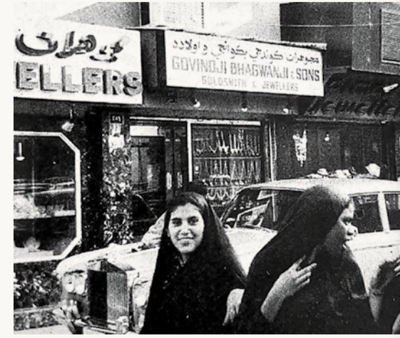
محلات المجوهرات في خمسينيات القرن العشرين