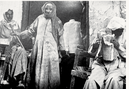
مقهى شعبي يعود إلى الأربعينات