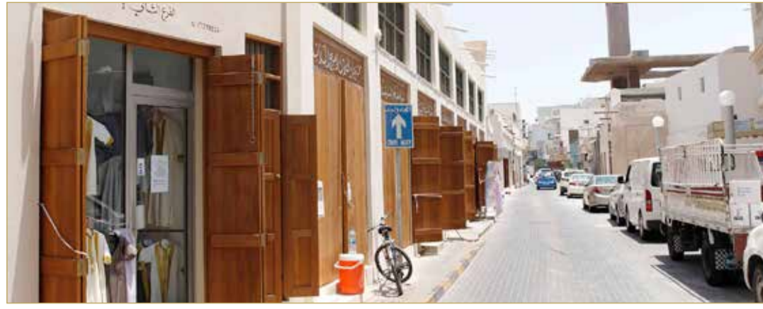
سوق القيصرية في مدينة المحرق... تحفة تراثية