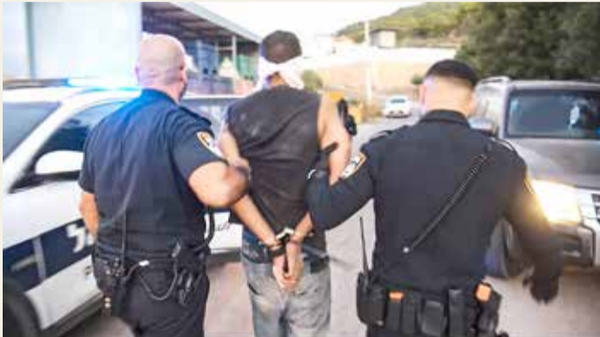
عملية القبض على أحد الأسرى الفارين

الشرطة. وأشاد وزير الأمن الداخلي الإسرائيلي عمر بارليف أمس بالقوى الأمنية، مؤكداً عبر تويتر أن مهمتها "لم تنته". من جانب آخر، أعلنت حركة الجهاد الإسلامي التي ينتمي إليها 5 من الفارين في بيان، أن إلقاء القبض عليهم "لن يمحو" عملية الفرار "البطولية"، محملة إسرائيل "كامل المسؤولية" عن سلامتهم ومؤكدة أن "محاولة الانتقام ستكون بمثابة إعلان حرب". كما ثقت حركة حماس ما قام به "أبطال (...) نفق الحرية". وقالت حركة فتح بزعامه الرئيس محمود عباس إن "إعادة اعتقال الأسير البطل (...) زكريا الزبيدي، ورفاقه الأسرى الأبطال لن يضعف