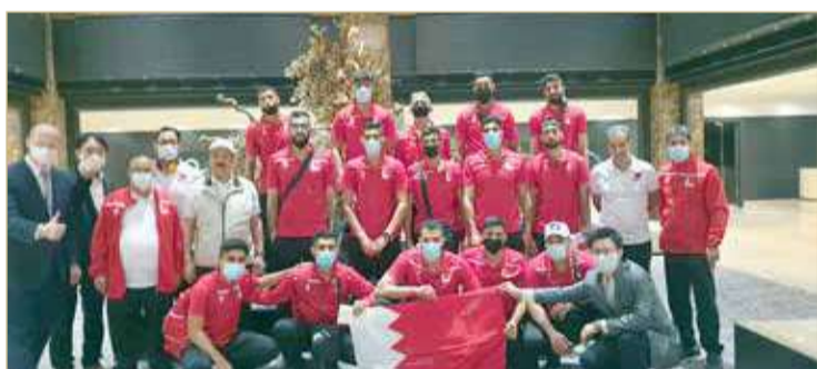
منتخب الطائرة أثناء وصوله طوكيو

العام 1999، وحقق المركز ذاته. كما شارك منتخبنا في النسخة الثانية عشرة بالصين 2004، وحقق خلالها المركز العاشر. وشارك في النسخة العاشرة في طهران