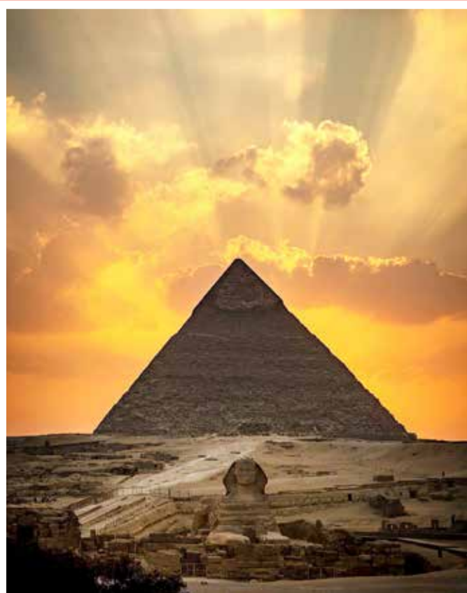
الغروب من أهرامات مصر

أصدرت وارنر براذرز للإنتاج عبر حساباتها على مواقع التواصل الاجتماعي التريلر الأول لفيلم The Matrix 4 الجديد، بعنوان The Matrix Resurrections، الذي يجمع النجم كيانو ريفز، والنجمة كاري آن موس، ليعودا من جديد بعد آخر إصدار للفيلم العام 2003، وتصدر اسم الفيلم مؤشرات البحث فور عرض إعلانه الترويجي، حيث يبدأ المقطع الدعائي بطلب كيانو ريفز للحصول على إرشادات من طبيب نفسي، والذي يجسد دوره نيل باتريك هاريس، وتكشف الملامح الأولى لشخصية كيانو ريفز إن لديه أحلاماً، يبدو أنها تتعلق بماضيه في حالة الحرب مع الذكاء الاصطناعي. يضم الفيلم نخبة كبيرة من النجوم، من بينهم، جادا بيننكيت سميث، ويحيى عبدالمتين.