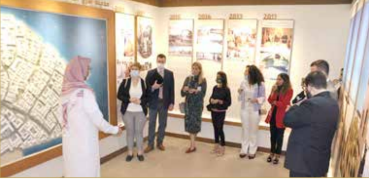
وفد من موظفي مجلسي النواب والشيوخ الأميركيين يزور مشروع مدينة شرق الحد الإسكاني

كما أشاد الوفد الزائر بما شاهدته من مشروعات إسكانية مدعومة تقدم للمواطنين ضمن فئات مختلفة، وما تقوم به الوزارة من جهد وعمل مستمر