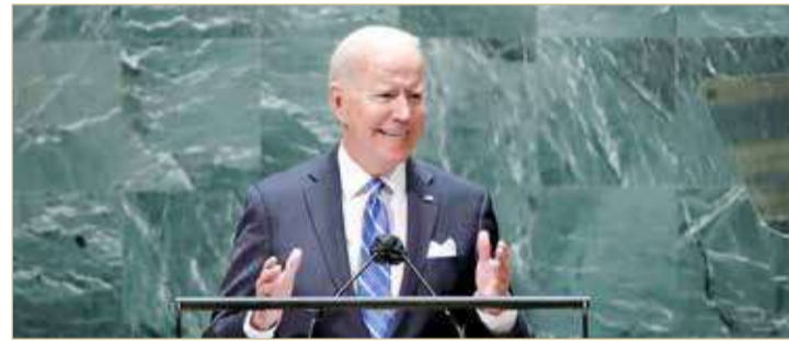
الرئيس الأمريكي جو بايدن (روبرتز)

الولايات المتحدة لن تلجأ إلى القوة العسكرية إلا كخيار أخير