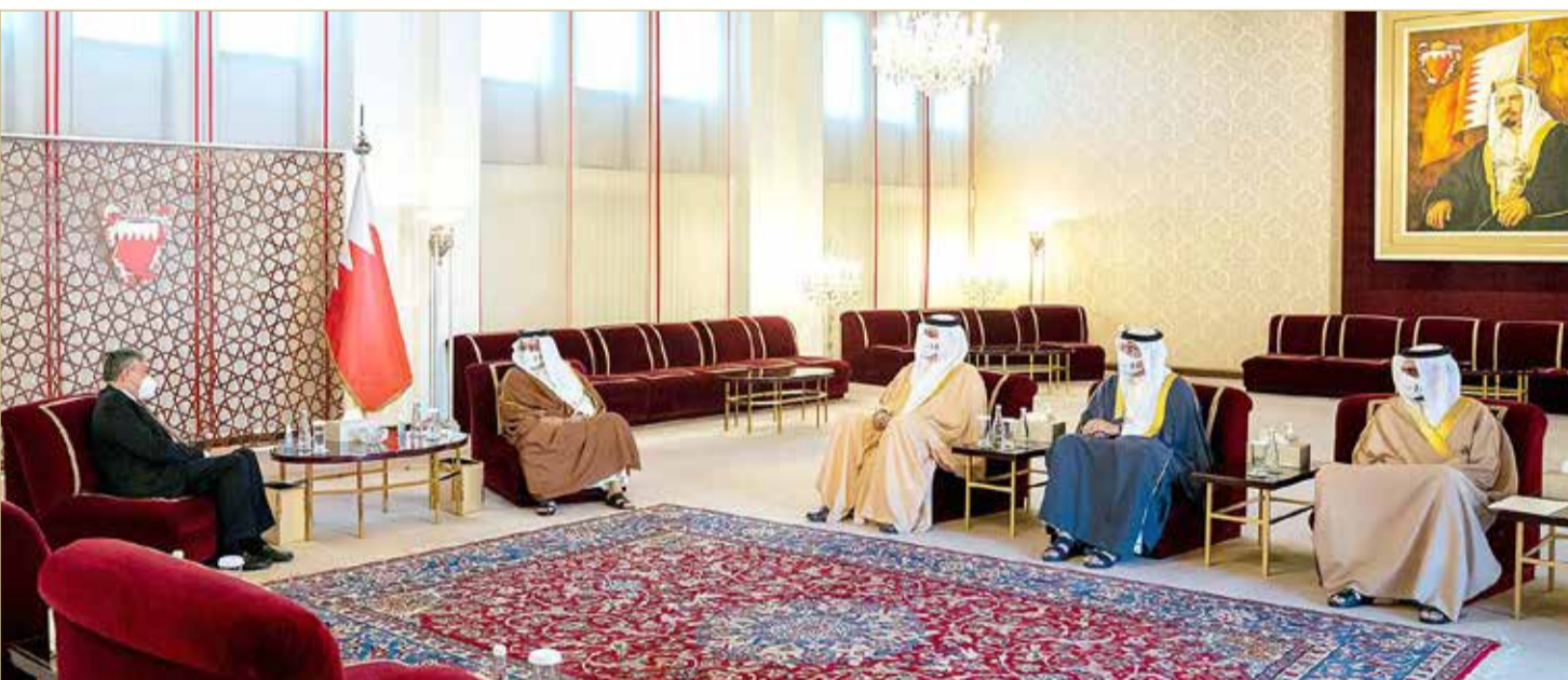
سمو ولي العهد رئيس الوزراء لدى لقائه السفير الفلبيني

◆ فتح آفاق أوسع من التعاون بين البلدين في مختلف المجالات