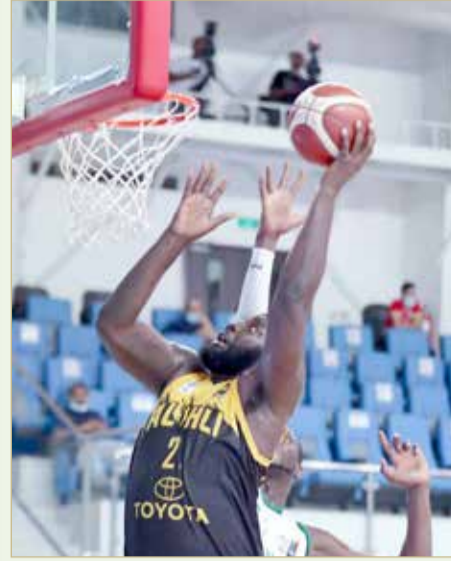
لقاء الأهلي والبحرين

أصبح رصيد "الاهلي" (3 نقاط) فيما أصبح رصيد سترة بخسارته الثانية تقطعين. وبرز في صفوف الاتحاد محترفه هارت بتسجيله (32 نقطة) منها 4 ثلاثيات، حسن البوسطة (23 نقطة)، وفي سترة حسين صفر أفضل المسجلين (28 نقطة)، محترفه ريد (21 نقطة).