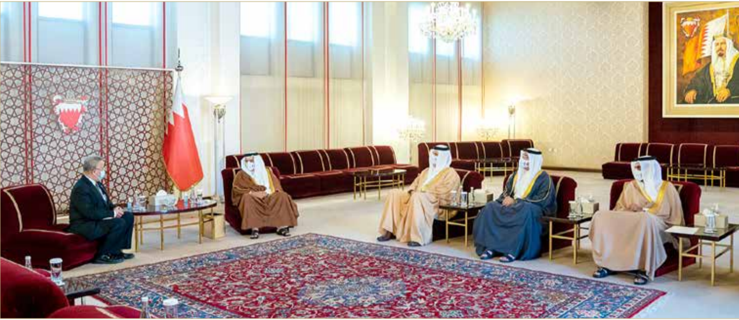
سمو ولي العهد رئيس الوزراء لدى لقائه السفير التايلندي

◆ جهود ملحوظة للسفير التايلندي في دعم أسس التعاون المشترك