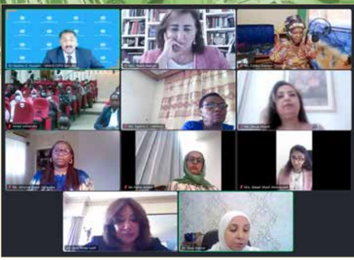
جانب من المشاركة في الفعالية

الأمم المتحدة - مكتب اليونيدو نظمت جامعة الأحفاد للبنات في السودان، في إطار أولى فعاليات تدشين مركز تمكين المرأة في جامعة الأحفاد للبنات الذي أنشئ بدعم ومساندة المركز العربي الدولي لريادة الأعمال والاستثمار التابع لمنظمة الأمم المتحدة للتنمية الصناعية في مملكة البحرين، "يوم رائدات الأعمال العرب والأفارقة" تحت شعار "تمكين رائدات الأعمال بين التطلعات والقيادة"، وذلك بالشراكة مع مكتب ترويج الاستثمار والتكنولوجيا والمركز العربي الدولي لريادة الأعمال والاستثمار التابعين لليونيدو في البحرين، بالتعاون مع اتحاد الغرف العربية والمصرف العربي للتنمية الاقتصادية في إفريقيا ومكتب اليونيدو في السودان. ومن أهداف هذه الفعالية بحث دور المرأة في إطار تحقيق أهداف التنمية المستدامة لتعزيز المساواة