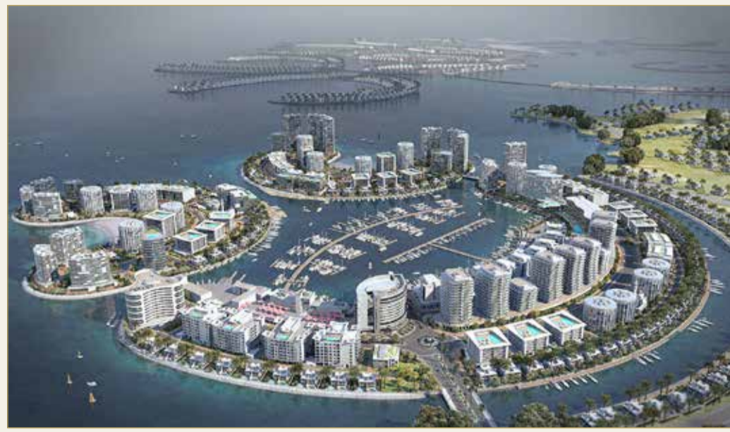
المنامة - شركة درة مارينا

لتقديم خدمات تأسيس اتحادات الملاك في المشروع