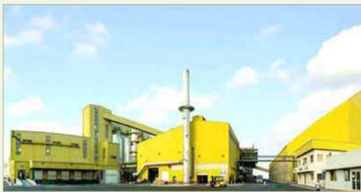
مصنع الشركة العربية للسكر في منطقة الحد

المزاد يبدأ بـ 18 مليوناً والقيمة السوقية تقارب 100 مليون دولار