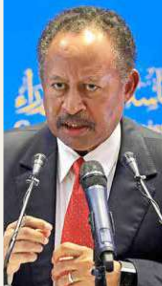
رئيس الوزراء السوداني عبدالله حمدوك

وتمكنت السلطات الانتقالية حينها من اعتقال عدد من القيادات العسكرية التي خططت لتنفيذ