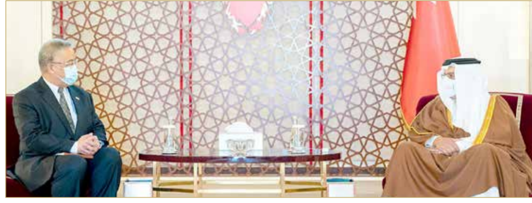
سمو ولي العهد رئيس الوزراء لدى لقائه السفير التايلندي