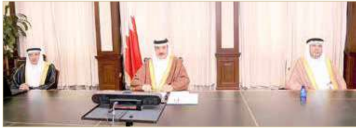
حميدان مترسفاً وفد البحرين والاجتماع الخليجي

◆ دراسة خليجية لمعالجة تحديات تغيير الوظائف بالمستقبل