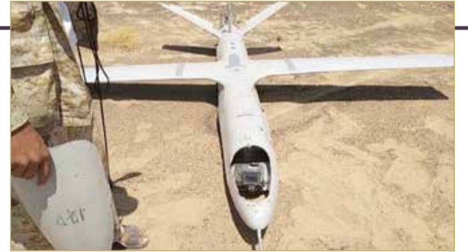
مسيرة حوثية تم إسقاطها سابقا

البلاد 08 international@albiladpress.com