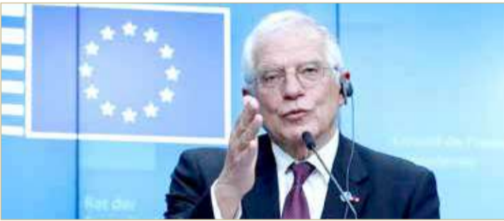
مسؤول السياسة الخارجية في الاتحاد الأوروبي جوزيب بوريل

بوريل: لا اجتماع مع إيران في الأمم المتحدة بشأن النووي