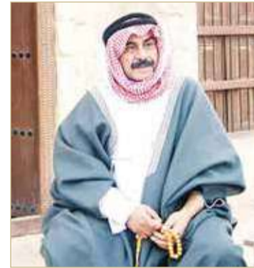
عملاق الشاشة وتعامل راق مع الجمع