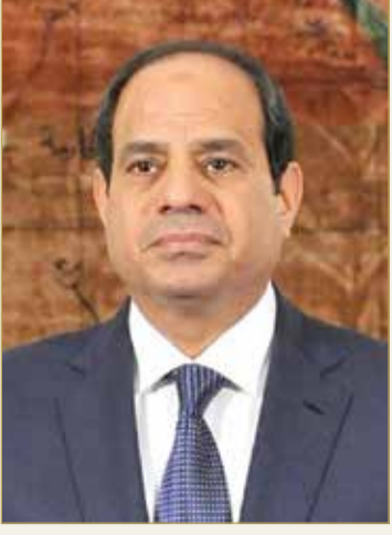
عبد الفتاح السيسي