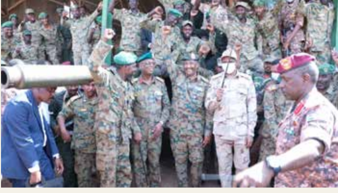
من مقر الانقلاب الفاشل.. البرهان "ستحمي وحدة السودان"

انقلاب، بل وعمدت إلى تسجيل أشرطة لإعلان البيان الأول قبل أن يتم كشف مخططاتها. وفي الأشهر الماضية اعتقلت السلطات السودانية العشرات من أنصار نظام البشير وعملت على تطهير مؤسسات الدولة من مسؤولين محسوبين على النظام السابق.