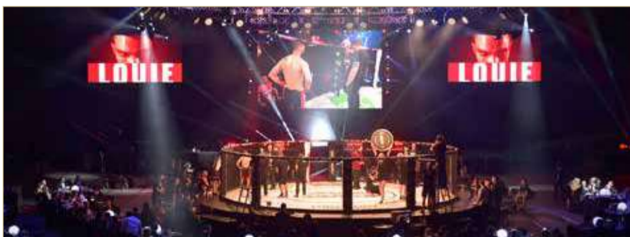
جانب من المنافسات

وأضاف شاهد "تشير النتائج والمعطيات إلى أن منظمة BRAVE CF تستعد لتأسيس حقبة جديدة في عالم رياضات فنون القتال المختلطة، إذ تعمل المنظمة على تحطيم الأرقام القياسية وصنع التاريخ نحو العصر الجديد لهذه الرياضة. إنه لشرف كبير لي بأن أكون جزءاً صغيراً من هذه الرؤية العالمية".