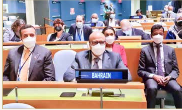
وزير الخارجية يترأس وفد البحرين المشارك في أعمال الجلسة

ترأس وزير الخارجية عبداللطيف الزباني، أمس، وفد مملكة البحرين المشارك في أعمال الجلسة الافتتاحية للمناقشة العامة للجمعية العامة للأمم المتحدة في دورتها السادسة والسبعين، التي عُقدت بمقر الأمم المتحدة في نيويورك تحت عنوان "بناء القدرة على الصمود من خلال الأمل - للتعافي من كوفيد-19، وإعادة البناء بشكل مستدام، والاستجابة لاحتياجات الكوكب، واحترام حقوق الناس، وتشجيع الأمل في المستقبل". وذلك بدعوة من الأمين العام للأمم المتحدة أنطونيو غوتيريش، وبترأسه رئيس الدورة الحالية للجمعية العامة للأمم المتحدة عبدالله شاهد.