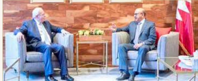
وزير الخارجية يجتمع مع وزير الخارجية والمغتربين الفلسطيني

اجتمع وزير الخارجية عبداللطيف الزباني، في مقر بعثة مملكة البحرين لدى الأمم المتحدة أمس، مع وزير الخارجية والمغتربين بدولة فلسطين الشقيقة رياض المالكي، على هامش انعقاد أعمال الدورة الـ 76 للجمعية العامة للأمم المتحدة.