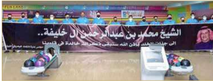
لمسة وفاء للشيخ محمد بن عبدالرحمن

عبدالرحمن آل خليفة رئيس مجلس إدارة مركز أرض المرح الرئيس السابق لاتحاد كرة السلة ونادي المحرق، رفع لاعبو ولاعبات البولينج لافتة استذكروا فيها الراحل وكتبوا فيها "الشيخ محمد بن عبدالرحمن آل خليفة... إلى جنات الخلد بإذن الله، ستبقى ذكرك خالدة في قلوبنا".