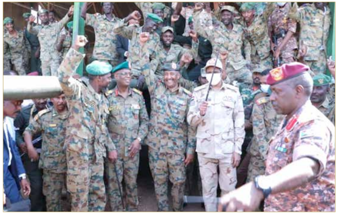
من مقر الانقلاب الفاشل... البرهان، سحيمي وحدة السودان