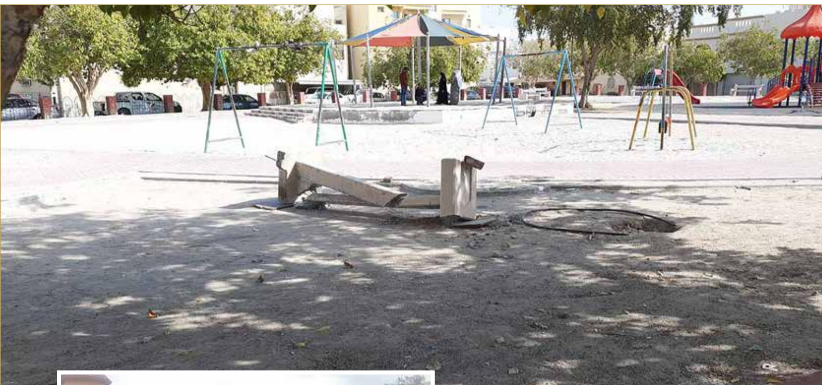
جانب من مظاهر التخريب

الشرطة تقومون بدورها على أكمل وجه في صيانة الحديقة، وإرسال الدوريات لمنع أعمال التخريب، إلا أن ذلك لم يكن كافيًا لمنع تلك المجموعة من الاستمرار والإصرار على أعمال التخريب. ورأى أن الحل يكمن في تخصيص هذه الحديقة لتكون مناسبة لذوي الاحتياجات الخاصة، والعمل على رفع سور الحديقة للحد من تعرضها لأعمال التخريب، إلى جانب تشكيل مجموعة أصدقاء الحقائق من أهالي المنطقة للحفاظ على الحديقة ومساندة الجهات المختصة في كل ما يتعلق بأعمال التجميل والنظافة والتطوير وغيرها.