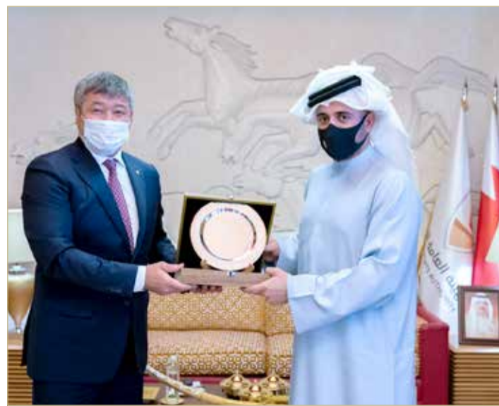
تبادل الهدايا التذكارية

تصل إلى ما وصلت إليه في رياضة فنون القتال المختلطة، مبدية في الوقت ذاته استعدادها للمساهمة في دعم جهود تطوير المصارعة البحرينية.