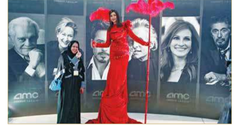
افتتاح السينمات بنامى في السعودية

في السنوات الثلاث التي تلت إعادة افتتاح دور السينما في المملكة العربية السعودية، أثبتت الأفلام العالمية، والألمني خصوصا، أنها تحظى بشعبية ونجاح كبيرين ومع