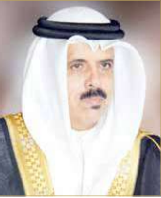
وزير التربية والتعليم