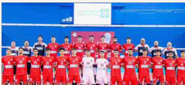
منتخب الشباب لكرة الطائرة

انطلاق بطولة العالم تحت 21 بمشاركة 16 منتخباً