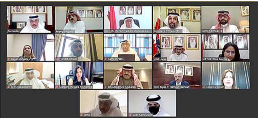
سمو الشيخ محمد بن مبارك يترأس اجتماع المجلس الأعلى لتطوير التعليم والتدريب

مع ضمان جودتها، مضيئاً أن أبرز ما تضمنته عملية تطوير آليات عمل اللجنة استحداث الإطار التنظيمي وضوابطه للاعتراف بالمؤهلات الصادرة عبر نظام التعلم الإلكتروني ووضع فعلياً حيز التنفيذ، وكذلك التنسيق مع الجهات ذات العلاقة للاعتراف بالمؤهلات الصادرة عبر نظام احتساب الخبرة التراكمية. وبشأن التحول الكبير في وتيرة إصدار إفاذات المعادلات العلمية خلال فترة وجيزة مقارنة بالوضع السابق، بين رئيس اللجنة الوطنية لتقويم المؤهلات العلمية مجموعة من الأرقام والإحصاءات التي عكست تطوراً وزيادة كبيرة في إصدار إفاذات المعادلات العلمية، وقد أشاد المجلس بما تحقق على مستوى تطوير آليات عمل اللجنة الوطنية لتقويم المؤهلات العلمية، بما يحافظ على جودة العمل ويحفظ حقوق ومصالح المواطنين والمقيمين الذين يتقدمون بطلب المعادلة مع استيفائهم جميع الاشتراطات المطلوبة. وناقش المجلس الأعلى لتطوير التعليم والتدريب في اجتماعه التقرير المرفوع من المدير العام لشؤون المدارس بشأن توصيات المؤتمر السنوي الثاني للجان الدائمة بغرفة تجارة وصناعة البحرين، إذ استعرضت التوصيات الخاصة بالتعليم والتدريب على مختلف فئاتها مع مناقشة المقترحات المتعلقة بسبل التعامل معها، وقد وافق المجلس على التوصيات والإجراءات الواردة في التقرير المرفوع، ووجه بتكليف جميع الجهات المعنية بهذه التوصيات لاتخاذ ما يلزم لوضع المقترحات حيز التنفيذ حسب أولويات العمل لدى كل جهة مع موافاة المجلس الأعلى لتطوير التعليم والتدريب بالمستجدات على هذا الصعيد بشكل دوري.