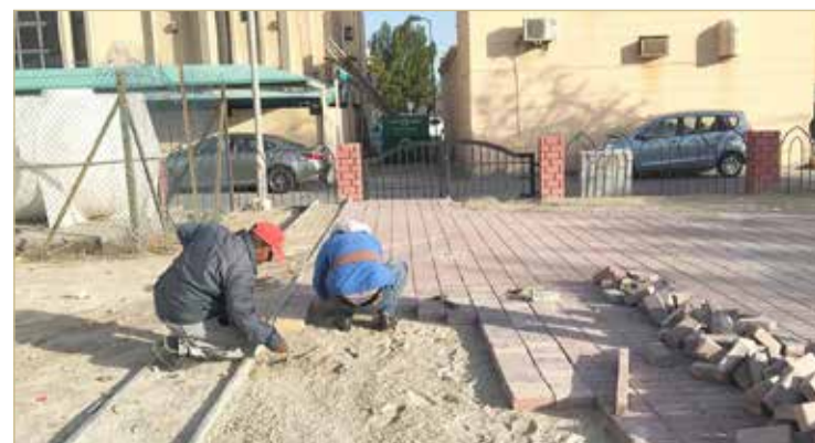
أثناء تركيب الارضيات