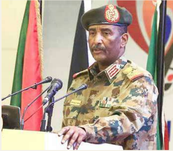
رئيس مجلس السيادة في السودان عبدالفتاح البرهان

وقالت وزيرة الخارجية السودانية، مريم الصادق المهدي، إن إنجازات الثورة ونجاح الحكومة الانتقالية بفك عزلة بلادها "أزعج أعداء الثورة". وقالت الوزيرة في بيان قدمته اليوم للسلك الدبلوماسي الأجنبي المعتمد بالخرطوم، حول المحاولة الانقلابية الفاشلة "تود وزارة خارجية جمهورية السودان أن تُنهي إلى كريمة علمكم أن السلطات السودانية المختصة أحبطت يوم الثلاثاء محاولة انقلابية فاشلة قام بها بعض الضباط من الرتب الوسيطة والصغرى". وأضاف البيان أن الانقلابيين "تصدت لهم قيادة القوات المسلحة، ولم يجدوا الاستجابة التي كانوا ينتظرونها من الوحدات المختلفة، إضافة إلى بعض المدنيين ذوي الصلة بالنظام البائد، وتمت السيطرة الكاملة على الوضع، كما تم إلقاء القبض على قادة تلك المحاولة الانقلابية الفاشلة من العسكريين والمدنيين، ويجري التحري معهم حاليا".