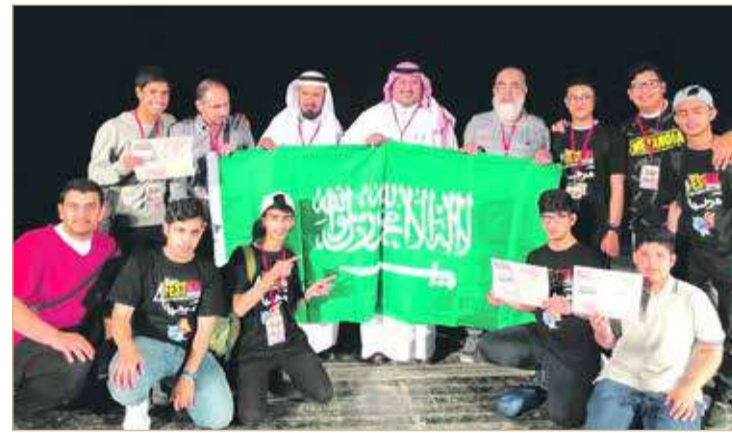
جوائز في مختلف المهرجانات الخليجية والعربية

كما أن الدكتور عصام خوقير يعتبر من رواد المسرحية التراثية السعودية وهو أشهرهم، فقد كتب مسرحية بعنوان "الدوامة" العام 1380هـ، ثم عرف الجمهور بمسرحيته الثانية "السعد وعد" وقد حولت فيما بعد إلى مسلسل تلفزيوني. ويقول ناصر الخطيب في كتابه "مدخل إلى دراسة المسرح في المملكة العربية السعودية": إن الدكتور عصام خوقير قد ذكر أنه "حين كتبت هذه المسرحيات لم يكن المسرح فنا مقروءا، وكانت الكتب التي تقرأ هي الدواوين والقصص وبعض الروايات ولهذا أردت أن أجعل من المسرح فنا أدبيا ككل الأجناس الأدبية الأخرى في الأدب السعودي".