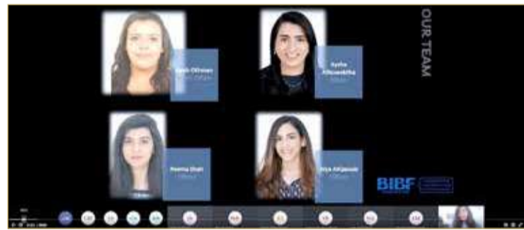
البرنامج خريجي برنامج ولي العهد للملح الدراسية لمشاركة تجربتهم منصة التعلم الإلكتروني MyClass (3.0) التابعة للمعهد. كما استضاف

رحّب معهد البحرين للدراسات المصرفية والمالية (BIBF) بالطلبة المستجدين في البرنامج التمهيدي الدولي وبرنامج البكالوريوس لجامعة بانفور، في لقاء تعريفياً افتراضياً عبر منصة "مايكروسوفت تيمز" استعداداً لانطلاق العام الأكاديمي الجديد. وقدم مركز الدراسات الأكاديمية عرضاً تعريفياً عن أنظمة ولوائح المعهد، تبعه عرض فيديو إرشادي للطلبة بشأن تفعيل صفوفهم الافتراضية من خلال