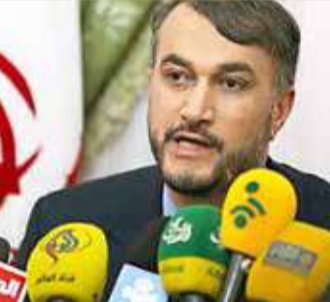
وزير الخارجية الإيراني

تثبت التزامها بالاتفاق". يذكر أن الرئيس الإيراني إبراهيم رئيسي كان ألمح الثلاثاء كذلك لاستعداد بلاده استئناف المحادثات النووية، إلا أنه استبعد أن تشمل الصواريخ الباليستية ودعم الميليشيات الإقليمية، وهي من ضمن المواضيع الخلافية التي كانت تعترض إدارة الرئيس الأميركي جو بايدن إدراجها ضمن المحادثات أيضا.