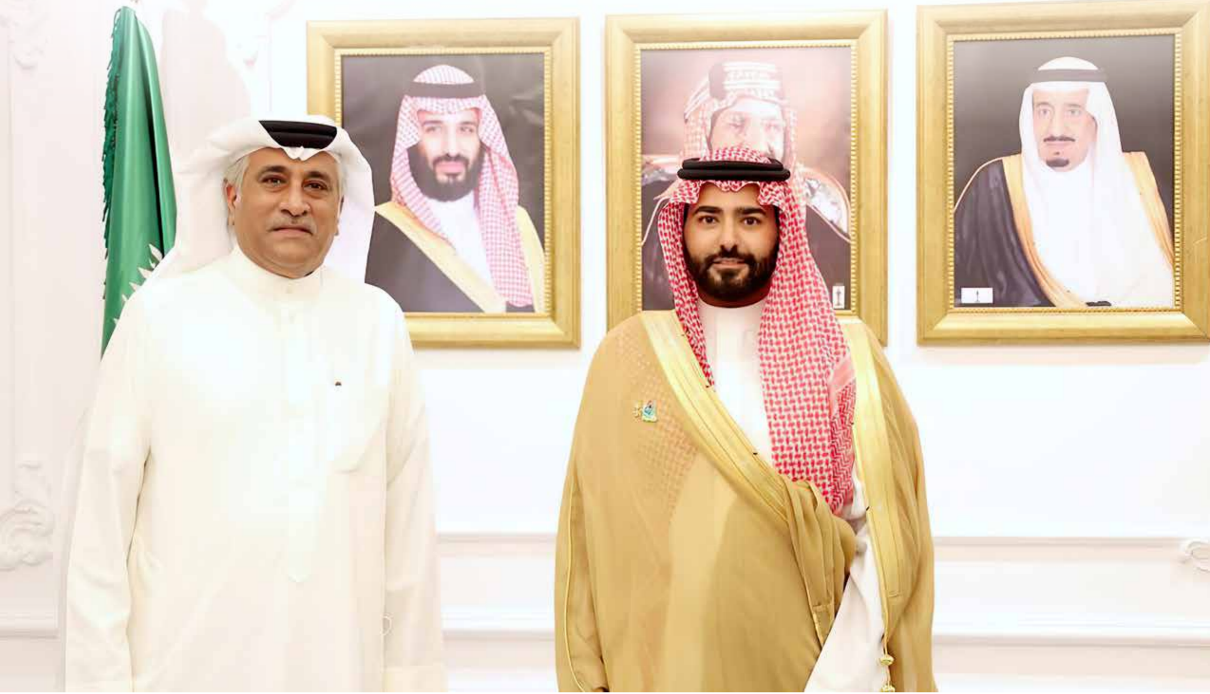
سمو السفير السعودي مع رئيس التحرير بمقر السفارة بالمنامة