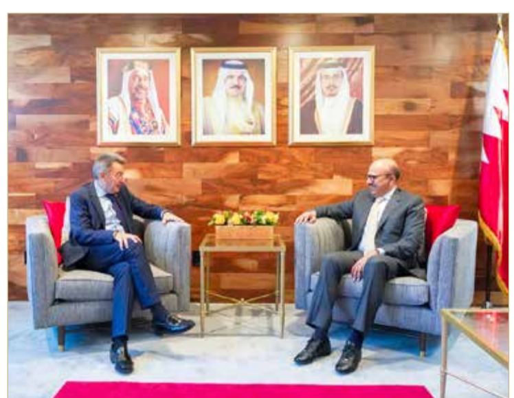
وزير الخارجية ملقيا رئيس اللجنة الدولية للصليب الأحمر

مساعدة الشعوب المنكوبة في العالم بمختلف حالات الطوارئ والكوارث