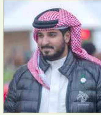
سمو الشيخ عيسى بن عبدالله

وسيشهد الموسم الجديد 2021/2022 إقامة 11 بطولة في الفترة من نوفمبر 2021 حتى أبريل 2022، حيث ستكون البطولات قابلة للتغيير بحسب الظروف. ويبدأ الموسم الجديد بإقامة بطولة افتتاح موسم الاتحاد الملكي لقفز الحواجز وذلك يوم 12 نوفمبر 2021، وبعدها بطولة الاتحاد الملكي لقفز الحواجز بتاريخ 26 نوفمبر 2021. وهي آخر بطولات العام الجاري.