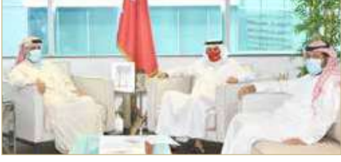
الزباني مستقبلاً النائبين بوحمود والأنصاري

استقبل وزير الصناعة والتجارة والسياحة، زايد الزباني مكتبه أمس كلا من عضو لجنة المرافق العامة والبيئة بمجلس النواب النائب محمد خليفة بوحمود وعضو لجنة الخدمات بالمجلس أحمد الأنصاري. وجرى أثناء اللقاء بحث عدد من الموضوعات ذات الصلة بالشأن العام، خصوصاً منها ما يتصل بالشؤون الاقتصادية بالبلاد، مشيداً الوزير بكل ما يبذله المجلس الوطني من جهود قيمة وتوجهات تصب في خدمة الوطن والمواطنين. وأعرب الوزير عن استعداد الوزارة دائم لتقديم كل أوجه الدعم والمساعدة للمجلس النيابي وللجهات الأخرى المعنية في