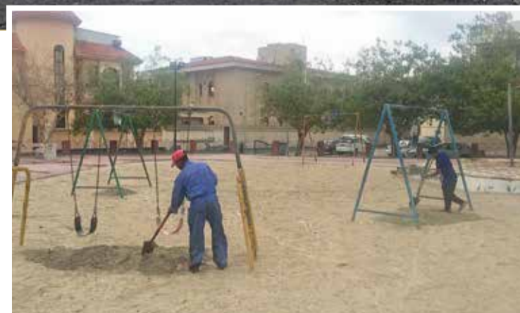
جانب من أعمال الصيانة