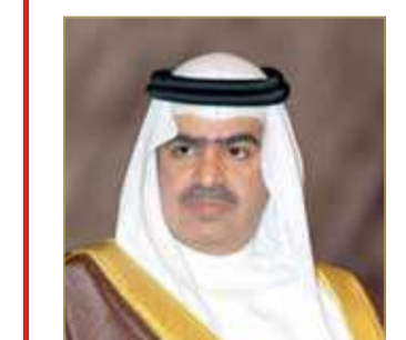
الشيخ فواز بن محمد