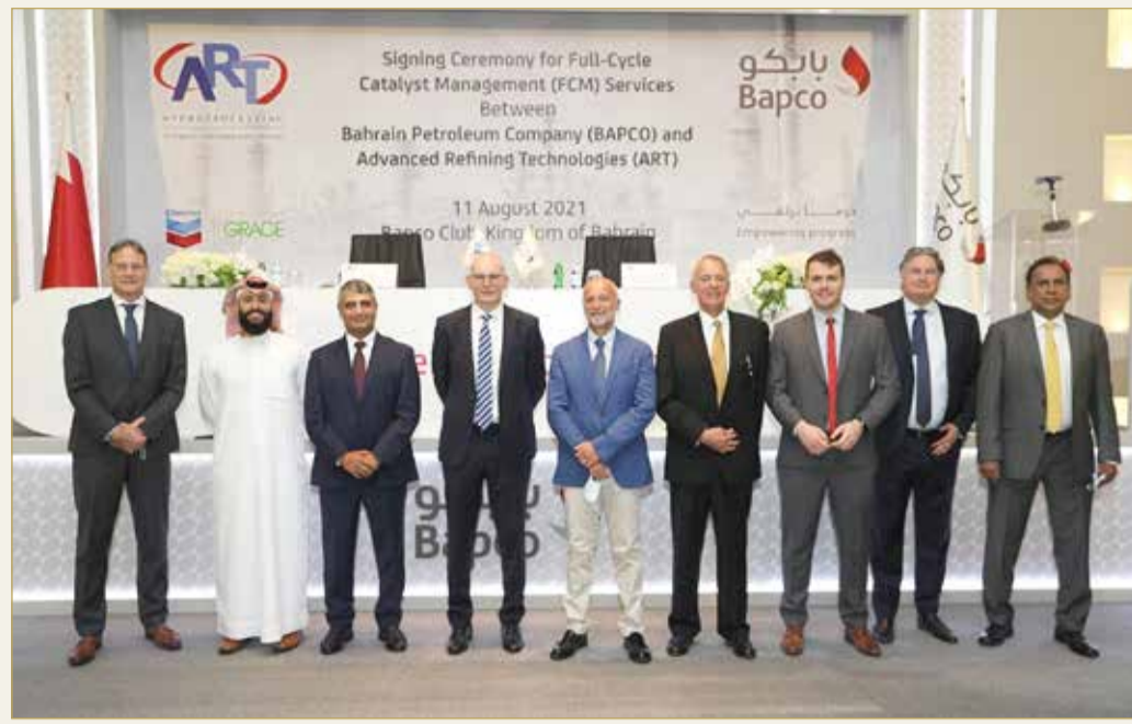
هيوستن - بزنيس واير/ ايتوس واير

في شراكة بين "هوفر سي إس" و "أدفانس ريفايينج تكنولوجيز"