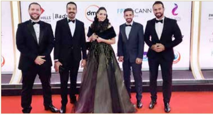
فريق فيلم حد الطار

والإنتاج السينمائي وصناع الأفلام السعوديين من كلا الجنسين؛ إقامة وجودهم محليا ودوليا.