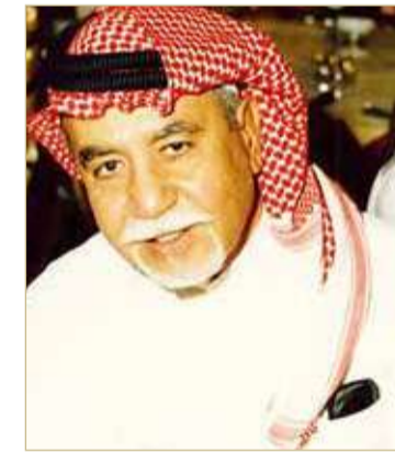
عصام خوقير رائد المسرحية التراثية في السعودية

في العام 1960 بدأت أولى محاولات المسرح العربي في السعودية، على يد الشيخ أحمد السباعي، إذ قام بتأسيس فرقة مسرحية في مكة، وأنشأ معها مدرسة للتمثيل سماها "دار قريش للممثل الإسلامي"، وبدأت الاستعدادات للقيام بأول عرض مسرحي، غير أن الظروف حالت دون ذلك وأغلقت دار العرض. ظل المسرح العربي في