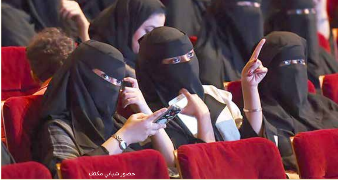
حضور شبابي مكثف