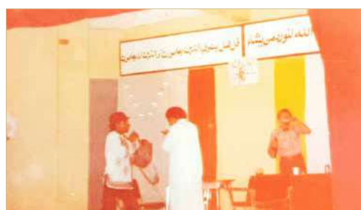
الزميل الماجد في أول عمل مسرحي تمثيلا وإخراجا في السعودية العام 1984

السعودية ذا طابع مدرسي، إذ إن كثيرا من العروض المسرحية كانت تقدم على مسارح المدارس، وبالطبع فإن العنصر النسائي لم يكن موجودا. إلا أن هناك بعض الخطوات التي من شأنها تحريك المسرح العربي في السعودية وتنشيطه، تمثلت هذه الخطوات في أمور عدة، منها: تأسيس جمعية الفنون الشعبية العام 1970، إنشاء قسم الفنون المسرحية بإدارة العامة لرعاية الشباب العام 1974، قيام الجمعية العربية السعودية للثقافة والفنون برعاية الآداب والفنون من العام 1973.