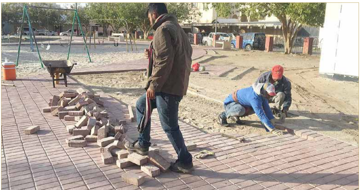
جانب من أعمال التأهيل للحديقة