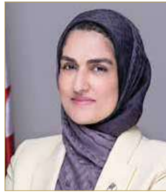
الأمين العام للمجلس الأعلى للمرأة