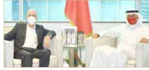
الزباني مستقبلاً القائم بأعمال سفارة إسرائيل

اجتمع وزير الصناعة والتجارة والسياحة زايد الزباني بالقائم بأعمال سفارة دولة إسرائيل لدى البحرين إيتاي تاجنر. وتم خلاله بحث عدد من الموضوعات ذات الاهتمام المشترك. وأكد الزباني أن مثل هذه اللقاءات والتطورات الاقتصادية التي تشهدها العلاقات بين البحرين وإسرائيل ستفتح الباب أمام التبادل التجاري وتعزيز فرص التعاون الاستثماري بين الجانبين، بعدما تم استعراض أوجه التعاون والعمل المشترك، ما سينعكس إيجابياً على اقتصاديات البلدين، لاسيما في القطاعات التجارية والصناعية والسياحية، إذ إن المنطقة ستشهد طفرة كبيرة في شتى