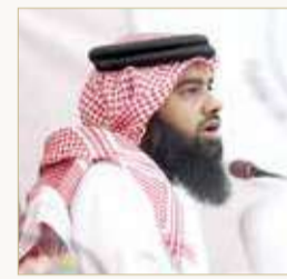
البلاد | سيدعلي المحافظة

مّرّ مجلس بلدي المنطقة الجنوبية مقترحًا بتطوير وتجميل جسر رقم 1 وجسر رقم 2 بشارع الملك حمد.