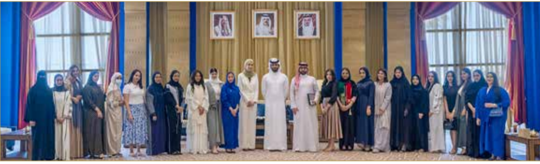
سمو الشيخ ناصر بن حمد يستقبل الطلبة المتطوعين من الجامعة الملكية للبنات

سموه التهاني إلى ولي العهد نائب رئيس مجلس الوزراء وزير الدفاع في المملكة العربية السعودية الشقيقة صاحب السمو الملكي الأمير محمد بن سلمان بن عبدالعزيز آل سعود. وأعرب سمو الشيخ ناصر بن حمد آل خليفة عن أطيب تهنئه وتمنياته إلى المملكة العربية السعودية مزيداً من التقدم والازدهار في ظل قيادة خادم الحرمين الشريفين الملك سلمان بن عبدالعزيز آل سعود.