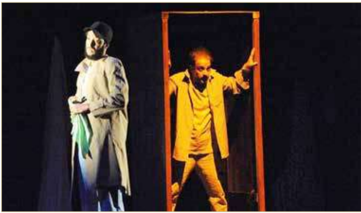
تشابه أفضل عرض مسرحي في مهرجان الشارقة

♦ "متوسطة الإمام الشافعي" بالخبر أعطتني أول فرصة في الإخراج والتمثيل