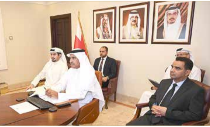
اجتماع وزراء الإسكان بدول الخليج

وأضاف وزير الإسكان أنه جرى خلال الاجتماع التطرق إلى طرق التمويل السكني، بالإضافة إلى مناقشة قواعد المعلومات الإسكانية التي تساند صناع القرار على اتخاذ الخطوات المطلوبة في الشأن الإسكاني؛ من أجل إدارة هذا الملف وفق إحصاءات وبيانات محددة، كما تم استعراض النظام العام الموحد لملاك العقارات، والإستراتيجية الموحدة للإسكان في دول مجلس التعاون الخليجي والتي تحدد الأطر العامة للسياسات الإسكانية وكيفية التعامل مع الملف الإسكاني من خلال سرعة تلبية الخدمات الإسكانية للمواطنين.