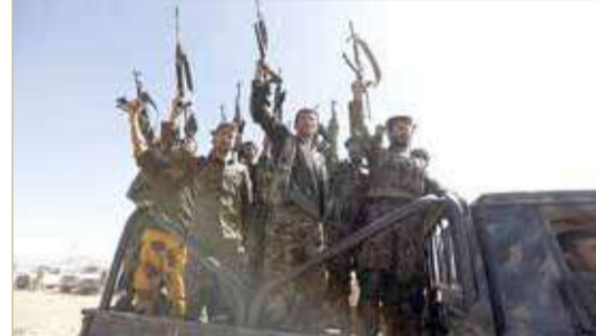
أفراد من ميليشيات الحوثي.

وفي السياق، تضاعفت خسائر ميليشيات الحوثي في الأرواح والعتاد في محافظات مارب والبيضاء وصعدة، من جراء شن مقاتلات التحالف غارات جوية على آليات وتجمعات ومواقع حوثية. إلى ذلك، أعلن تحالف دعم الشرعية، أمس الأربعاء، أن الدفاعات الجوية اعترضت ودمرت طائرتين مسيرتين مفاخنتين أطلقتتهما الميليشيا الحوثية تجاه خميس مشيط. وأضاف في بيان أنه يتابع النشاط الحوثي بإطلاق المسيرات المفخخة، ويتخذ إجراءات صارمة لحماية المدنيين.