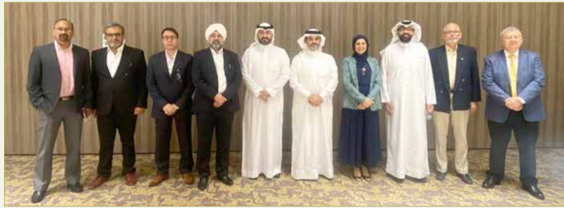
مجلس إدارة جمعية مكاتب السياحة والسفر البحرينية المنتخب

المعلم: متفائلون ونحتاج لـ 3 سنوات لنعود لوضع 2019