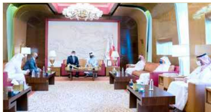
سمو الشيخ خالد بن حمد مستقبلا رئيس الاتحاد الآسيوي للمصارعة

اعتلاء المنتخب الوطني لفنون القتال المختلطة لصدارة التصنيف الدولي، مشيرًا إلى أن البحرين قادرة على تحقيق مزيد من النتائج المتميزة في لعبة المصارعة، وأن