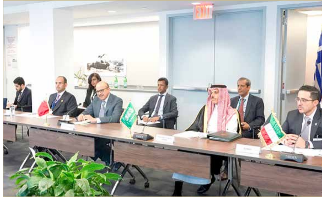
وزير الخارجية يتراس وفد مجلس التعاون في الاجتماع الوزاري المشترك بين المجلس والاتحاد الأوروبي

الدفع بآفاق التعاون المشترك في المجالات السياسية والاقتصادية والأمنية