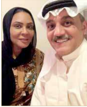
إنتاج كويتي بروح بحرينية

طيلة عمره الممتد حول 40 عامًا حضر فيه الكثير من جلسات "الزبان" لم ير الجن بعينه. القصة المتداولة لاعتزال الطاقة نورة والتي روتها بنفسها في أحد الفيديوهات أنها تلقت مكالمات هاتفية لإحياء أحد حفلات الزفاف في أحد المناطق في الكويت خلال فترة التسعينات وتم الاتفاق على اليوم والموعود وكل ما يخص الزفاف، وبمجرد وصول الفرقة الفئانية للطاقة نورة للحفل والسلام على أصحاب الزفاف شعر بعض أعضاء الفرقة بأن هناك شوكا في أيدي أهل