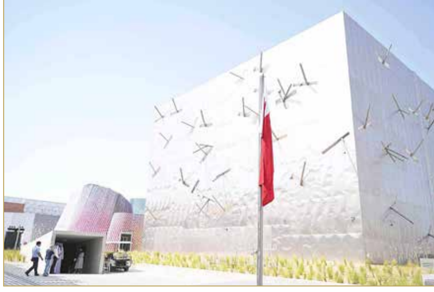
مملكة البحرين افتتحت مساء أمس جناحها الوطني في "إكسبو 2020 دبي"