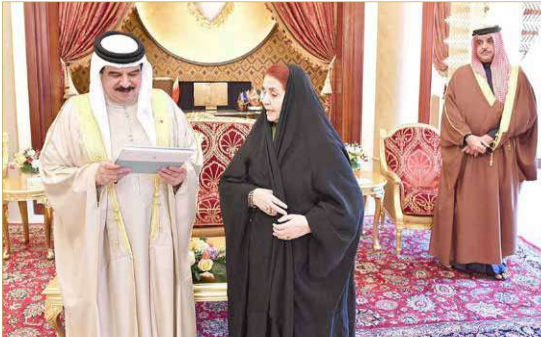
جلالة الملك يتسلم نسخة من كتاب المرأة البحرينية والتعليم "إشراقات مبكرة وريادة وطنية"

♦ "الأعلى للمرأة": البحرينية وصلت إلى أوج ريادتها في التعليم