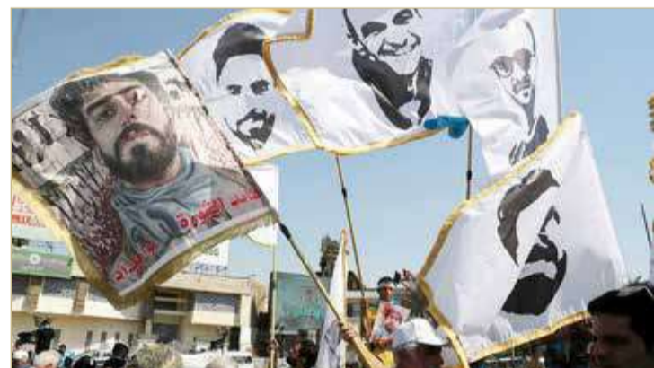
تظاهرة في بغداد إحياءً للذكرى الثانية لاحتجاجات 2019

مطالب بالتغيير ومحاسبة القتلة ورفض انتخاب الأحزاب الفاسدة