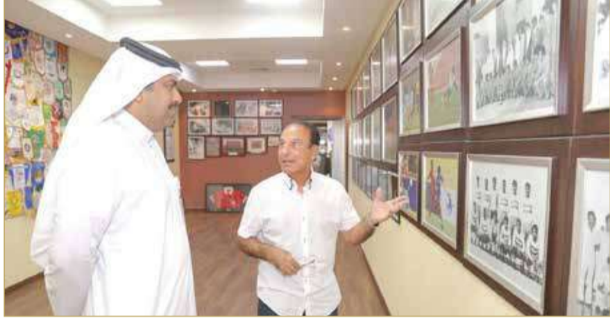
زليخ يطلع على معرض النجوم