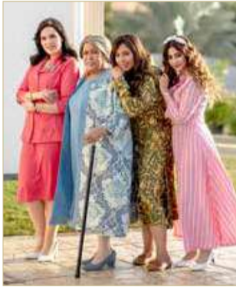
مسلسل مارجريرت الرمضاني