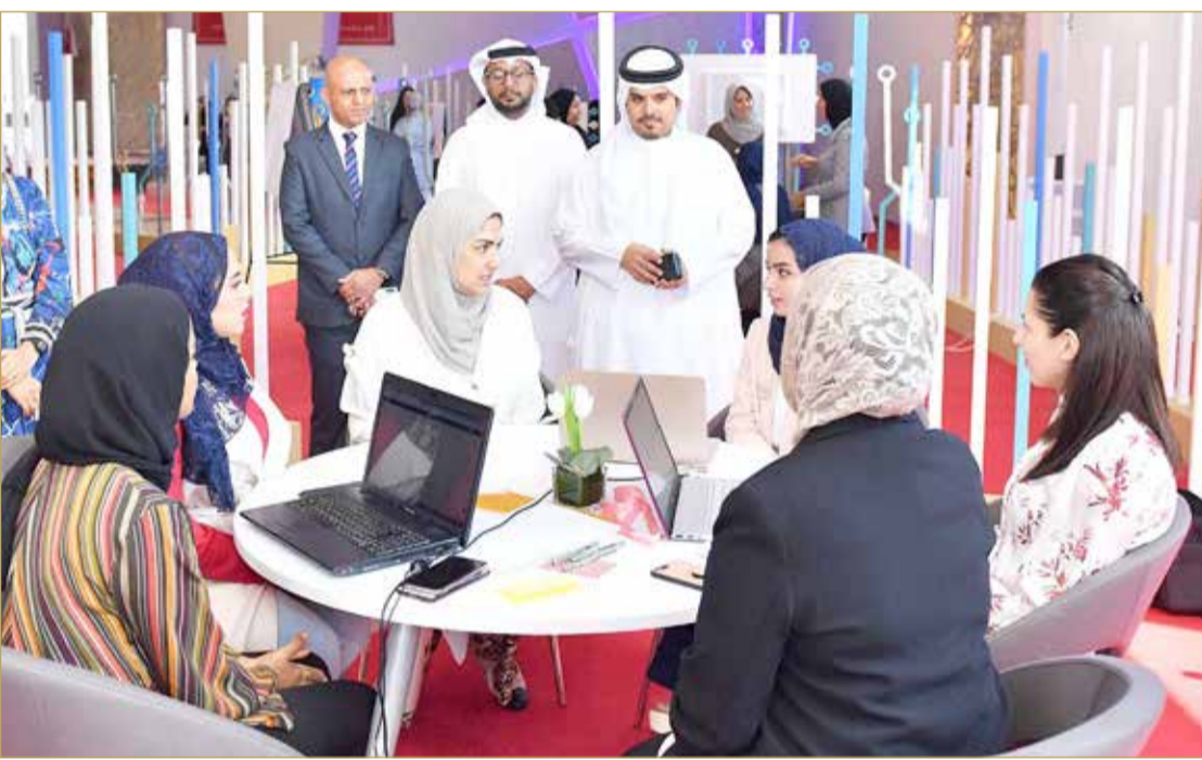
إطلاق أول هاكثون نسائي للمرأة البحرينية بعنوان "تحدي وابتكار"

كما تم إطلاق مبادرة يوم المرأة البحرينية للعام 2008؛ ليتم الاحتفاء بها تقديرًا لدورها الكبير في تنمية وتطوير المجتمع، واستذكاً لما قدمته طوال