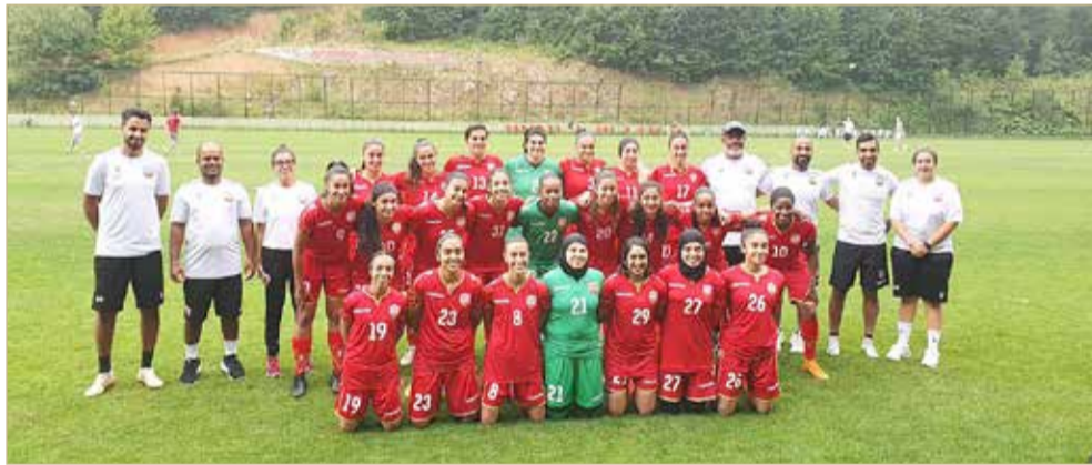
منتخب السيدات لكرة القدم

18 حتى 24 أكتوبر الجاري، إذ سيلعب يوم 18 أكتوبر: لاوس مع الصين تايبيه، يوم 21 أكتوبر: البحرين مع لاوس، ويوم 24 أكتوبر: الصين تايبيه مع البحرين. وبحسب نظام التصفيات يتأهل بطل المجموعة مباشرة إلى النهائيات المقررة في الهند.