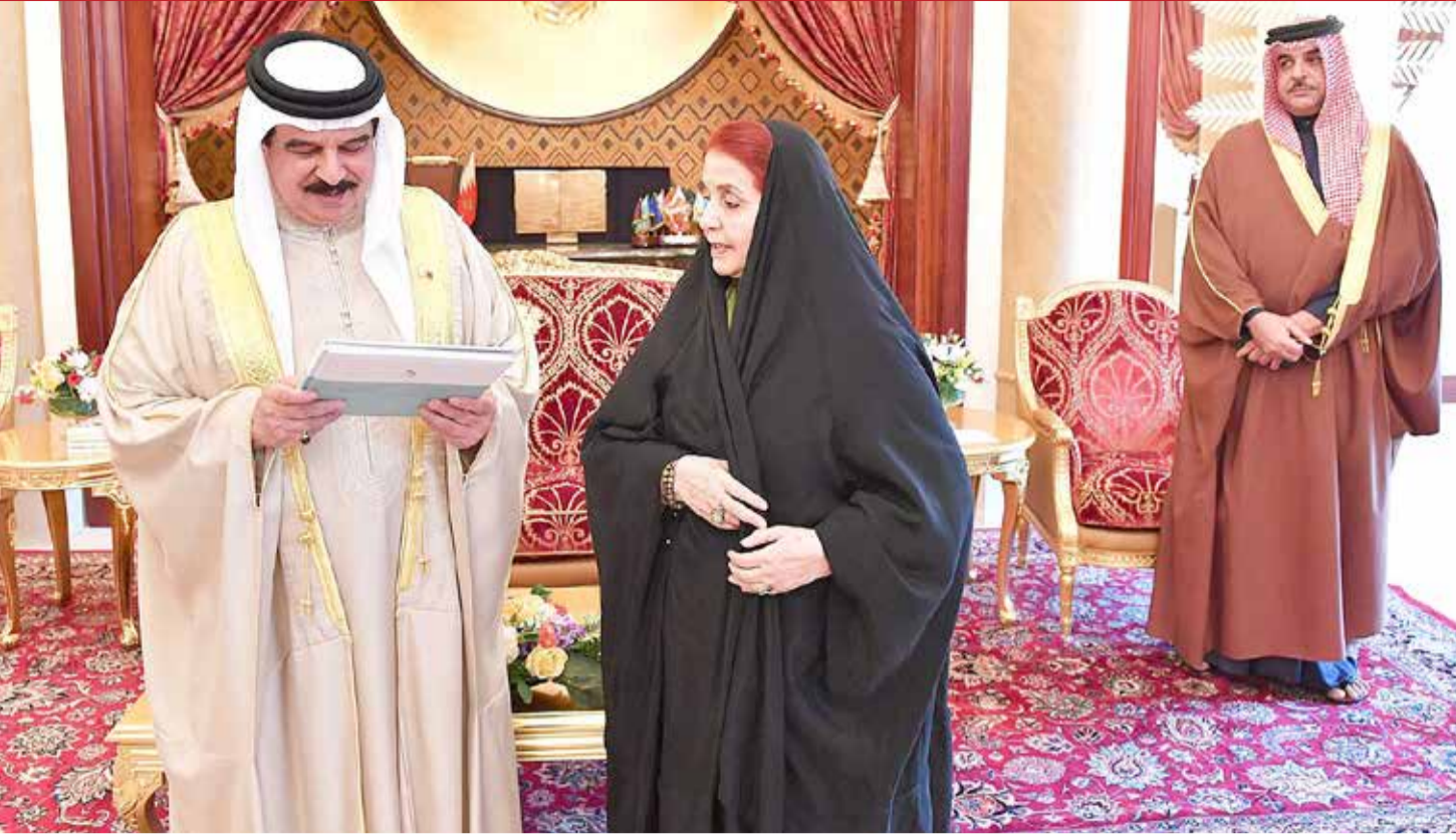
جلالة الملك يتسلم نسخة من كتاب المرأة البحرينية والتعليم "إشرافاً مبكرة وريادة وطنية"