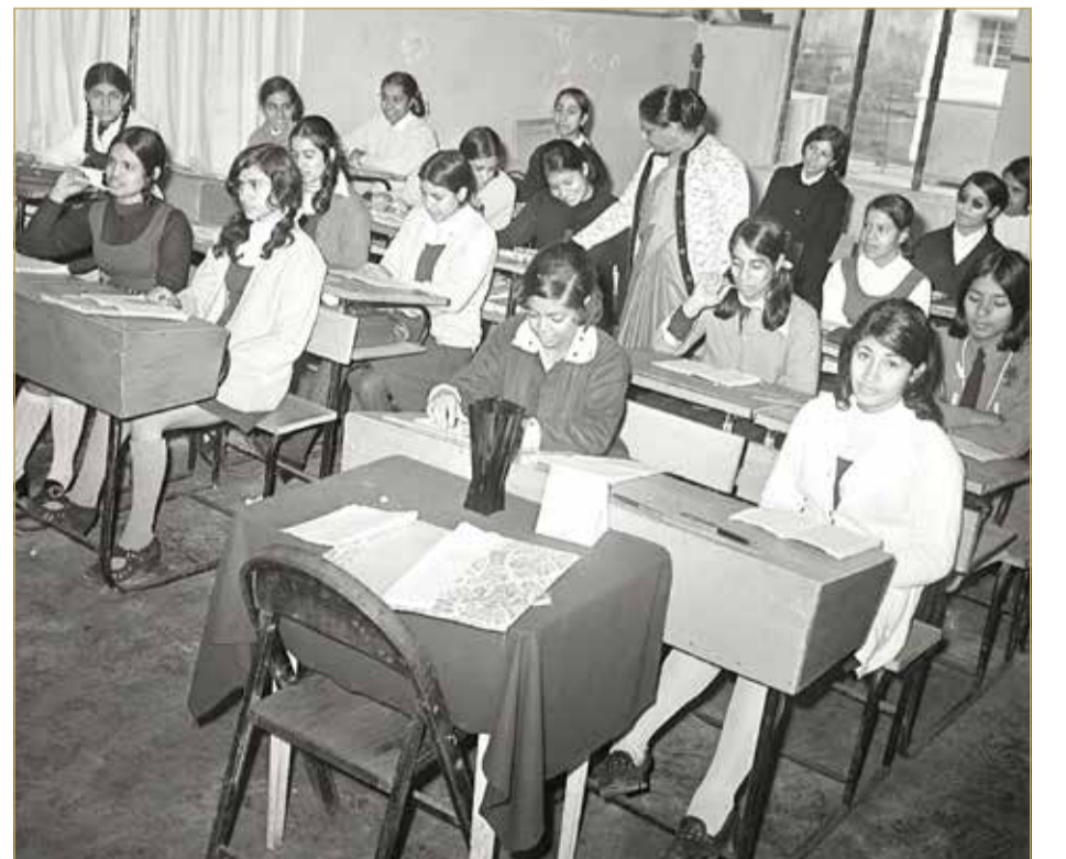
صورة أرشيفية لطالبات مدارس البحرين في السبعينات