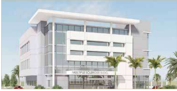
مركز التصلب اللويحي

♦ "الأشغال": تشمل جسوراً علوية وأنفاقاً ومحطات للمياه المعالجة ومحاجر صحية