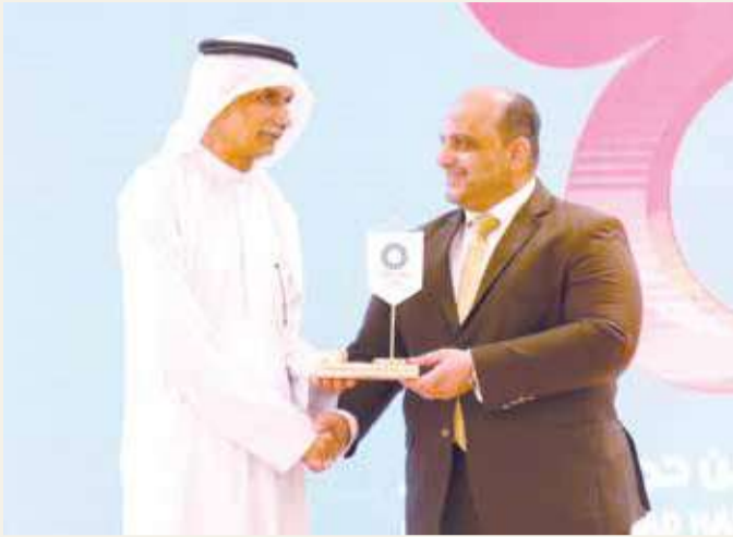
تكريم رئيس نادي الشباب

وكشف اتحاد اللعبة عن رعاية الدوري وهم: البنك الأهلي المتحد، بنك بيت التمويل الكويتي، شركة شووت، مصنع السافي (فراتا). كما أعلن اتحاد اللعبة عن وجود جائزة مادية مقدارها 50 ديناراً ستكون مخصصة في كل جولة، لأفضل لاعب، إداري، مدرب، وطاقم تحكيم. وسيحصل بطل الدوري على جائزة مقدارها 10000 دينار، المركز الثاني 6000 دينار، المركز الثالث 4000 دينار.