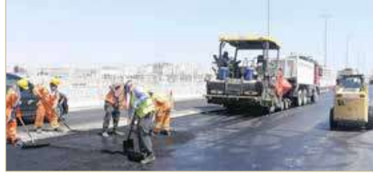
شارع الشيخ زايد