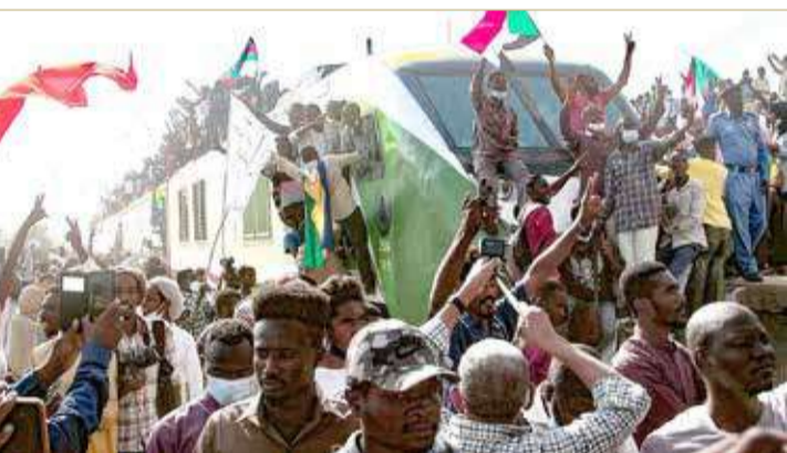
تظاهرات دعم للتحويل المدني في السودان

البرهان: حريصون على الشراكة مع المكون المدني في البلاد