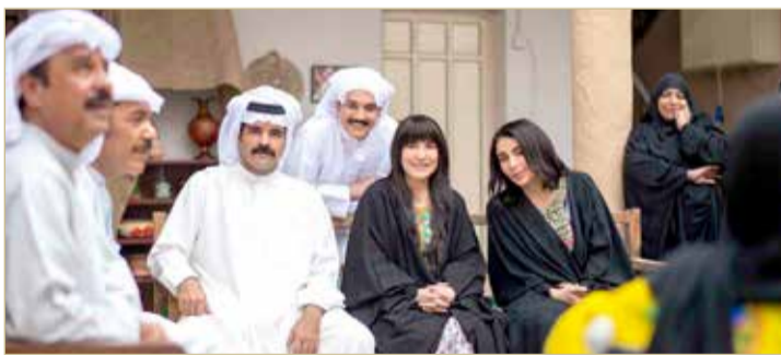
فريق مسلسل كف ودفوف

خصوصاً والبحرين سباقه بكوادرها دائماً في جميع المجالات.