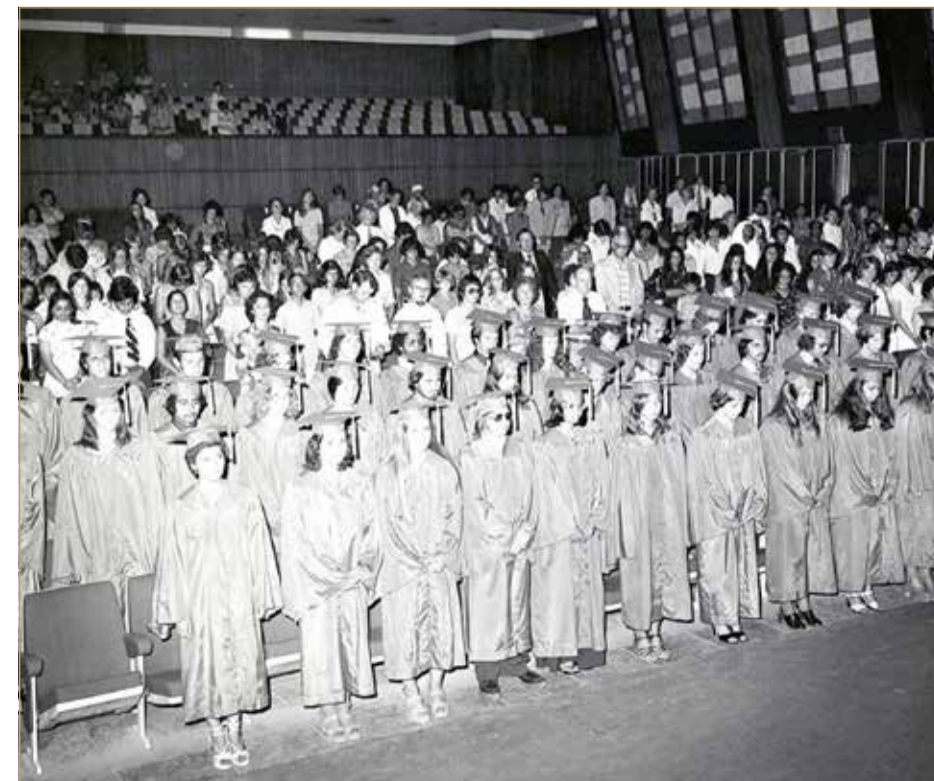
حفل تخرج طالبات مدرسة البحرين يونيو 1977

وبدأت رحلة تطوير التعليم بوضع التصورات التي تستند إليها الرؤية الحداثية لعاهل البلاد للارتقاء بالتعليم، الأمر الذي يمكن التعرف عليه من خلال تحليل خطابات وتصريحات جلالت ذات الصلة؛ إذ شغلت قضية التعليم حوالي 28 % منها خلال فترة العقدين الماضيين تقريبا، بما يجسد مكانة وأهمية التعليم في فكره ووجدانه، وتوازي مع ذلك خلق البيئة التشريعية والقانونية التي تستوعب ما يطمح إليه لجهة خلق نموذج