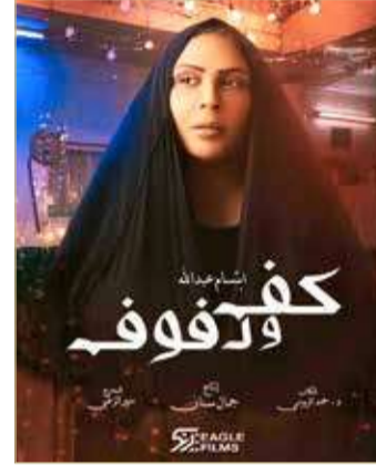
أحداثها ربما حقيقية