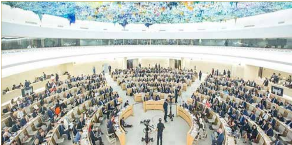
مجلس حقوق الإنسان خلال جلسة سابقة

دولة عضوا ومقره جنيف باعتراف 21 دولة على مشروع القرار الذي قدمته هولندا وتأييد 18 منهم بريطانيا وفرنسا وألمانيا. بينما امتنعت 7 دول عن التصويت وغياب دولة هي أوكرانيا. ويقتصر تمثيل الولايات المتحدة في المجلس على دور المراقب.