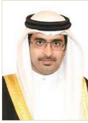
سمو الشيخ خليفة بن علي

مواطن ومقيم عاش على أرض البحرين الغالية، منوهاً سموه بأن أهالي المحافظة الجنوبية بجميع مدنها ومناطقها يدينون بالإخلاص التام لجلالته. وبين سموه أن هذا اللقاء يتزامن في الوقت الذي تشهد المحافظة الجنوبية مشروعات تنموية وخدمات أساسية متميزة توفر جميع سبل العيش الكريم والرفاه لأبناء المحافظة المعطاء؛ بفضل اهتمام وحرص جلالته الملك ومتابعة ولي العهد رئيس مجلس الوزراء صاحب السمو الملكي الأمير سلمان بن حمد آل خليفة، منوهاً سموه بأن رؤية جلالتهم الحكيمة حققت للمحافظة الجنوبية أسباب التطور والنماء والاستدامة في المجالات كافة حتى أضحت اليوم نموذجاً في التقدم والريادة، داعياً سموه