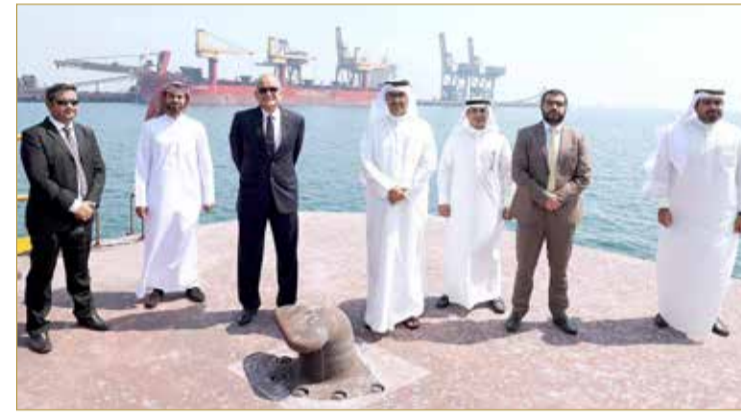
افتتاح رصيف شركة صلب البحري

البلاد | المرر الاقتصادي | تصوير: رسول الجبيري