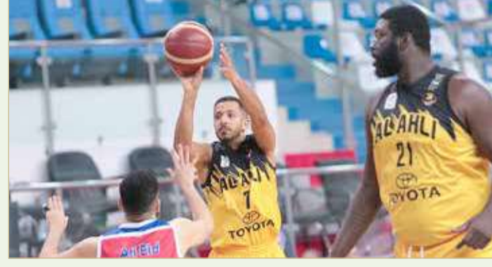
لقاء الأهلي وسترة

على المجريتين، وسيُربها لصالحه من خلال الشوطين اللذين أجاد التعامل معهما دفاعيًا وهجوميًا وإحراز النقاط داخل وخارج القوس، التي جعلته يتقدم بالنتيجة حتى نهاية المباراة، وسط مساعي للاعبين سترة بمجاراة خصمهم إلا أن الفوارق الفنية من جهة والأخطاء والاستعجال وإضاعة الكرات من جهة أخرى كلفته الخسارة.