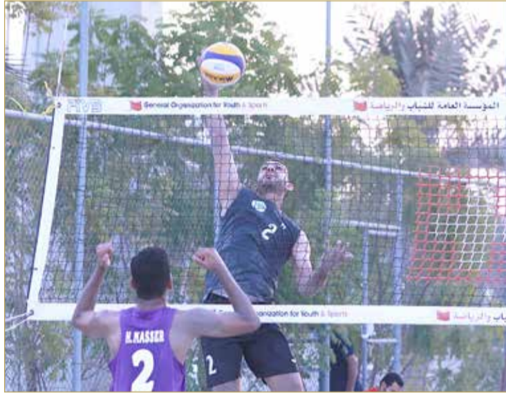
من منافسات الأدوار النهائية

الآن بخصوص المشاركات الخارجية المقبلة مثل البطولة العربية ودورة الألعاب الخليجية الشاطئية، ولكن المجلس حريص على استمرارية نشاط الشواطئ من جهة والجهوية المسبقة جهة أخرى لأي مشاركة مقبلة والتعامل مع أي ظروف مفاجئة، مضيافاً "روزنامة المشاركات الخارجية غير واضحة ولكننا نسعى للتحضير والاستعداد تحسباً لأي مشاركة مقبلة... فالمدرّب لا بد أن يضع عينه على اللاعبين ويحدد خياراته مسبقاً حتى لا يكون الاختيار عشوائياً وسريعاً قبل أي مشاركة...".