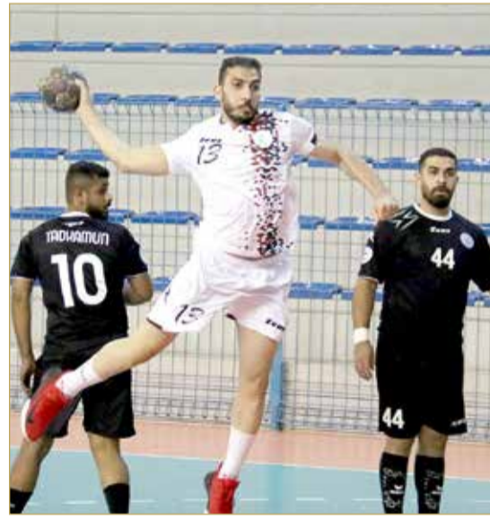
لقاء الاتفاق والتضامن