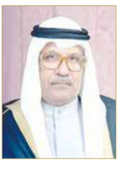
المرحوم ماجد الجشي

في المملكة في العام 1970. وشغل الفقيه أول منصب وزاري في العام 1975، حيث عمل وزيرا للأشغال والكهرباء والماء. ومارس عمله مستشارا لرئيس الوزراء بدرجة وزير منذ 2001 وحتى 2020. (04)