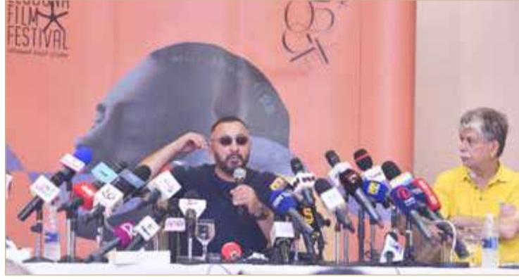
السوشيال ميديا مهم للفنان