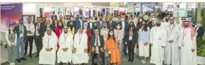
صورة جماعية للمشاركين في حفل التدشين

انطلقت أمس في مركز التجارة العالمي دبي أعمال الجناح الوطني البحريني بمعرض جيتكس 2021، وسط مشاركة ممثلين عن مختلف مجالات قطاع تقنية المعلومات في مملكة البحرين من شركات ناشئة ومتوسطة وجهات حكومية ومؤسسات تعليمية.