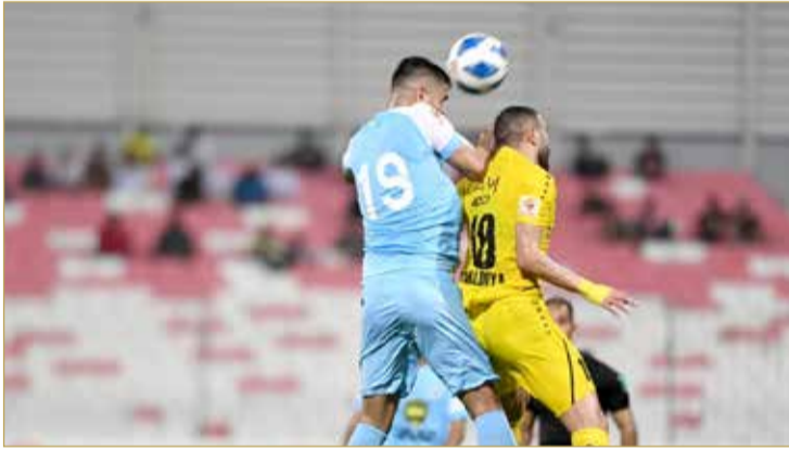
لقاء الرفاع والخالدية