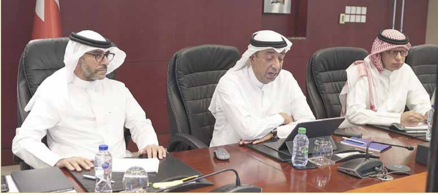
المنامة - غرفة تجارة وصناعة البحرين

◆ سنعد ورشا تدريبية للراغبين في صناعة المبادرات والأفكار الاقتصادية ووضع التصورات المستقبلية