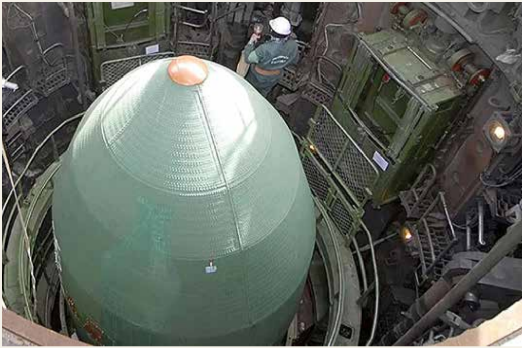
الإيرانيون ليسوا مستعدين بعد للانخراط في المحادثات النووية

ونقلت وكالة أنباء فارس أمس الأحد عن نائب البرلمان الإيراني قوله إن وزير الخارجية حسين أمير عبد اللهيان أكد خلال اجتماع مغلق للبرلمان على انتحاج طهران سياسة "الخطوة مقابل الخطوة والعمل مقابل العمل" في المفاوضات النووية مع القوى العالمية. وأضاف النائب علي رضا ميرسليمي في تصريحات للوكالة أن عبد اللهيان شدد على أنه "على الأميركيين إثبات حسن نواياهم وصدقيتهم والقيام بمبادرة جادة قبل (استئناف) المفاوضات". وأشار إلى أن إيران تعتزم متابعة المفاوضات بشأن القضايا التي تارثت منذ إعلان الرئيس الأميركي السابق دونالد ترامب عن خروج واشنطن من الاتفاق النووي "وليس الحالات الأخرى". وذكر النائب البرلمان أن وزير الخارجية أعلن خلال الاجتماع أن طهران "ستفضل مسار المفاوضات النووية عن مسار اقتصاد البلاد ولن تجعل الاقتصاد رهنا بها"، كما أوضح الوزير أن الحكومة "ستتابع الاقتصاد بمعزل