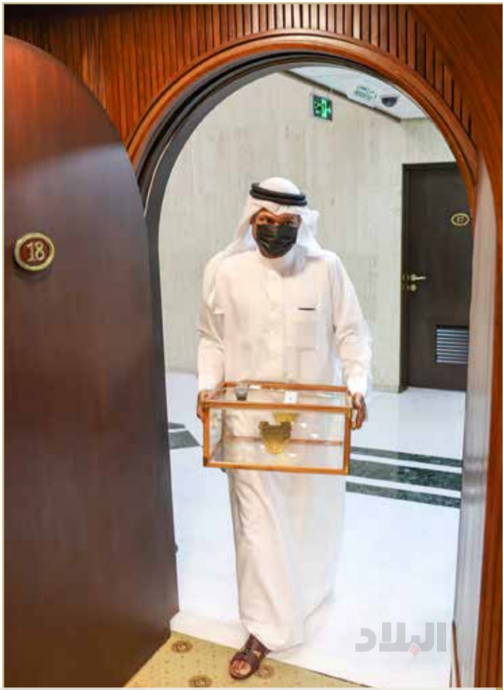
صندوق الاقتراع يدخل قاعة البرلمان

وحصد الشوري العرادي أعلى الأصوات (26 صوتاً). وبمقارنة تشكيل هذا الدور مع