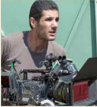
المخرج نبيل عيوش

عرض فيلم المخرج المغربي نبيل عيوش "علي صوتك"، وهو من الأفلام المهمة في مهرجان الجونة السينمائي الدولي، وفيه يحكي المخرج المبدع قصص الشباب المغربي المهووس بالهيب هوب، من خلال مجموعة مراهقين في حي سيدي مومن الفقير في الدار البيضاء، وهو اللقاء الذي سيتولد عنه نقاش مع الشباب الذين سيتعلمون كيف يبلغون أفكارهم ومعيشتهم وتطلعاتهم عبر ثقافة "الهيپ هوب" الغربية بمحاولة الشباب تحرر أنفسهم من بعض التقاليد، ويعبرون عن أنفسهم من خلال هذه الموسيقى المنتشرة بالمغرب.