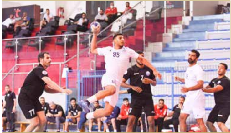
لقاء النجمة وسماهيج