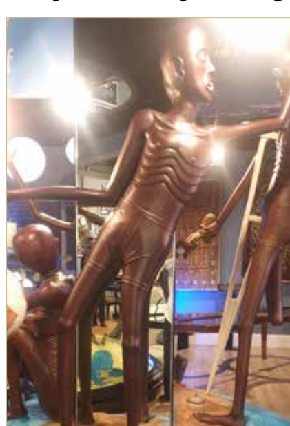
زاوية ثانية من العمل

العمل الفني الذي أبدعه جناحي فيه من التوافق والتناسق والإبداع والفن الأكمل في الحياة، فهو عبارة عن تماثيل يصور الجوع الرهيب المنطلق كالعاصفة حاملا سيف الدمار للبشر الذين يقتاتون على الشوك. تماثيل فيها قدرة التعبير عن الحركة