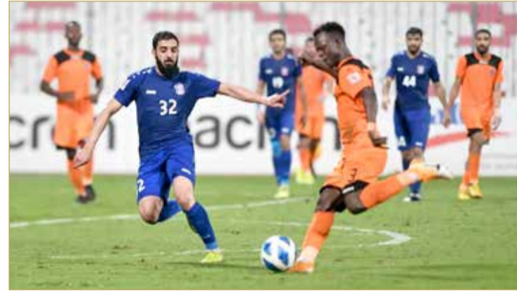
لقاء المنامة والحالة

وبسط فريق المنامة أفضليته على مجريات الشوط الأول وسط تحركات فعالة من لاعبيه وأخطاء في الجهة الحلاوية، ليهدد مرمى الحالة، وبعدها