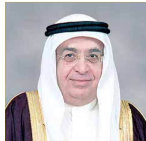
سمو الشيخ محمد بن مبارك

برنامج العقوبات البديلة، في تحقيق أهدافه كمشروع وطني حضاري بأبعاد إنسانية شاملة، مؤكداً المجلس ضرورة وضع توجيه جلالاته كأولوية في المرحلة المقبلة من أجل البدء في وضع الآليات التنفيذية والبنى التحتية اللازمة لمراكز الإصلاح والسجون المفتوحة، كما أكد المجلس الأهمية التي توليها الحكومة لاستمرار تعزيز العمل والتعاون مع السلطة التشريعية ومراجعة وتطوير التشريعات ذات الأولوية بما يسهم في تأمين البيئة الداعمة للتنمية ويحقق الخير والنماء للمواطنين. وبمناسبة ذكرى المولد النبوي الشريف، رفع مجلس الوزراء خالص التهاني والتبريكات إلى مقام عاهل البلاد صاحب الجلالة الملك حمد بن عيسى آل خليفة، وولي العهد رئيس مجلس الوزراء صاحب السمو الملكي الأمير سلمان بن حمد آل خليفة، سائلاً الله تعالى أن يُعيد هذه المناسبة على أبناء مملكة البحرين، والأمم العربية، والإسلامية بالخير، والاستقرار. (03)