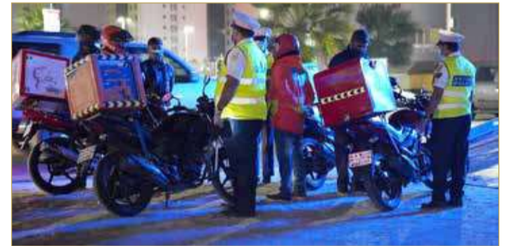
المنامة - وزارة الداخلية

في إطار تنفيذ الإدارة العامة للمرور للأنظمة والقوانين المرورية ومواصلة للجهود المخلصة لتعزيز السلامة المرورية لكافة مستخدمي الطريق، تمكنت الإدارة في ضبط 1400 دراجة نارية مخالفة للأنظمة والقواعد المرورية خلال الثلاث أشهر الماضية. وأوضحت الإدارة أن المخالفات المضبوطة تمثلت في ضبط دراجات مخصصة لتوصيل طلبات المطاعم لم يتقيد قائديها بالسرعة المقررة للطريق وتجاوز الإشارة الضوئية، والمرور عبر خطوط المشاة والسير عكس الاتجاه، إضافة إلى ضبط الدراجات النارية غير المسجلة، والدراجات التي يتم الاستعراض بها على الطريق العام وارتكاب الممارسات الخاطئة في الأحياء السكنية، وعدم الالتزام باشتراطات السلامة، ما يعرض حياتهم وحياة الآخرين للخطر وإزعاج القاطنين في المنطقة.