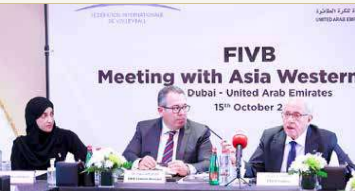
رئيس الاتحاد الدولي لكرة الطائرة أثناء مشاركته بالاجتماع

على أهمية منطقة غرب آسيا والتي تمثل تقاليداً كبيراً وتطوراً على مستوى البنية التحتية والاقتصاد القوي، مؤكداً اهتمام الاتحاد الدولي وتركيزه بتطوير اللعبة في منطقة غرب آسيا. وأشار إلى أن الاتحاد الدولي تعاقد مؤخراً مع شركة "CVC" للدعاية والإعلان، التي ستقوم بعملية التسويق