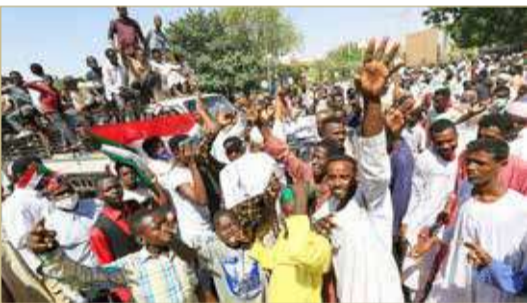
أزمة حكم تشعب منذ أكثر من سنتين في السودان