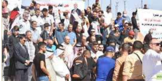
محافظات بغداد والبصرة وبنين، شهدت احتجاجات على نتائج الانتخابات

بالدليل القاطع والدامع". وأكد أنه "مع ردود الفعل والنتائج التي لا يمكن أن يوافق عليها الائتلاف، فإن تحالف الفتح لن يترك الساحة لأميركا وحلفائها وغيرهم ليلعبوا بها".