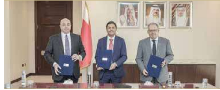
عقب توقيع الاتفاقية

أعلن بنك البحرين والكويت، عن تسهيل قرض مشترك لمدة عامين بقيمة 150 مليون دولار، جرى التوقيع عليه في 7 أكتوبر 2021 وبتنسيق من بنك ABC، وستستخدم عائدات القرض لأغراض التمويل العام للبنك. وتولي ترتيب القرض كل من بنك ABC وبنك الإمارات دبي الوطني وبنك المشرق بصفتهم المنظمين المفوضين والمدبرين الرئيسيين للقرض، كما قام بنك الإمارات دبي الوطني بدور الوكيل.