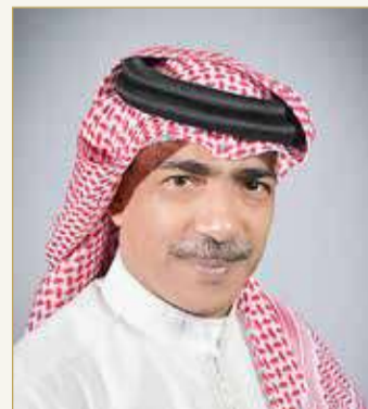
الشيخ علي بن محمد

الاتحادات القارية وذلك بناء على ما ستقدمه الاتحادات الوطنية من مشاريع وبرامج لتطوير اللعبة في بلدانها ومدى فائدة تلك المشروعات في الارتقاء بها.