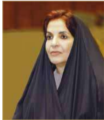
سمو الأميرة سبيكة بنت إبراهيم

جانب حث المواطنين والمقيمين على الاهتمام بالزراعة في المنازل، وتوعية طلبة وطالبات المدارس والجامعات بالزراعة كجزء لا يتجزأ من استراتيجية الأمن الغذائي والصحي ورافد مهم من روافد الاقتصاد الوطني للمملكة.