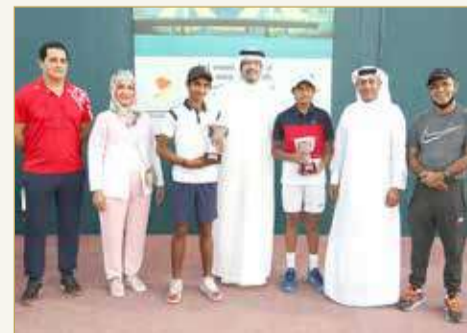
تنويج أبطال فردي الأولاد