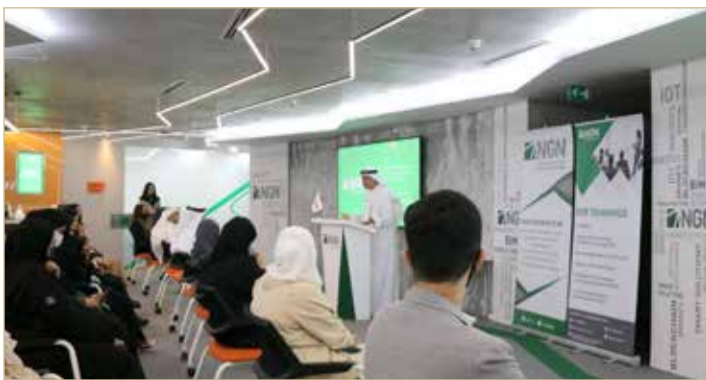
جانب من برامج التدريب

وأعرب عن دعم المركز للجهود الوطنية الرامية إلى خلق المزيد من فرص العمل أمام البحرينيين، عبر تقديم تدريب نوعي في مجال تقنية المعلومات للشباب من الجنسين، وتأهيلهم وفقاً لأفضل المعايير الدولية حتى يصبحوا جاهزين أكثر للحصول على فرص العمل النوعية ذات الرواتب المجزية ويسهموا في مسيرة التنمية المنشودة.