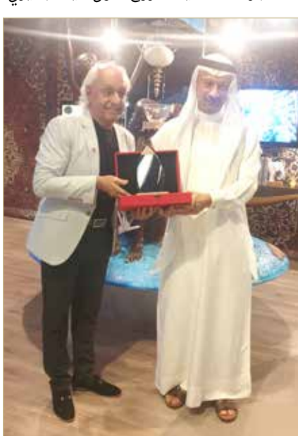
جناحي يكرم نائب محافظ العاصمة