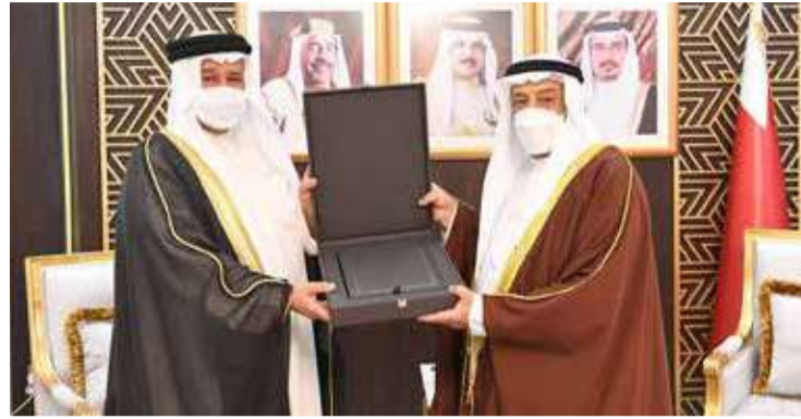
الصالح يسلم التقرير

الملك حمد بن عيسى آل خليفة، مكثه من أداء مهامه بكفاءة، منوهاً بالاهتمام الذي يولييه ولي العهد رئيس مجلس الوزراء نائب القائد الأعلى صاحب السمو الملكي الأمير سلمان بن حمد آل خليفة، وتوجيهاته بمتابعة تنفيذ التوصيات والملاحظات الواردة في تقارير الديوان للجهات المشمولة بالرقابة. وأكد أن الديوان سيواصل أداء مهامه الموكلة إليه بموجب القانون، وما تقتضيه