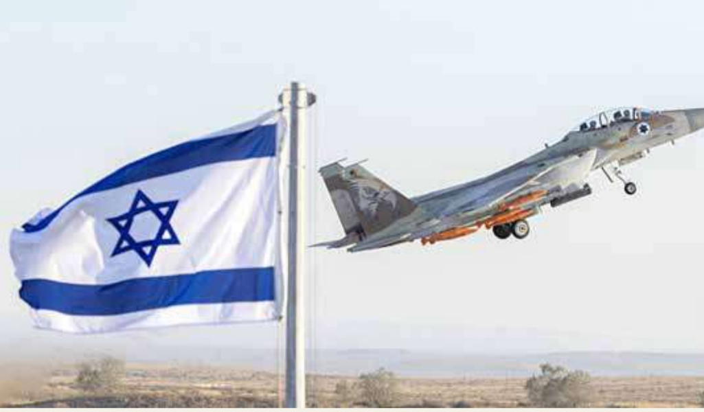
ليبرمان: لا عملية دبلوماسية أو اتفاقاً سيوقف برنامج إيران النووي

ووافقت الحكومة الإسرائيلية، على ميزانية بقيمة 5 مليارات شيكل، أي ما يعادل 1.5 مليار دولار، لتعزيز قدراتها على استهداف البرنامج النووي الإيراني، بحسب ما نقلت صحيفة "تايمز أوف إسرائيل"، عن القناة الإسرائيلية. وذكرت القناة أن "الأموال ستوجه نحو الطائرات وجمع المعلومات الاستخباراتية، وربما استخدام الأقمار الاصطناعية، من بين خيارات أخرى". وينص الاتفاق النووي لعام 2015 على أن تقيد إيران بشدة تخصيب اليورانيوم لديها مقابل رفع العقوبات الاقتصادية المفروضة عليها. وتصرّ إيران على أن برنامجها النووي مخصص للأغراض السلمية فحسب. وكان الرئيس الأميركي السابق، دونالد