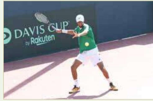
جانب من لقاء السعودية مع الإمارات

سيقام اليوم الجمعة لمعرفة مصيرهم في البطولة.