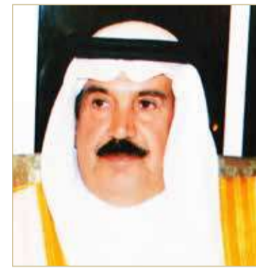
دعيج بن سلمان

هنا نائب رئيس المجلس الأعلى للشباب والرياضة مجلس إدارة نادي المحرق الشيخ دعيج بن سلمان آل خليفة برئاسة الشيخ أحمد بن علي آل خليفة، على تأهل الفريق الأول لكرة القدم للمباراة النهائية لبطولة كأس الاتحاد الآسيوي، وذلك بعد تفوقه على منافسه الكويت الكويتي في نهائي منطقة غرب آسيا يهدفين دون مقابل.