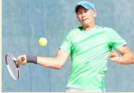
من لقاء تركمانستان وعمان

يسدل الستار اليوم الجمعة على منافسات دور المجموعات، حيث ستقام 3 مباريات، وستلعب البحرين مبارياتها الأخيرة في المجموعة الأولى أمام غوام، وستلعب العراق مباراة مصيرية أمام منغوليا في المجموعة الثانية، فيما ستلتقي اليمن مع غيرقيزستان في المجموعة الثالثة، وستقام جميع المباريات على ملاعب الاتحاد البحريني للتنس في الساعة 9 صباحاً.