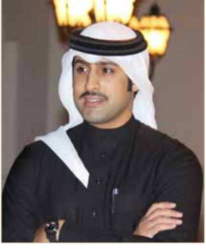
الشيخ دعيج بن عيسى

لاستدامة تطوير وتنمية القطاع الزراعي في مملكة البحرين وإبراز السمات الجمالية للمملكة واهتمامها بالزراعة كإرث تاريخي على مر الأزمنة، والسعي نحو زيادة وتوسعة الرقعة الخضراء.. ناهيك عن توافرها وانسجامها مع الهدف الثالث عشر والخامس عشر من أهداف التنمية المستدامة.