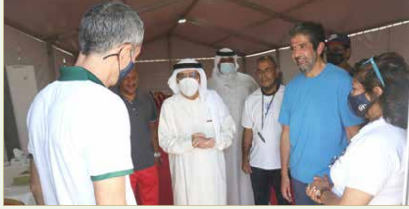
سموه متحدثاً مع الحكم العام لبطولة كأس ديفيز وممثل الاتحاد الدولي