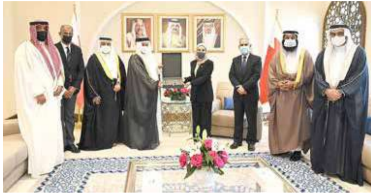
زينل تتسلم التقرير

وفي لقاء آخر، سلم رئيس ديوان الرقابة المالية والإدارية، رئيس مجلس الشورى علي الصالح، تقرير ديوان الرقابة المالية والإدارية السنوي الثامن عشر. وأبدى الشيخ أحمد خلال لقائه الصالح أمس، تقديره للدور الكبير الذي يقوم به رئيس وأعضاء مجلس الشورى في المسيرة التنموية الشاملة التي يقودها جلالة الملك.