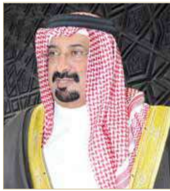
أحمد بن علي

خليفة، التوفيق لممثل المملكة فريق المحرق في مشواره القادم عبر المباراة النهائية، معرباً عن خالص الأمنيات للفريق بالتوفيق والتتويج بكأس البطولة، وإضافة إنجاز جديد لكرة القدم البحرينية يعكس رقيها وتطورها ومكانتها الرائدة.