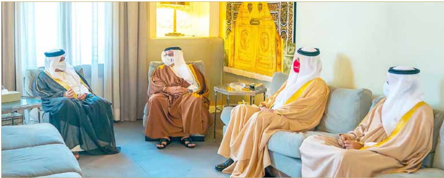
نائب جلالة الملك ولي العهد يستقبل رئيس ديوان الرقابة المالية والإدارية

من جلالة الملك يواصل تحقيق أهدافه والتوسع في تقديم خدماته الرقابية كالتدقيق الاستقصائي، والتحول الرقمي والاستخدام الفعال للتكنولوجيا، منوهاً بالمتابعة المستمرة من صاحب السمو الملكي نائب جلالة الملك ولي العهد وتوجيهاته لمتابعة تنفيذ التوصيات والملاحظات الواردة في تقارير الديوان من قبل الجهات المشمولة بالرقابة. وأوضح أن أعمال الرقابة التي أنجزها الديوان شملت مختلف القطاعات الاقتصادية والاجتماعية والخدمية والصحية والبيئية وغيرها، وتركزت على الجوانب المالية وعلى رفع كفاءة الأداء وأوجه التطوير، كما فقل الديوان مجال التدقيق على نظم المعلومات في الجهات المشمولة برقابته؛ وذلك نظراً لتوسع عمليات التحول الرقمي في مختلف الجهات الحكومية، كما جرى تنفيذ عدد من المهام الرقابية على الموضوعات ذات الأهمية في ظل مستجدات جائحة فيروس كورونا.