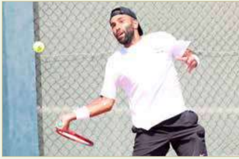
من لقاء إيران وكمبوديا