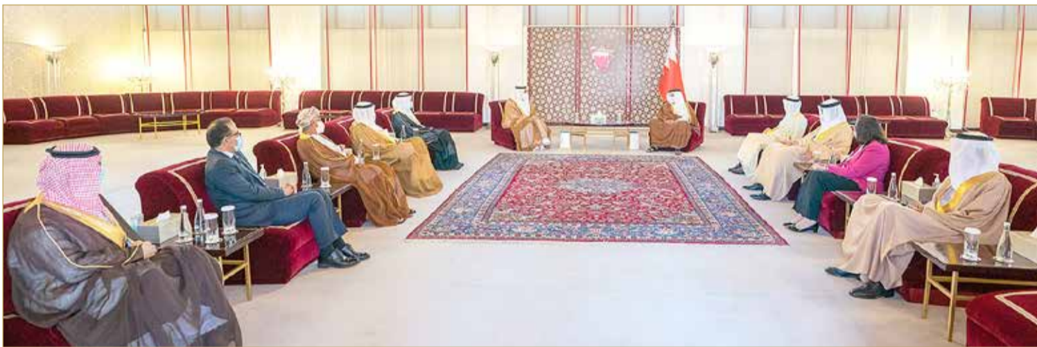
سمو نائب جلالة الملك ولي العهد يستقبل وزراء الصحة بدول مجلس التعاون

مملكة البحرين، حيث رحب سموه بالجميع، وأعرب عن تمنياته لهم التوفيق والنجاح وأن تكون مخرجات الاجتماعات معززة للتعاون الصحي بين دول المجلس بما يحقق الأهداف المشتركة، مشيداً إلى دور مجلس الصحة بدول المجلس في متابعة الخطط والبرامج الصحية التي تهدف إلى مواصلة الحفاظ على صحة وسلامة المواطنين والمقيمين بالدول وفق التطلعات المنشودة. من جهتهم، أعرب وزراء الصحة بدول مجلس التعاون عن شكرهم وتقديرهم لصاحب السمو الملكي نائب جلالة الملك ولي العهد على ما أيداه سموه من حرص على مواصلة تعزيز التعاون الخليجي في المجالات الصحية، وعلى ما وفّرت مملكة البحرين من أسباب النجاح للمؤتمر العام الرابع والثمانين لمجلس الصحة بدول مجلس التعاون.