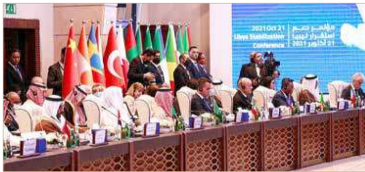
شهد المؤتمر مشاركة مسؤولين عرب ودوليين بارزين

الليببيين". وأضاف أن "جهود الدول الشقيقة والصديقة أسهمت في وقف الحرب" في ليبيا، مضيقاً: "ندعم المفوضية العليا للانتخابات لإجراء الاستحقاقات في موعدها.. وعلى جميع الليبيين احترام نتائج الانتخابات المرتقبة".