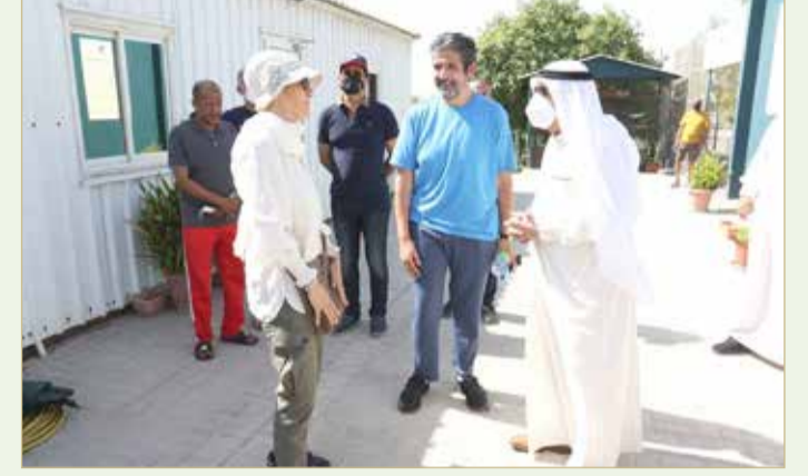
سمو نائب رئيس مجلس الوزراء في حديث مع رئيسة الاتحاد السعودي للتنس

صارتهم للمجموعة بفوزهم على كمبوديا شريكهم السابق في الصدارة بنتيجة 3/0.