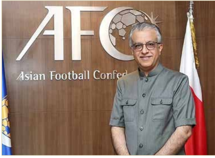
سلمان بن إبراهيم

القارة للعديد من مسابقات كأس العالم للرجال والسيدات خلال السنوات الخمس الماضية، تأكيداً لمتانة البنية التحتية وارتفاع نسبة النجاح الجماهيري والاقتصادي والإبهار في التنظيم، وهو ما عزز مكانة كرة القدم الآسيوية بشكل غير مسبوق. وأكد سلمان بن إبراهيم أن الاتحاد الآسيوي لكرة القدم يضع جميع إمكاناته إلى جانب الاتحاد الإماراتي لكرة القدم لدعم استمرار الإرث الناجح في مثل تلك المناسبات، متمنياً النجاح والتوفيق لجميع فريق العمل في إخراج الحدث العالمي المتميز بأبهى صورة ممكنة.