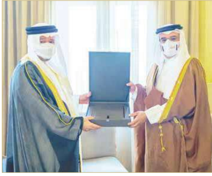
نائب جلالة الملك ولي العهد يتسلم تقرير ديوان الرقابة المالية والإدارية

أكد نائب جلالة الملك ولي العهد صاحب السمو الملكي الأمير سلمان بن حمد آل خليفة أهمية تعزيز المحاسبة والمسؤولية باعتبارهما من ثوابت ومرتكزات العمل الحكومي بما يساهم في مواصلة تحقيق أهداف المسيرة التنموية الشاملة بقيادة عاهل البلاد صاحب الجلالة الملك حمد بن عيسى آل خليفة. جاء ذلك لدى لقاء سموه في قصر الرفاع أمس، رئيس ديوان الرقابة المالية والإدارية الشيخ أحمد بن محمد آل خليفة، حيث رفع إلى سموه تقرير ديوان الرقابة السنوي الثامن عشر للسنة المهنية 2020 - 2021. (02)