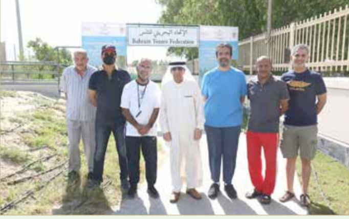
رئيس وأعضاء مجلس إدارة الاتحاد للتنس في استقبال سمو نائب رئيس مجلس الوزراء