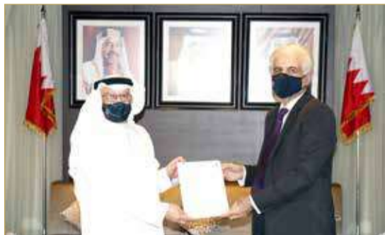
توقيع الاتفاقية مع مجموعة الذكاء الاصطناعي