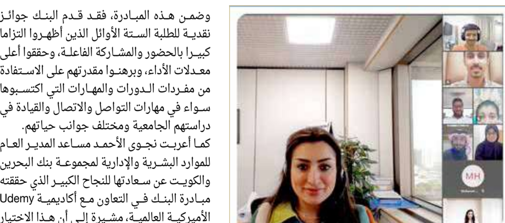
جانب من حفل التخرج

على صعيد المعارف النظرية والتطبيقات العملية التي تقودهم نحو توجهات سوق العمل، وساعدتهم على اتخاذ القرار الأكثر صوابية حول مستقبلهم المهني، والذي يساهم بلا شك في زيادة نفعهم لأنفسهم ولمجتمعاتهم ووطنهم.