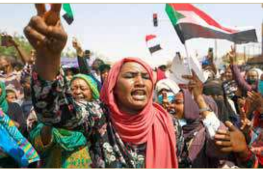
من تظاهرات السودان

إبطاء وتكوين المجلس التشريعي "البرلمان". وتأتي المسيرات استجابةً للدعوة التي أطلقها تجمع يضم أكثر من 200 كيان من قوى الثورة، وفي ظل انقسام كبير في الشارع السوداني بين مجموعتين إحداهما - وهي الأكبر - مساندة للتحويل المدني، وأخرى محدودة جها من أحزاب وعناصر موالية للإخوان وعدد من الحركات المسلحة التي تسعى بتفويض الجيش لاستلام السلطة وتعارض خطوات تفكيك نظام الإخوان وتطالب بإعادتهم للمشهد السياسي مجدداً.