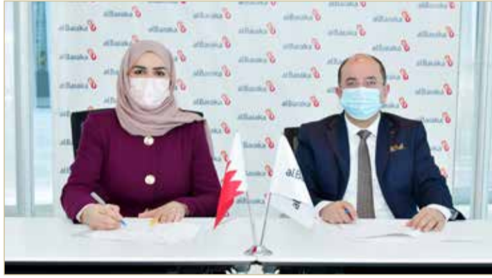
إثناء توقيع الاتفاقية

أعلن بنك البركة الإسلامي، إحدى المؤسسات المالية البحرينية الرائدة في مجال المصرفية الإسلامية، عن توقيع اتفاقية تعاون مشترك مع الجامعة الخليجية، تُعنى بتقديم التمويل للطلبة الراغبين بالالتحاق بالجامعة.