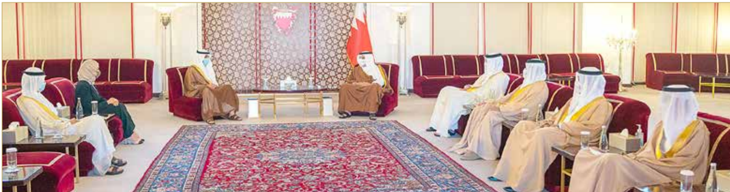
نائب جلالة الملك ولي العهد يستقبل رئيس مجلس الأمة الكويتي

سموه برئيس مجلس الأمة الكويتي، مشيداً إلى أهمية مواصلة التعاون والتنسيق المشترك لتبادل أفضل الممارسات والخبرات بين البلدين والشعبين الشقيقين على الأصعدة كافة. من جهته، أعرب رئيس مجلس الأمة بدولة الكويت الشقيقة عن شكره وتقديره لصاحب السمو الملكي نائب جلالة الملك ولي العهد على ما يبديه سموه من حرص دائم على دعم وتعزيز العلاقات الأخوية التاريخية التي تربط بين مملكة البحرين ودولة الكويت في مختلف المجالات.