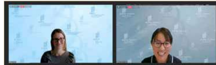
جانب من المشاركة في الفعالية