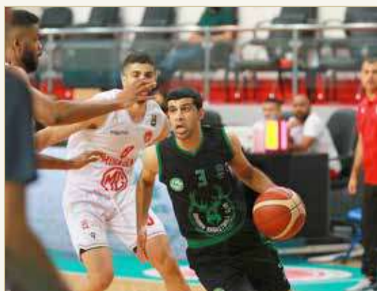
لقاء البحرين والمحرق