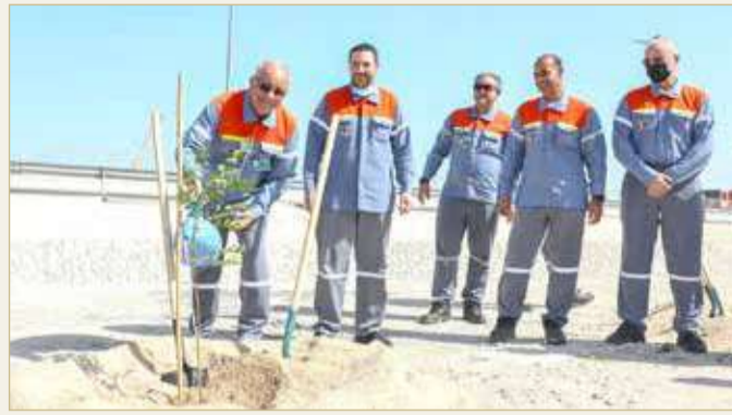
جانب من الحملة