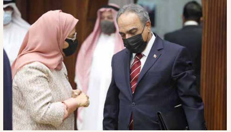
وزير الأشغال والشورى فاطمة الكوهجي

البلاد قال وزير الأشغال وشؤون البلديات والتخطيط العمراني عصام خلف إن كلمة التخصيص التي وردت في المشروع لا ترد للأملك الخاصة، وإنما للأراضي الحكومية، مضيفاً أن "استملاك أي أرض يجب أن يكون وفقاً لقرار الاستملاك والتعويض وبالتالي يمكن تخصيصها لسواحل أو أي منفعة عامة". وزاد "المخطط الاستراتيجي لمملكة البحرين ينص على تخصيص 50% من الواجبات البحرية للعامة، وهو ما تقوم به الحكومة من خلال المشروعات الحكومية التي منها ساحل البسيتين، المرحلة الأولى من ساحل المعامير وتوبلي، ممشى سترة، وأيضا تنفيذ الواجبات البحرية في المنامة، ونحن نقوم بالتنفيذ حالياً على مراحل".