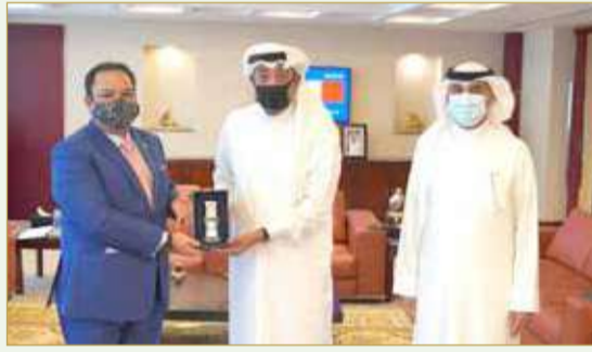
ناس مستقبلاً سفير ماليزيا لدى البحرين

ومن جهة أخرى، رحب رئيس الغرفة بكل ما يدفع نحو تنمية العلاقات الاقتصادية البحرينية الماليزية، وجميع الخطوات التي تستهدف تطوير علاقات التعاون بين أصحاب الأعمال والمؤسسات والشركات في البلدين، مشدداً على أهمية تهيئة المناخ الملائم للتواصل بين أصحاب الأعمال وفتح آفاق جديدة لقطاعات التجارة والأعمال والاستثمار في البلدين الصديقين، وتشجيع إقامة شركات ومشروعات مشتركة بين قطاعات الأعمال في البلدين. ومن جانبه، قال السفير شازريل بن زاهيران “تطلع باستمرار إلى تنمية العلاقات الاقتصادية بين البلدين بفضل جهود حكومتي البلدين وبفضل مبادرات أصحاب الأعمال والقطاع الخاص في ماليزيا والبحرين.”