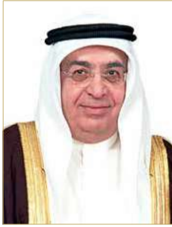
سمو الشيخ محمد بن مبارك

هذا وتعد مواصلة تنظيم التميز للحكومة الإلكترونية تأكيداً لالتزام مملكة البحرين بالمشي قدمًا في مبادرات الابتكار والريادة في قطاع تقنية المعلومات والاتصالات الذي يشهد نموًا كبيرًا بفضل تسارع التطورات التقنية التي هدفت إلى تلبية احتياجات الأفراد والمؤسسات ولا سيما خلال جائحة "كوفيد 19"، والتي سرعت من خطط الحكومات للتحول الرقمي في جميع أنحاء العالم، كما سلطت الضوء في مملكة البحرين على أهمية مواصلة السير في هذا الطريق الذي حددته حتى قبل انتشار الجائحة، حيث حفزت المجتمع بأكمله على ابتكار المبادرات الرائدة التي يمكن الوصول إليها من خلال القنوات الرقمية، وتقديم منتجات وخدمات مبتكرة تساعد على دعم البنية الوطنية التحتية.