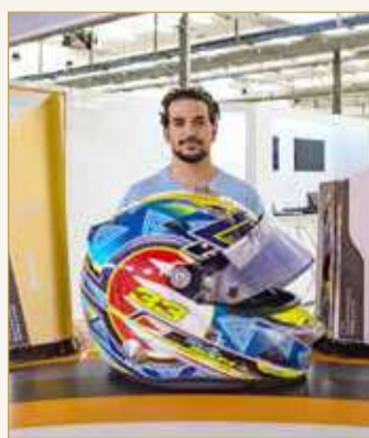
سمو الشيخ عيسى بن عبدالله

عيسى بن عبدالله أبدأ ارتياحه الكبير للنتيجة المتميزة