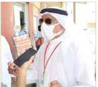
الظاعن متحددا لـ "البلاد"

وأكد أهمية أن يتحمل أصحاب المحلات مسؤولية الرقابة والإشراف عليها، إلى جانب أهمية وعي الناس في الحد من المخالفات عبر تجنب التعامل مع المحلات التي تقصر في الالتزام بالإجراءات والقوانين.