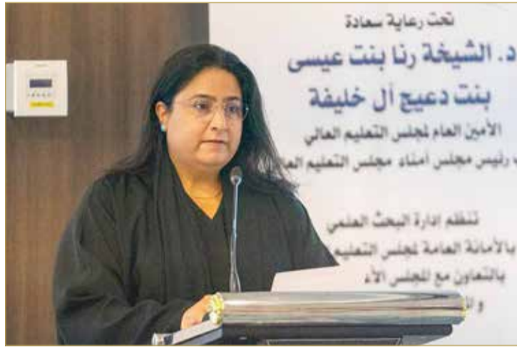
افتتاح البرنامج التدريبي بشأن البحوث والمشروعات البيئية

برعاية الأمين العام لمجلس التعليم العالي نائب رئيس مجلس أمناء مجلس التعليم العالي الشبيخة رنا بنت عيسى بن دعيج آل خليفة، وبحضور سفير المملكة المتحدة لدى مملكة البحرين رودي دراموند، ورؤساء مؤسسات التعليم العالي بمملكة البحرين، افتتح البرنامج التدريبي لمشروع بحوث “أبطال المناخ“ لطلبة البكالوريوس بمؤسسات التعليم العالي الحكومية والخاصة في المملكة، وذلك بالشراكة مع المجلس الثقافي البريطاني؛ بهدف تعزيز القدرات البحثية للطلبة بما يساهم في معالجة التحديات والمشكلات البيئية والمناخية في مملكة البحرين.