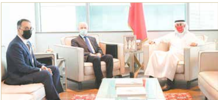
الوزير الزباني مستقبلاً السفير الروسي

اجتمع وزير الصناعة والتجارة والسياحة زايد الزباني بسفير جمهورية روسيا الاتحادية لدى مملكة البحرين إيغور كريمنوف؛ لاستعراض آخر مستجدات التحضير للاجتماع الثالث للهيئة الحكومية البحرينية الروسية للتعاون التجاري الاقتصادي والعلمي والتقني. وفي هذا السياق، أكد الوزير اهتمام حكومة مملكة البحرين وحرصها الدائم على تطوير علاقاتها بجميع الدول الشقيقة والصديقة، لافتاً إلى أهمية الزيارات المتبادلة والفعاليات الاقتصادية المشتركة في تعزيز العلاقات الثنائية والارتقاء بها إلى مستويات متقدمة، مشيراً في هذا الصدد إلى البيئة الاستثمارية الصديقة والمرحبة في مملكة البحرين والميزات