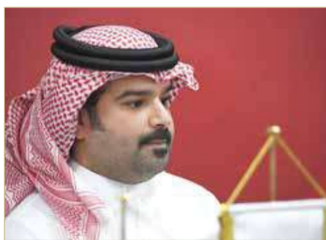
سمو الشيخ خليفة بن علي

وأشاد سمو الشيخ خليفة بن علي بن عيسى آل خليفة بتواجد نخبة من المحاضرين البحرينيين في الدورة، تحت إشراف محاضرين دوليين، مؤكداً أنهم من خبرة الكفاءات الفنية الذين سينقلون خبراتهم التراكمية للمشاركين بما يعكس إيجاباً عليهم. ويشارك في الدورة 20 دارساً.