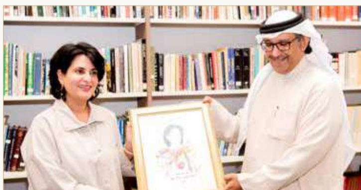
الشاعر طلال المالود