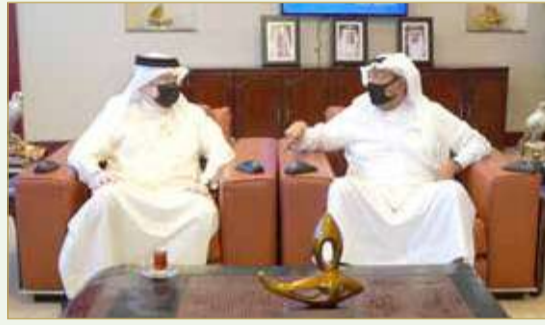
رئيس الغرفة ملتقياً السفير البحريني لدى السودان

العلاقات التجارية والاقتصادية والسياحية وتطويرها لما يخدم مصالح البلدين الشقيقين ورعاية مصالح مواطني مملكة البحرين في جمهورية السودان، مشيداً بجهود غرفة تجارة وصناعة البحرين وحرصها على تطوير التعاون المشترك بين الدول الصديقة والسعي نحو الارتقاء بالاستثمارات والتبادل التجاري وتسويق البحرين، مشيراً إلى فرص استثمارية مميزة في