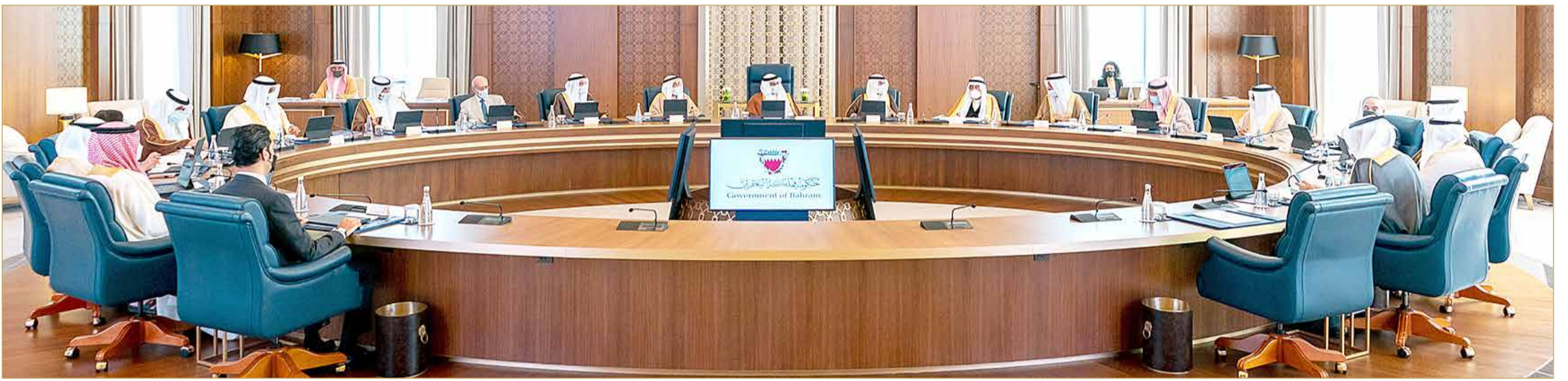
سمو ولي العهد رئيس مجلس الوزراء يترأس جلسة مجلس الوزراء

ترحيب بحريني بإعلان السعودية الحيداء الصفري من الانبعاثات الكربونية في 2060