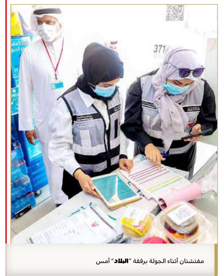
مفتشتان أثناء الجولة برفقة "البلاد" أمس

وأشار إلى أن مفتشي الوزارة يقومون بالتحقق من امتلاك المحلات لترخيص الصحة، إلى جانب تأكيد قصر ممارسة النشاط في المساحة الداخلية للمحل، باستثناء تقديم الطعام بالنسبة للعربات المتنقلة أو المطاعم التي تمتلك جلسات خارجية، فيما يشترط أن تتم أعمال الطبخ والتحضير داخل المطعم.