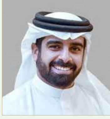
سمو الشيخ سلمان بن محمد

البحرينية الشيخ محمد بن دعيج آل خليفة، عن سعادته بلوغ لاعبة روان السعد هذه المرحلة المتقدمة من بين العدد الهائل من المسجلين وتمثيلها لمواهب اللاعبين البارالمبيين البحرينيين خير تمثيل في هذا المحفل الخليجي المرموق، متمنياً لها كل التوفيق لنيل الجائزة في حفل ختام هذه المسابقة.