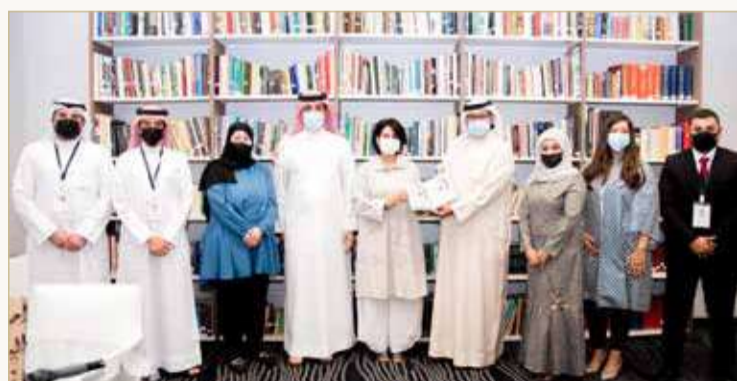
خلال حفل التشيخ

المشهد الثقافي في مملكة البحرين يتسم بالحركة الدؤوبة، والمشاكسة في أحيان كثيرة. البحرين بلد عريق، والثقافة فيه قديمة، وجمالها في جوانبها المتنوعة، وتيارات الثقافة المختلفة، والتي لها جمهورها وأنصارها ومتذوقوها. المهم أن يبقى الاختلاف صحيحاً، ورافداً مستمراً لمزيد من الأنشطة والفعاليات الفاعلة في المشهد الثقافي، ولكل الحق في أن ينهل من أيها شاء.