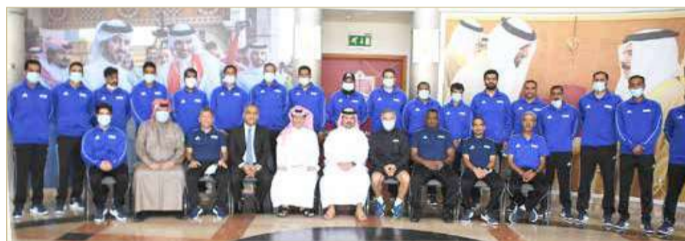
صورة جماعية للدارسين في حفل الافتتاح

والتطوير المستمر للكفاءات الوطنية على المستويات الفنية والإدارية. وأشار سموه إلى أن دورة تطوير الشباب الدولية تشمل مجالات متعددة تتعلق بعمل المدربين على مستوى الشباب وتطويرهم.