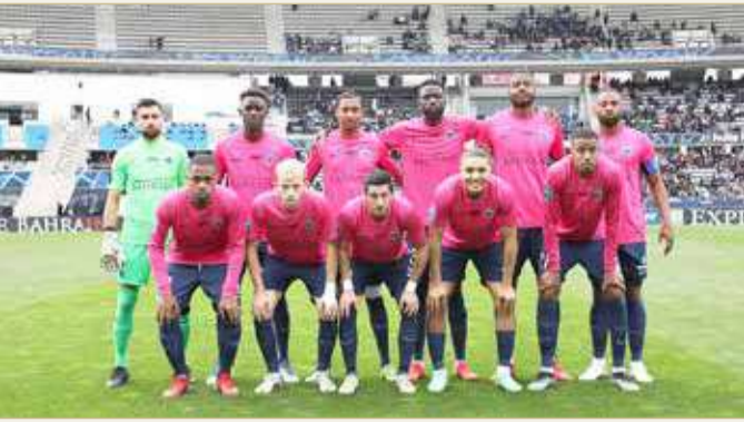
فريق باريس اف سي