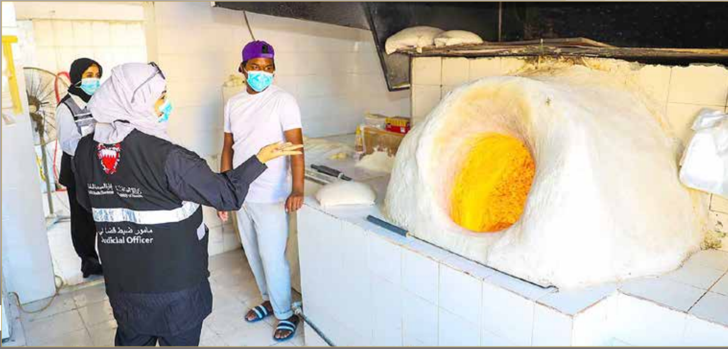
التأكد من التنور وسلامة عجينة الخبز