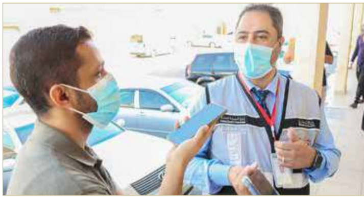
مأمور الضبط القضائي متحددا لـ "البلاد"

ولفت إلى اختلاف الفترة اللازمة لتبديل الزيوت وفقا لجودة الزيت المستخدم، مشيراً إلى أن المطاعم لديها أكثر من مؤشر وطريقة للتحقق من انتهاء صلاحية استخدام الزيت أو حاجته للتنظيف.