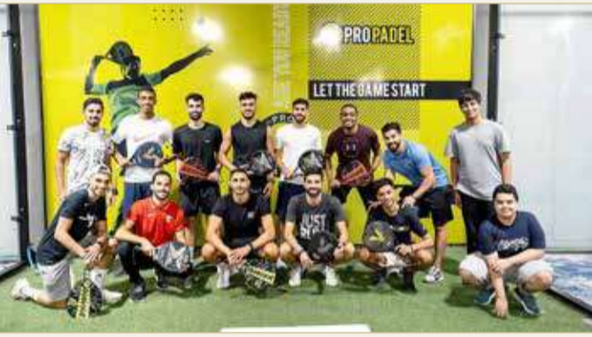
لاعبو المحرق في ملعب البادل