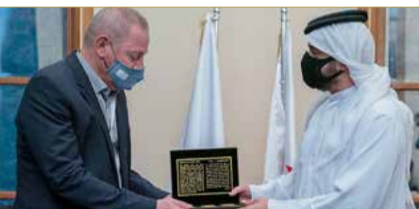
تبادل الدروع التذكارية

كريت - المكتب الإعلامي لسمو الشيخ خالد بن حمد