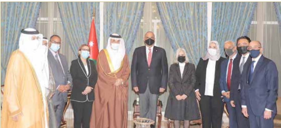
وزير العمل والتنمية الاجتماعية يلتقي رئيس الوزراء الأردني

تعزيز وتنمية العلاقات الأخوية بين البلدين على مختلف الأصعدة، وحرص مملكة البحرين على دعم وتعزيز التعاون مع الدول العربية الشقيقة بجميع المجالات في إطار العمل العربي المشترك. وتم خلال اللقاء استعراض أبرز التحديات التي تواجه العالم