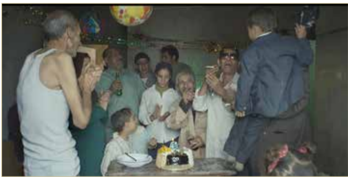
سوداوية بصورة جميلة