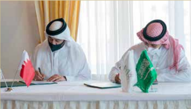
من توقيع الاتفاقية