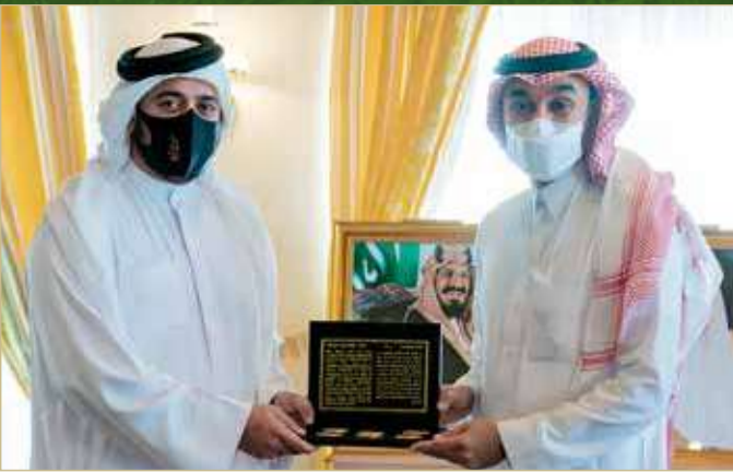
تبادل الدروع التذكارية