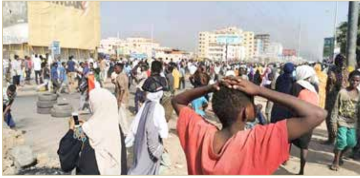
حالة من التوتر تخيم على الشارع السوداني

من جهته، دعا رئيس مفوضية الاتحاد الإفريقي موسى فكي محمد في بيان إلى إطلاق سراح القادة السياسيين في السودان. وأضاف أنه يجب استئناف المحادثات بين الجيش والجناح المدني للحكومة الانتقالية، وفق رويترز.