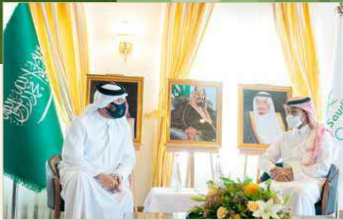
سمو الشيخ خالد بن حمد في لقائه مع رئيس اللجنة الأولمبية السعودية