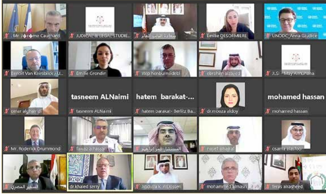
جانب من المشاركين

وذكر في كلمته الافتتاحية، خلال ورشة العمل الإقليمية بشأن آفاق وتحديات التطبيق الفاعل لقانون العدالة الإصلاحية للأطفال وحمايتهم من سوء المعاملة، أن القانون أكد حق الأطفال في جميع مراحل التحقيق والمحاكمة في الاستماع إليهم وتفهم مطالبهم، ومعاملتهم بما يحفظ كرامتهم ويضمن سلامتهم البدنية والنفسية، وحق الطفل في شموله بالحماية والمساعدة الصحية والاجتماعية والقانونية وإعادة التأهيل، على نحو يتفق والمبادئ والمعايير الدولية. ولفت إلى أن من أبرز مظاهر هذا القانون أنه جعل للخبرة الاجتماعية والنفسية والصحية دوراً متوازماً في كل مرحلة وفي كل إجراء، بحيث لا يصدر حكم أو أمر أو يتخذ إجراء ما إلا بناء على دراسة وافية للظروف الاجتماعية والنفسية والشخصية