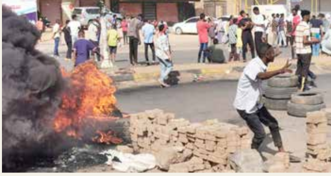
السودان يدخل مرحلة جديدة

كما قرّر البرهان في بيان للشعب "إنهاء تكليف ولايات الولاية وتجميد عمل لجنة إزالة التمكين وإعفاء