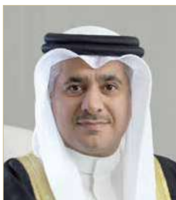
وزير المواصلات والاتصالات

قدرة المطار على استيعاب أحجام أضخم من الشحنات على نحو أكثر كفاءة، وتلبية احتياجات عملاء الشحن السريع بشكل أفضل وخلق العديد من الفرص النوعية للشباب البحريني. من جانبه، صرح الرئيس الإقليمي لشركة فيديكس إكسبريس لمنطقة الشرق الأوسط وشبه القارة الهندية وإفريقيا جيمس ميوز ”تعتبر منطقة دول مجلس التعاون الخليجي مهمة لشركة فيديكس إكسبريس، حيث تشهد هذه المنطقة تعاونًا بين القطاعين العام والخاص يعزز