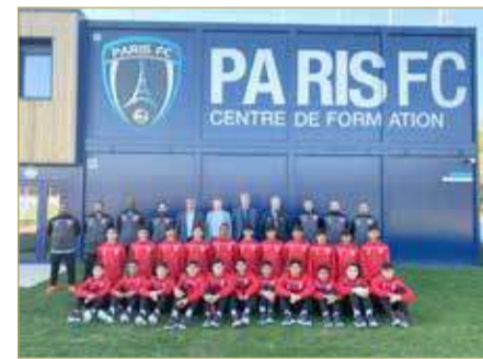
منتخب الناشئين بالمعسكر التدريبي في "باريس اف سي"

رحب نادي باريس أف سي الفرنسي بوفد منتخبنا الوطني للناشئين لكرة القدم الذي سيخوض معسكراً تدريبياً بضيافة النادي الفرنسي خلال الفترة من 24 أكتوبر الحالي حتى 1 نوفمبر المقبل. وفي هذا الإطار، قال رئيس النادي بير فيراتشي "يسعدنا أن نرحب بهذا الوفد من الشباب البحريني في منشأتنا. تأتي هذه الزيارة في إطار الشراكة بين مملكة البحرين وباريس. هذا التبادل الثقافي والرياضي سيسلط الضوء على نادينا وكذلك على مدينة باريس ويؤكد رغبتنا في السماح للفتيات والفتيان الصغار في هذا البلد بالاستفادة من خبرة النادي". وقال النادي في بيان إنه سيتم استضافة البحرين في مركز تدريب النادي، وسيتم تعريفهم على هيكل النادي والعديد من الجوانب الفنية. وخلال الأسبوع، سيدرب اللاعبون البحرينيون في مرافق النادي ويلعبون مبارياتين ضد فريق باريس لكرة القدم تحت 17 سنة. كما سيتبادلون الآراء مع الموظفين ويتابعون جلسات التدريب. وإلى جانب الجانب الرياضي، ستسمح هذه الرحلة للبحرينيين باكتشاف تراث الأراضي الفرنسية خصوصا مدينة باريس من خلال زيارة ممتعة وثقافية للعاصمة.