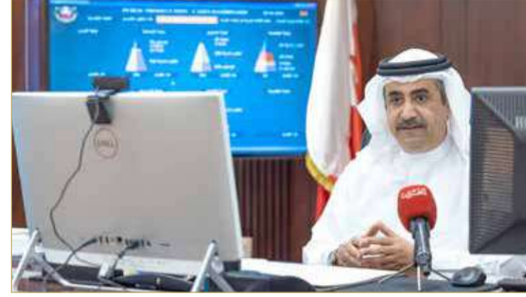
النائب العام متحدثاً بالفعالية

قال النائب العام علي البوعيين إن قانون العدالة الإصلاحية للأطفال وحمايتهم من سوء المعاملة قدم نموذجاً متميزاً في معاملة الطفل وحمايته من سوء المعاملة، بما رسمه من قواعد الاختصاص القضائي، وبجعله الأولوية لمصالح الطفل الفضلى في جميع الأحكام والقرارات والإجراءات المتعلقة به، فضلاً عن توسيع دائرة اختصاص مركز حماية الطفل بما يكفل الحماية المثلى للطفل من سوء المعاملة.