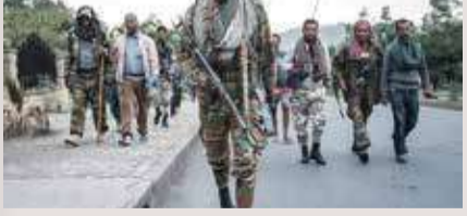
متمردون مولون لجهة تحرير شعب تيغراي

أعلن قائد جيش تحرير أوروغو المتحالف مع جبهة تحرير تيغراي، أن قواته بالقرب من العاصمة الأثيوبية أديس أبابا وتستعد لهجوم آخر، متوقفاً أن تنتهي الحرب "قريباً جداً" بانتصارهم. وحذر