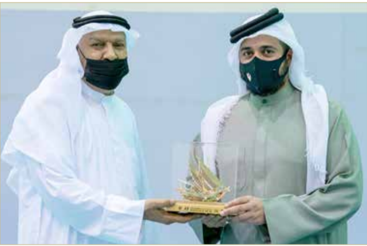
سمو الشيخ خالد بن حمد يتسلم هدية تذكارية من رئيس نادي داركليب