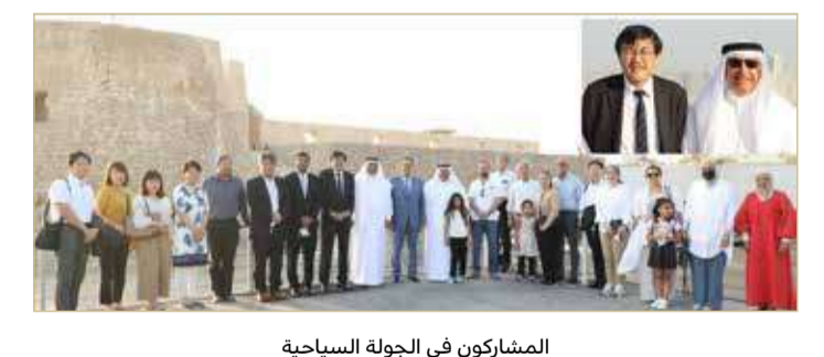
المشاركين في الجولة السياحية

تنظيم هذه الندوة التي تأتي في وقت تجلت فيه آثار جائحة كورونا وما بعد الجائحة، حيث إن المؤسسات الصغيرة والمتوسطة عانت خلال هذه الأزمة وبعدها من إقفال أبواب بعض المؤسسات والمحلات التجارية وبلا رجعة وذلك بسبب عدم الاستعداد المسبق لهذه الجائحة التي فاجأت الجميع. ومن هنا يأتي دور التعاون والتكاتف بين مختلف المؤسسات والجهات الحكومية وغير الحكومية التابعة للقطاع الخاص التي أثبتت فعاليتها خلال الأزمة حيث عمل ذلك على ضمان استمرارية الأعمال بالرغم من تبعات هذه الأزمة الخائفة.