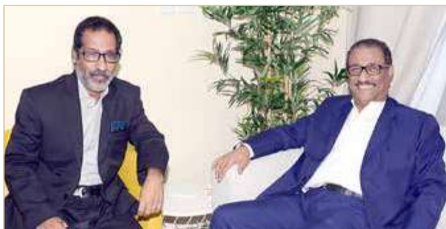
"البلاد" في لقاء جانبي مع المخرج بسام الذوايدي