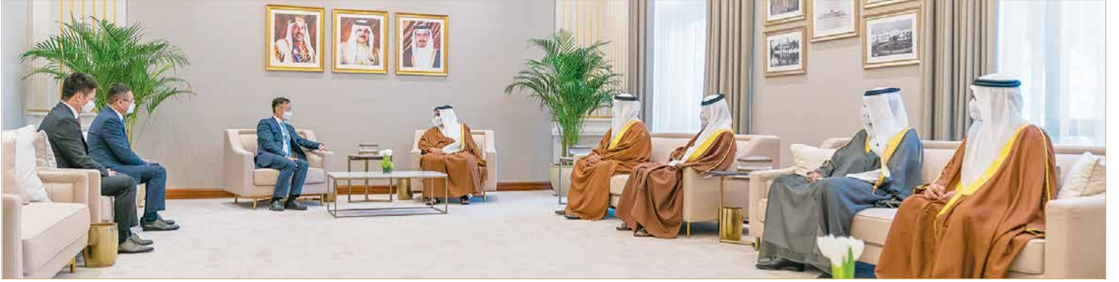
سمو ولي العهد رئيس مجلس الوزراء يستقبل عضو مجلس الإشراف ورئيس شركة هواوي في الشرق الأوسط وشمال أفريقيا