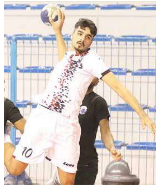
لقاء الاتفاق وسماهيج

بخّر فريق الاتفاق أحلام نظيره سماهيج بعدما حول تأخره بالشوط الأول إلى فوز مستحق وجدير بالشوط الثاني (33/35) في المباراة التي جمعتهم مساء الاثنين في ختام الجولة الثامنة من دوري خالد بن حمد لكرة اليد.