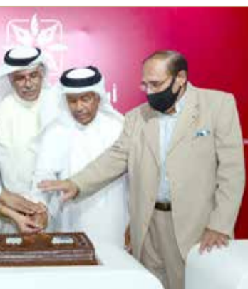
جانب آخر من حفل التدشين