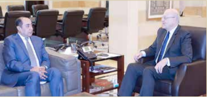
حسام زكي يلتقي رئيس الحكومة اللبنانية نجيب ميقاتي

إلا أن زكي ألمح في الوقت عينه إلى إمكان التوصل إلى مدخل