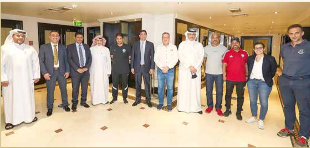
صورة جماعية للمجتمعين

أو فريقين من خارج منطقة غرب آسيا للمشاركة في البطولة الثانية، وبحيث يعتمد ذلك على عدد الفرق المشاركة في البطولة من الإقليم. كما شهد الاجتماع الذي حضره المناعي مناقشة تنظيم بطولة خاصة لأندية كرة القدم الشاطئية لاتحادات غرب آسيا، واقترح المجتمعون الربيع الأخير من العام المقبل 2022 موعداً لإقامتها، واستوضح أمين عام اتحاد غرب آسيا في