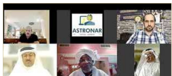
جانب من الندوة الافتراضية