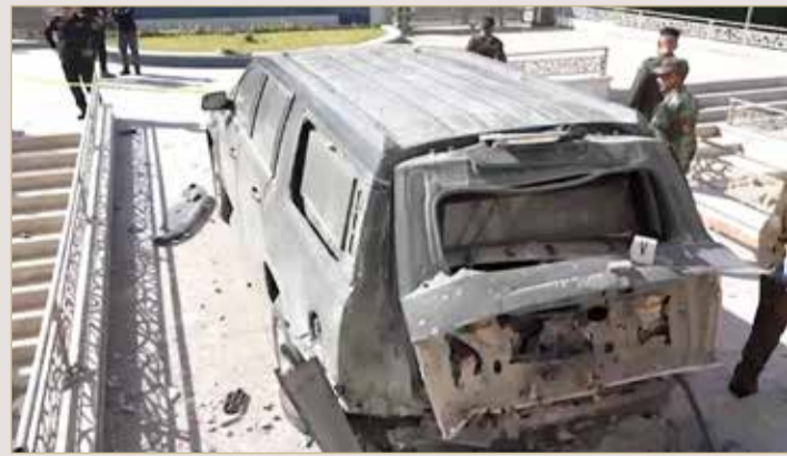
آثار محاولة استهداف رئيس الوزراء العراقي

مسؤولون: عملاء إيران وراء محاولة اغتيال الكاظمي