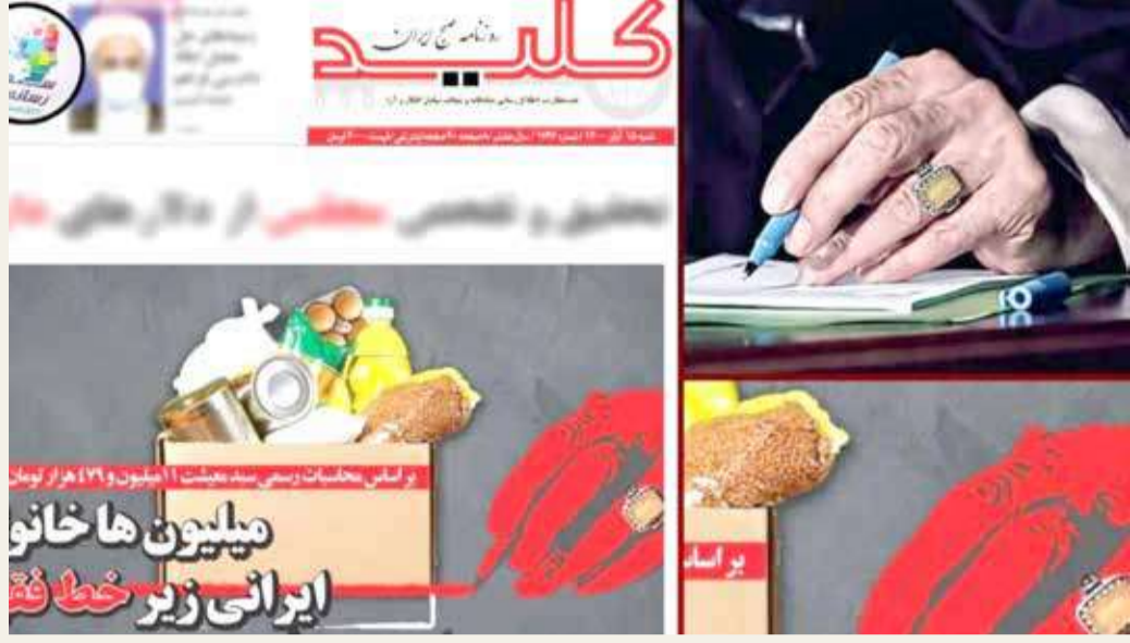
حظر صحيفة يومية نشرت صورة يد خامنئي