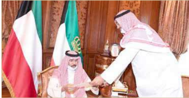
الاستقالة جرى تقديمها إلى أمير دولة الكويت أمس الاثنين

أفادت وسائل إعلام كويتية عدة، أمس الاثنين، عن تقديم الحكومة استقالتهام. وقال مصدر حكومي إن رئيس مجلس الوزراء الكويتي، الشيخ صباح خالد الحمد الصباح، قدم استقالته إلى أمير دولة الكويت، الشيخ نواف الأحمد الجابر الصباح. كما أشار إلى أن اجتماع مجلس الوزراء انتهى بعد أن قدم الوزراء استقالتهام، تمهيداً لرفعها إلى القيادة السياسية. من جهته أعلن رئيس مجلس الأمة مرزوق الغانم صدور المرسومين الأميريين القاضيين بمنح العفو عن بعض الكويتيين المحكومين في قضايا سابقة. يذكر أن الحكومة كانت أقرت مساء الأحد مشروعات مراسيم العفو الأميري بحق عدد من الكويتيين ممن صدرت عليهم أحكام في قضايا سابقة. ويطوى مرسوم العفو الأميري الذي وعد به أمير الكويت صفحة الخلاف