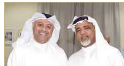
جانب آخر من الحضور