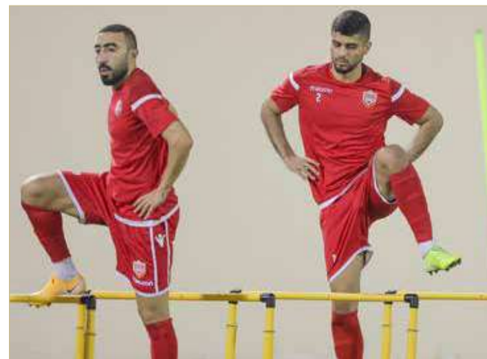
من تدريبات المنتخب

وسيدشن المنتخب بدءاً من يوم الثلاثاء 9 نوفمبر الجاري بتدريبات على فترتين صباحية ومسائية خلال بعض الأيام، على أن ينتظم في معسكر بأحد فنادق العاصمة خلال الأيام القليلة المقبلة.