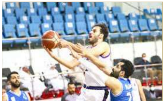
لقاء الاتحاد ومدينة عيسى

واصل فريق المنامة انتصاراته بدوري زين لكرة السلة وهذه المرة تفوق على النويدرات بنتيجة (63/97) في المباراة التي جمعتهم مساء الاثنين ضمن منافسات الجولة التاسعة من دوري زين لكرة السلة. وجاءت نتائج الأشواط الأربعة كالآتي: (18/28) المنامة، 12/21 المنامة، 11/23 المنامة، 22/25 المنامة، وبذلك حقق المنامة انتصاره السابع وأصبح رصيده (14 نقطة) متقدماً في سلم الترتيب، فيما مُني النويدرات بخسارته الخامسة وصار رصيده (11 نقطة).