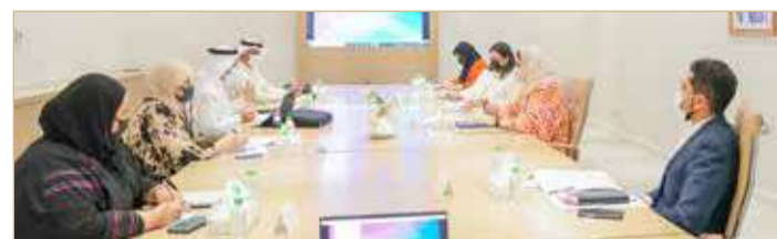
الأعلى للمرأة ومعهد الإدارة العامة يبحثان بناء وتنمية قدرات منتسبي لجان تكافؤ الفرص