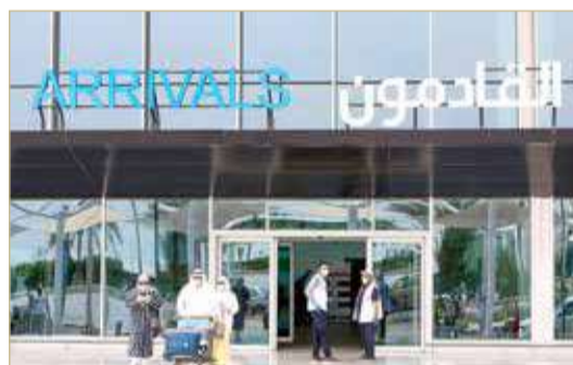
القرار يشمل وقف إصدار الزيارات بانواعها

العودة إلى البلاد"، كما لفت إلى أن "القرار يشمل وقف إصدار الزيارات بأنواعها سواء أكانت عائلية أم سياحية أم تجارية أم حكومية، وكذلك وقف سمات الالتحاق بعائل، إضافة إلى وقف سمات الدخول فيز العمل". ويأتي التشدد الكويتي في منح التأشيرات للبنانيين وسط تقارير نشرتها وسائل إعلام محلية عن قيام الأجهزة الأمنية بالتحقيق مع 16 كويتيًّا يشتبه في تمويلهم "لحزب الله".