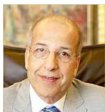
الصدوق عمر الكبير

نتطلع إلى اختتام العام بإشارة قوية بعد أن نجحنا في اجتياز التحديات التي فرضها الوباء على مدى الأشهر الثمانية عشر الماضية إضافة إلى الاستكمال الناجح لعملية الاستحواذ على بنك بلوم مصر.