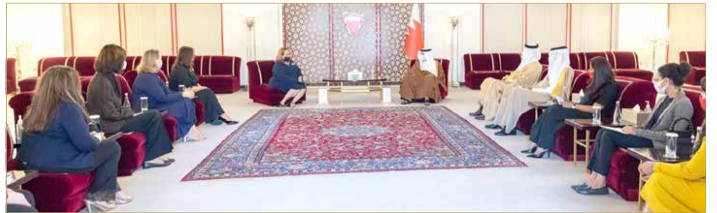
سمو ولي العهد رئيس مجلس الوزراء يستقبل مجلس الادارة الجديد لجمعية النساء الأمريكيات

على فرصة اللقاء، وما حظي به مجلس الإدارة من حفاوة واستقبال، مؤكداً تقديره لكل مضمين حديث سموه خلال اللقاء وثناؤه على أعمال الجمعية والتي ستكون دافعاً لهم لمواصلة العطاء بكل حب واعتزاز حتى الوصول للتطلعات المنشودة، متمنين لمملكة البحرين دوام التقدم والازدهار.