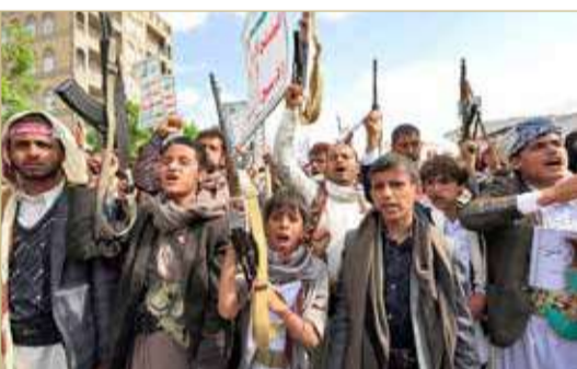
أطفال يحملون السلاح خلال تجمع للحوثيين في صنعاء

المجتمع الدولي للعمل على تصنيف جماعة الحوثي "منظمة إرهابية"، وعلى ملاحقة قياداتها ومحاكمتهم باعتبارهم "مجرمي حرب". وقال وزير الإعلام اليمني إن "الحوثيين استغلوا الأوضاع المعيشية الصعبة للمواطنين جراء ظروف الحرب.. للضغط على الأسر الفقيرة ومساومتها بالمساعدات الغذائية لاستدراج أطفالها، في أكبر عمليات تجنيد للأطفال بتاريخ البشرية".