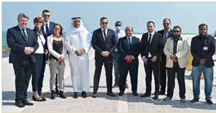
وزير الإسكان يستقبل وفد البرلمان الأوروبي

وفورية للمواطنين والاهتمام بأدق التفاصيل؛ لتوفير سبل الراحة والبيئة المناسبة للقاطنين بالمدن الحديثة. من جانبه، أكد توماس زداجوفسكي رئيس مجموعة أصدقاء البحرين في البرلمان الأوروبي حجم الإنجاز الذي تشهده النهضة الإسكانية بمملكة البحرين من خلال مشروعات تطوير وبناء المدن الجديدة والتي تخدم الآلاف من المواطنين، وتقع ضمن مشروعات حضرية تسهم في تحقيق الرفاه الاجتماعي والاستقرار لمواطنيها، معرباً عن رغبته في نقل تجربة مملكة البحرين الإسكانية بتفاصيلها للدول الأوروبية خصوصاً في شأن حل المشكلة الإسكانية، متمنياً للمملكة مزيداً من التقدم والانجاز.