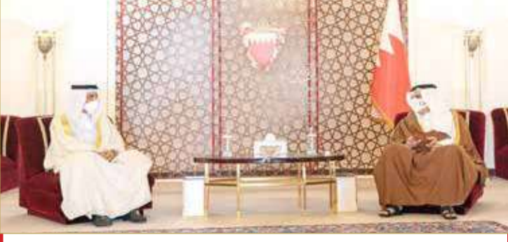
سمو ولي العهد رئيس مجلس الوزراء ملقباً رئيس محكمة التمييز نائب رئيس المجلس الأعلى للقضاء (02)

البطولة وتفوقه على العديد من اللاعبين المشاركين وإحرازه الميدالية الذهبية وتشريف الوطن في المحفل الرياضي الدولي، مشيداً بما تمتلكه المملكة من طاقات ومواهب رياضية قادرة على المنافسة والتفوق في جميع الرياضات واعتلاء منصات التتويج. من جانبه، أعرب اللاعب علي منفرد عن عظيم الشكر وبالغ الامتنان والعرفان إلى المقام السامي لجلالة الملك على اللقطة الكريمة من لدن جلالتة وعلى الرعاية والدعم والتشجيع الذي يحظى به رياضيو المملكة كافة من جلالتة، معاهدًا جلالتة على مواصلة عطاءه لتشريف الوطن في المنافسات المقبلة.