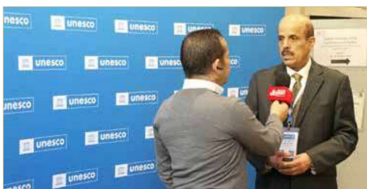
وزير التربية والتعليم في لقاء مع قناة الشرق التلفزيونية

كما أشار الوزير إلى ما قامت به اليونسكو من أعمال على الصعيد العالمي، وذلك بمناسبة احتفالها بمرور 75 عاماً على تأسيسها، إذ بين أنها قامت بدور مهم وبارز في مجال دعم التعليم للجميع، وتقديم العديد من الدراسات وإقامة المؤتمرات، وتوفير الخبراء العالميين في جميع مجالاتها، ما أسهم في الارتقاء بالتعليم والبحث العلمي.