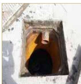
توصيل غير قانوني