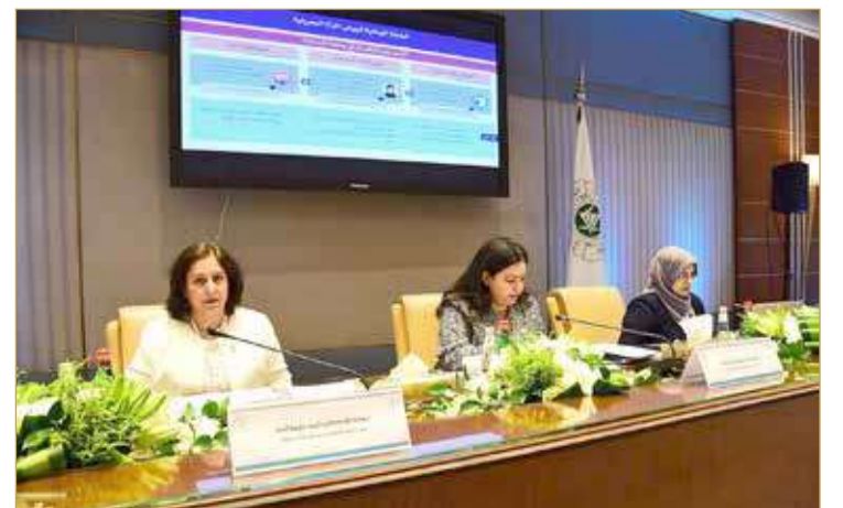
ورشة عمل الخطط والاستراتيجيات لتحقيق التوازن بين الجنسين وآليات تدقيقها ومراقبتها