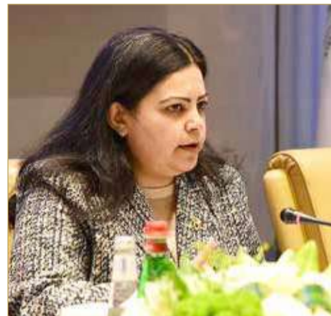
الشيخة دينا بنت راشد

لمحاور وآليات شاملة، ومخرجات النموذج التي تتضمن استراتيجيات وسياسات ونظم داعمة، وأدوات إدارة المعرفة في المجال وبرامج ومبادرات وخدمات مساندة وآليات رصد ومتابعة تحقيق الأثر وقياس العائد. وفتحت إلى تبني وتطبيق منهجية الموازنة المستجيبة لاحتياجات المرأة عبر آلية وطنية وتقييم وقياس مدى تحقق العدالة والتنافسية وتسد الفجوات المرصودة بما يضمن الاستدامة، وتحدثت أيضاً عن مراحل التطور في تبني الموازنات المستجيبة