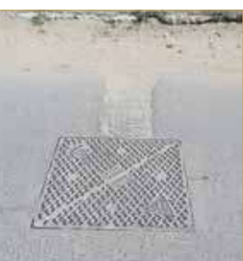
توصيل غير قانوني