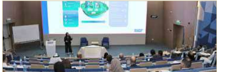
جانب من الدورة التدريبية