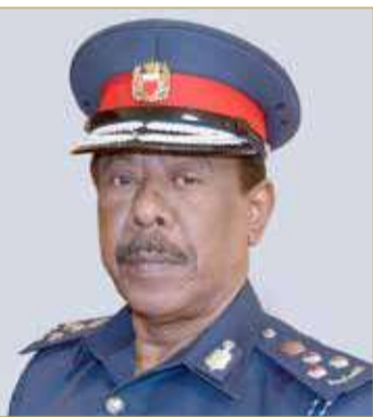
المدير العام للإدارة العامة للدفاع المدني

بوزارة الداخلية محاضرة توعوية عبر تقنية الاتصال المرئي لعدد من مدارس مملكة البحرين تحت عنوان "لا للتدخين". وتضمنت المحاضرة التي قدمها مسؤول