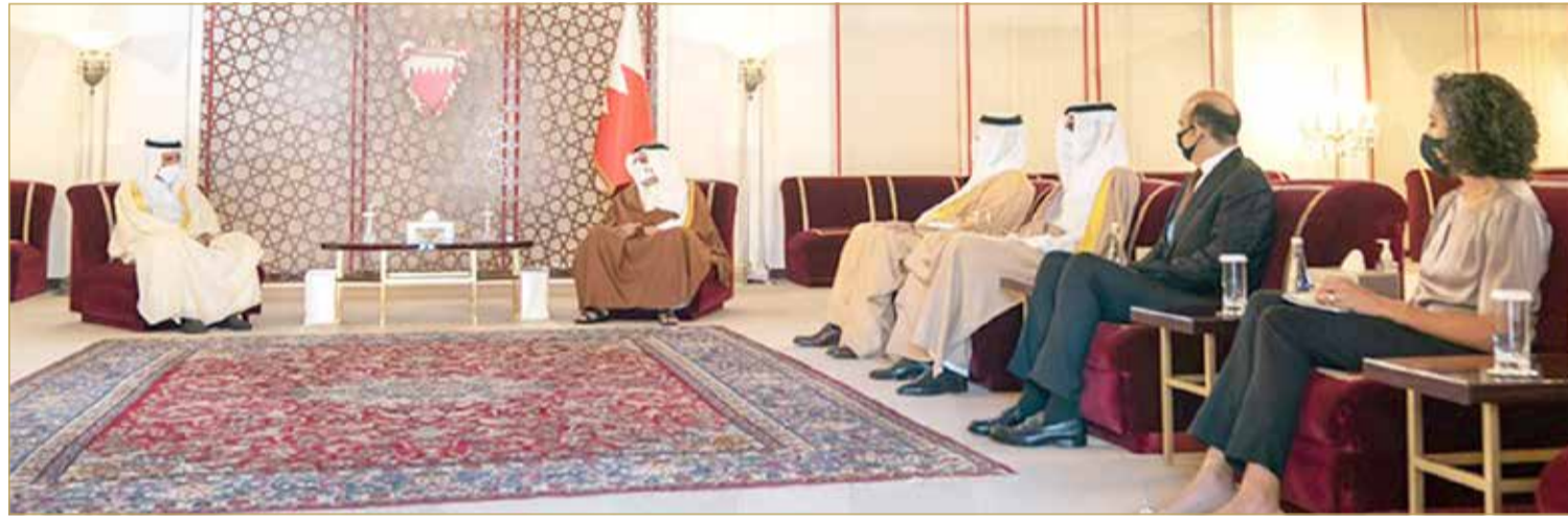
سمو ولي العهد رئيس مجلس الوزراء ملتقياً رئيس محكمة التمييز نائب رئيس المجلس الأعلى للقضاء

من جانبه، أعرب رئيس محكمة التمييز نائب رئيس المجلس الأعلى للقضاء عن شكره وتقديره لصاحب السمو الملكي ولي العهد رئيس مجلس الوزراء على ما يوليه من دعم يسهم في تعزيز الدور الذي يضطلع به المجلس الأعلى للقضاء في تعزيز سيادة القانون وحماية الحقوق والحريات.