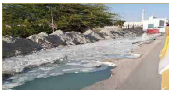
العمل بدون تصريح مما أدى لفيضان المياه المعالجة