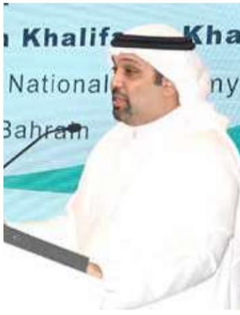
وزير المالية والاقتصاد الوطني

فيروس كورونا يتابع بشكل مستمر تساؤلات الناس ومخاوفهم خلال جائحة فيروس كورونا ويُبشر بالرد عليها سواء عبر وسائل الإعلام المختلف أو عن طريق المؤتمرات الصحافية وغيرها.