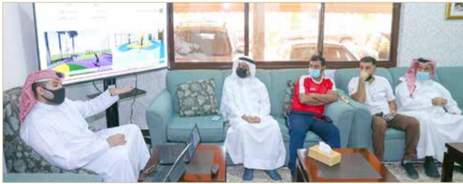
جانب من العرض