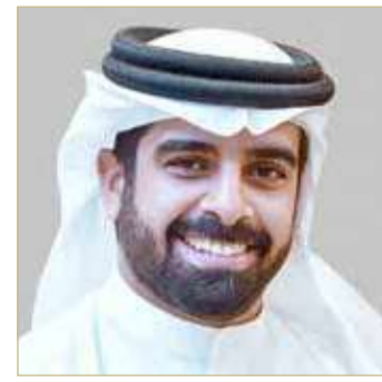
سمو الشيخ سلمان بن محمد

ولي العهد رئيس الوزراء بالقطاع الرياضي، والجهود الكبيرة التي يبذلها سمو الشيخ ناصر بن حمد آل خليفة وسمو الشيخ خالد بن حمد آل خليفة، والتي ساهمت في ظهور الفرق والمنتخبات الوطنية بصورة مشرفة، وتحقيق النتائج المتميزة، والتي تضاف لسجل الرياضة البحرينية الحافل بالإنجازات. وقال سموه "نشيد بالإنجاز الذي حققه اللاعب علي سينا منفردى في عالمية الجوجيتسو، والذي يعكس الاستعدادات القوية التي خاضها اللاعب، مهنتاً سموه رئيس الاتحاد البحريني للجوجيتسو رضا إبراهيم منفردى وجميع أعضاء الاتحاد وأفراد المنتخب الوطني بهذا الإنجاز".