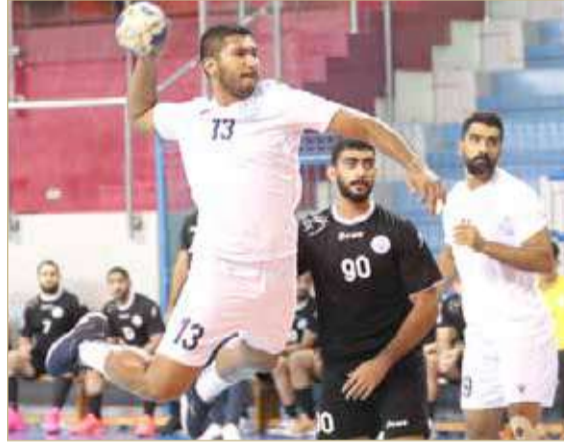
من لقاء باربار والتضامن

واصل فريق النجمة تربعه على عرش ترتيب فرق دوري خالد بن حمد لكرة اليد، بعدما هزم نظيره التضامن بنتيجة (24/36) في المباراة التي جمعتهم مساء الخميس لحساب الجولة التاسعة.