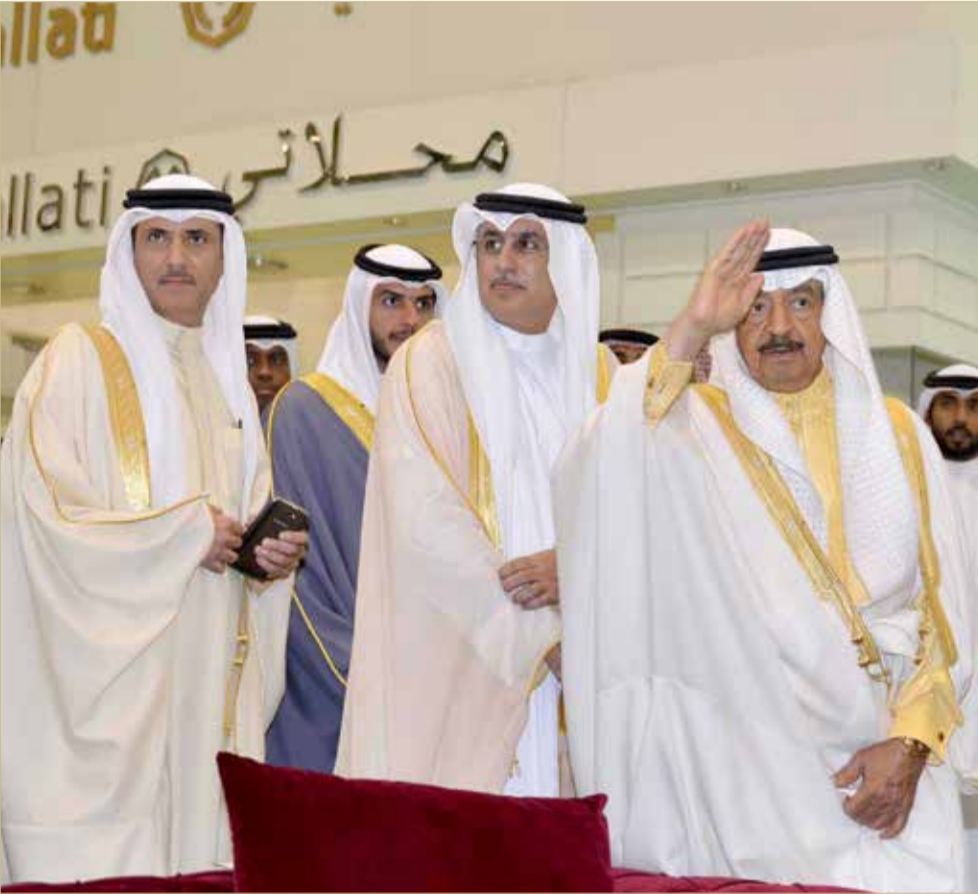
سمو الأمير الراحل ووزير الصناعة والتجارة والسياحة بإحدى الفعاليات