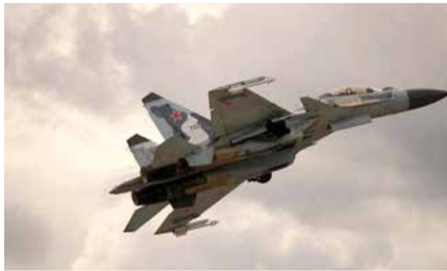
المقاتلة الروسية Su-30 أفلعت لاعتراض طائرة استطلاع بريطانية

وأفادت وزارة الدفاع الروسية سابقا بأن السفن التابعة للقوات البحرية الأمريكية وصلت للمشاركة في المناورات الدولية التي تجريها القيادة العامة للقوات المسلحة الأمريكية في أوروبا بمنطقة البحر الأسود. وأضافت أن المناورات تشارك فيها المدمرة "بورتير" الحاملة للصواريخ الموجهة، وناقلة وسفينة قيادة، وتري الوزارة أن هذه الأعمال تؤدي إلى زعزعة الاستقرار في المنطقة.