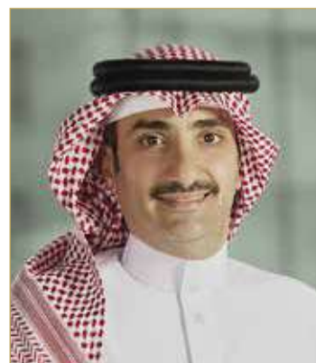
الشيخ عبدالله بن خليفة

في نهاية العام 2020. وتُعزى الزيادة في إجمالي الموجودات إلى استحواذ سيكو خلال هذه الفترة على حصة الغالبية (72.7%) في شركة مسقط المالية الواقع مقرها في السعودية والتي تم استبدال