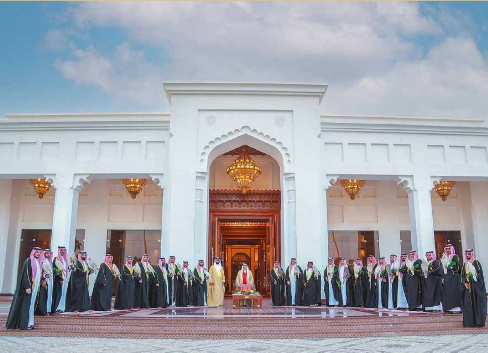
جلالة الملك يستقبل عددا من الصقارين بمناسبة بدء موسم الصيد بالصقور

استقبل عاهل البلاد صاحب الجلالة الملك حمد بن عيسى آل خليفة في قصر الصافية عددا من الصقارين ومعهم الصقور التابعة لجلالته؛ وذلك بمناسبة بدء موسم الصيد بالصقور.