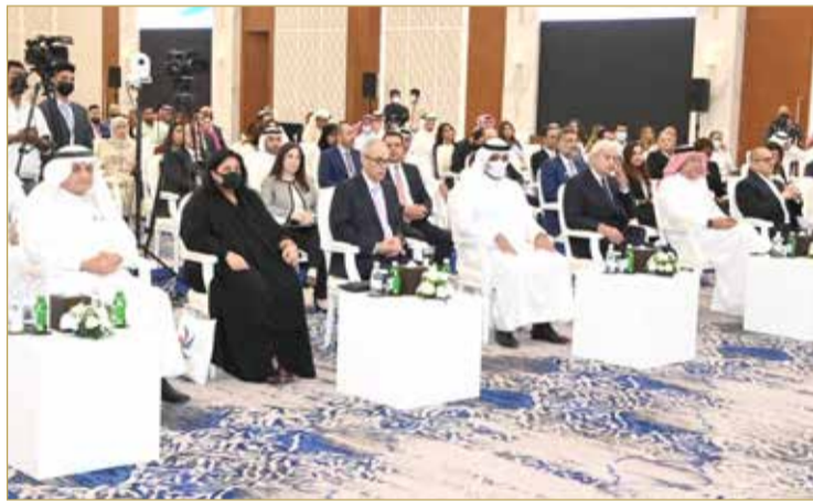
جانب من الحضور في المؤتمر