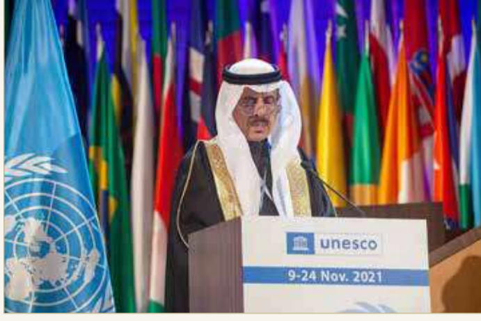
وزير التربية يلقي كلمة البحرين