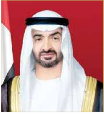
سمو الشيخ محمد بن زايد