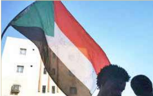
عذرات في طريق مفاوضات الحل بالسودان

وقال متحدث آخر باسم قوى الحرية والتغيير "لم نقض الشراكة. ويجب أن نعود إلى الوثيقة الدستورية"، مضيفا أن الانقلاب حدث بعد أن طرح المدنيون بعض القضايا الخلافية على الطاولة. ودعت لجان المقاومة إلى "مسيرات مليونية" يومي 13 و17 نوفمبر والتي