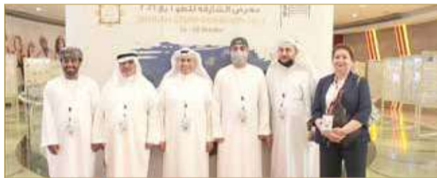
منسقة مملكة البحرين مع باقي المنسقين من دول الخليج المشاركة