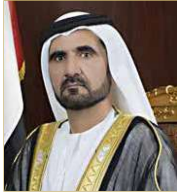
سمو الشيخ محمد بن راشد