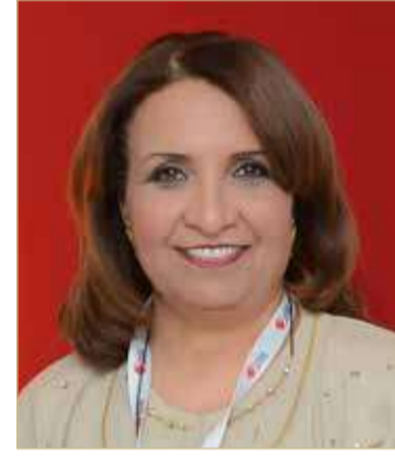
الشيخة حياة بنت عبدالعزيز

رفعت الشيخة حياة بنت عبدالعزيز آل خليفة رئيس مجلس إدارة الاتحاد البحريني لكرة الطاولة بالأصالة عن نفسها وبالنيابة عن أخوانها أعضاء مجلس الإدارة التهناني والتبريكات إلى حضرة صاحب الجلالة الملك حمد بن عيسى آل خليفة عاهل البلاد المقدي، وصاحب السمو الملكي الأمير سلمان بن حمد آل خليفة ولي العهد رئيس مجلس الوزراء، بمناسبة فوز مملكة البحرين ممثلة برئيس الاتحاد البحريني لكرة اليد علي إسحاق بمنصب نائب رئيس الاتحاد الآسيوي لكرة اليد للدورة الثانية على التوالي، وفوز الاتحاد البحريني لكرة اليد