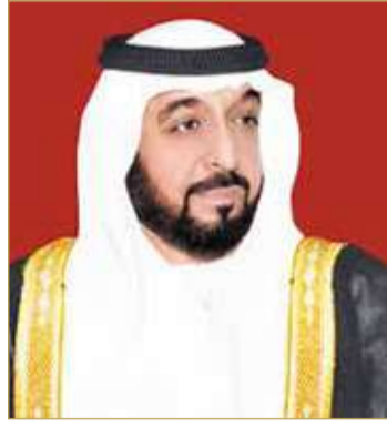
سمو الشيخ خليفة بن زايد