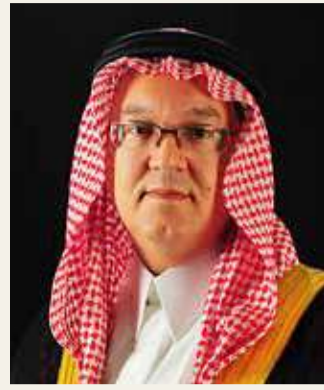
الأمير عمرو الفيصل

يذكر أنه في شهر أكتوبر افتتح بنك الإثمار فرعاً رئيسياً جديداً في مجمع السيف بضاحية السيف، والفرع الرئيس الجديد، الذي تم افتتاحه ليحل محل الفرع الرئيس في برج السيف، يتضمن تقنيات متطورة، بما في ذلك أجهزة صراف آلي من الجيل القادم وغيرها من الحلول الرقمية الجديدة والتميزة لتوفير فروع وخدمة عملاء تعتمد على التقنية. وتم تصميم الفرع بشكل جديد و متميز وتقنيات متطورة من أجل ضمان تعزيز التجربة المصرفية للعملاء.