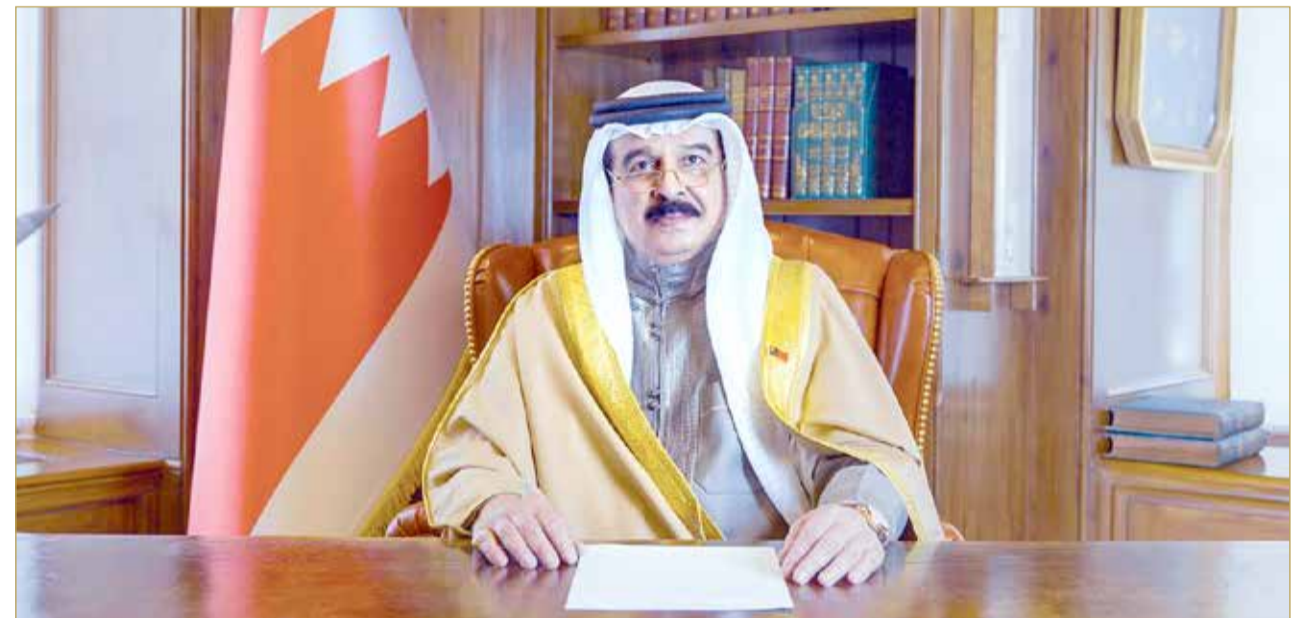
جلالة الملك يلقي كلمة أمام منتدى باريس للسلام

أكد عاهل البلاد صاحب الجلالة الملك حمد بن عيسى آل خليفة أن الأحداث والأزمات العالمية برهنت أن التعاون الدولي الوثيق، القائم على ركائز ثابتة من التواصل والتضامن والسلام، ومن خلال استجابة جماعية، وشراكة دولية فاعلة برؤى عصرية وأفكار متطورة تناسب الحاضر وتستشرف المستقبل، هو السبيل أمام دول العالم لتحقيق أهدافها المشتركة في توفير حياة آمنة مزدهرة ومستدامة للبشرية جمعاء. جاء ذلك خلال مشاركة جلالة الملك بكلمة مسجلة في الجلسة الافتتاحية لمنتدى باريس للسلام الذي بدأت أعماله أمس بحضور رئيس الجمهورية الفرنسية إيمانول ماكرون، وعدد من رؤساء الدول والحكومات.