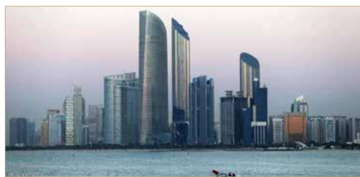
ولي عهد أبوظبي نائب القائد الأعلى للقوات المسلحة على "تويتر": "يسعدنا استضافة دولة الإمارات مؤتمر المناخ COP28 العام 2023".

وقال الشيخ محمد بن راشد على "تويتر": "نبارك لدولة الإمارات فوزها باستضافة أهم مؤتمر عالمي للمناخ COP28 في العام 2023، اختيار مستحق لدولتنا". وأضاف: "سنضع كل إمكانياتنا لإنجاح المؤتمر وستبقى دولة الإمارات ملتزمة تجاه العمل المناخي العالمي لحماية كوكب الأرض". كما قال الشيخ محمد بن زايد آل نهيان