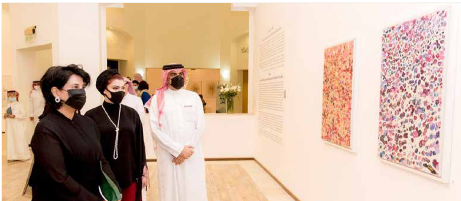
الشيخة هلا بنت محمد خلال افتتاح المعرض