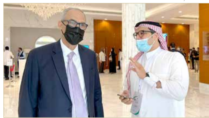
المعراج مصرا لـ "البلاد"

شيء جديد، ولكن ما زالت هذه الأفكار موجودة، والمجلس النقدي موجود، ونحن نعمل على مسألة بناء مزيد من التكامل، ولكن الموضوع ليس سهلاً، ولكن كل الأبواب ستفتح من أجل تحقيق هذا الهدف؛ من أجل مزيد من التكامل وفتح الأسواق، وتدقيق السلع، وارتباط الأسواق المالية، مشيراً إلى أن كل هذه الأمور يجب أن تكتمل وتسير ضمن نهج معين بحيث تؤدي إلى الهدف الرئيس في الأخير.