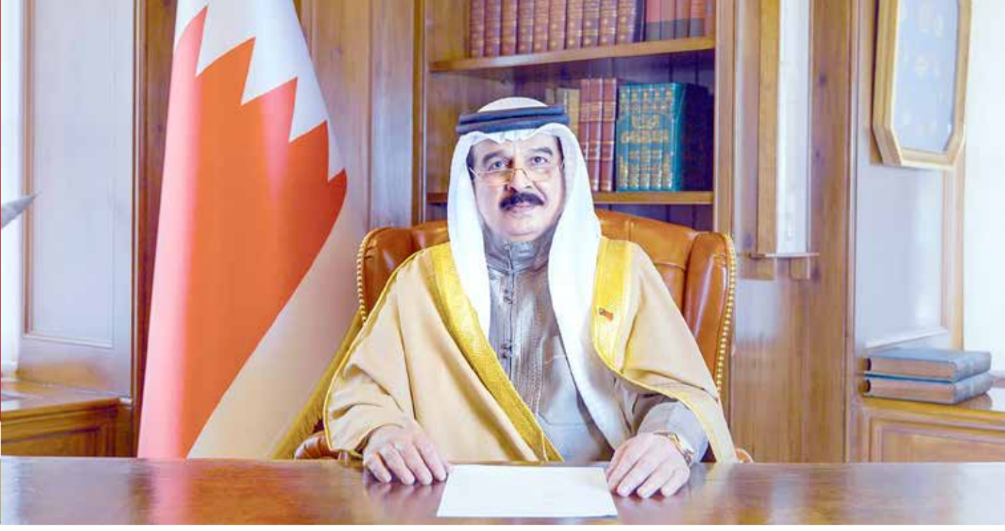
جلالة الملك يلقي كلمة أمام منتدى باريس للسلام

◆ بناء عالم أكثر أمنا واستقرارا وعدالة ومساواة... جلالة الملك في كلمة أمام منتدى باريس للسلام: