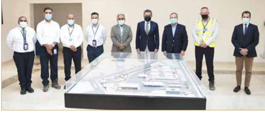
أثناء الزيارة لمجموع مستودعات وقود الطائرات

الطيران. يذكر أن شركة مطار البحرين شركة مطار البحرين والنفط والغاز. لوقود الطائرات هي مشروع مشترك بين