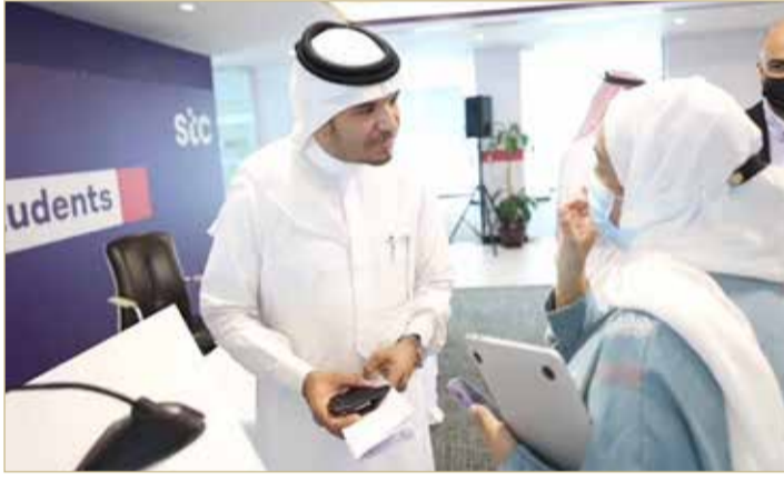
بانبيله مصراً لـ “البلاد”

وأضاف “ما تزال الشركة تعمل على تقديم الدعم المجتمعي للجميع وتشارك بمساهمات كبيرة وفعالة