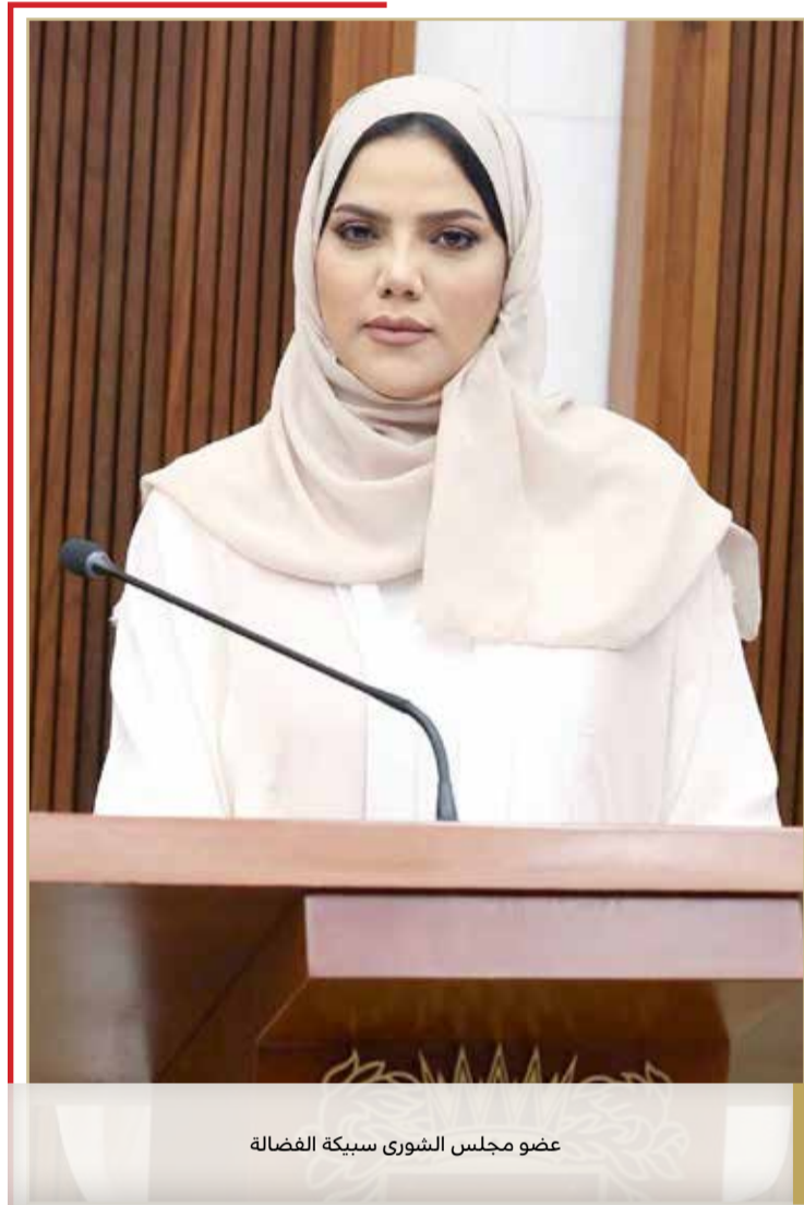
عضو مجلس الشوري سبيكة الفضالة

والحوار والتعايش. واعتبر أن مواصلة إقامة المؤتمر في المملكة رغم الظروف الطارئة بسبب جائحة "كورونا"، لهو دليل على تمكّن المملكة من تجاوز أصعب مراحل الجائحة، بفضل العمل المخلص والدؤوب من الفريق الوطني الطبي للتصدي للجائحة، بقيادة ولي العهد رئيس مجلس الوزراء صاحب السمو الملكي الأمير سلمان بن