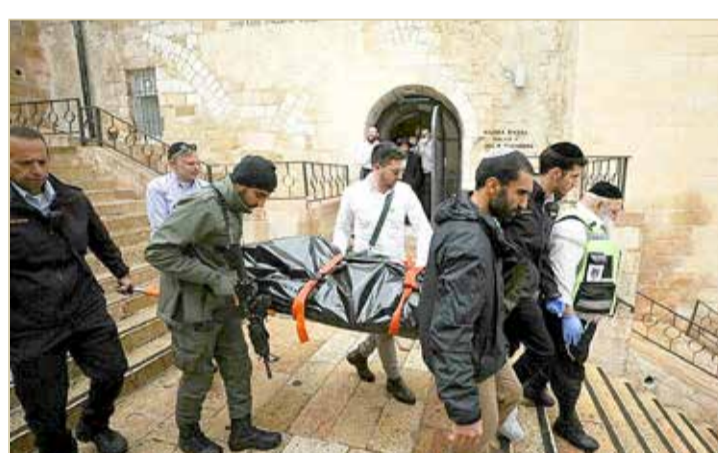
ثاني هجوم في القدس خلال أربعة أيام

بجروح طفيفة. وأمر رئيس الوزراء الإسرائيلي نفتالي بينيت بتشديد الإجراءات الأمنية في القدس بعد هجوم الأحد. واحتلت إسرائيل البلدة القديمة وأجزاء أخرى من القدس الشرقية في حرب عام 1967 وضمتهما إليها في خطوة لا تحظى باعتراف دولي.