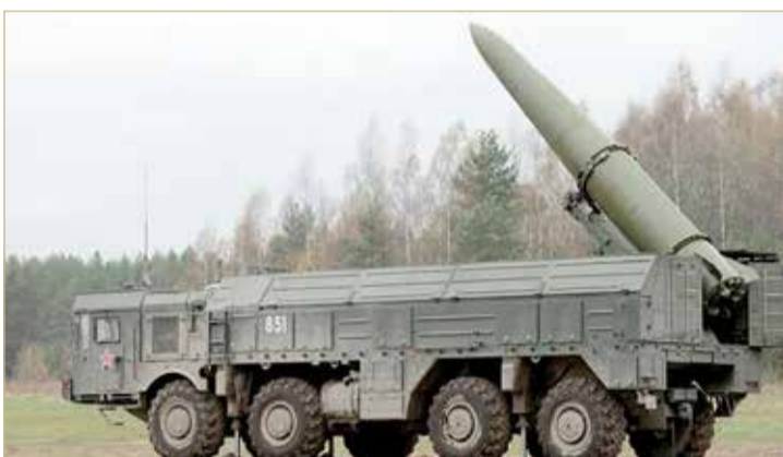
إسرائيل تعزز التسليح بصواريخ متقدمة استعدادًا للمواجهة

بصحة زوجته ميخال، أمس الأحد، قال هرتسوغ إن "إسرائيل لا تستطيع أن تسمح لإيران بتملك الأسلحة النووية، وإنها تتوقع من حلفائها أن يكونوا صارمين وحازمين مع الإيرانيين". وأضاف: "إسرائيل تجعل هذا الموقف واضحًا لكل أصدقائها وبالطبع توضح أنها تحتفظ بجميع خيارات الدفاع عن نفسها".