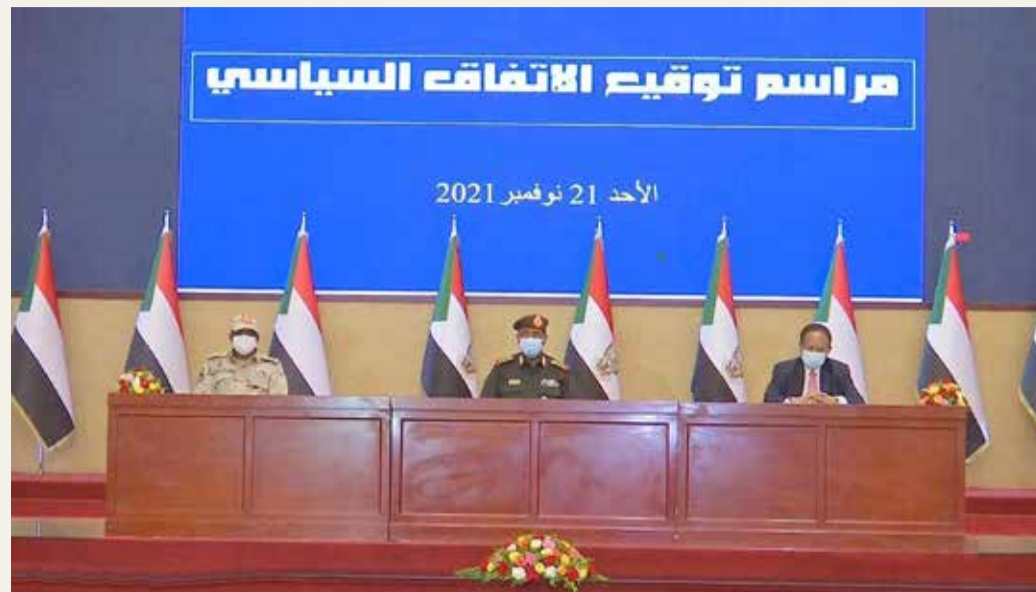
مراسم توقيع الاتفاق بين رئيس الحكومة والمجلس السبدي

العملية الانتقالية بقمع المظاهرات وقتلهم. كما أضاف في بيان على صفحته على فيسبوك "ملتزمون بالسلامة المعهودة وبالمسارات الميدانية المحددة من لجان المقاومة، وبالوحدة خلف الأهداف الوطنية". واعتبر ألا تفاوض أو شراكة مع قادة الجيش. وشن تجمع المهنيين السودانيين، هجومًا لانعًا على الاتفاق السياسي، واصفا ما جرى بـ"الخيانة".