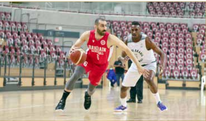
جانب معسكر منتخبنا بالسعودية