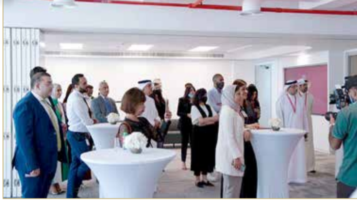
جانب من حفل تدشين الهوية الجديدة

يشار إلى أن شركة بنفت قد حققت مجلّة من النجاحات المتواترة مؤخرًا ومنها الإطلاق الناجح لخدمة التحويلات عبر تطبيق بنفت بي، والتي ستمكن جميع مستخدمي التطبيق من إجراء تحويلات مالية دولية. وفي وقت سابق، أعلنت الشركة عن تدشين خدمة الشيك الإلكتروني، والتي هي بمثابة أول نظام خاص للشيكات الإلكترونية في العالم. علاوة على ذلك، تمتلك شركة بنفت مجموعة متنوعة من المنتجات الأخرى ومنها شبكة الربط المالية وشبكة ربط أجهزة الصراف الآلي وأجهزة نقاط البيع وتطبيق بنفت بي، وهو المحفظة الإلكترونية الوطنية، وتشغيل مركز البحرين للمعلومات الائتمانية ومنصة اعرف عميلك إلكترونيًا (eKYC) الأولى من نوعها في المنطقة والتي تغطي القطاع المالي بأكمله. وقد حازت شركة بنفت على العديد من الجوائز المحلية والدولية الهامة مثل جائزة التميز للحكومة الإلكترونية لعام 2021 وجائزة أفضل تطبيق ذكي لعام 2021 وغيرها من الجوائز العديدة.