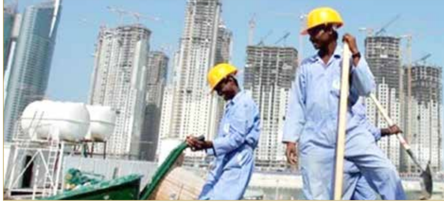
الاتحاد البحريني لكرة القدم يستنكر الأوضاع المأساوية للعمال العاملين في قطر

يستنكر الاتحاد البحريني لكرة القدم الواقع المرير الذي يعيشه العمال العاملين في دولة قطر من استغلال وسوء معاملة في الكثير من القطاعات خصوصاً في البنية التحتية والملاعب الخاصة بكأس العالم 2022. وكانت تقارير دولية وعالمية وبيانات صادرة من الاتحادات الأوروبية أكدت أن الأوضاع الخاصة بالعمال تزيد سوءاً وأدانت جميعها دولة قطر نتيجة الاستخفاف بحقوق العمال والانتقاص منها كما قالت منظمة العفو الدولية في تقرير جديد صدر عنها قبل نحو 5 أيام أن الواقع اليومي للعديد من العمال الأجانب لا يزال قاسياً. (08)