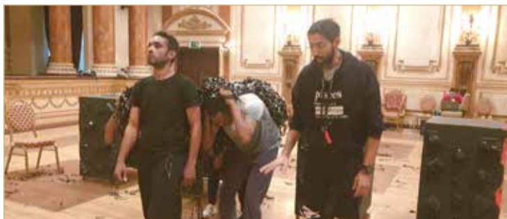
المخرج البكري يوجه فريق العمل