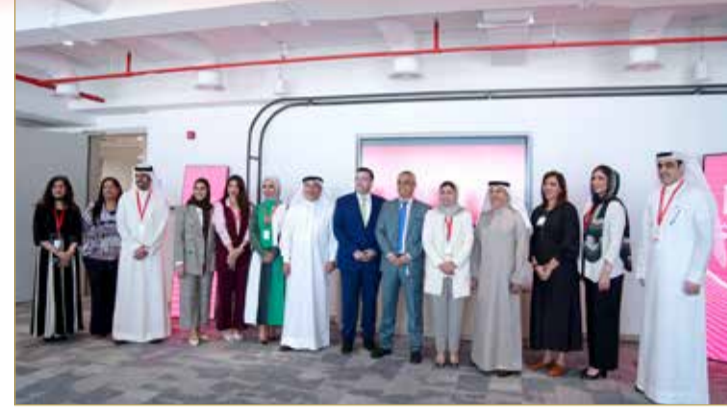
جانب من حفل تدشين الهوية الجديدة

15% النمو المتوقع للتحويلات في العام القادم