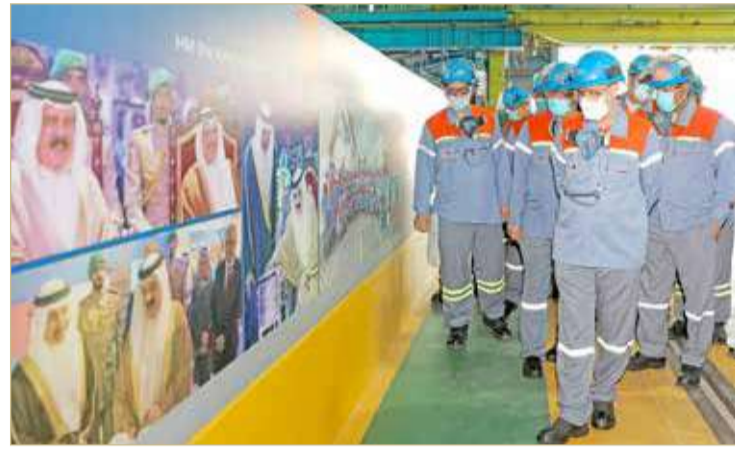
رئيس مجلس إدارة "ألبا" يزور الخط السادس

أجرى رئيس مجلس إدارة شركة أمنيوم البحرين ش.م.ب. (ألبا)، الشيخ دعيح بن سلمان بن دعيح آل خليفة، يوم الخميس الموافق 18 نوفمبر 2021 زيارة تفقدية لخط الصهر السادس، وذلك تزامناً مع قرب مرور عامين على تدشين عملياته. وتأتي هذه الزيارة ضمن سلسلة من الزيارات الميدانية التي يجريها رئيس مجلس الإدارة لمختلف مرافق الشركة في أعقاب تخفيف القيود التي فرضتها جائحة كوفيد-19. خلال الفترة الماضية.