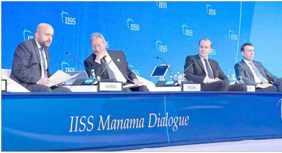
المتحدثون في منتدى حوار المنامة

في التعامل، لكننا جاهزون لاتخاذ أية خيارات أخرى". وقال مستشار الأمن القومي الإسرائيلي أيلال هولوتا: "ننا نشهد مرحلة زمنية حرجة ونطمح للخروج منها أقوى، ولن نسمح لإيران بأن تصبح دولة نووية وسنقوم بذلك من خلال العمل والتنسيق المشترك". (04 - 05)