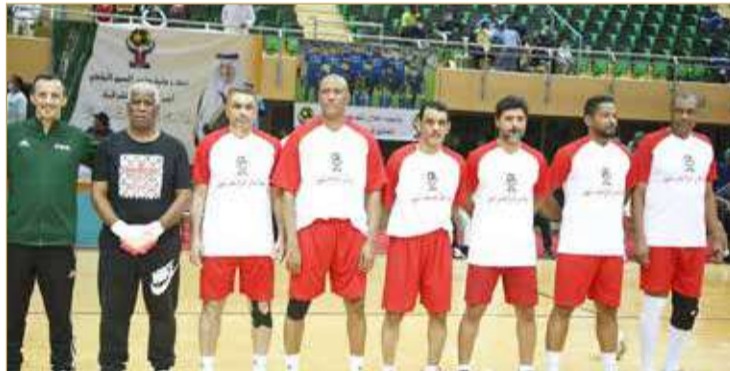
فريق نجوم البحرين

في المباراة النهائية خسرت نجوم البحرين المباراة من نجوم الشرقية المطعم بنجوم فرق الأندية السعودية الشابة بنتيجة ثلاث أهداف مقابل لاشي بعدنا انتهى الشوط الاول بالتعادل السليبي.