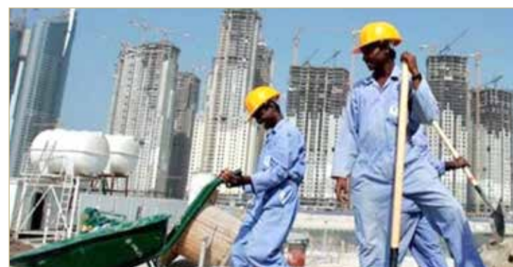
الاتحاد البحريني لكرة القدم يستنكر الأوضاع المأساوية للعمال العاملين في قطر

بخاصة؛ بيدي الاتحاد البحريني لكرة القدم قلقه لما أكدته من تزايد حالات الوفاة للعاملين في المنشآت والبنية التحتية والملاعب في دولة قطر والتي وصلت بالآلاف مما يؤكد بأن العمال يعيشون تحت وطأة الحرمان لأبسط حقوقهم الإنسانية ويدفعون الثمن باهظاً، بالإضافة إلى أن تلك التقارير والأرقام تؤكد أن التدابير الإصلاحية والخطوات التي اتخذتها دولة قطر غير كافية لحماية حقوق العمال وحمايتهم من ظروف عمل حرجية، ويطلب الاتحاد البحريني لكرة القدم بضرورة توفير الحقوق الإنسانية بهدف حماية العمال من الاستغلال غير الحضاري للشركات والقطاعات القطرية.