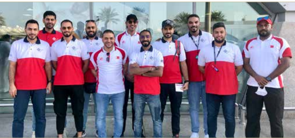
فريق الاتحاد البحريني للسيارات (اللوجيستك)

أعربوا عن فخرهم واعتزازهم بثقة الاتحاد البحريني للسيارات بهم من أجل تمثيل الوطن في هذا المحفل الرياضي الخارجي على المستوى التنظيمي، مؤكداً أنهم سيبدلون قصارى جهدهم من أجل الوصول لأعلى مستويات النجاح وجعله سباقاً من أميز سباقات الموسم الحالي.