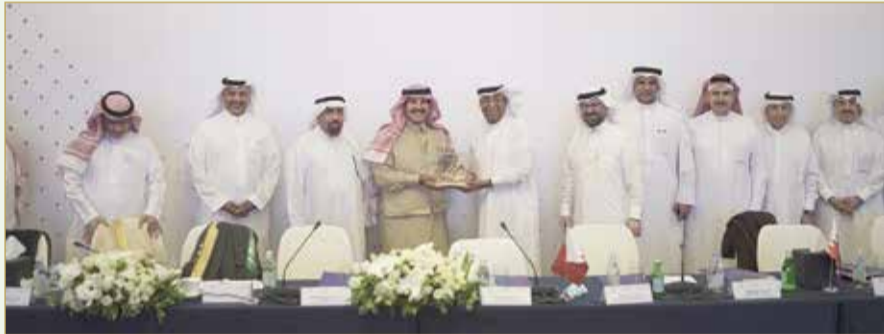
جانب من اجتماع مجلس الأعمال البحريني السعودي المشترك

وشمل جدول أعمال اجتماع مجلس الأعمال البحريني السعودي المشترك عرضاً عن الفرص الاستثمارية في البحرين من قبل مجلس التنمية الاقتصادية، والتوجهات الاستراتيجية في ضوء قراءات المتغيرات في المشهد الاقتصادي. وتلى ذلك، مناقشة آليات ومتطلبات تعزيز التجارة البينية بين السعودية والبحرين، وتشكيل لجان مشتركة في القطاعات المستهدفة، كما قدم الجانب السعودي عرضاً مرئياً عن الطاقة المتجددة للبيئة والقرى النائية ضمن خطة استراتيجية شاملة للطاقة المتجددة والهيدروجين الأخضر في الوطن العربي، وفرص تعزيز العلاقات المشتركة بين البلدين الشقيقين وتطورات الجسر الموازي، وعددًا من الفرص الاستثمارية في قطاع النقل والخدمات اللوجستية.