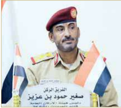
رئيس الأركان اليمني

حول كم نسبة المناطق والمحافظات المسيطرة والبعيدة عن مجالات الاختراق الحوثي في ظل المشروع الإيراني للتدخل في اليمن، قال، إن كثيراً من المناطق لاتزال هناك وهي بعيدة عن اختراق من محافظات مثل مأرب وجزء كبير من محافظة الجوف وجزء من البيضاء وشبوي أيضاً والتي لازالت تحت السيطرة، ماعدا مديريتين، ولدينا حضر موت وعدن وجزء كبير من حجا، هذه المناطق كلها لاتزال تحت السيطرة. وأكد ومن هذه المناطق سيتم تحرير كل المناطق من قبل أبناء اليمن المخلصين ودحرمهم في كل ما تبقى من مناطق اليمن، مؤكداً، أن النصر سيتم النصر باذن الله على ميليشيات إيران وحلفائها في