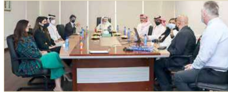
رئيس المجلس الأعلى للصحة يقوم بزيارة ميدانية لمجمع السلامة الطبي

الوحدة، كما تفقد ما وصل إليه مشروع توسعة قسم الحوادث والطوارئ، بالإضافة إلى عدد من المشاريع الأخرى الجاري تنفيذها حالياً. من جانبه، ثمن الشيخ هشام بن عبدالعزيز آل خليفة، زيارة رئيس المجلس الأعلى للصحة، والتي تأتي انعكاساً لاهتمامه البالغ بمساعي الارتقاء بالمنظومة الصحية في مملكة البحرين، ومتابعته المباشرة لآليات تنفيذ الاستراتيجيات الصحية بما يحقق ما تم إقراره في الخطة الوطنية للصحة 2016-2025، ويؤكد جميع المواطنين والمقيمين من الحصول على رعاية صحية ذات نوعية عالية.