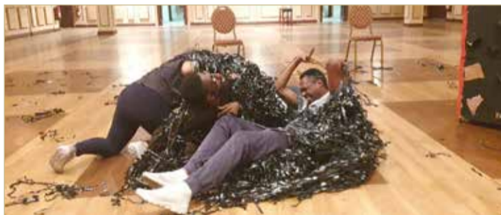
جانب من البروفات

العمل بكامله يعتمد على لغة الجسد وليس الحوار كما هو متعارف عليه في المسرح، وثيمته تختلف عن تسميته "هدوء تام"، فهو يناقش الفوضى التي غرقت فيها الإنسانية من كل الجوانب،