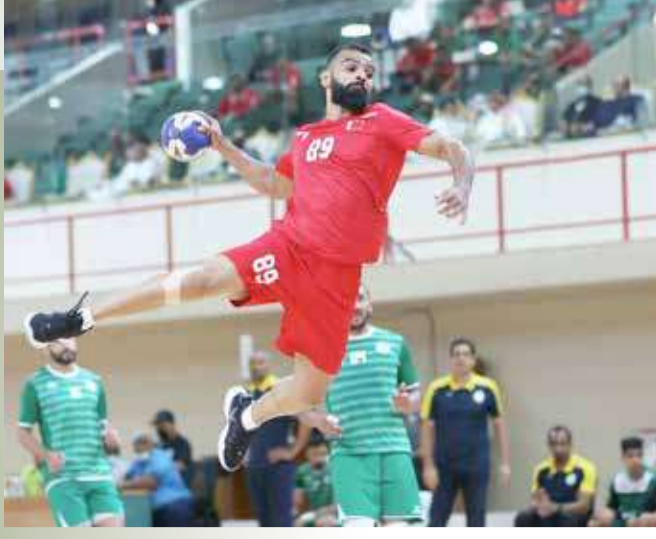
من لقاء منتخبنا والسعودية لكرة اليد