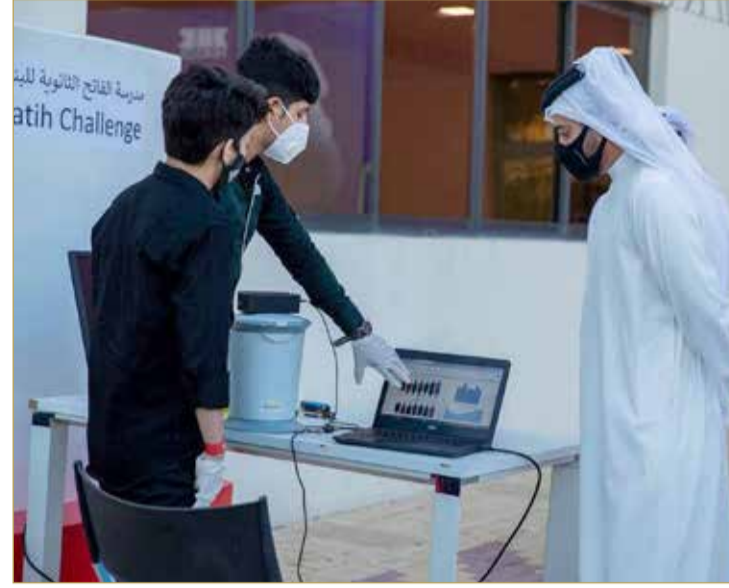
المشاركة في المحافل الوطنية

نجاحاً كبيراً في دوراتها المختلفة، وتم الإعلان عن دورتها الجديدة مؤخراً. ويضاف إلى ذلك احتضان مملكة البحرين المركز الإقليمي لتكنولوجيا المعلومات والاتصال، الذي يعمل تحت إشراف المنظمة، ومركز التميز للتعليم الفني والمهني، فضلاً عن مشاركة البحرين في شبكة المدارس المنتسبة لليونسكو، والتي حظيت بإشادة المسؤولين في المنظمة.