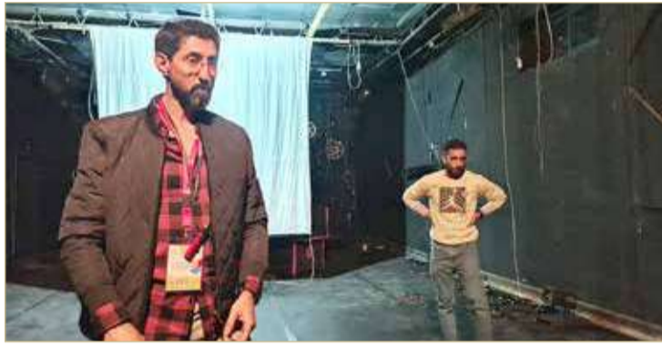
أفضل العمل بنظام الورش