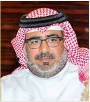
عبدالله بن عيسى

على خارطة الرياضة العالمية، مشيراً أن ما يقوم به سمو الشيخ خالد بن حمد من جهود كبيرة هو مواصلة ما أسس له ممثل جلالة الملك للأعمال الإنسانية وشؤون الشباب، رئيس المجلس الأعلى للشباب والرياضة سمو الشيخ ناصر بن حمد آل خليفة أثناء فترة رئاسته سموه اللجنة الأولمبية البحرينية.