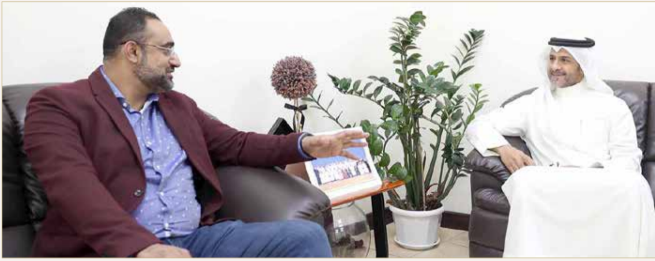
المحامي العام الأول المستشار نايف يوسف محمود والرئيس علوي الموسوي

يذكر أن مملكة البحرين حققت إنجازات دولية عديدة ونوعية في مجال مكافحة غسل الأموال وتمويل الإرهاب، حيث تبوّأت المرتبة الأولى عربياً والثانية على مستوى دول الشرق الأوسط من حيث الدول الأقل خطورة في جريمة غسل الأموال وتمويل الإرهاب وذلك لعامين على التوالي، وذلك وفق مؤشر بازل لمكافحة غسل الأموال والذي تستند نتائجه إلى 14 مؤشراً من مصادر متاحة للجمهور، تدرج في الفئات التالية، ويتم وزنها في الفهرس المركب، وهي جودة إطار مكافحة غسل الأموال وتمويل الإرهاب، وخطر الفساد، والشفافية والمعايير المالية، والشفافية العامة والمسألة، والمخاطر السياسية والقانونية، وفي إطار متسق أود أن أشير إلى أن مملكة البحرين تشارك بصفقتها عضواً في منظومة دول مجلس التعاون الخليجي في مجموعة العمل المالي (FATF) كما تلتزم بتطبيق كافة المعايير الدولية في هذا المجال، ولا يفوتنا بيان إلى أن مملكة البحرين عضواً مؤسساً لمجموعة العمل المالي لمنطقة الشرق الأوسط وشمال إفريقيا (MENAFATF) وتستضيف المملكة مقر الأمانة العامة للمجموعة. ومن جانب آخر، فقد أجرت نيابة الجرائم المالية وغسل الأموال تحقيقات تنفيذاً لطلبات مساعدة قضائية وردت من دول أجنبية تتعلق بملاحقة الجناة واسترداد الأموال.