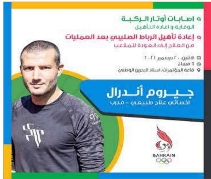
إعلان ندوة اختصاصي العلاج الطبيعي الفرنسي

تنظم اللجنة الأولمبية البحرينية ندوة عن إصابات أوتار الركبة "الوقاية والتأهيل" وإعادة تأهيل الرباط الصليبي بعد العمليات "من العلاج إلى العودة للملاعب" والتي تستضيف خلالها اختصاصي العلاج الطبيعي الفرنسي المعروف والمدرّب الرياضي "جيروم أندرال" يوم الإثنين 20 ديسمبر 2021 الساعة 6 مساءً بقاعة المحاضرات باستاد البحرين الوطني بمنطقة الرفاع.