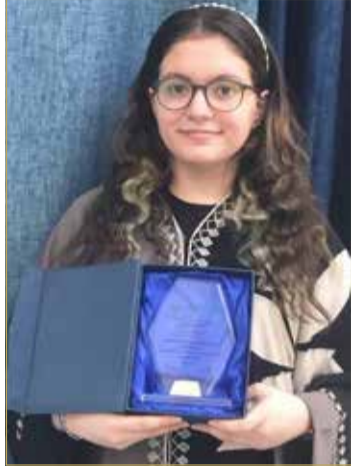
من الإنجازات الطلابية