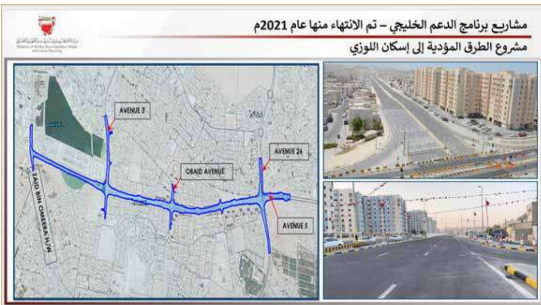
مشاريع برنامج الدعم الخليجي - تم الانتهاء منها عام 2021

أما قطاع مشاريع البناء والصيانة فقد شهد إنجاز 11 مشروعاً بلغت قيمتها الإجمالية 57 مليون دينار وكان من ضمن هذه المشاريع ما يلي: - مجمع الإعاقة الشامل بعالي لصالح وزارة التنمية الاجتماعية بقيمة 8.5 مليون دينار ممول من الدعم الخليجي والذي يشتمل على 9 مراكز/مبان بوظائف مختلفة مثل: التوحد والتلف الدماغي ومتلازمة داون والصرم والأمراض العقلية ومركز التعليم والموارد مركز صحي مبنى إداري صالة للعرض مع الأعمال الخارجية. - مبنى شؤون الزراعة بهورة عالي لصالح شؤون الزراعة بقيمة 2 مليون دينار ممول من الدعم الخليجي والذي يشتمل على مبنى جديد لشؤون الزراعة مع