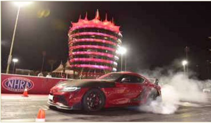
جانب من الفعاليات

قبل منتصف الليل. كما يتعين على المشتركين الخضوع لفحص سلامة إلزامي لسياراتهم قبل دخول المضمار. للمرافقين أيضاً نصيب من المتعة، إذ يمكنهم الركوب مع السائقين في سياراتهم أيضاً لعيش اللحظة وذلك بمبلغ 4 دنانير، بينما يمكن للجمهور متابعة إثارة الفعالية بمبلغ وقدره ديناران فقط.