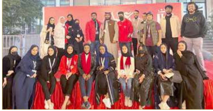
فريق المجلس الطلابي

منتسبي المملكة من عمداء الكليات وأساتذة وطلبة بهذا الاحتفال الكبير الذي يليق بجامعة المملكة الرائدة. وحرص أعضاء مجلس الطلبة على أن تصل الفرحة الوطنية للجميع من خلال برامج الحفل المتنوعة بداية من عروض "الليوة" التراثية وبين ظل القوافي وأمسية شعرية يحيها الشعراء المبدعين الشاعر محمد المضحى والشاعر عبدالله المري والشاعرة سبيكة الشحي منتقلين إلى أجمل الأنغام والأغنيات بصوت الفنان علي العوضي، وختاماً بالمسابقات والسحوبات على الجوائز القيمة، كما أتاح مجلس الطلبة لعربات الطعام والأسر المنتجة فرصة المشاركة بالفعالية المميزة، وحرصاً على إسعاد الجميع كان هناك كرنفال ألعاب للأطفال والشباب.