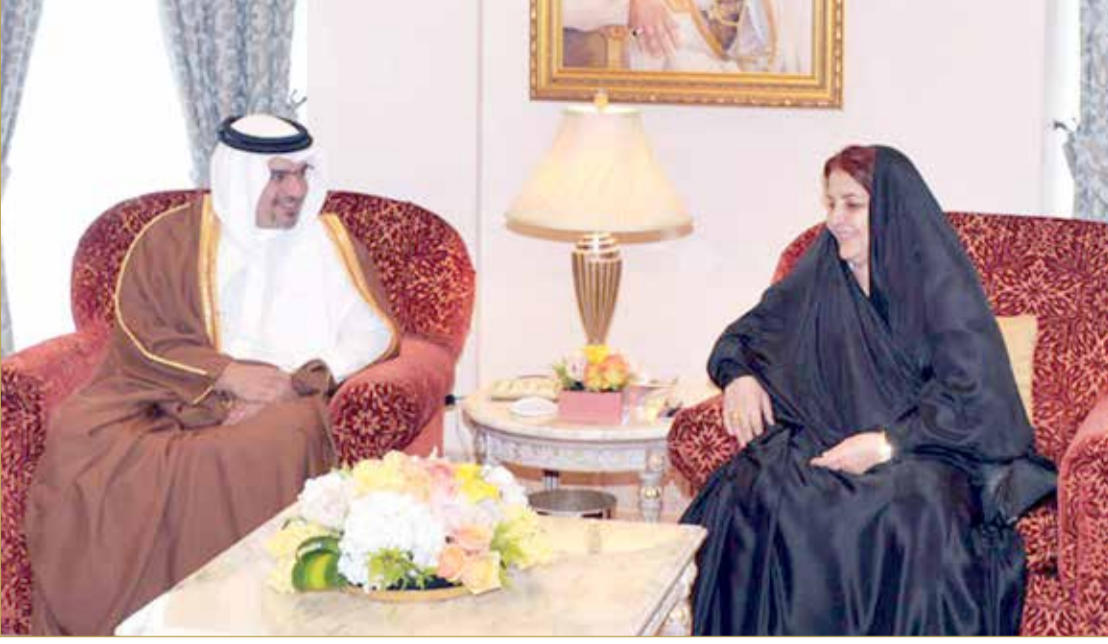
زيارة سمو ولي العهد للمجلس الأعلى للمرأة العام 2014