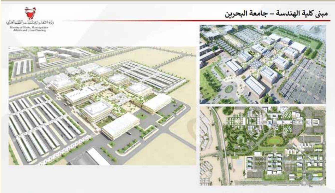
مبنى كلية الهندسة - جامعة البحرين

دينار، 5 منها في محافظة الجنوبية و1 في كل من محافظة العاصمة والمحرق.