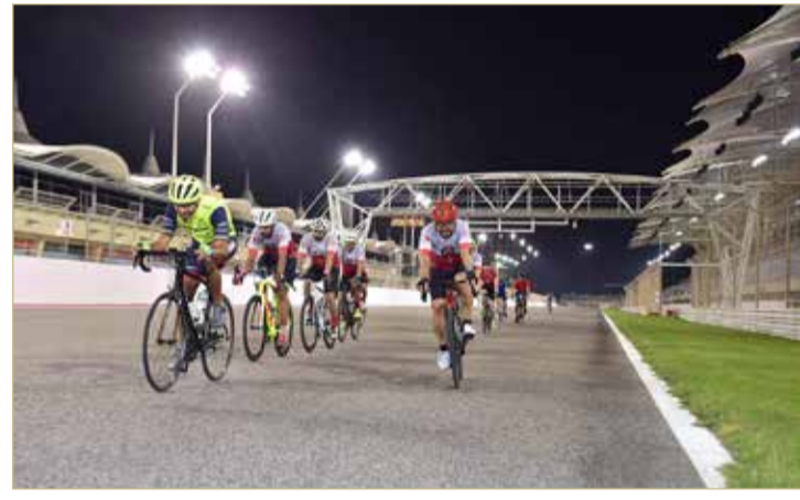
جانب من الفعالية

أو ببساطة ممارسة الرياضة بشكل عرضي في بيئة آمنة وخاضعة للرقابة في الحلبة. على أن تقام فعالية الثلاثاء من الساعة 6 مساءً وحتى 10 مساءً. وتم تخصيص مسارات منفصلة للدائنين والمشاة وآخر لراكبي الدراجات. سيستخدم العدادون والمشاة المسار الداخلي الذي يبلغ طوله 2.550 كيلومتراً، بينما سيتمكن راكبو الدراجات من ممارسة نشاطهم على الحلبة الخارجية البالغ طولها 3.543 كيلومتراً، مع وجود منطقة مخصصة لركوب الدراجات للأطفال.