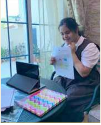
التعلم عن بعد لذوي العزيمة

والتقانة للصفين الثاني والثالث الابتدائي، وإضافة موضوعات عن الاقتصاد الرقمي في مناهج العلوم التجارية بالمرحلة الثانوية، والعمل على تحويل كتب التصميم والتقانة إلى كتب إلكترونية، والتدريب التدريجي لطلاب المرحلة الأساسية على مهارات التصميم والإنتاج باستعمال البرامج التقنية؛ لتهيئته لمناهج أكثر تطوراً في الحلقة الثالثة (تصميم الروبوتات).