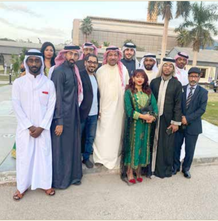
مع فريق مسرحية "هدوء تام" بالفاخرة

من شروط الإبداع أن تكون دارسا بشكل أكاديمي، ولكن يجب أن تكون مثقفا مسرحيا من خلال الاطلاع والممارسة، وقبل كل هذا يجب أن تمتلك الخيال، ودائما ما يقول إن المسرح خيال، ودون هذا الخيال لا يوجد إبداع، وبعد الاطلاع والثقافة تأتي الممارسة، والتدريب العملي والخبرة، ويعتبر البكري نفسه محظوظا بكم العروض التي قدمها مع كبار المخرجين في الوطن العربي، حيث تعامل وتدرّب على يد أسماء كبيرة مثل يوسف الحمدان، وعلي مهدي، وغنام غنام، وجمال ياقوت، وأكرم اليوسف، وجواد شكرجي، ويوسف العرقوب، وعبدالرحمن المناعي، وناصر عبدالرضا، وفهد الباك، وخالد الرويعي، وحمد الريمحي، وسالم المنصوري، ومحمد الحملي، وابتسام الحمادي، ومرعي الحليان. كما شارك مع عدد كبير من الفرق