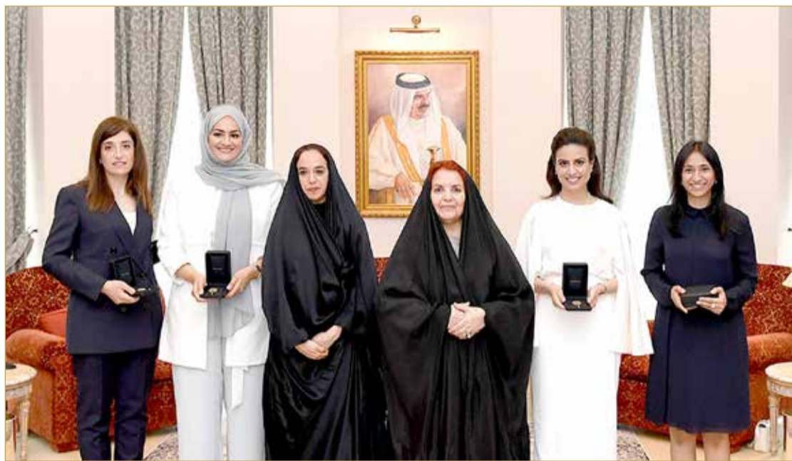
صورة جماعية مع الحائزات على امتياز الشرف لرائدة العمل البحرينية الشابة

وتتفهداً لاختصاصات المجلس الأعلى للمرأة بتعزيزها وإدماج جهودها في برامج التنمية الشاملة، أخذ المجلس على عاتقه ترجمة النصوص الدستورية إلى واقع، لاسيما وأن المادة الخامسة الفقرة (ن) تنص على "تكفل الدولة التوفيق بين واجبات المرأة نحو الأسرة وعملها في المجتمع، ومسؤولياتها بالرجال في ميادين