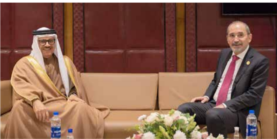
المنامة - وزارة الخارجية

اجتمع وزير الخارجية عبداللطيف الزباني، أمس، مع وزير الخارجية وشؤون المغتربين بالمملكة الأردنية الهاشمية الشقيقة أيمن الصفدي، وذلك على هامش الاجتماع الاستثنائي لمجلس وزراء خارجية الدول الأعضاء في منظمة التعاون الإسلامي بشأن أفغانستان، المنعقد في مدينة إسلام آباد بجمهورية باكستان الإسلامية.