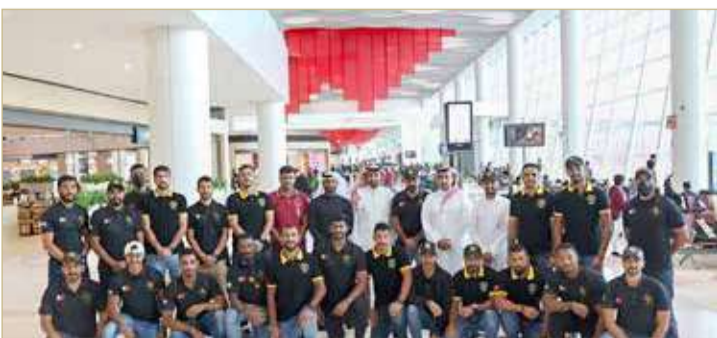
فريقا ”فيكتوربوس“ و”KHK“ أثناء مغادرتهم إلى دبي

الشعبي، بينما حقق فيكتوربوس المركز الثاني في الجولة الأولى والمركز الثالث في سباق الجولة الثانية. ويحمل الحدث المرتقب أهمية خاصة؛ كونه يمثل النسخة الخامسة والعشرين والتي تشكل سباق البيوبيل الفضي.