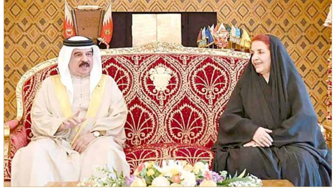
جلالة الملك وقرينته صاحبة السمو الملكي رئيسة المجلس الأعلى للمرأة