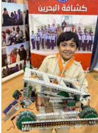
إبداع طلابي في الذكاء الاصطناعي

مؤخراً على تقييم (A) في مراجعات هيئة جودة التعليم والتدريب ارتفاعاً، وهو أعلى تقييم يتم منحه للمؤسسات التعليمية، وذلك تنويحاً للجهود استثنائية بذلت في سبيل تحسين الأداء في مختلف جوانب المنظومة المدرسية، خصوصاً خلال الجائحة، بما أسهم في ضمان استدامة الخدمات التعليمية. ويأتي ذلك في إطار الانعكاسات الإيجابية العديدة لبرنامج تحسين أداء المدارس الذي تطبقه الوزارة منذ العام 2008 بالتزامن مع تأسيس هيئة جودة التعليم والتدريب، إذ قامت الوزارة بالعديد من التغييرات في آلية متابعة أداء المدارس بما يضمن استمراريتها وشموليتها وتركيزها على محاور التقييم المعتمدة في الهيئة.