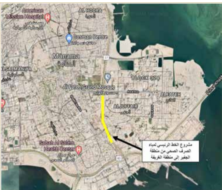
مشروع الخط الرئيسي لمبنى الصرف الصحي من منطقة البحر إلى منطقة الدانة

مختبرات زراعة النباتات والمياه والتربة والأنسجة مع المرافق الداعمة. البنية التحتية لمدينة الملك عبد الله الطبية لصالح وزارة التربية والتعليم بقيمة 19.5 مليون دينار ممول من الدعم الخليجي حيث يتضمن المشروع إنشاء شبكات المياه والصرف الصحي والكهرباء والطرق الداخلية والخارجية وتصريف مياه الأمطار وتنسيق الموقع بالإضافة إلى بناء محطة كهرباء بجهد 66 كيلو فولت - مبنى المراقبة الجوية بمطار البحرين الدولي لصالح شؤون الطيران المدني بقيمة 2.5 مليون دينار - مركز مدينة خليفة الصحي لصالح وزارة الصحة بقيمة 5.5 مليون دينار ممول من بنك البحرين الوطني. - المسرح المفتوح بحلبة البحرين الدولية (مسرح الدانة) بقيمة 15.5 مليون دينار.