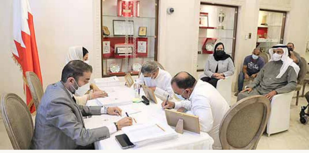
المنامة - وزارة الإسكان

في إطار التوجيهات الملكية السامية بتوفير 40 ألف وحدة سكنية، وتنفيذاً لأمر ولي العهد رئيس مجلس الوزراء صاحب السمو الملكي الأمير سلمان بن حمد آل خليفة، بتوزيع 2000 وحدة سكنية على المواطنين، تواصل وزارة الإسكان توزيع الوحدات الإسكانية على المنتفعين من مشاريع المدن الإسكانية الجديد في كل من (مدينة خليفة، ومدينة شرق الحد، ومدينة شرق سترة)، وذلك بمناسبة احتفالات مملكة البحرين بأعيادها الوطنية؛ إحياء لذكرى قيام الدولة البحرينية الحديثة في عهد المؤسس أحمد الفاتح كدولة عربية مسلمة العام 1783 ميلادية، وذكى تولى حضرة صاحب الجلالة الملك مقاليد الحكم.