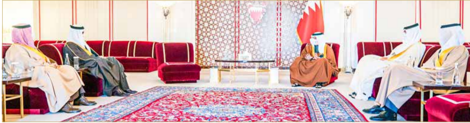
سمو ولي العهد رئيس مجلس الوزراء يستقبل سفير مملكة البحرين لدى المملكة العربية السعودية

من جانبه، أعرب السفير الشيخ علي بن عبدالرحمن بن علي آل خليفة عن اعتزازه بالثقة الملكية السامية، وتقديره وامتنانه لصاحب السمو الملكي ولي العهد رئيس مجلس الوزراء على ما يبديه من حرص واهتمام بدعم الكوادر الوطنية على كافة الأصعدة.