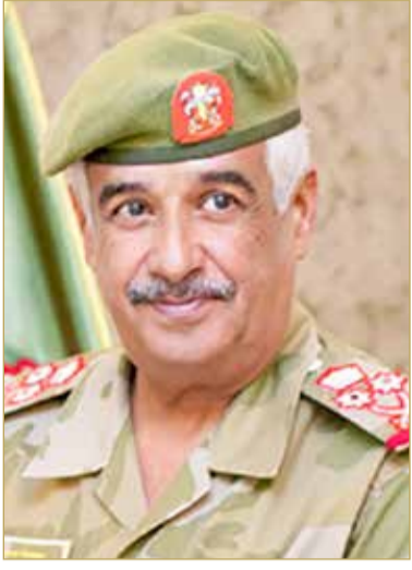
رئيس الحرس الوطني