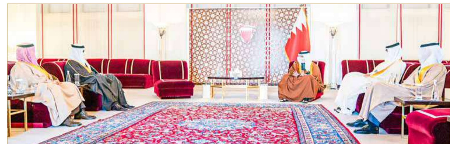
سمو ولي العهد رئيس مجلس الوزراء مستقبلاً سفير مملكة البحرين لدى المملكة العربية السعودية

وهنا سموه في لقاء بقصر الرفاع أمس السفير الشيخ علي بن عبدالرحمن بن علي آل خليفة بمناسبة صدور المرسوم الملكي بتعيينه رئيساً للبعثة الدبلوماسية لمملكة البحرين لدى المملكة العربية السعودية الشقيقة.