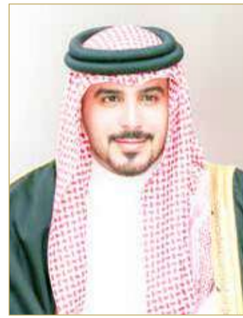
سمو الشيخ محمد بن سلمان بن حمد

ويقيم الشوط الثالث على كأس سمو الشيخ عبدالله بن عيسى بن سلمان آل خليفة لجياد جميع الدرجات والمبتدئات "نتاج محلي" مسافة 1600 متر والجائزة 2000 دينار، وبمشاركة 6 من الأفرس أبرزها "منامه غيرل" التي تعتبر الوحيدة التي حققت الفوز من جياد الشوط وذلك في مشاركتها الأخيرة، وسط