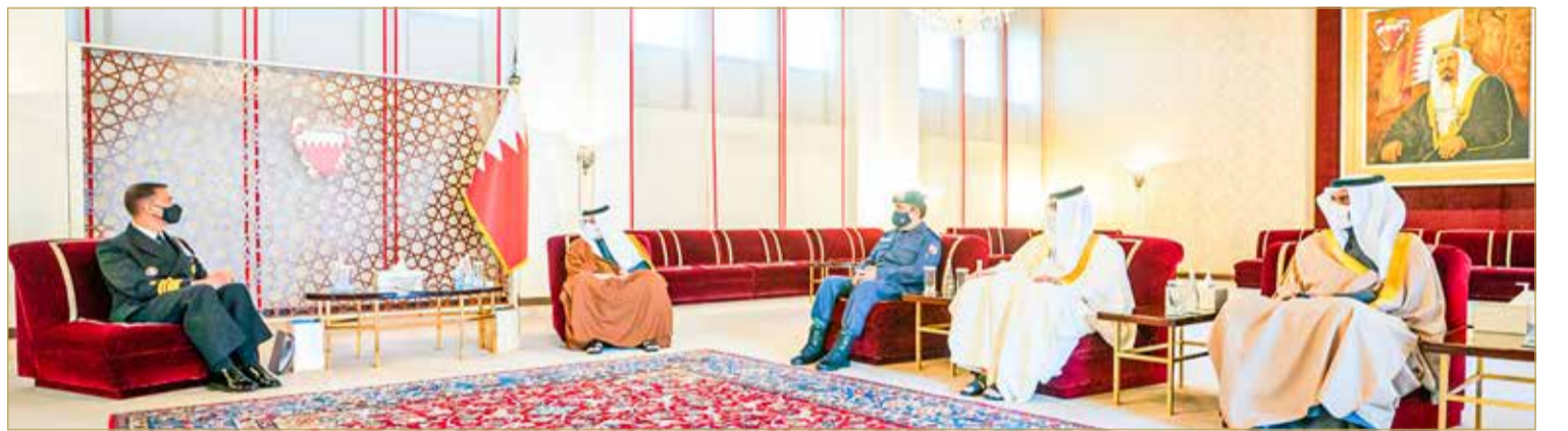
سمو ولي العهد نائب القائد الأعلى رئيس مجلس الوزراء يستقبل قائد القوات البحرية بالقيادة المركزية الأمريكية قائد الأسطول الخامس

الولايات المتحدة الأمريكية والدول الشقيقة والصديقة في مواجهة التحديات التي تواجهها المنطقة بما يعزز من أمنها واستقرارها. وخلال اللقاء، تم استعراض عدد من القضايا ذات الاهتمام المشترك وآخر المستجدات على الساحتين الإقليمية والدولية.