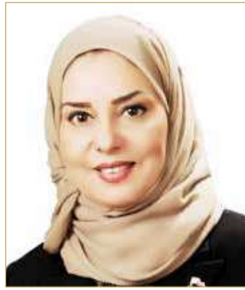
رئيسة مجلس النواب