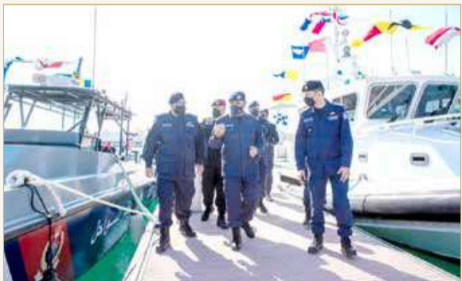
وزير الداخلية يشهد ختام فعاليات التمرين البحري المشترك لقيادة خفر السواحل (الحارس اليقظ 10)

أكد وزير الداخلية الفريق أول الشيخ راشد بن عبدالله آل خليفة، أهمية تأمين المياه الإقليمية والتصدي للتحديات المرتبطة بهذا الشأن، مما يتطلب رفع معدلات الاستعداد والجاهزية ومواصلة