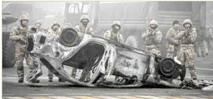
القوات الكازاخية تطلق الرصاص الحي على المتظاهرين