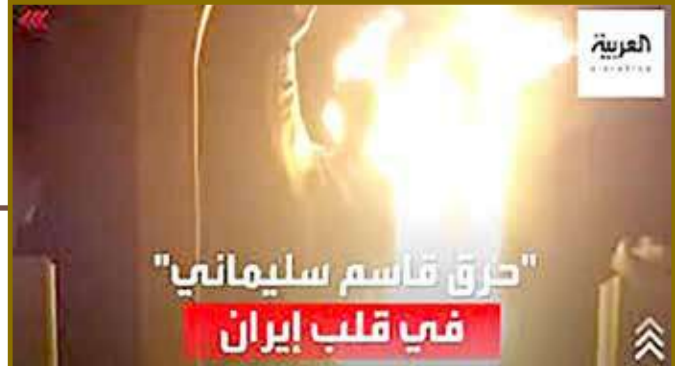
"حرق قاسم سليمان في قلب إيران"

بعد ساعات على تشييده، أضرم مجهولون النيران، مساء أمس الأربعاء في مجسم لقاسم سليمان الذي قتل في غارة أميركية في يناير 2020، في مدينة شهرکرد، مركز إقليم جارمخال وبختياري، وسط إيران. وتعليقا على الحادثة، وصف محمد علي نيكونام، ممثل المرشد علي خامنئي، أمس الخميس، ما حدث بأنه أشبه بـ "إحراق منزل الإمام علي"، واصفاً تلك الخطوة بـ "ذروة الغباء" بحسب ما أفادت شبكة "إيران نترناشيونال". وكان مسؤولون محليون أزالوا الستار عن تمثال قائد فيلق القدس في الحرس الثوري في شهرکرد، صباح الأربعاء، وقال رئيس بلدية المدينة محمد تقي جابلقى إن إقامة التمثال، الذي يبلغ ارتفاعه 6 أمتار، كلف 150 مليون تومان، فيما يعاني آلاف الإيرانيين أزمة معيشية، وتدهورا في أوضاعهم الاقتصادية. ويتهم قسم من الإيرانيين القيادي الذي اغتيل بضربة أميركية في محيط مطار بغداد، بالسيطرة على السياسة الخارجية للبلاد. كما يتهمونه والحرس الثوري بتبديد أموال الدولة على الميليشيات في الخارج، بدل إطعام الشعب، والنظر في أحواله، وقد رفعت مراراً شعارات في هذا السياق خلال تظاهرات متفرقة شهدتها بعض أنحاء البلاد سابقاً.