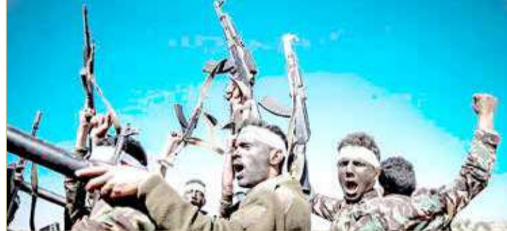
عناصر من ميليشيا الحوثي

كذلك أضاف أن عناصر الميليشيات قاموا بتخزين ونقل أسلحة من المعسكر المذكور. وكان التحالف استهدف الإثنين الماضي، بضربات جوية نفس المعسكر أيضاً، استجابة للتهديد ومبدأ الضرورة العسكرية. وأضاف حينها في بيان، أن الميليشيات الانقلابية تستخدم المعسكر المذكور للتخزين والإمداد، وأيضاً لإطلاق الأسلحة النوعية.