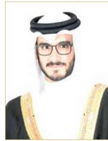
سمو الشيخ عيسى بن سلمان بن حمد

الجوادرين البحرينيين "وبت فور أفر" و بونديس بوي" في المركزين الثالث والرابع، فيما أقيم الشوط الدولي الثالث الأسبوع الماضي على "كأس الدانة"، وواصلت جياد البحرين السيطرة على المراكز الأربعة الأولى حيث تمكن الحصان "مارس لاندنغ" لإسطبل المحمدية تحقيق فوزه الثاني في البطولة تلتها الجياد "ماجيكل ويش" و"زاغاتو" و"بونديس بوي" في المراكز الثاني والثالث والرابع.