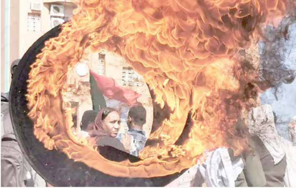
احتجاجات جديدة في السودان

خرج آلاف السودانيون في العاصمة الخرطوم وعدد من مدن البلاد الأخرى، أمس الخميس، في مسيرات احتجاجية جديدة طلبا للحكم المدني وسط إجراءات أمنية مشددة. وأفاد مراسلنا بأن الشرطة السودانية أطلقت قنابل الغاز والصوتية على محتجين جنوب شارع القصر في الخرطوم. ومنذ الساعات الأولى من صباح الخميس أغلقت معظم الجسور الرئيسية الرابطة بين مدن العاصمة الثلاثة، الخرطوم وأم درمان والخرطوم بحري، كما وضعت أسلاك شائكة وحواجز أسمنتية على الطرق الرئيسية المؤدية إلى القيادة العامة للجيش والقصر الرئاسي في وسط الخرطوم.