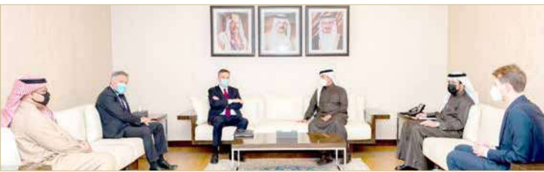
رئيس مجلس أمناء مركز دراسات مستقبل رئيس لجنة الشؤون الخارجية في البرلمان الأوروبي

الأوروبي، عن اعتزازه بالدور الحيوي والتميز الذي يضطلع به مركز "دراسات" كبيت خبرة دولي، لدعم التعاون المشترك بين مملكة البحرين والاتحاد الأوروبي، لاسيما في مجالات ترسيخ القيم الإنسانية، ودعم الرخاء العالمي.