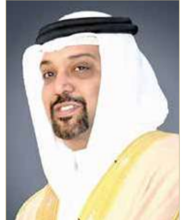
الشيخ سلمان بن خليفة

رفع وزير المالية والاقتصاد الوطني الشيخ سلمان بن خليفة آل خليفة أسمى آيات التهاني والتبريكات إلى ملك البلاد القائد الأعلى صاحب الجلالة الملك حمد بن عيسى آل خليفة، وإلى ولي العهد نائب القائد الأعلى رئيس مجلس الوزراء صاحب السمو الملكي الأمير سلمان بن حمد آل خليفة، وإلى رئيس الحرس الوطني الفريق أول ركن سمو الشيخ محمد بن عيسى آل خليفة بمناسبة الذكرى الخامسة والعشرين لتأسيس الحرس الوطني.