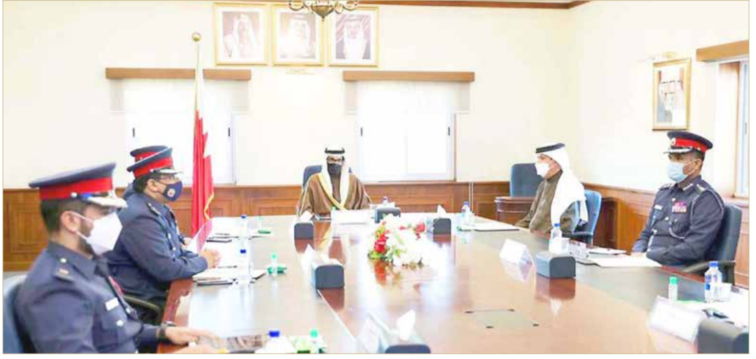
سمو محافظ الجنوبية يترأس اجتماع اللجنة الأمنية

استقبل رئيس جهاز المساحة والتسجيل العقاري رئيس مجلس إدارة مؤسسة التنظيم العقاري الشيخ سلمان بن عبدالله بن حمد آل خليفة، أمس بمكتبه، سفير مملكة البحرين المعين لدى المملكة العربية السعودية الشقيقة الشيخ علي بن عبدالرحمن آل خليفة. وأعرب الشيخ سلمان عن خالص تهنئته للشيخ علي بن عبدالرحمن آل خليفة،