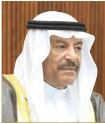
رئيس مجلس الشورى